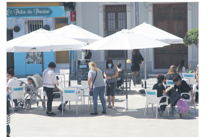
Las propuestas presentadas por Cs incluyen la ampliación de la superficie de las terrazas a los bares, restaurantes y demás negocios de hostelería