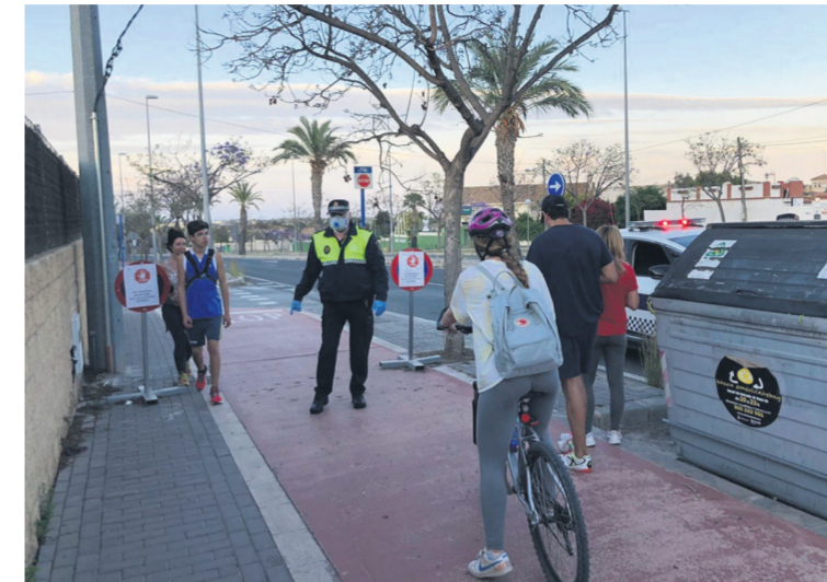
La Policía Local, un pilar fundamental en esta crisis