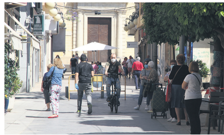
La calle Mayor de San Vicente del Raspeig