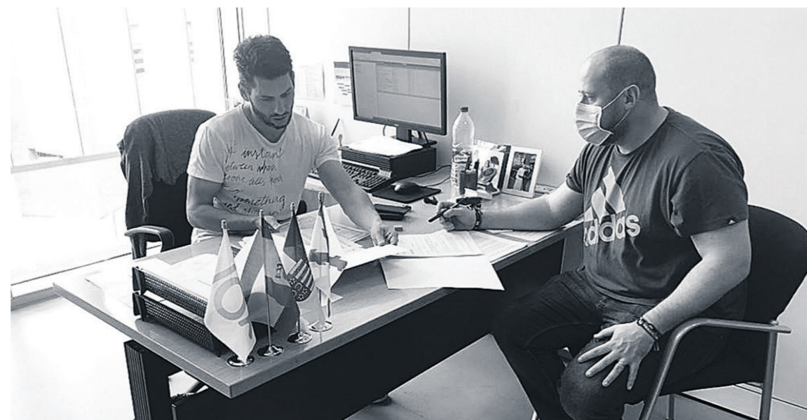
VOX alerta de una de una plaga de mosquito tigre en nuestro municipio