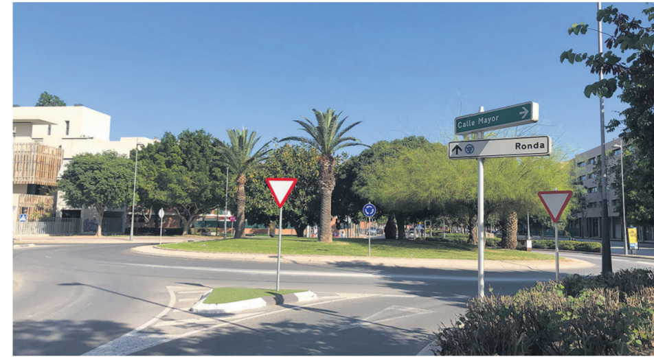
La Avenida Vicente Savall durante la cuarentena