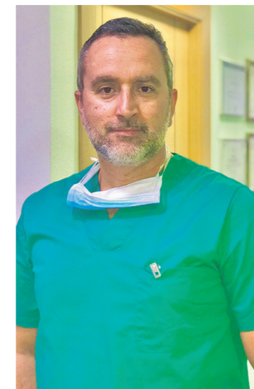
Clínica Podológica Manuel Anguita

◆ E NUESTROS PIES, EN MARCHA DE NUEVO. Después de casi dos meses en nuestras casas lentamente vamos recuperando nuestra actividad diaria. En este tiempo de parada forzosa nuestra musculatura se ha debilitado y en mayor o menor medida también hemos aumentado de peso corporal. Nuestros pies han seguido ahí, esperando el momento para ponerlos a trabajar y si hay una palabra que define lo que va a suceder durante las próximas semanas es SOBRECARGA. El pie, con su clásica forma de bóve-