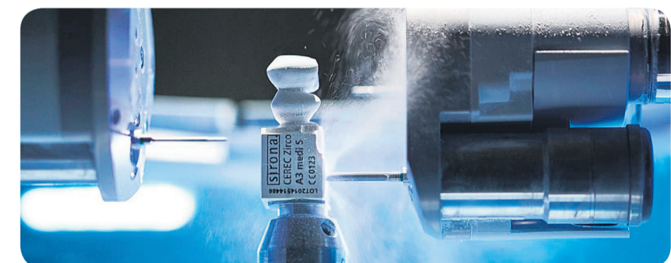
Sistema de robotización para prótesis dentales

Hay que tener claro que las clínicas dentales son seguras y hay que transmitir esa seguridad y tranquilidad a la población. Siempre hemos estado con nuestros pacientes, nunca les hemos abandonado y siempre velamos por su seguridad y bienestar. También queremos agradecer a todos nuestros pacientes la comprensión que han tenido frente a todas estas medidas adoptadas y también agradecer su paciencia y colaboración. Muchas gracias!!!