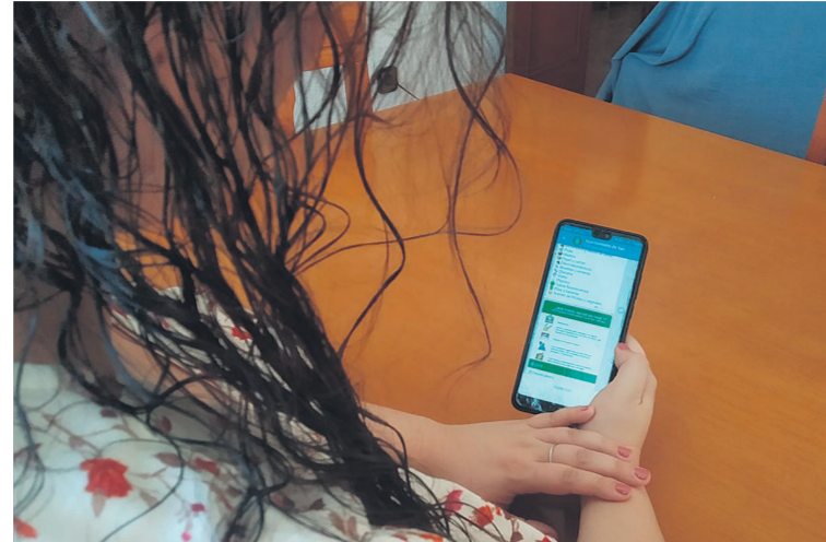
Telegram, la red Social de Referencia durante la Pandemia

Ranking nacional de Suscriptores con San Vicente a la cabeza. Tabla Completa en la web