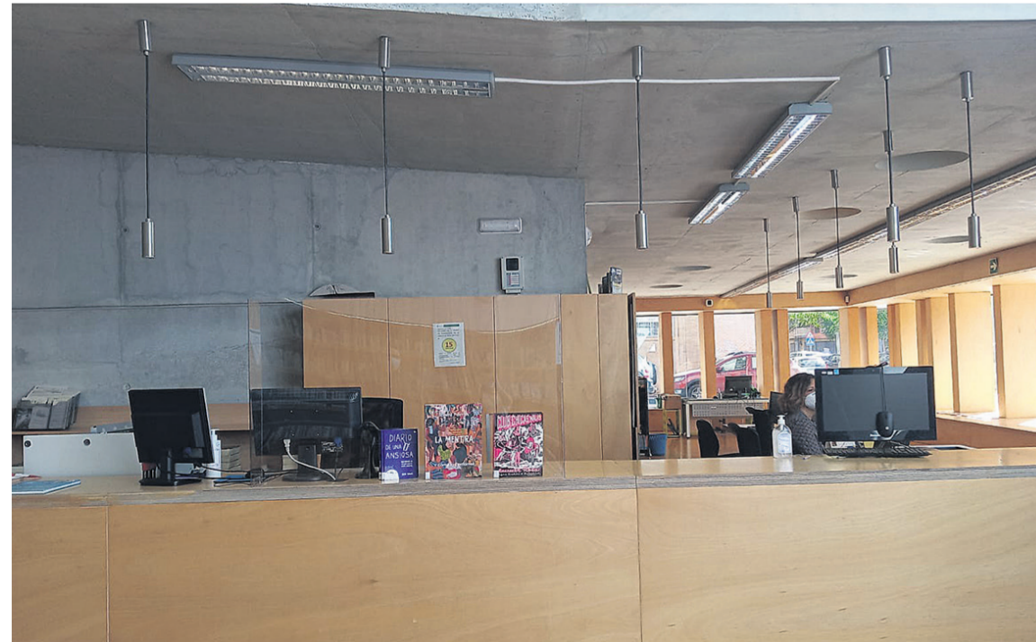
La biblioteca Miguel Delibés reabre sus puertas