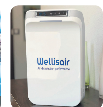
Wellis air sistema de desinfección de ambiente superficies y ropa frente a virus bacterias y hongos (incluido el covid-19)