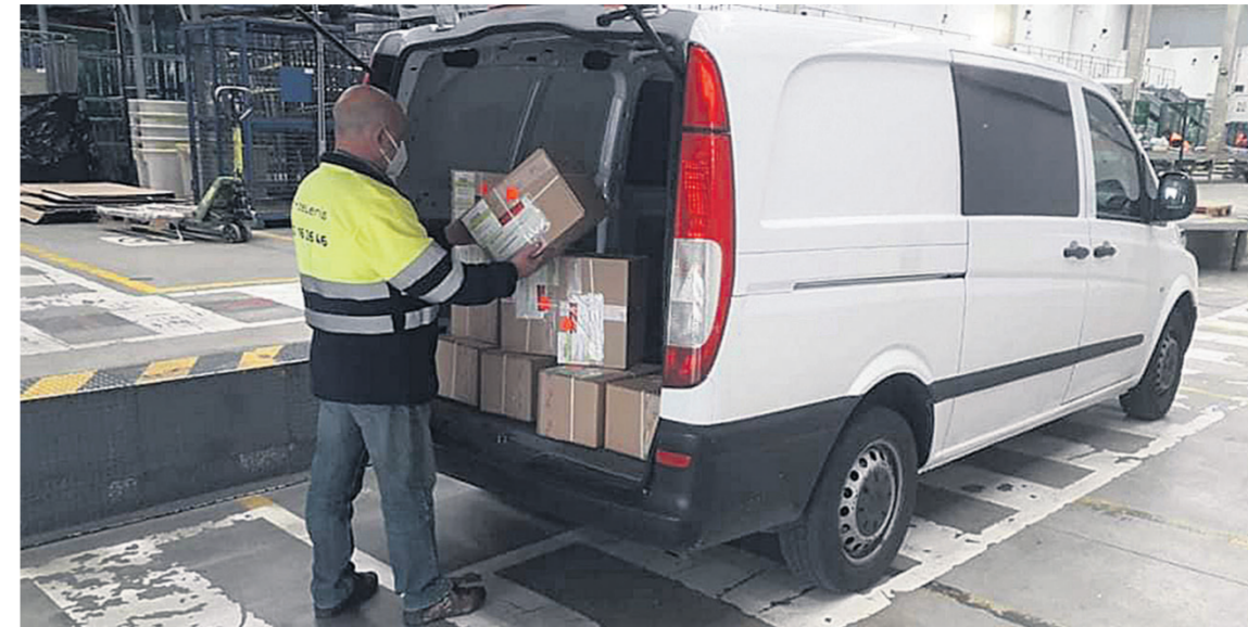
La Conselleria de Educación ha repartido un total de 208 tablets para poder finalizar el curso académico

● Igualdad de oportunidades en Educación. Bajo esta premisa Compromís ha puesto en conocimiento que la Conselleria de Educación ha repartido un total de 208 tablets, propiedad de los centros educativos, con tarjeta SIM de conexión a Internet para poder finalizar el curso académico. Esta medida va destinada a familias con menos recursos o que viven en zonas con peor conectividad.