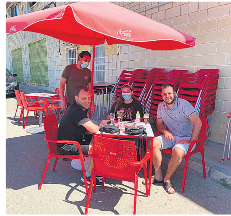
Noramidad en fase 1

Estas ayudas supondrían el 25 por ciento de los 265.000 euros contemplados en el Plan de Apoyo de Impuestos Municipales para Pymes 2020 e iría destinado a subvencionar las tasas de ocupación de vía pública, mesas, sillas, veladores y vados"