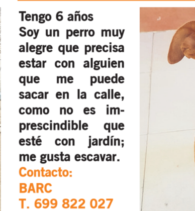
Soy Paquito, mestizo pequeño de 10kg

Tengo 6 años Soy un perro muy alegre que precisa estar con alguien que me puede sacar en la calle, como no es imprescindible que esté con jardín; me gusta escavar. Contacto: BARC T. 699 822 027