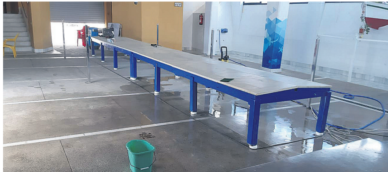
La Lonja de Pescado de El Campello reanuda su actividad