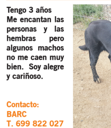
Soy Cris, tipo labrador de 35kg

Tengo 3 años Me encantan las personas y las hembras pero algunos machos no me caen muy bien. Soy alegre y cariñoso. Contacto: BARC T. 699 822 027