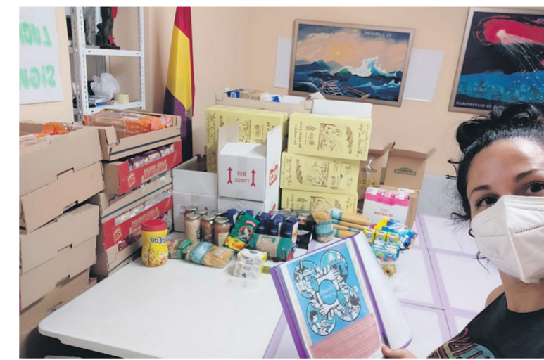
A día de hoy el grupo tiene más de trescientas personas

solidarias que se vuelcan en ayudar y el local que nos han prestado. Diariamente hay nuevas familias que se ponen en contacto porque llevan meses esperando alguna ayuda. Desde el grupo se lleva un seguimiento de las familias, de sus trámites y les facilitamos las hojas fotocopiadas que desde servicios sociales piden por correo electrónico para solicitar la valoración de las ayudas económicas de emergencia PEIS covid-19 y colgamos los enlaces de interés de ayudas al alquiler y de las entidades que ofrecen abastecimiento, pero insistimos en la dificultad que supone la brecha tecnológica para muchas personas y en el tiempo de espera en esta situación. El hecho de que las administraciones estén teletreabajando ha supuesto que en los días de setenta días estas familias se encuentren desesperadas. A todo esto, la brecha educativa también ha sido muy grande y parece que llega el momento de replantearnos qué sentido tiene la escuela en nuestra sociedad y recordar que nuestros niños y niñas no son mera maquinaria de producción. Hemos colaborado con "Alicante Gastronómica", "GAMA" de Alicante, Banco de cuidados y