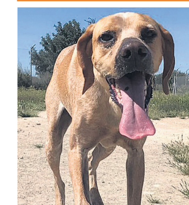
Soy Sergio, tipo braco de 20 kg con pelo corto

Tengo 2 añitos Me encantan todos los perros y aunque soy muy tímido, a la gente también. Me gustaría estar con personas alegres pero tranquilas y quizás que tenga perra. Contacto: BARC T. 699 822 027