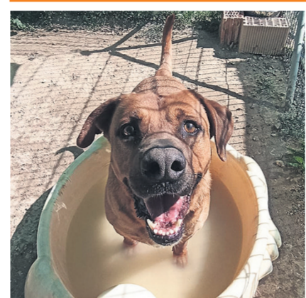
Soy Bruno, un perro grande de 36 kg

Tengo 5 años A mí me gusta estar con una pareja o familia madura, sin niños. No me interesa tanto otros perros y estoy bastante independiente. Contacto: NHARA T. 644 423 556