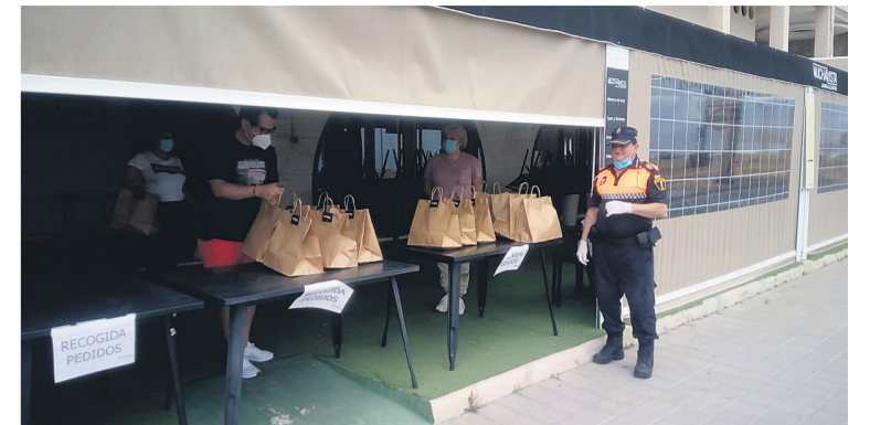
Se han repartido 150 lotes de alimentos entre personas y familias vulnerables de El Campello

alimentos entre personas y familias vulnerables y en más de 70 ocasiones se ha podido suministrar alimentos a los campelleros que así lo requerían, gracias a las donaciones realizadas por negocios, empresas, entidades y vecinos solidarios de nuestro municipio.