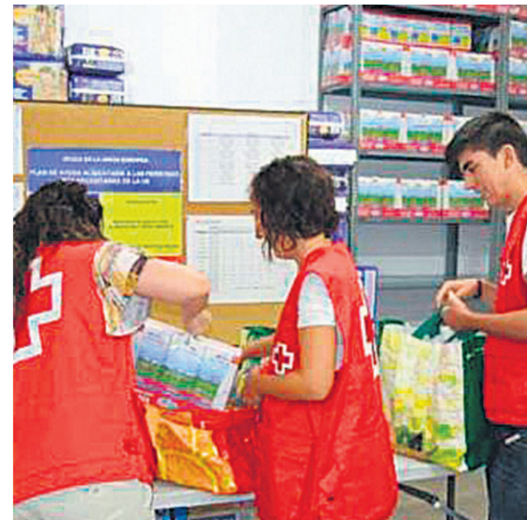
Voluntarios de Cruz Roja