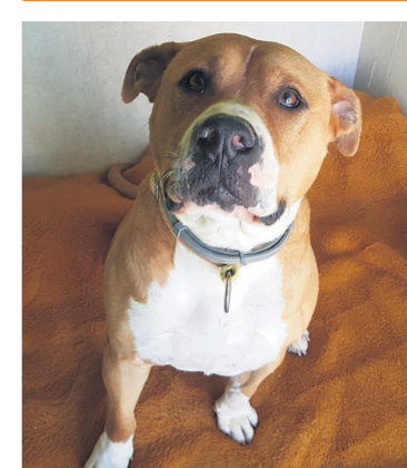
Soy Tranco, un American Staffordshire Terrier de 32 kg

Tengo 3 años Yo estaría fenomenal con un dueño que tenga algo más de experiencia con el adiestramiento de perros. Me encantan las personas y la mayoría de los perros. Contacto: APAC (caso externo) T. 649 715 092