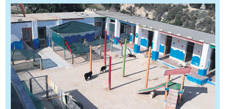
El Hotel Canino, El Rey de la Casa