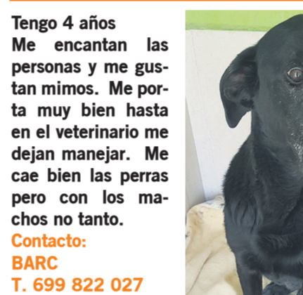
Soy Tomas, tipo labrador de 20kg

Tengo 4 años Me encantan las personas y me gustan mimos. Me porta muy bien hasta en el veterinario me dejan manejar. Me cae bien las perras pero con los machos no tanto. Contacto: BARC T. 699 822 027