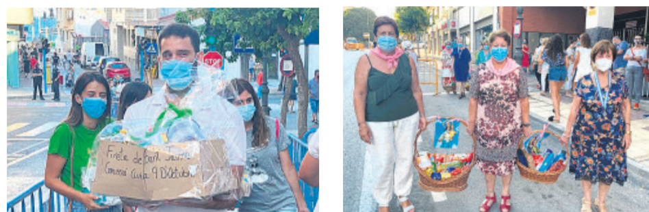
EMotiva misa y ofrenda de flores a la Virgen del Carmen