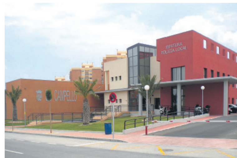
Retén de la Policía Local de El Campello

Som El Campello ◆ Continúan las inversiones públicas en materia de seguridad en El Campello. El concejal de Seguridad Ciudadana,