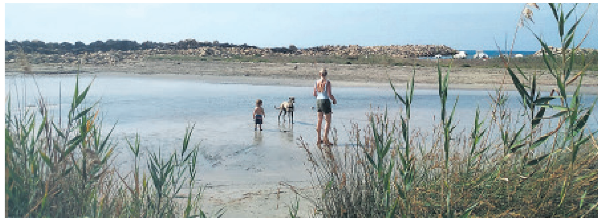
Bañistas en Cala Baeza que fueron avisados para que salieran del agua