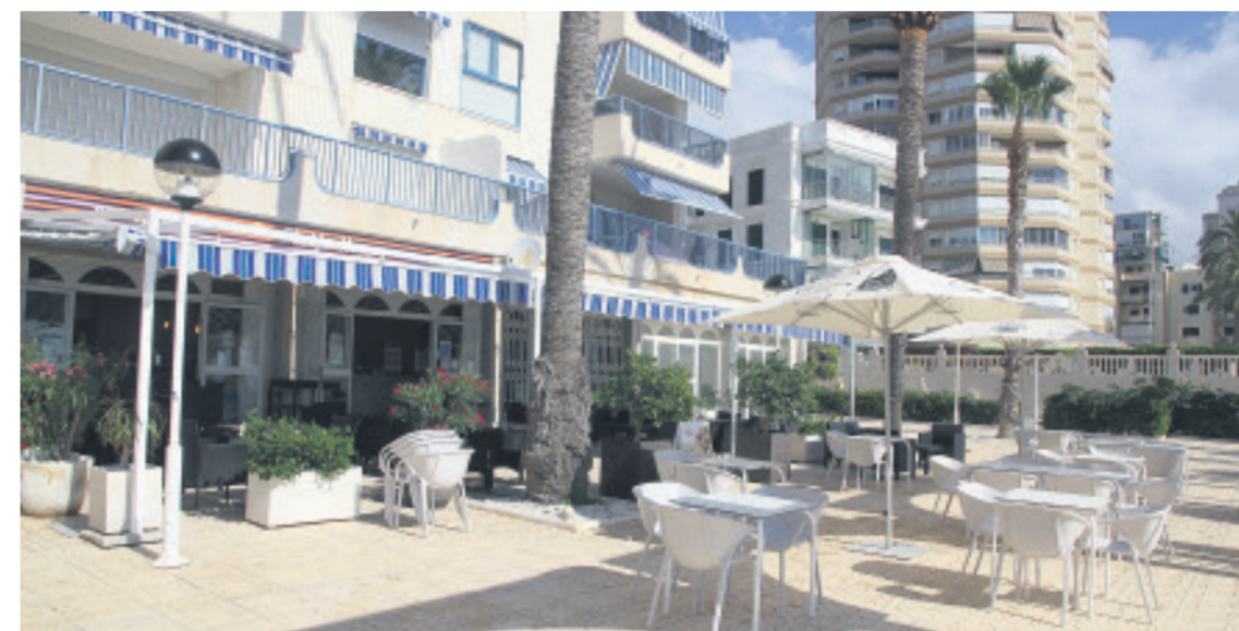
Espectacular terraza en pleno paseo marítimo de El Campello con vistas al Mediterráneo

● Recorrer el paseo marítimo de El Campello es toda una grata experiencia para nuestros sentidos. La espectacular vista del mar Mediterráneo, el sonido de las olas, el olor a brisa marina pero sobre todo los sabores de la amplísima oferta gastronómica que encontramos en el recorrido.