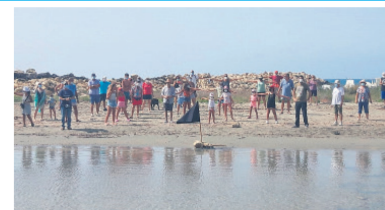
Manifestantes reclamando el cierre y señalización de las calas