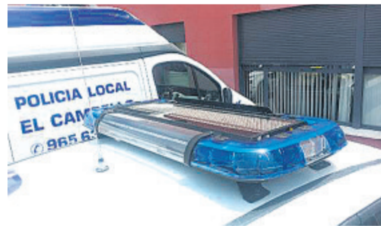
La Policía Local adquiere dos nuevos coches

Som El Campello ◆ Con los votos a favor de PP, Cs, Vox, PSPV, Compromís y EU, y la abstención de Red y Podem, el pleno del Ayuntamiento de El Cam-