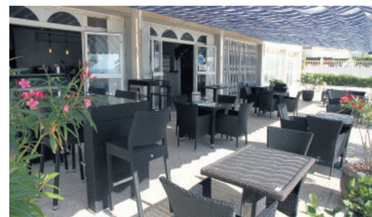
La amplitud de su terraza permite que el distanciamiento social esté garantizado