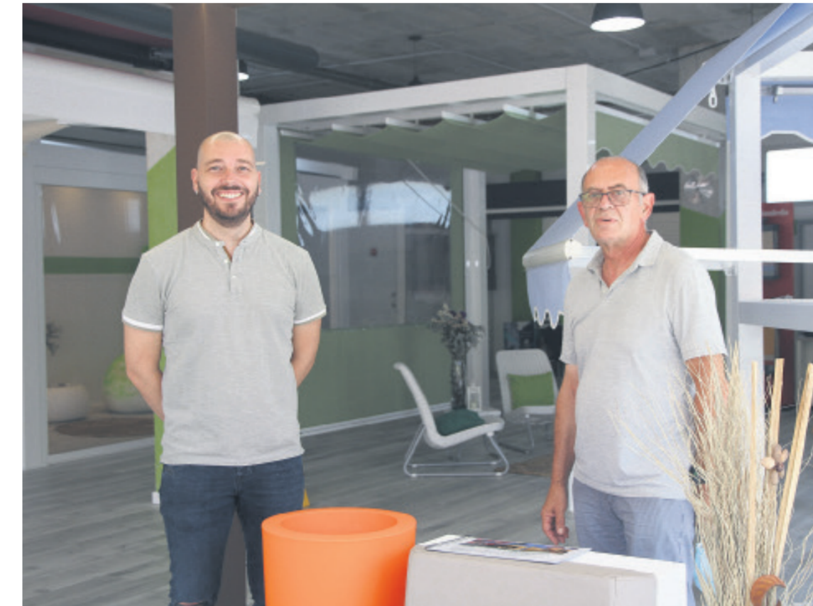
Este verano, equipate con todo lo necesario en Toldos Vicente

◆ Toldos Vicente se caracteriza por su competencia y eficacia, poniendo a disposición de sus clientes todos los conocimientos técnicos que atesoran. Siguen ofreciendo todo lo que necesitas en su tienda física situada en el municipio de El Campello, donde podrás descubrir su catálogo y encontrar inagotables posibilidades que te permitirán vivir un verano relajado y refrescante.