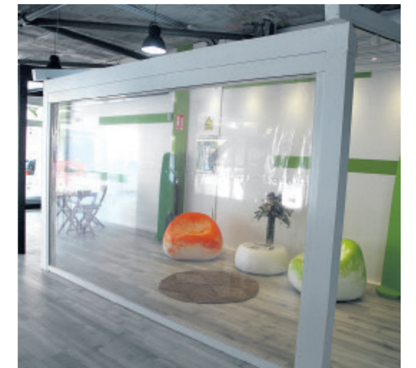
Encuentra el mejor asesoramiento en Toldos Vicente

Utilizan materiales de última generación, más limpios y resistentes, como los empleados para una 'unión termosoldada'. Disponen de telas y tejidos ecológicos, capaces de purificar el aire y mejorar la experiencia del cliente. Trabajan con las principales marcas del mer-