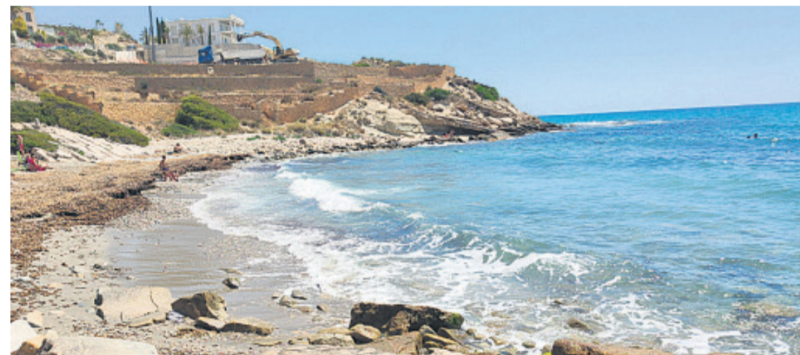
Es la primera vez que se cierra una cala por vertidos de aguas fecales

Som El Campello ◆ Por primera vez se cierran al baño dos calas de El Campello por vertidos de aguas fecales, un problema conocido por muchos vecinos desde hace años consecuencia de la falta de alcantarillado de la zona norte de El Campello y