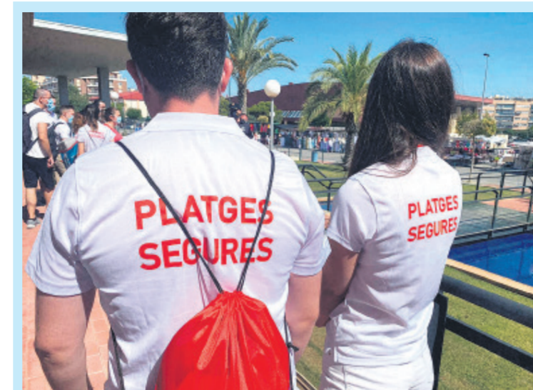
Dos agentes turísticos de El Campello