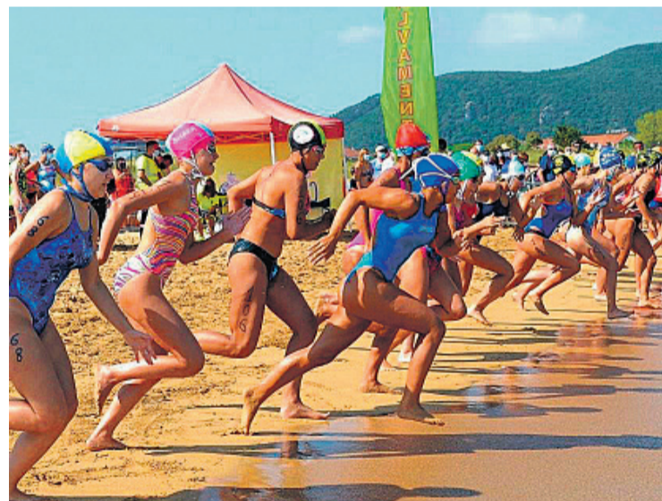
Una de las pruebas del Campeonato de España

El Salvamento y Socorrismo es un apasionante deporte en el que se ponen de manifiesto las habilidades de los socorristas tanto en entornos naturales como en instalaciones acuáticas. Los deportistas no solo deben de adquirir una altísima cualificación natatoria sino que deben estar preparados tanto física como psicológicamente. Es un deporte que engloba múltiples actividades o disciplinas entre las que se encuentran: la natación con y sin aletas, el buceo, los remolques o arrastres de personas en el agua, los primeros auxilios, carrera en playa, surf con tabla de salvamento, remar con sky de salvamento, rescate en playa con y sin material, etc. Es muy atractivo y apasionante y eso se nota en cada competición ya que muchos bañistas o turistas lo descubren a pie de playa y