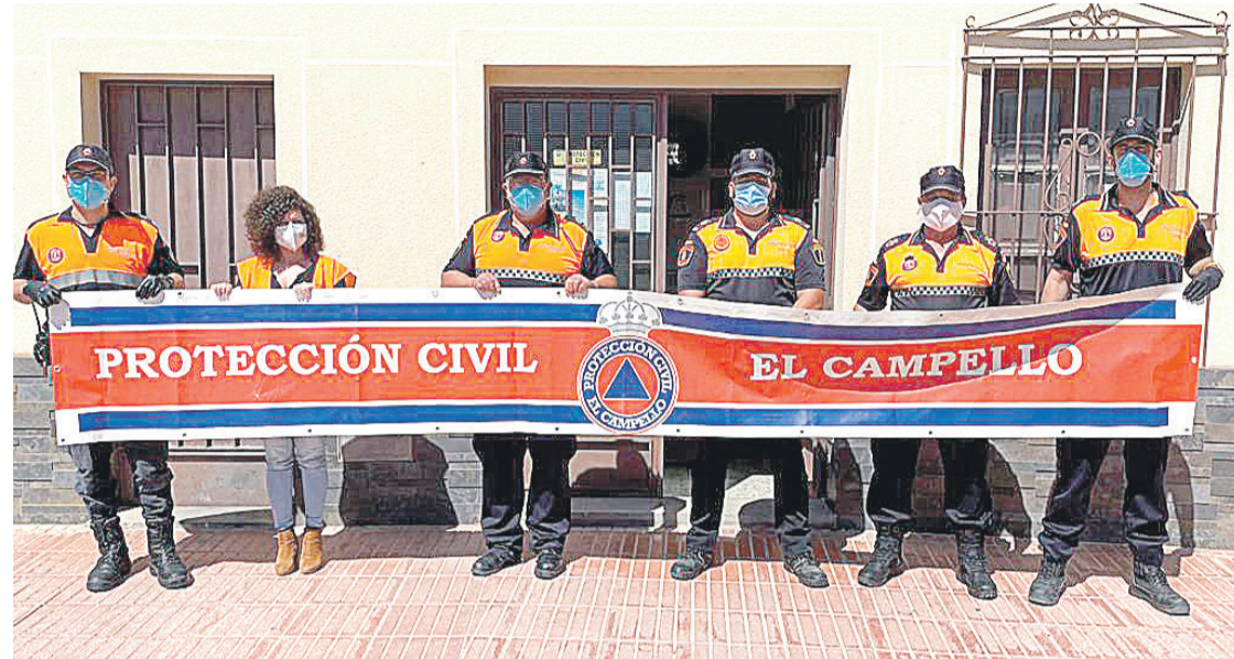
Agentes de protección Civil de El Campello