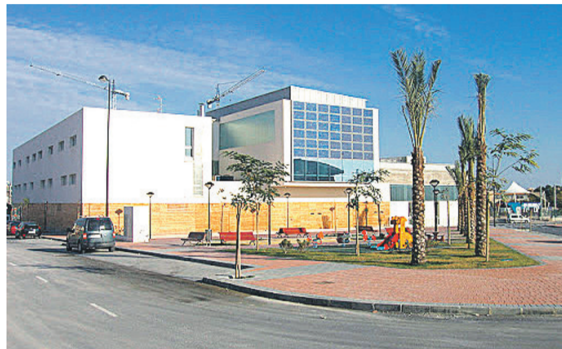
Centro Social “El Barranquet”

● “Bienestar Social gestiona, tramita y da salida a infinidad de solicitudes y situaciones para las personas más vulnerables en El Campello. La atención presencial sólo se realiza en casos de absoluta imposibilidad de realizar los trámites telemáticamente pues se prioriza la salvaguarda y salud de nuestros vecinos”