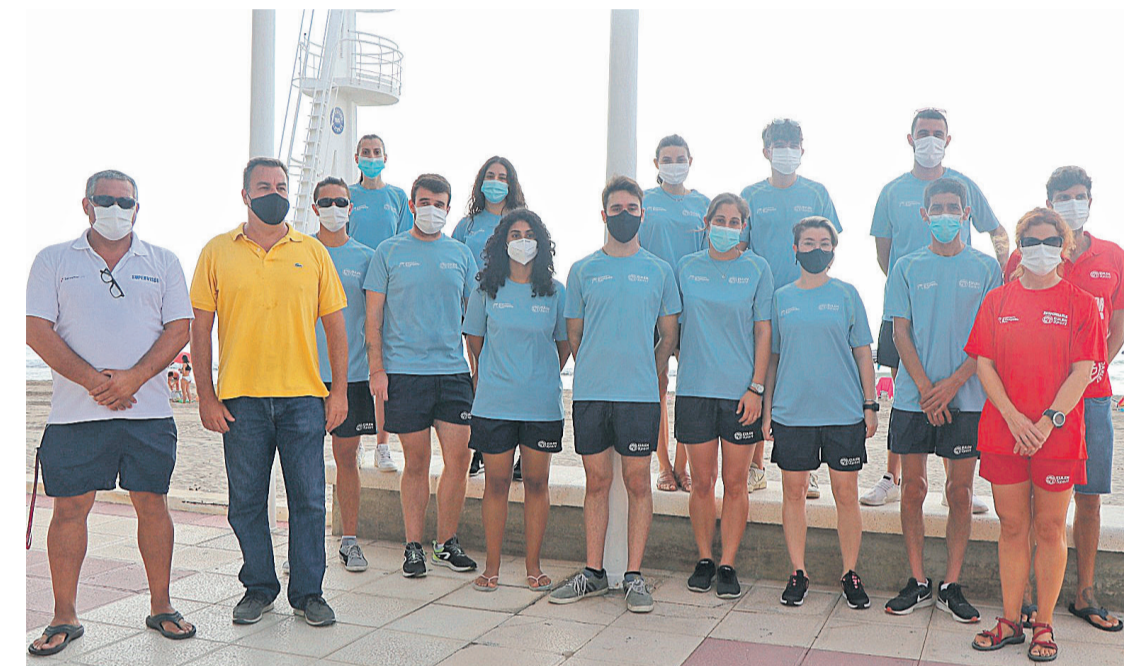
Playas presenta 14 nuevos controladores para las playas y calas de El Campello

● “Como principal novedad, calas del municipio incluyen la concejalía de Playas, reduciendo las que no tienen servicio de salvamento y socorrismo”