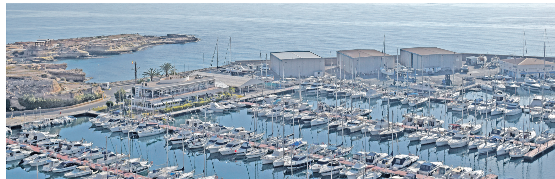
Vista panorámica del Club Náutico Campello

◆ El Club Náutico Campello registra una gran afluencia durante el mes de agosto en sus servicios de amarres, varadero, escuela y restauración. Las malas expectativas con las que arrancaba esta tardía campaña de verano, marcada por las medidas sanitarias derivadas de la crisis sanitaria, mejoran las previsiones económicas para esta temporada.