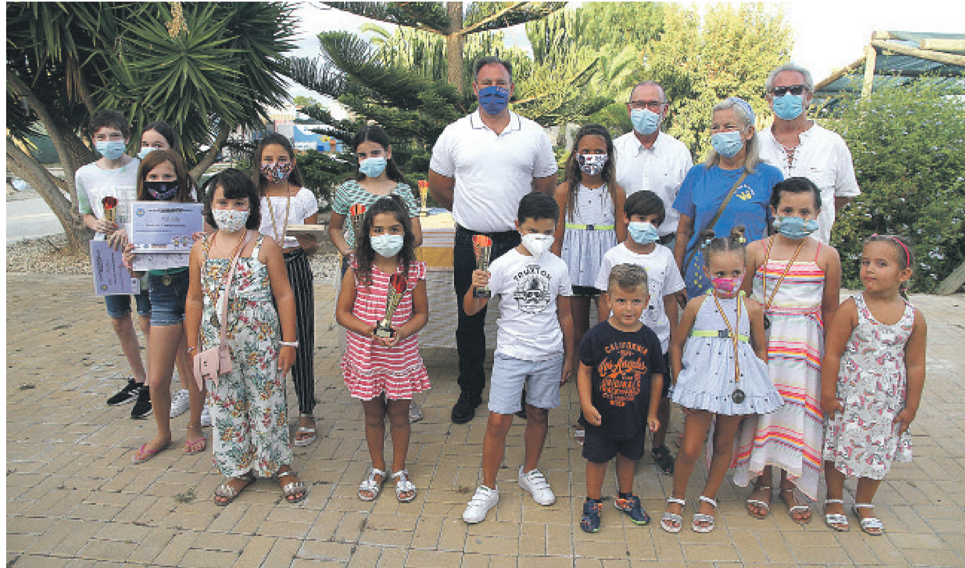
Ganadores del concurso de Dibujos y Relatos organizado por el Hotel Canino El Rey de la Casa