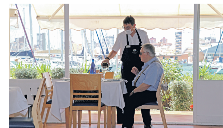
El restaurante del CNC ha retomado la actividad cumpliendo las medidas higiénico-sanitarias

Unos buenos datos que ayudan a aliviar las pésimas expectativas que no logran salvar la temporada veraniega, pero que sin duda superan las previsiones iniciales. Una recompensa al esfuerzo organizativo que ha realizado el Club con la puesta en marcha de las medidas anti-covid para ofrecer a sus socios y usuarios unas instalaciones