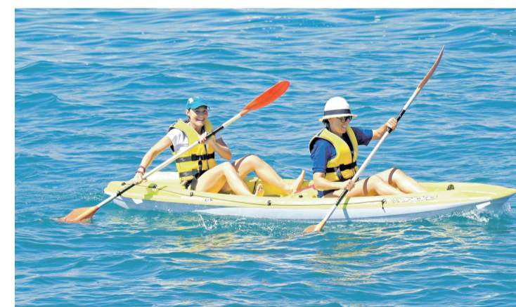
Usuarios de la Escuela del CNC durante unos alquileres de kayak

◆ El Club Náutico Campello registra una gran afluencia durante el mes de agosto en sus servicios de amarres, varadero, escuela y restauración. Las malas expectativas con las que arrancaba esta tardía campaña de verano, marcada por las medidas sanitarias derivadas de la crisis sanitaria, mejoran las previsiones económicas para esta temporada.