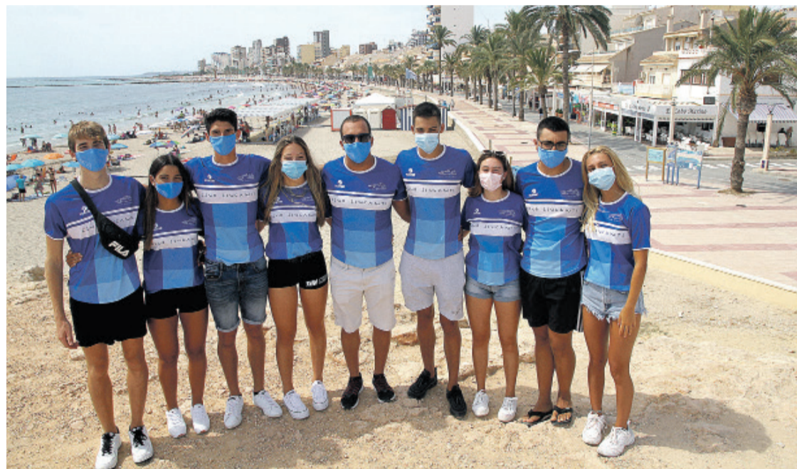
Participantes del Club Leucante en el Campeonato de España

● El trabajo de 5 años se está considerando ya que además viendo recompensando con de competición reúne en él la un año de triunfos para el formación de jóvenes en las Club Leucante de Salvamento y Socorrismo. Un deporte, que debería ser tenido más en las necesarias labores de prevención de accidentes en costas y piscinas.