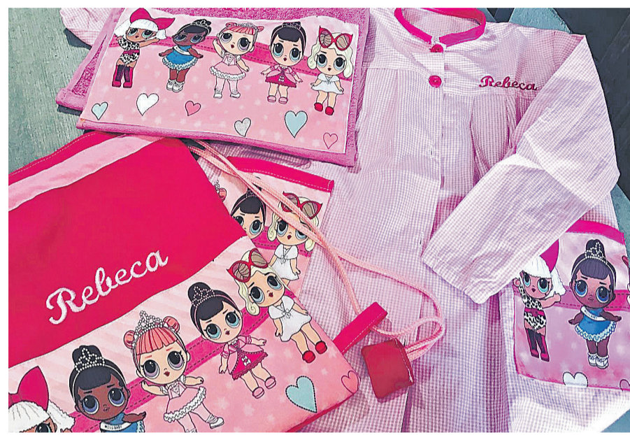
Pack "Vuelta al cole" en promoción de Baby+mochila+toalla personalizadas por 35 euros