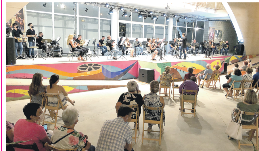
Concert d'estiu de la Associació Musical L'Avanç