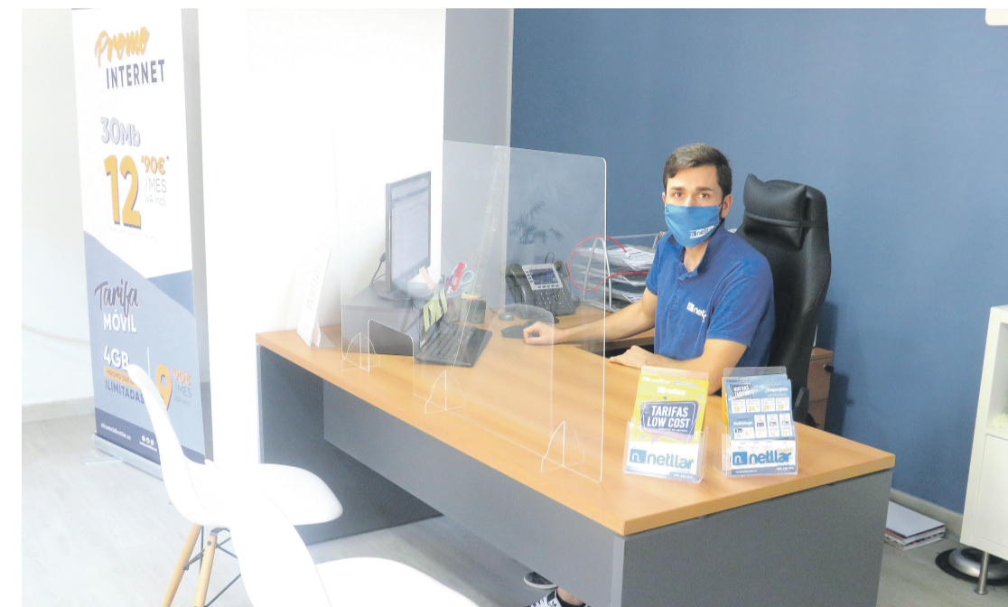
Netllar te atenderá en su oficina de El Campello