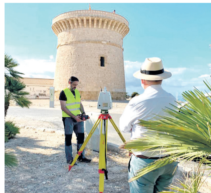
Escaneo de la Torre de la Illeta de El Campello