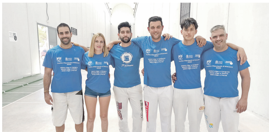
L'equip finalista