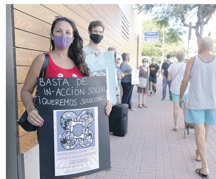
Imagen de la manifestación del pasado miércoles 19 de agosto

do que desde el 14 de marzo se ha atendido presencialmente a 140 personas, mediante cita previa y ha recepcionado telefónicamente alrededor de 3000 llamadas relacionadas en el 87.5 % de los casos con necesidades de personas en situación de vulnerabilidad y en el 12.5 % restante, vinculadas a cuestiones de interés general. La concejala del área de Bienestar Social, Mercé Pairó explica que “La atención presencial se realiza en casos de extrema urgencia y mediante cita previa, ya que desde el primer momento el Ayuntamiento ha priorizado el bienestar de nuestros vecinos y su protección frente a la Covid-19”.