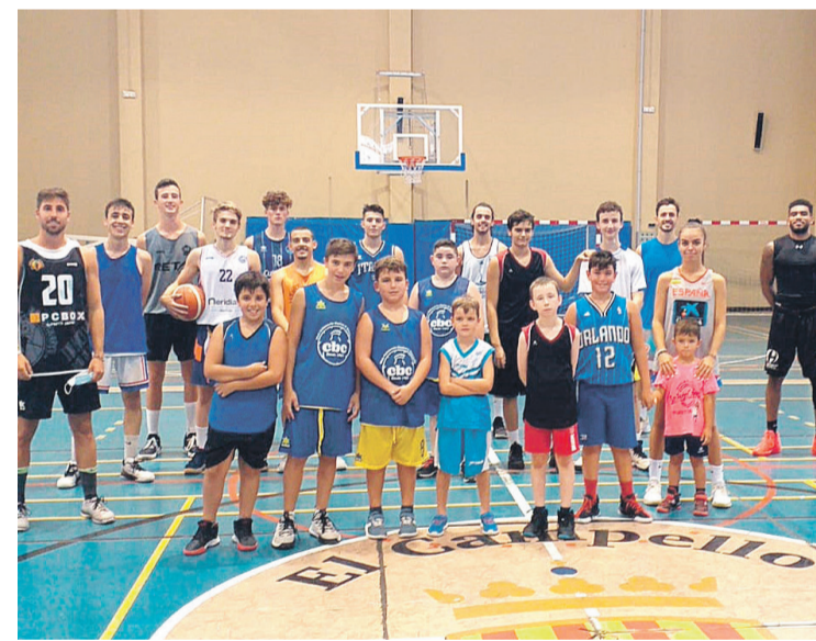
Participantes del Campus Cantera organizado por el Club baloncesto Casino de El Campello