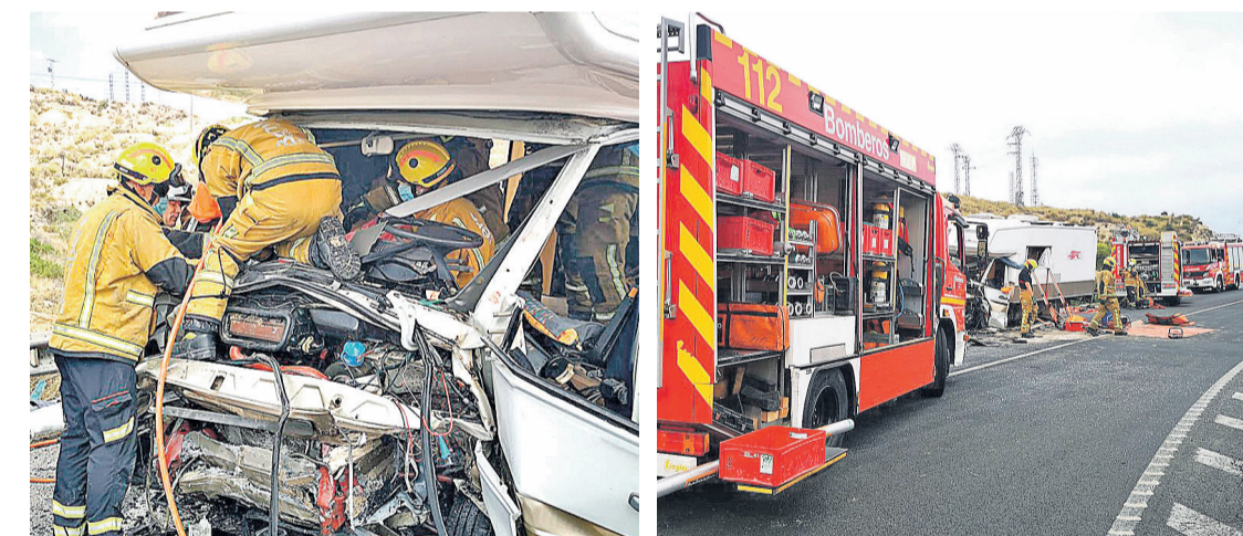
Dramático accidente de tráfico en la N-332, km 128, a la altura de venta Lanuza en El Campello

◆ El pasado miércoles 12 de agosto lamentamos un dramático accidente de tráfico en la N-332, km 128, a la altura de venta Lanuza en El Campello, con dos fallecidos y tres heridos graves.