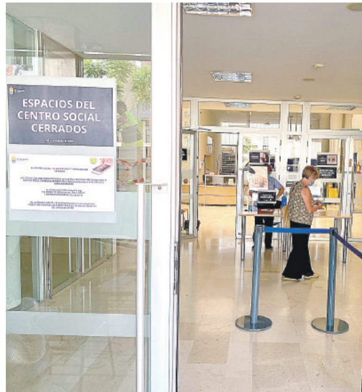
Centro Social "El Barranquet"

“ 2332 consultas relacionadas con ayudas económicas y alimentarias, violencia de género, adicciones, asesoramiento jurídico y psicológico, dependencia o voluntariado...”