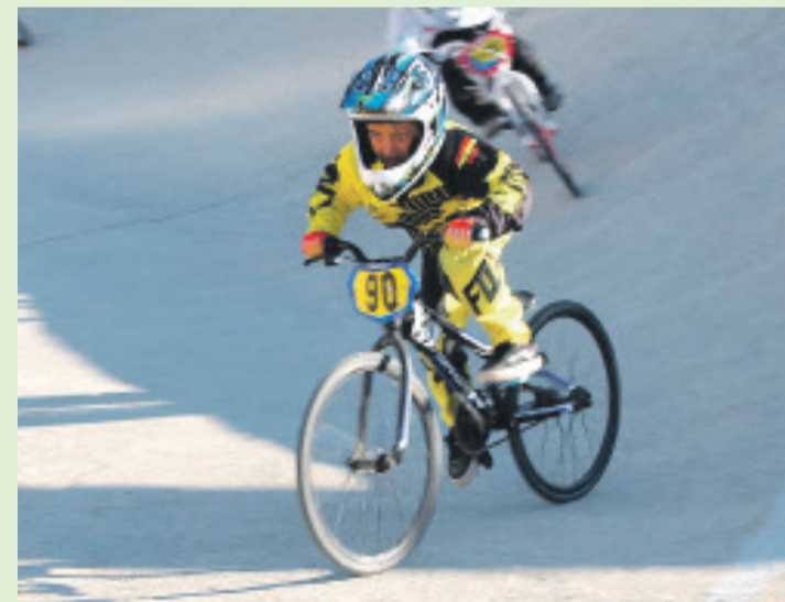
Corredores del Club de BMX de El Campello que participaron en el Campeonato de España