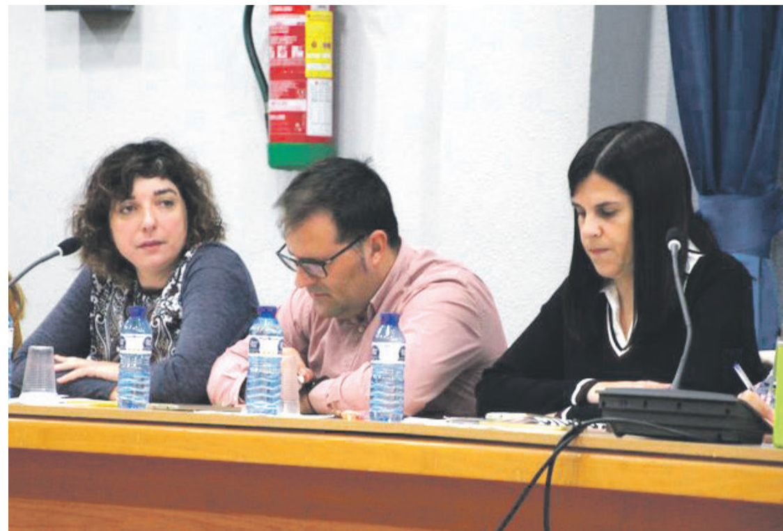
El grupo Municipal de Compromís en El Campello