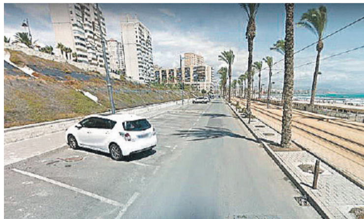
Aparcamientos en la Playa Muchavista de El Campello