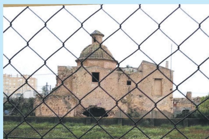
Foto del Convento de mercedaris