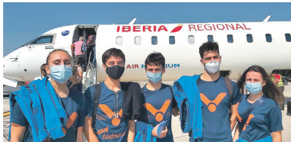
El Club de badminton de El Campello se trasladó a Oviedo para disputar el "Iberdrola Spanish Junior"