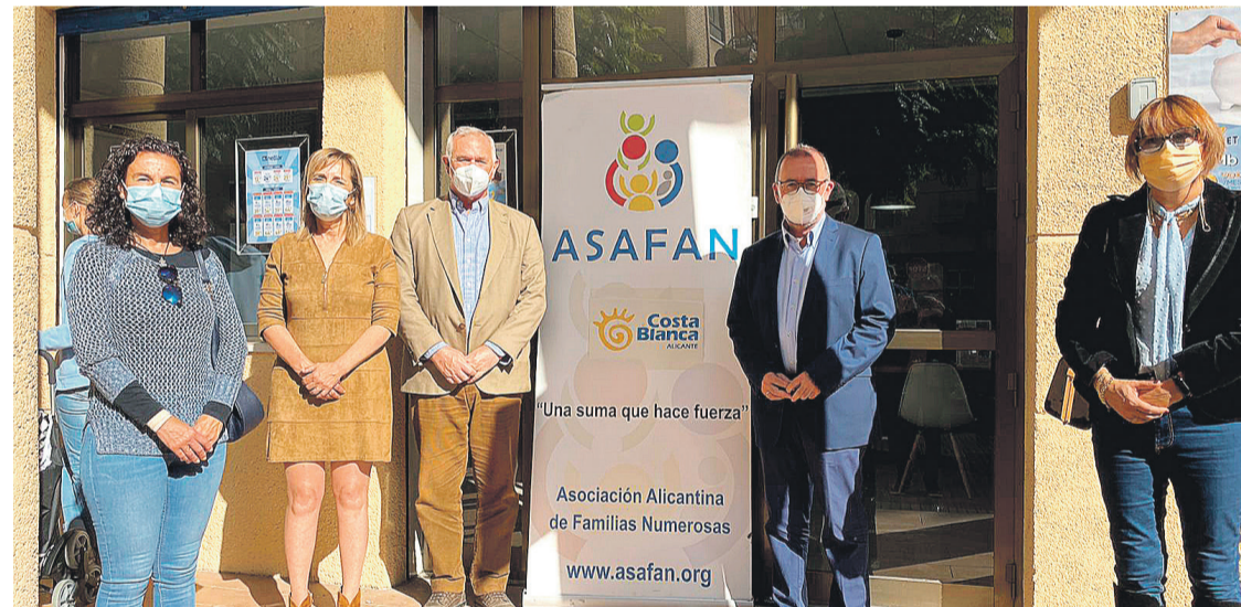
ASAFAN ya cuenta con una sede en el municipio de El Campello