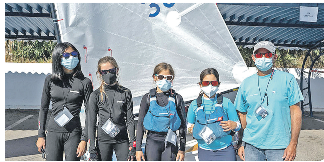
Las buenas condiciones meteorológicas permitieron a la flota completar el programa de pruebas previsto