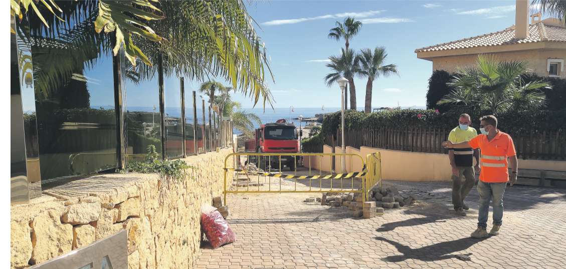
Trabajos de mejora de la escorrentía de la calle Morros Alts