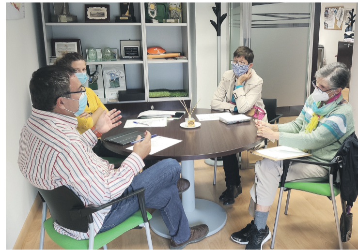
Reunión para impulsar el voluntariado medioambiental