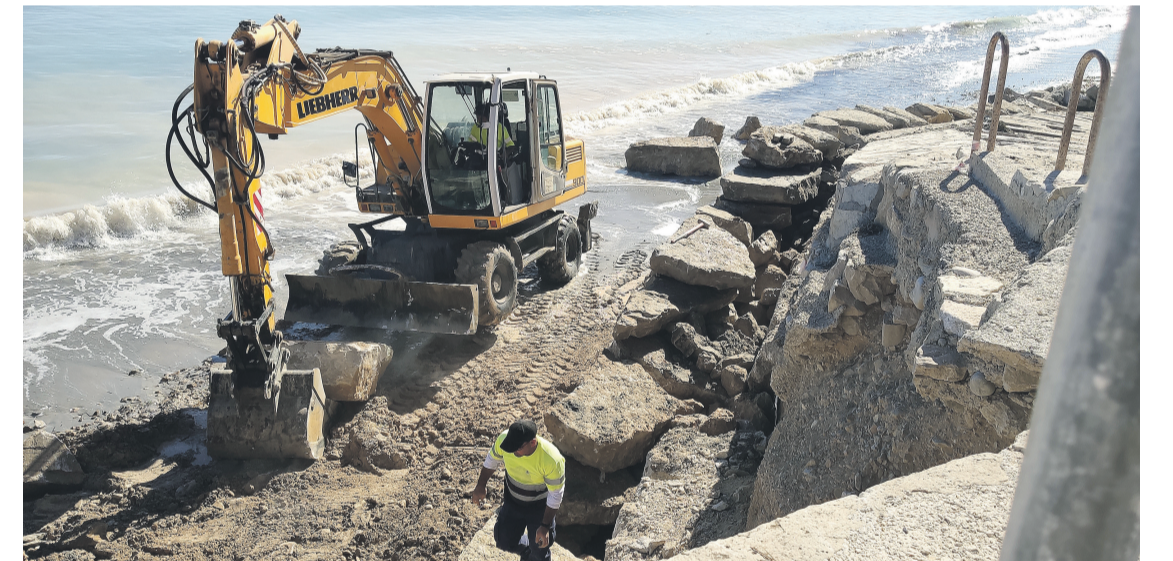
Obras en la playa de La Almadraba

Asimismo, se ha acometido la reconstrucción del muro de contención de mampostería, de una longitud de 20 m y una altura de 3 m, para lo cual se están empleando bloques de piedra de escollera, de hasta 2 toneladas, procedentes de las canteras de Busot. Además, se ha procedido a la recons-