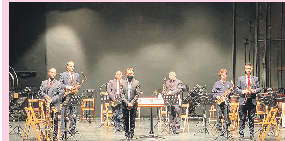
Concierto de Santa Cecilia en el que L'Avanç incorporó 4 nuevos educandos