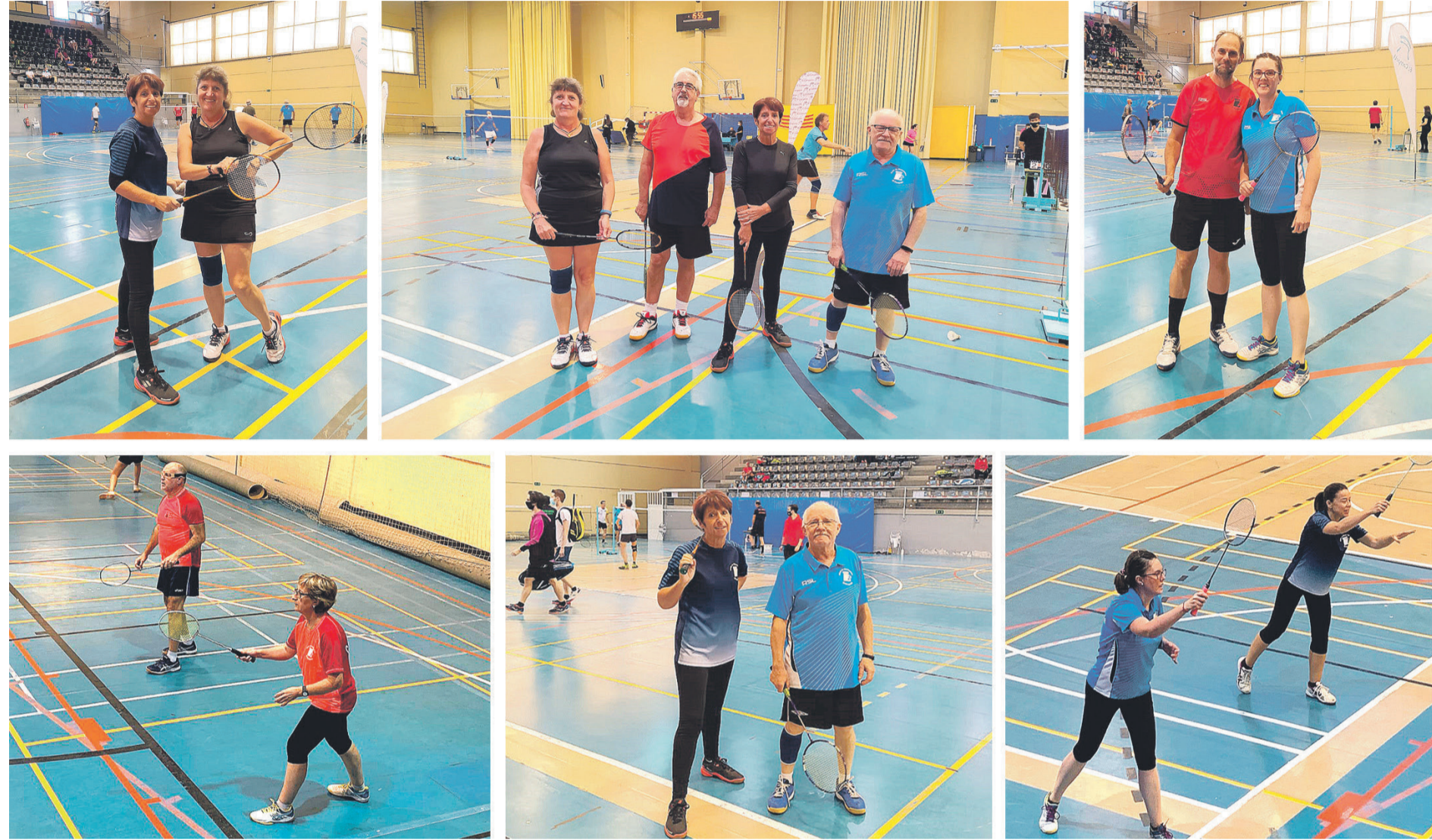
El pasado domingo 15 de Noviembre se disputó en El Campello el primer TTR absoluto/ sénior de bádminton