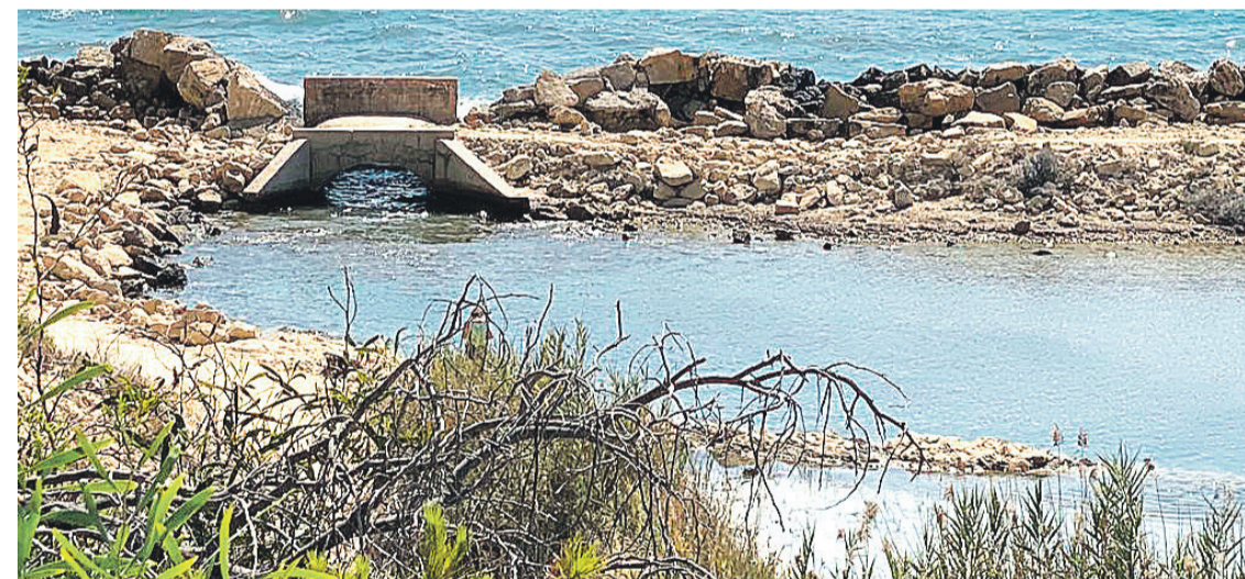
Imagen de Cala Baeza en El Campello