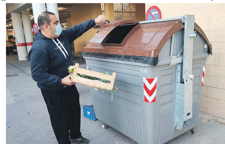
Un usuario del quinto contenedor para materia orgánica

Para ello, la concejalía pondrá a su disposición 16 nuevos contenedores, 4 para el desecho de basura orgánica, 6 para el de papel y cartón y otros 6 para depositar envases y plásticos. Así, las aproximadamente 10 toneladas de residuos recogidas habitualmente cada día de mercadillo podrán ser tratadas convenientemente para su posterior recuperación. Hoy mismo, se realizaba una primera prueba piloto, en la que se ha valorado la viabilidad de la recogida de residuos orgánicos en el contenedor marrón, cuya boca de entrada posee unas dimensiones muy reducidas, lo que podía representar una dificultad a los comerciantes, a la hora de desechar los residuos. "Se trata de facilitarles el trabajo, que entiendan esta iniciativa desde el punto de vista del beneficio y no como una carga o un trabajo añadido a sus quehaceres", ha explicado el edil de Mercado, Ja-