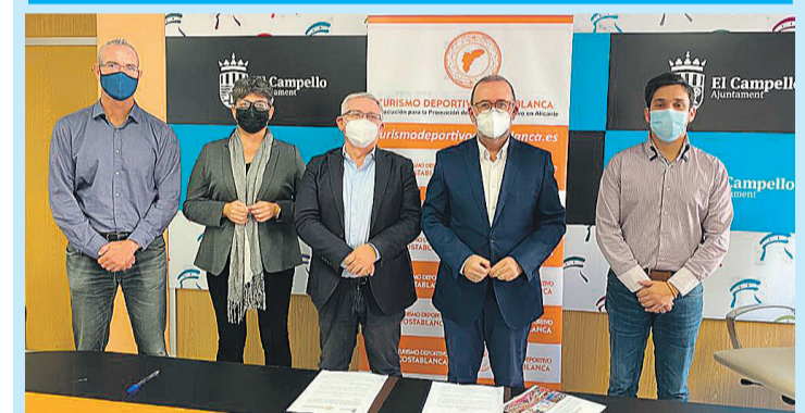
Firma del convenio para promocionar el turismo deportivo