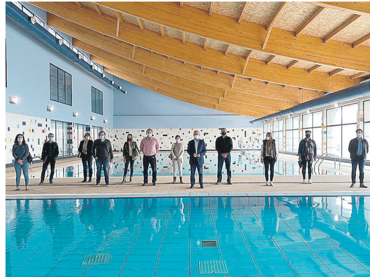
Visita de la corporación municipal a la instalación deportiva