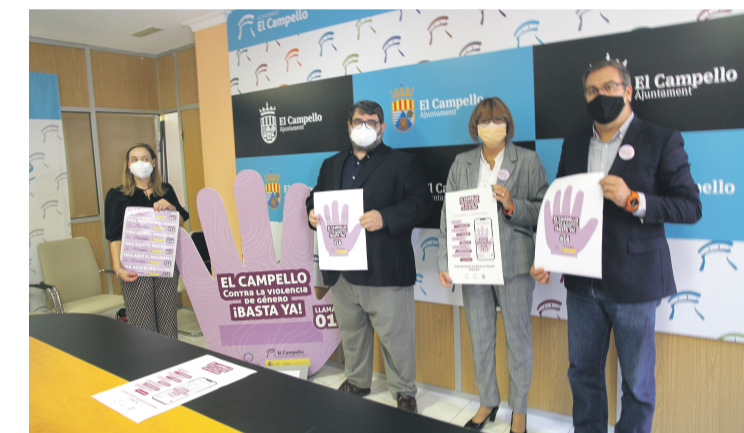
Presentación a los medios de la nueva campaña contra la Violencia Machista