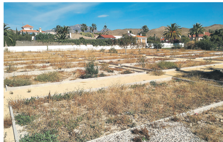
Parcelas dedicadas al huerto urbano de El Campello

proyecto y por tanto contará con nuestro apoyo. Además pensamos que para aquellas personas que se adentren por primera vez en el mundo de la plantación y recolección, sería interesante que recibiesen algún asesoramiento o formación, cuestión que solicitaremos al ayuntamiento que estudie la propuesta".