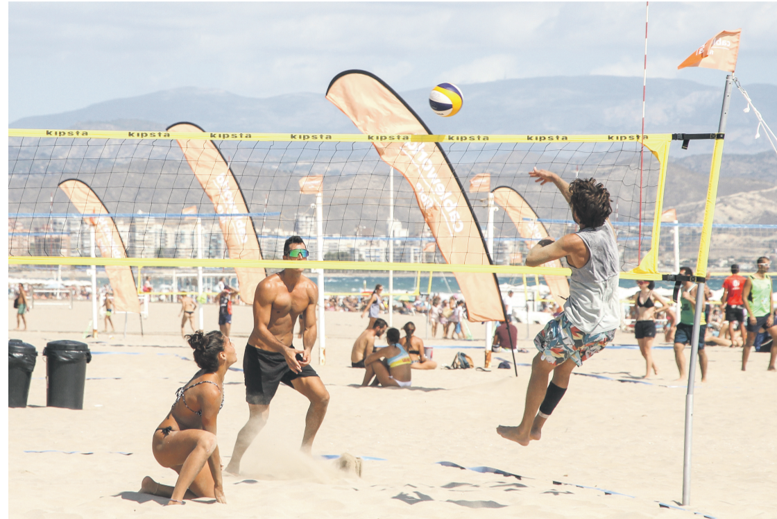
Equipo mixto jugando a Vóley