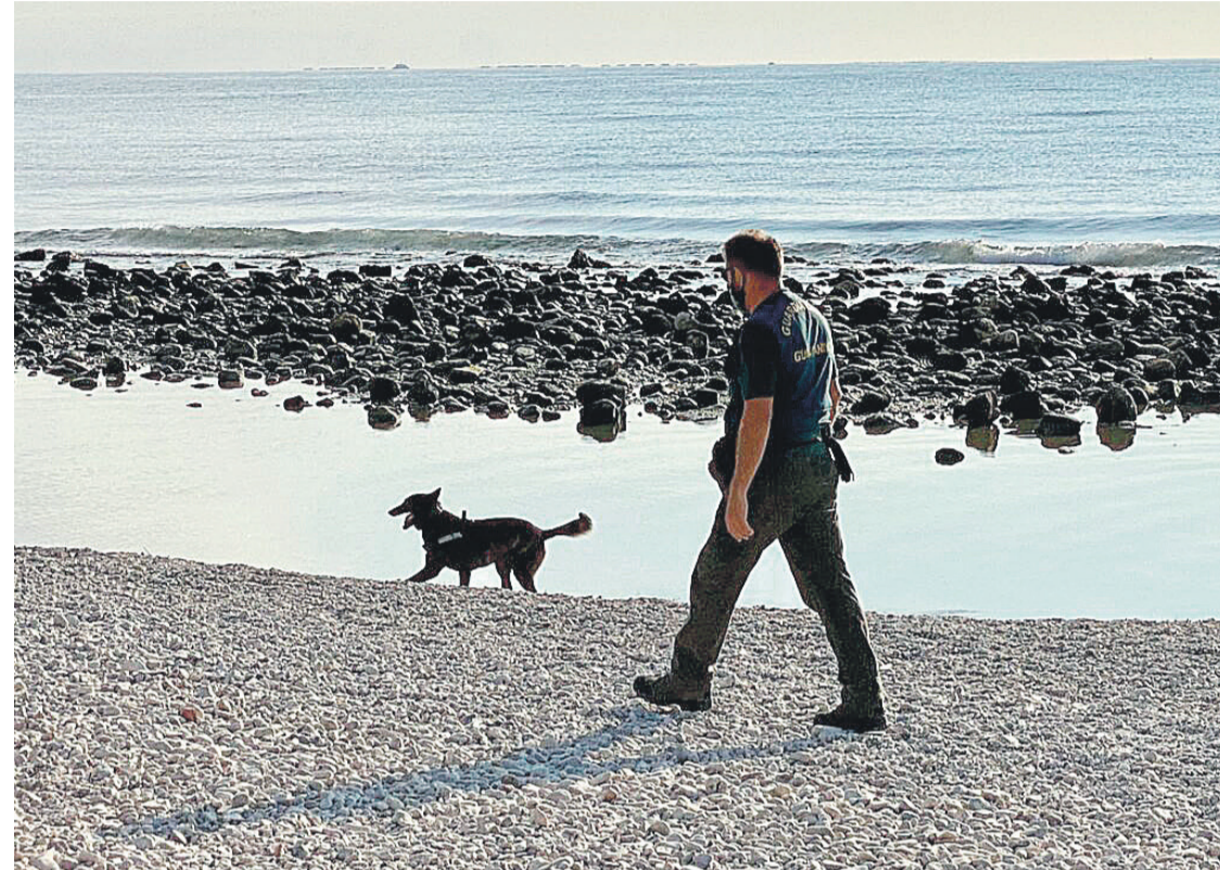
Agente de la Guardia Civil de la Unidad Canina en la playa

● Agentes del Servicio de Protección de la Naturaleza (SEPRONA), y la Unidad Canina de la Guardia Civil, han realizado hoy una minuciosa inspección de la playa de perros sita en la desembocadura del río Monnegre, en El Campello, donde en ocasiones se denuncian casos de envenenamiento de mascotas por ingesta de sustancias nocivas que algún o algunos desaprensivos lanzan en ese espacio destinado a su esparcimiento.