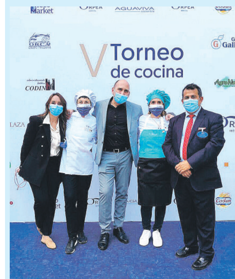
Todos los integrantes de Orpea en el concurso