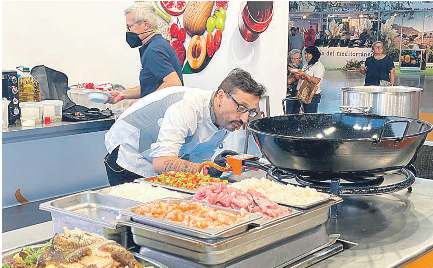
Uno de los cocineros preparando en directo uno de los platos

● Se clausuró en las instalaciones de la Institución Ferial Alicantina (IFA) «Alicante Gastronómica», una cita que durante cuatro jornadas ha reunido a los mejores fogones de la provincia con el objetivo de promocionar la Costa Blanca como destino gastronómico indiscutible.