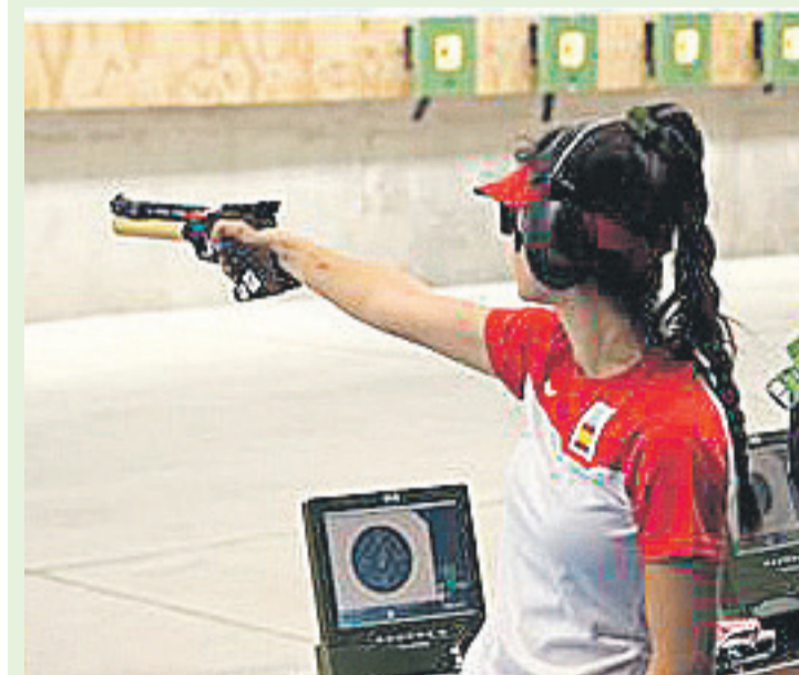
Irlanda tirando en el mundial