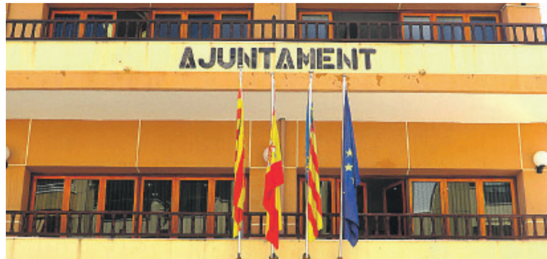
Fachada del Ayuntamiento de El Campello