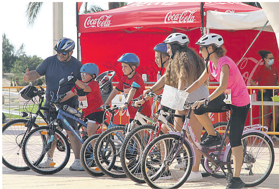
El Campello celebró la I Edición del Día Sin Coches

La jornada, que arrancaba a las 10.00h, se prolongaba durante cuatro horas durante las cuales la concejalía organizó cuatro sorteos en el punto de avituallamiento donde todos los participantes pudieron refrigerarse y tomar fuerzas para continuar recorriendo el circuito de 3 km de distancia, que transcurría