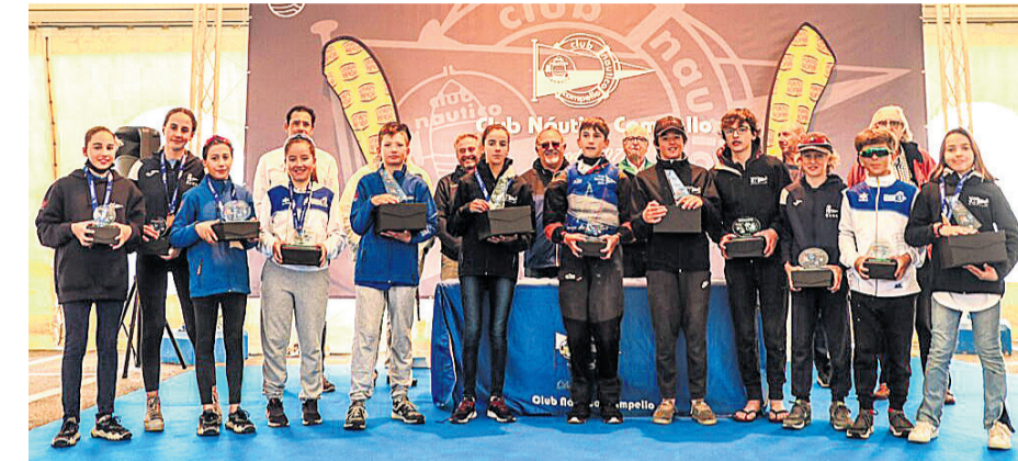
Foto de familia con todos los ganadores