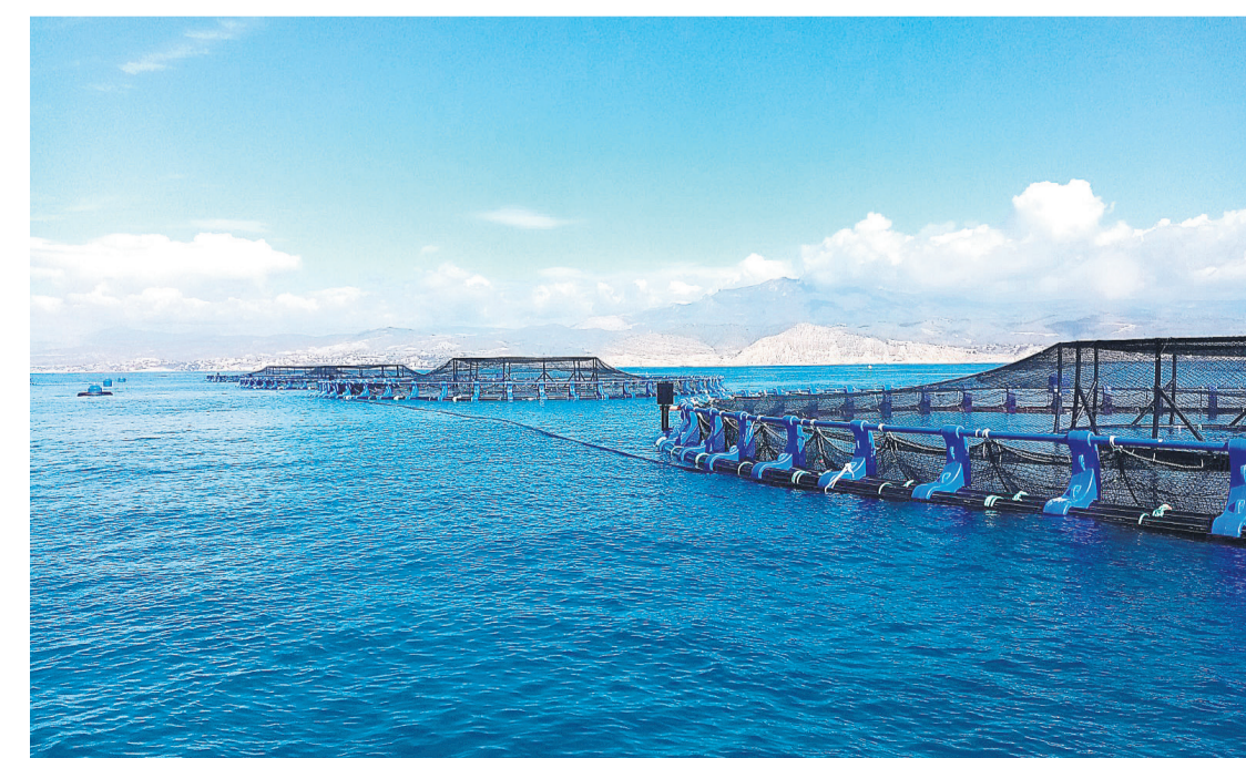
Nuevas instalaciones de AVRAMAR en El Campello

Todo esto es necesario para satisfacer al nuevo consumidor, más exigente, fuertemente comprometido con el entorno y más sensible, por tanto, al impacto medioambiental de sus decisiones de compra.