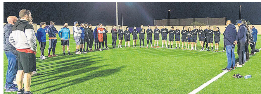
Reunión del equipo en el Polideportivo El Vinle