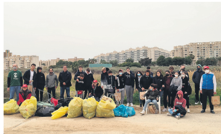
Ediles, dirección del centro y alumnado en la recogida de este año