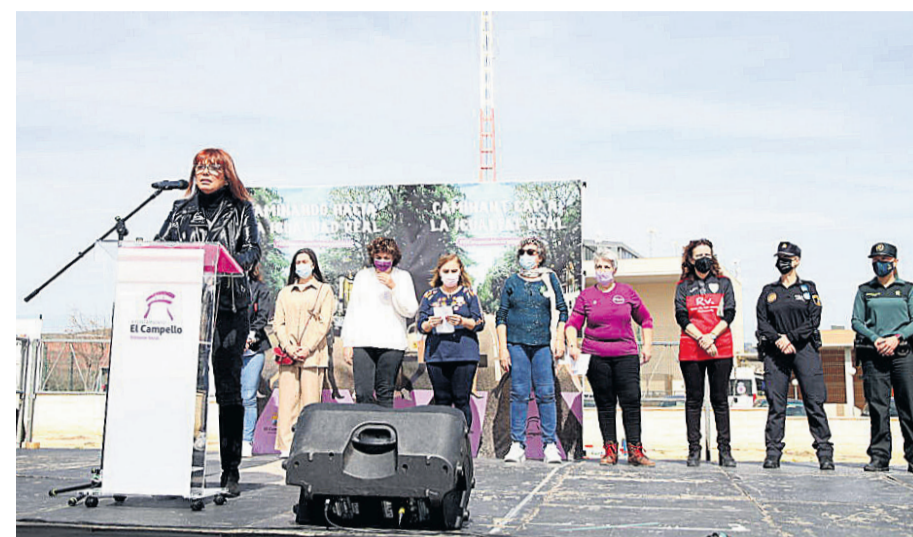
Lectura de manifiesto en la Jornada Familiar