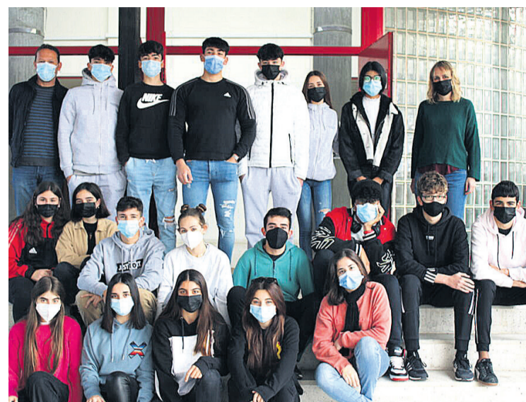
Los alumnos del proyecto en el instituto

Som El Campello ◆El proyecto, bajo la tutela de dos profesores del centro, se inicia desde que nace la asignatura de Proyecto Interdisciplinar en el instituto, eso hace que las asignaturas de música y tecnología comiencen a trabajar juntas. «Decidimos coger el paisaje sonoro como «late motiv» de la asignatura, ya que podríamos tratar desde temas musicales hasta lo más tecnológico» argumenta uno de los