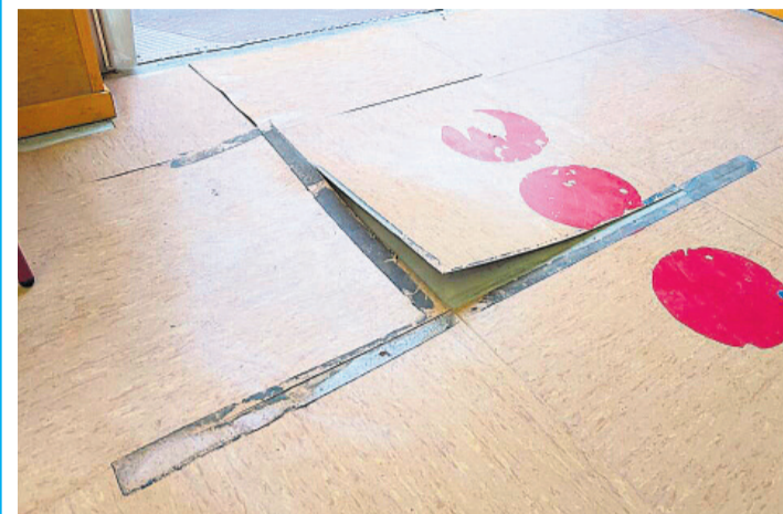
Suelo de una de las aulas del CEIP Pla de Barraques