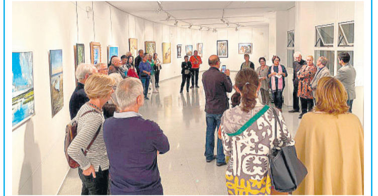
Inauguración de la exposición