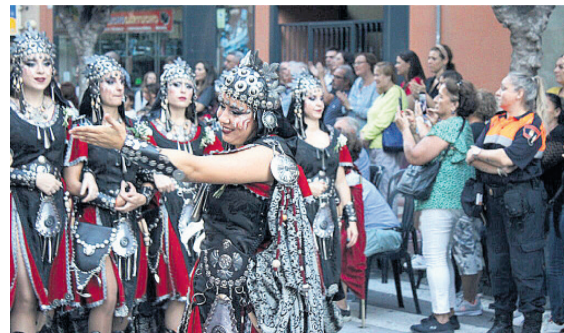
Escuadra cristiana desfilando por El Campello