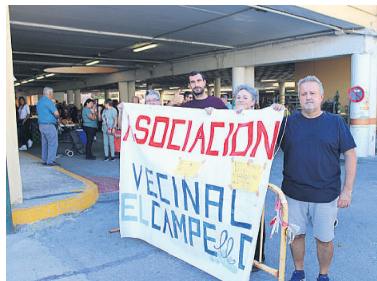
Algunos miembros de la Asociación en el mercado de los miércoles