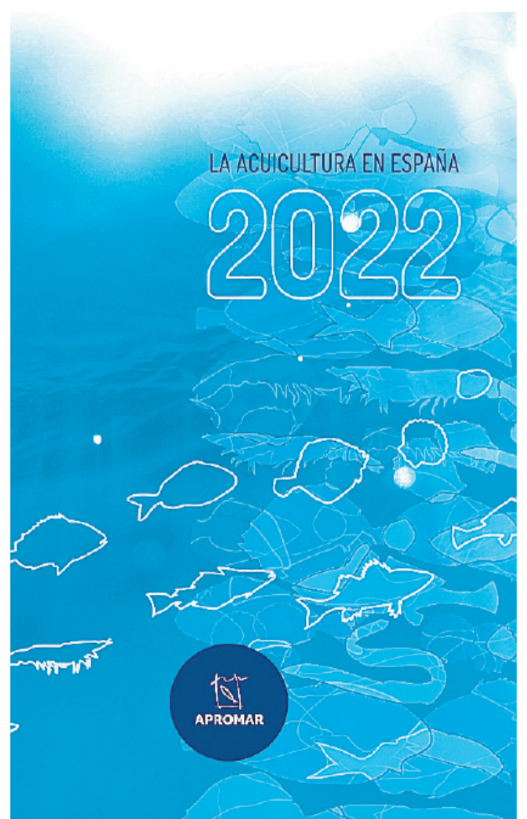
Portada de La Acuicultura en España 2022

Ministerio de Agricultura, Pesca y Alimentación, la Federación Europea de Productores de Acuicultura y la Organización de las Naciones Unidas para la Alimentación y la Agricultura.