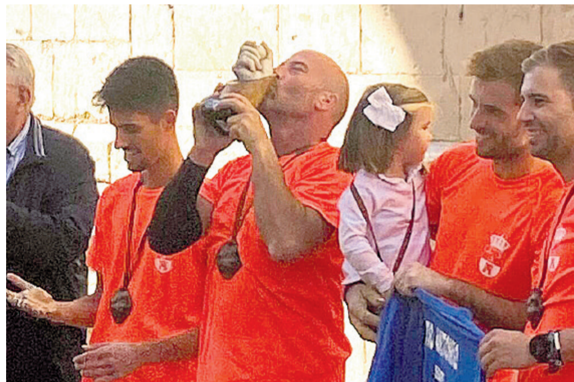
Martines en la Coupe des Champions d'Europe de Llargues