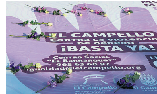
Foto de archivo de una de las marchas realizadas en años anteriores