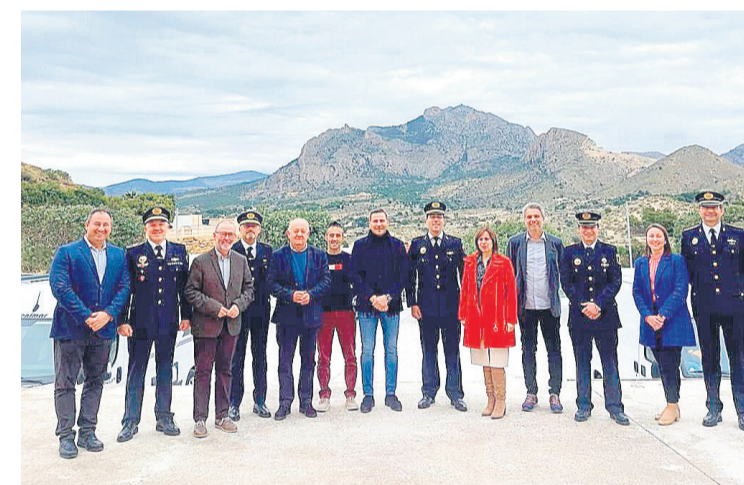
Miembros de los ayuntamiento de la comarca en la reunión para la creación de la comisión