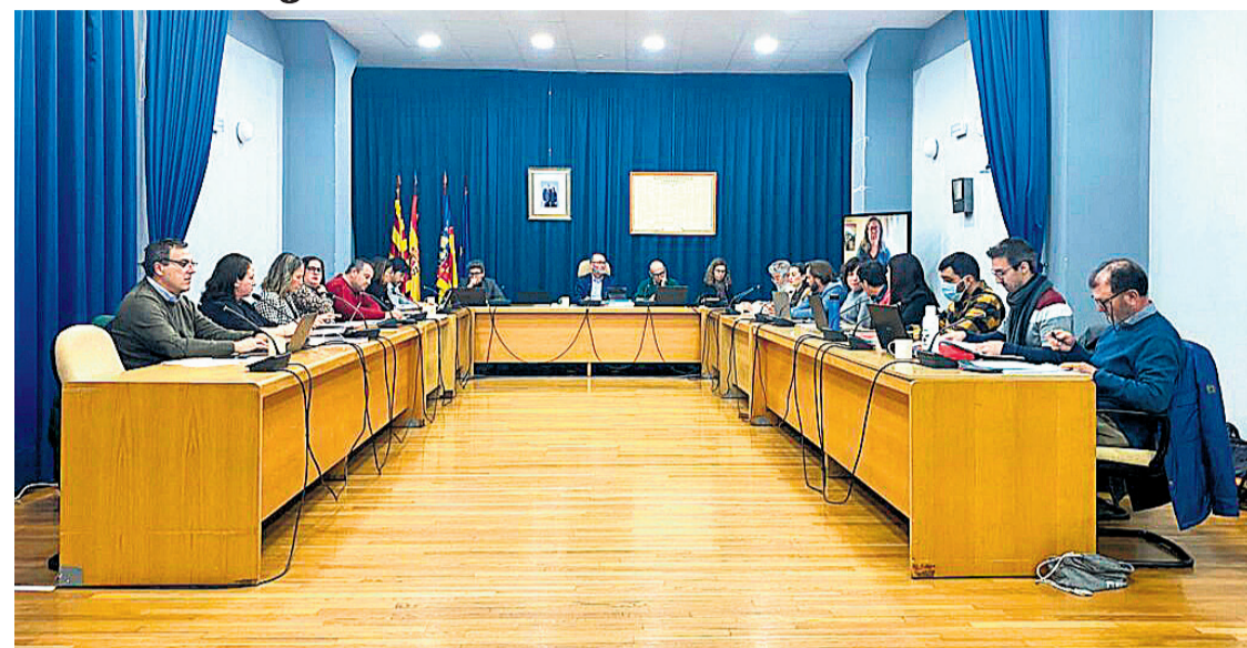
Pleno de El Campello