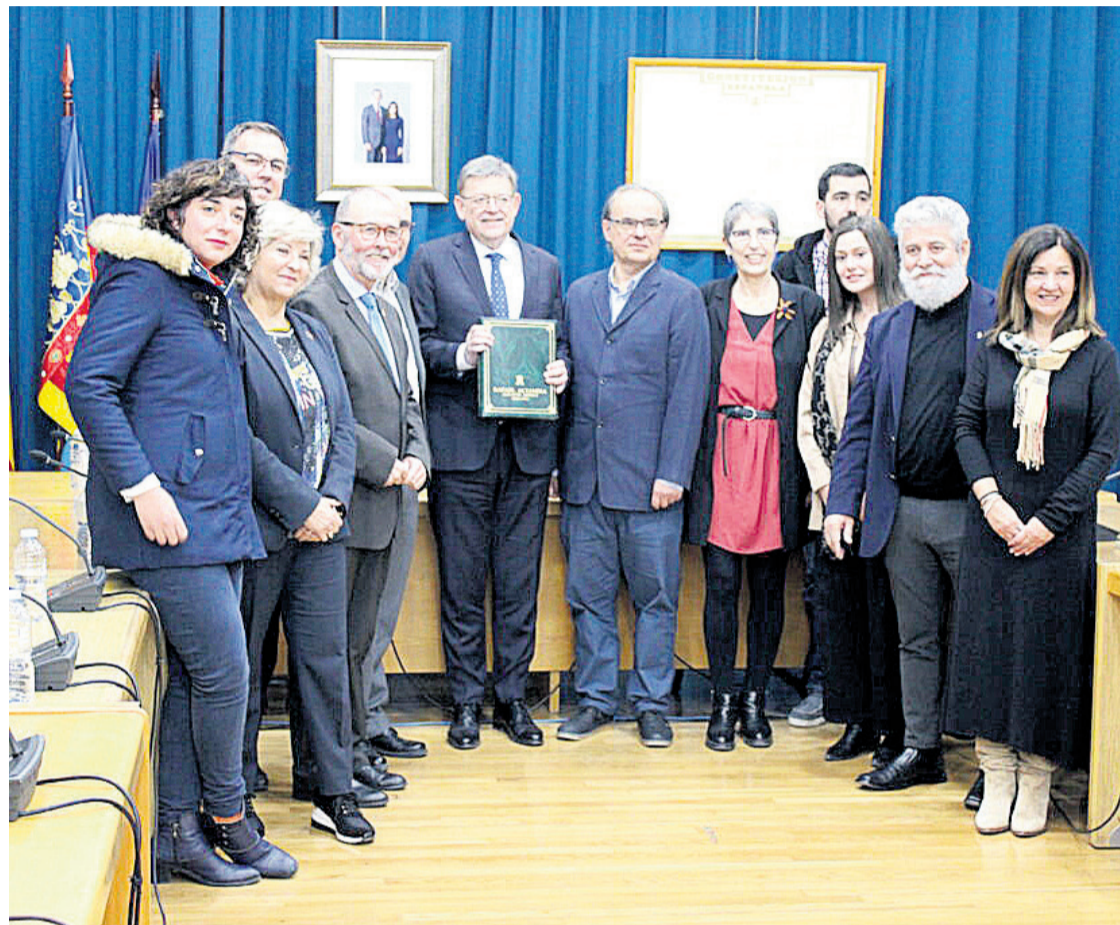
El presidente de la Generalitat Valenciana asistió a la clausura del Consell Valencià de Cultura