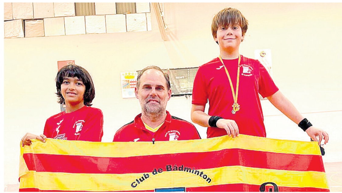
Imagen de equipo del Club de Bádminton

●El sábado se disputó en El Campello un TOP TTR sub13, sub17 y absoluto de bádminton, con participación de jugadores de clubes de la Comunidad Valenciana, Murcia y Castilla La Mancha. Del club de El Campello hubo participantes en las tres categorías.