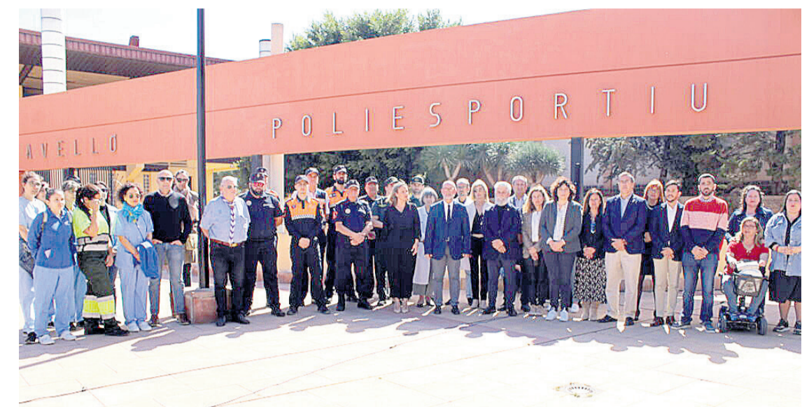
Foto de familia de todos los participantes en el homenaje