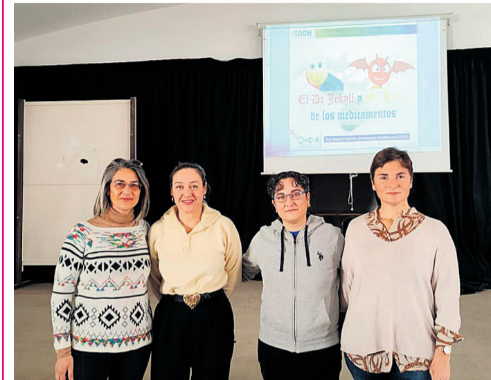
Las dos homenajeadas en su visita al instituto