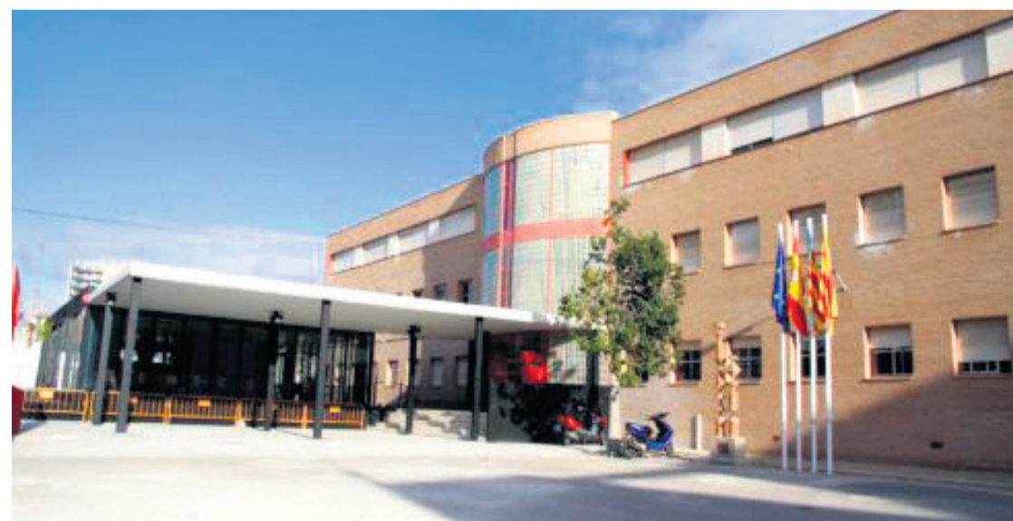
IES Clot de l'Illot

Serán reparadas las pistas de fútbol sala y vóley, con una superficie aproximada de 2.890 metros cuadrados, y serán reformados los aseos de las plantas baja, primera y segunda, tantos los destinados al alumnado como al profesorado, además de los vestuarios. Las obras se aprovecharán para introducir en el complejo aseos adaptados. En lo que a las pistas deporti-