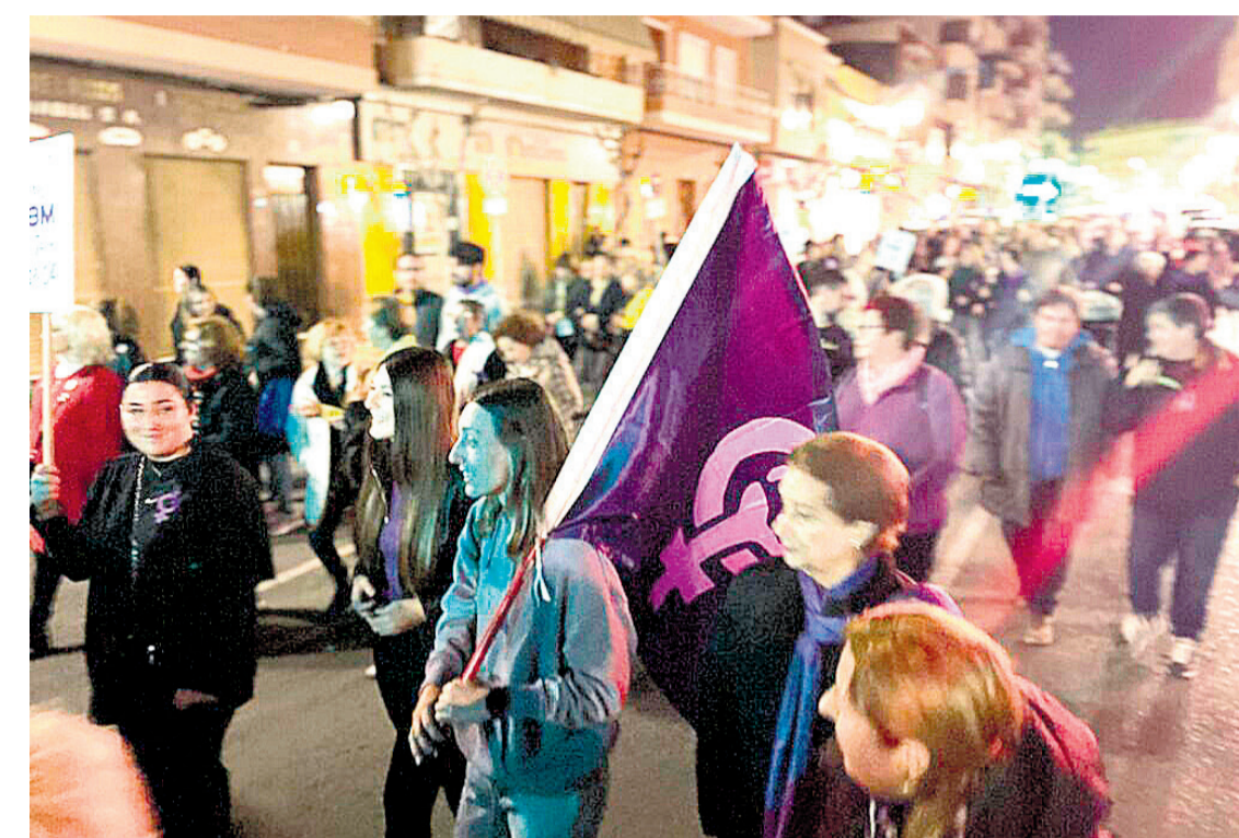
Manifestación del 8M en El Campello