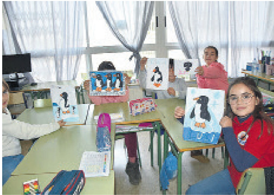
Los alumnos junto a sus dibujos