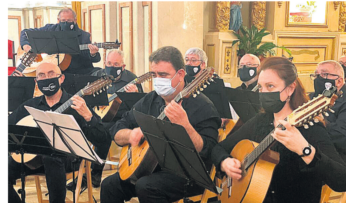
Imagen de archivo de la Batiste Mut