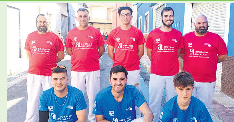
Un dels equips del Club de Pilota Valenciana del Campello