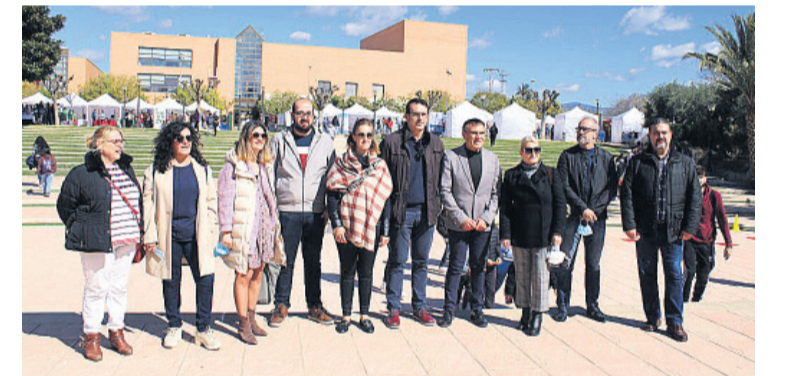
Parte de la corporación municipal en las jornadas

Entre las entidades participantes han acudido a esta jornada las Fuerzas Armadas Españolas, FEMPA, Universidad Miguel Hernández, Esatut Formación e Imp, Escuela Oficial de Idiomas San Vicent-L'Alacantí, CIPFP Valle de Elda, UCAM, Fundación Radio Ecça, Policía Local de Mutxamel, Aircro-Simcrew Training, European Flyers, CI-