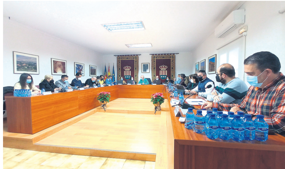
Plano de Mutxamel del pasado 31 de marzo