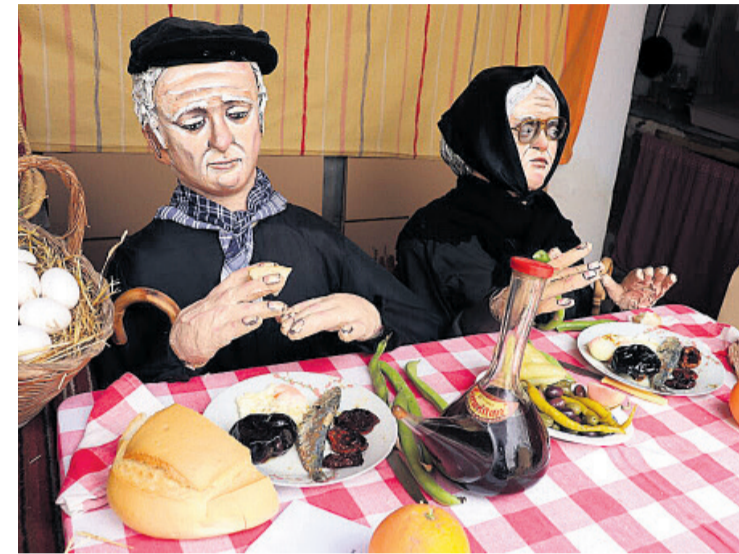
El vell i la vella en Mutxamel