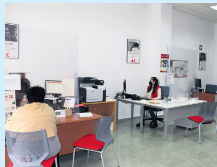
Voluntarios de Cruz Roja en su oficina de Mutxamel

Desde la organización quieren hacer llegar a la población mutxamela que Cruz Roja en Mutxamel si que existe e inciden en que hay carencia de voluntarios y de gente joven que ayude.—