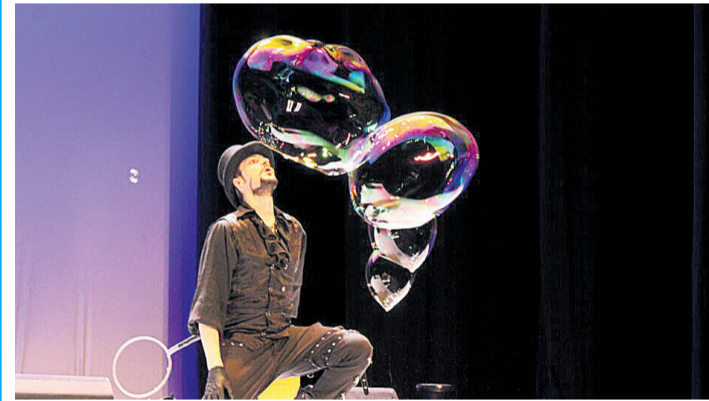
White Dreams en su actuación en la gala