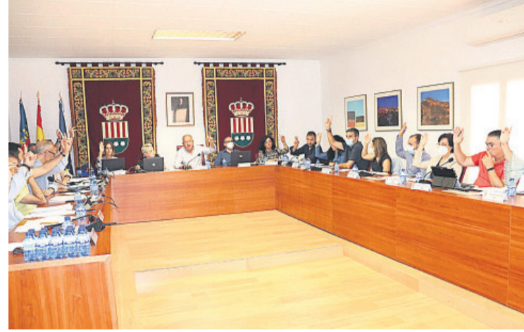
Votación del pleno