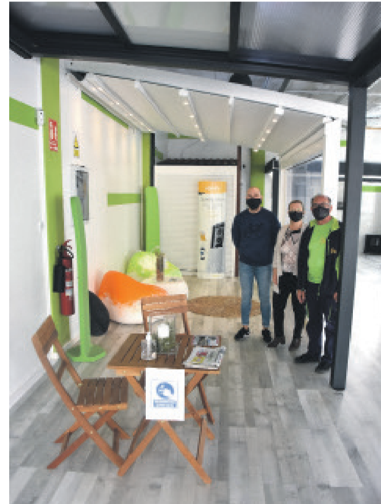
El equipo de Toldos Vicente en la delegación de San Vicente (Foto de 2021)

Confía en ellos para todo tipo de compra, instalación o reparación, especialmente en esta época del año donde es necesario anticipar la llegada de un verano que ya se nos ha echado encima. Mejora tu calidad de vida a la vez que ahorras tiempo, dinero y energía. En Toldos Vicente realizan tus productos a medida, destinados a todo tipo de espacios y estancias.