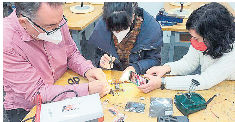
Los profesores del IES L'Allusser formándose