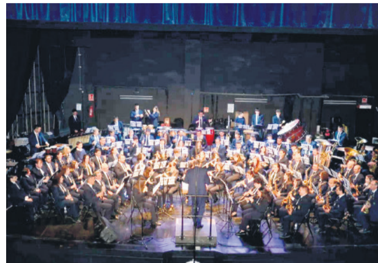
Actuación de la SM L'Aliança de Mutxamel