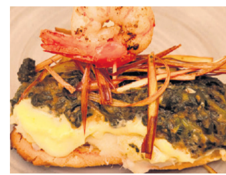
Tapas del Mutxatapa 2023