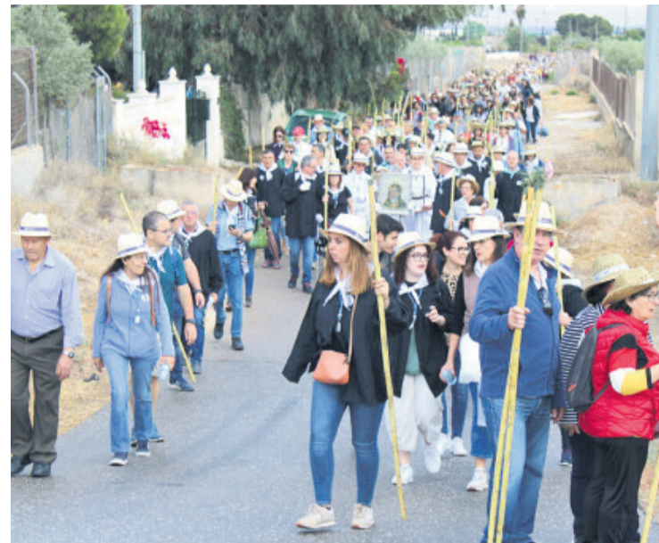
Los vecinos de Mutxamel acompañaron a la Virgen de Loreto al Assut de les Fontetes