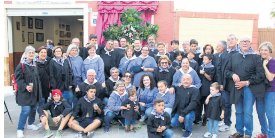
La mayordomía de Sant Antoni junto a la Comisión del Ravalet