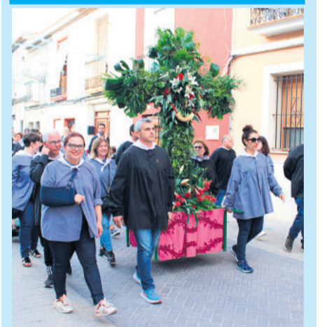
La Vera Creu recorre las calles del Ravalet Pág. 2