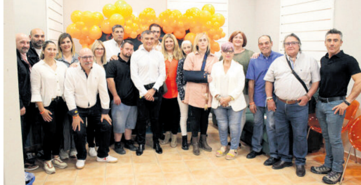
Equipo de Ciudadanos Mutxamel