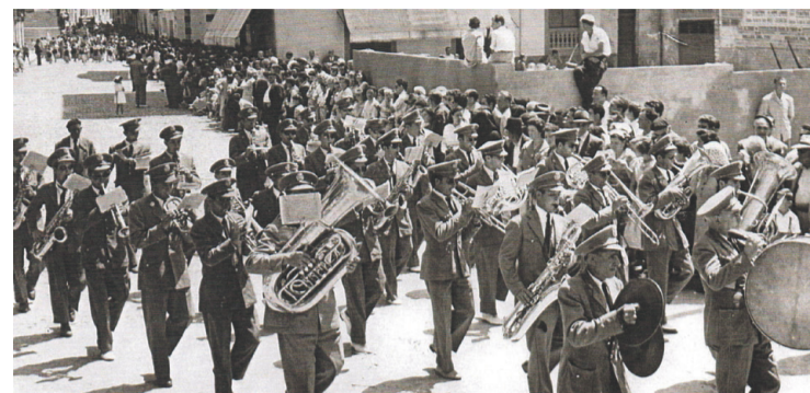
Entrada bandas Sta Maria 22-junio-1956