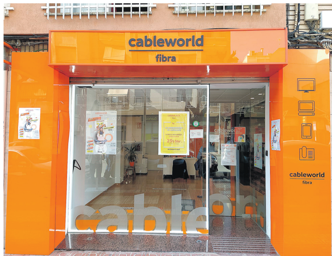
Oficina de atención al cliente en Mutxamel

◆ ¿Qué es cableworld? Cableworld es un grupo empresarial de la provincia de Alicante, un grupo familiar, que lleva más de 30 años operando en el sector. Fuimos los pioneros en España en cablear ciudades enteras con fibra óptica en el año 2012. Tenemos casi 500 empleados, más de la mitad de ellos son técnicos e ingenieros, por lo que estamos muy profesionalizados, pero al mismo tiempo ofrecemos la cercanía que nuestros clientes tanto valoran con respecto a los operadores nacionales.