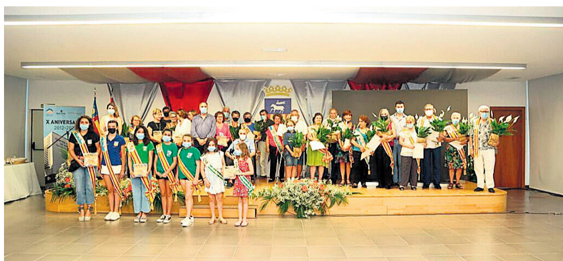
Imagen de grupo de todos los asistentes