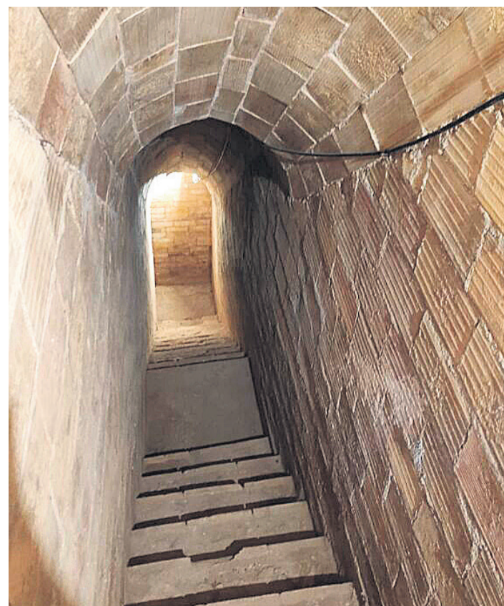
Entrada al refugio

Según las fuentes consultadas, dentro de las distintas tipologías constructivas existentes en refugios antiaéreos, estaríamos ante un refugio de Tipo 2, ejecutado en terreno arcilloso y que debido a su resistencia hace innecesaria la presencia de muros de contención. Las galerías están revestidas por una hilada de ladrillo de 7 cm y el techo se encuentra abovedado propiciando de esta forma el "efecto arco".