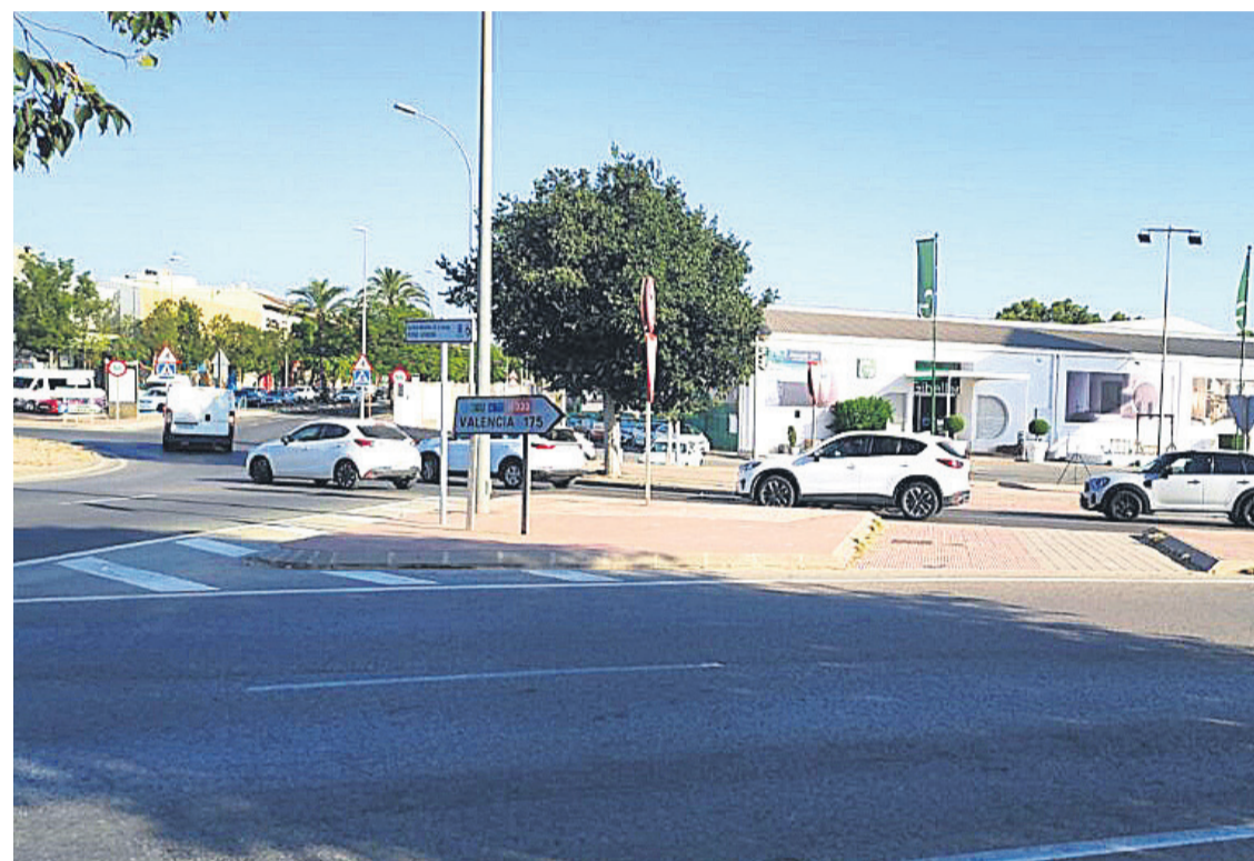
Una de las mejoras en la llegada al Hospital de Sant Joan