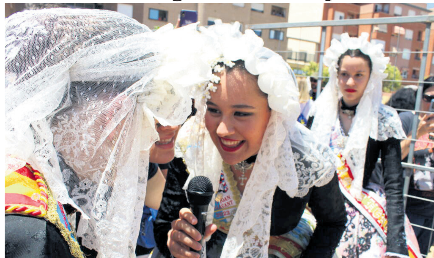
Las Bellezas del Fuego en la primera mascletà

● Muchos eran los actos a los que estás pasadas hogueras han tenido que asistir los amantes de la fiesta. Los más esperados, las mascletàs y la Cremà.