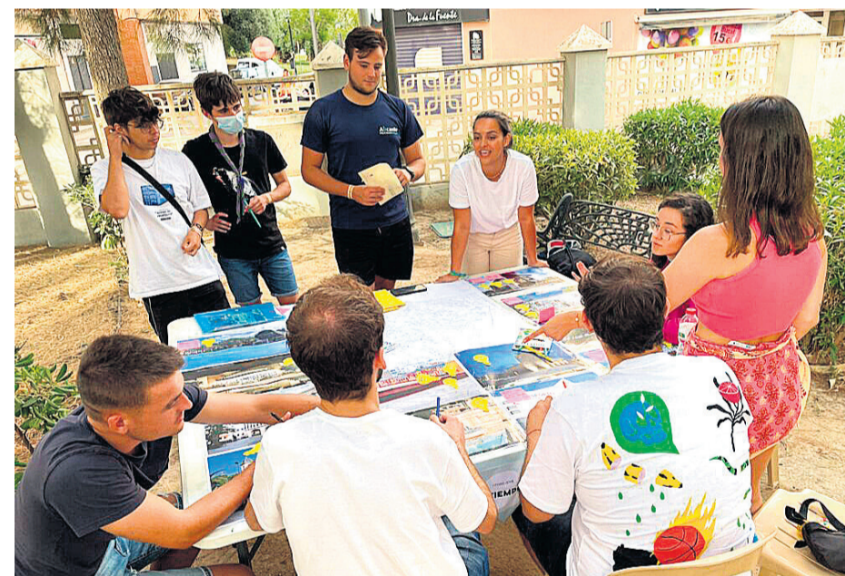
Algunos de los asistentes al Foro Jove