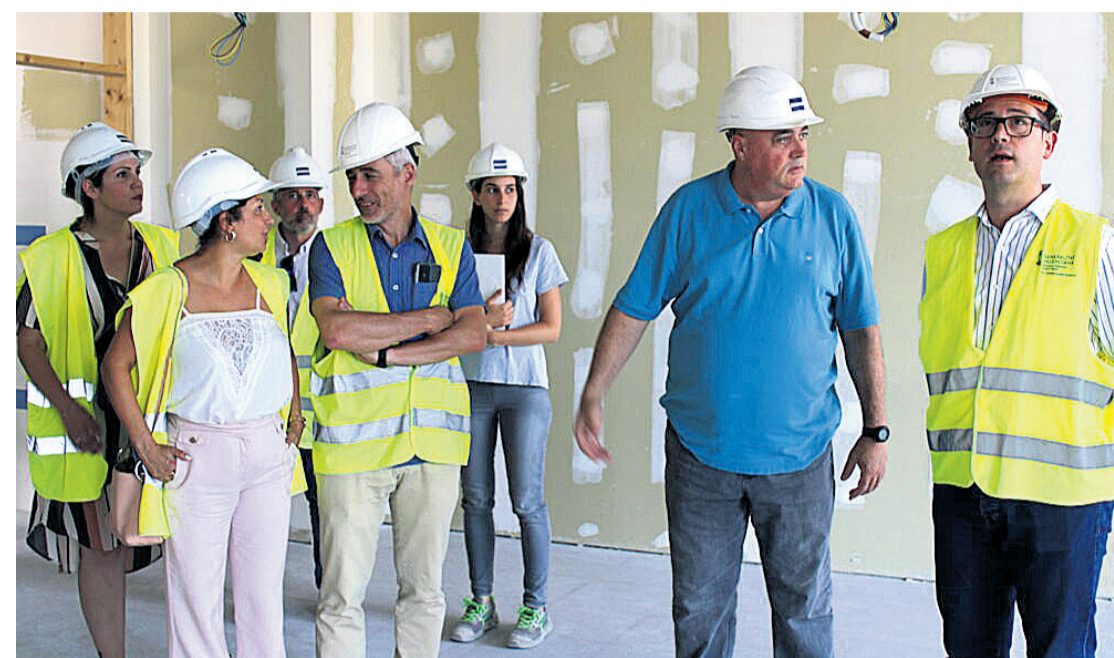
Victor Garcia, Director General de Infraestructuras Educativas de la Generalitat supervisando la obra junto a miembros de la corporación municipal