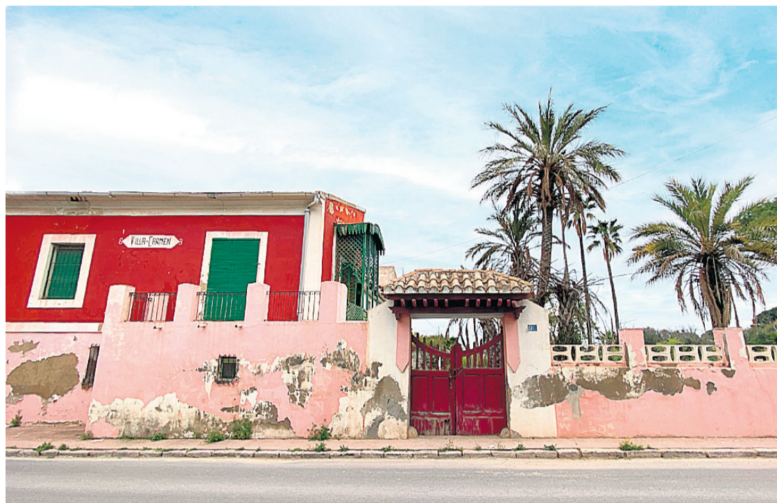
Villa Carmen.