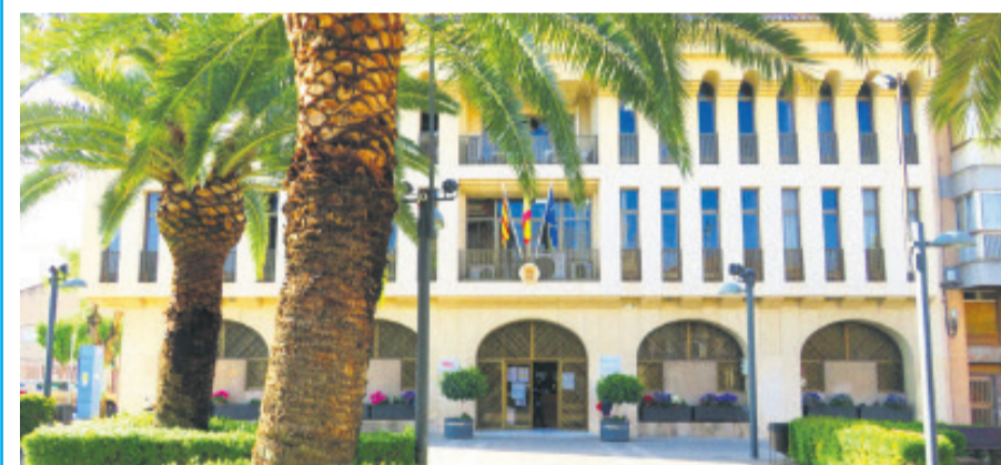
Imagen del ayuntamiento de Sant Joan