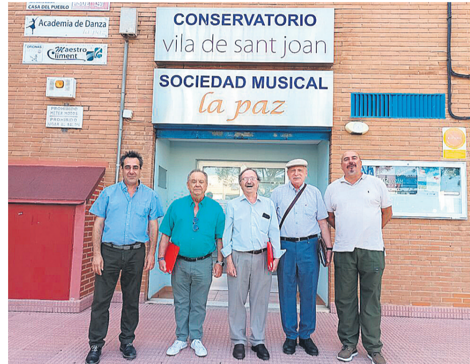
Jurado de certamen