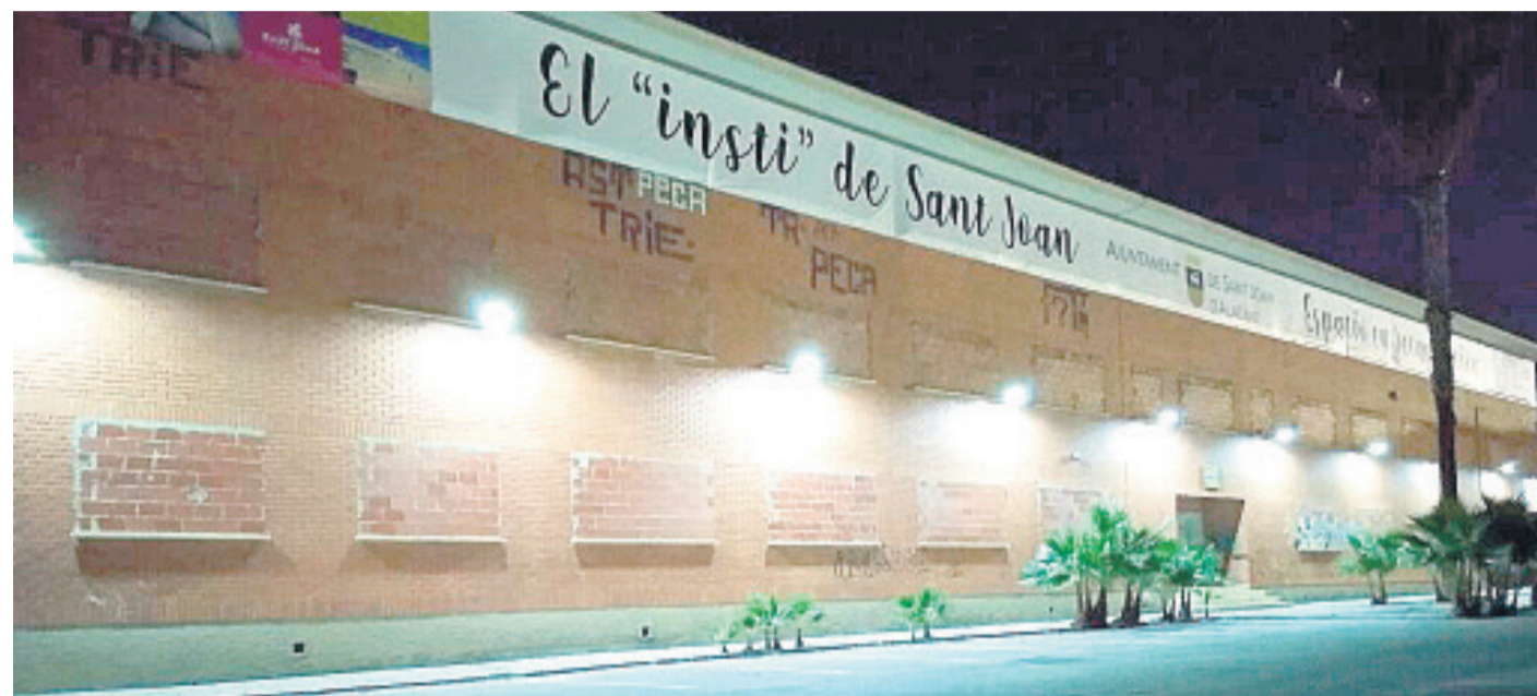
Antiguo Instituto Lloixa

●La Fàbrica de Formació, Art i Música (FFAM) es el proyecto creativo y de formación que desde Urbanismo, Cultura y Educación quieren trasladar al Consejo Social para implantar en el Antiguo Lloixa.