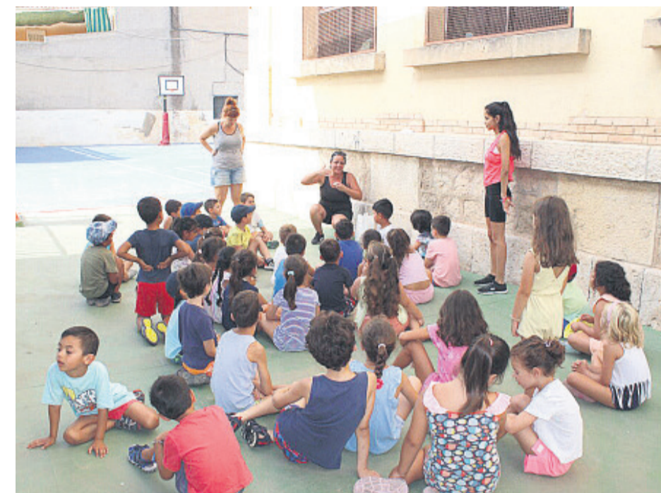
Los niños en la Escuela de Verano

Y completando la oferta estival, como todos los años, desde las ampas de los centros educativos del municipio en el CEIP Lo Romero, los superhéroes y súperheroínas, la semana verde, el circo y la educación vial será la programación que tendrán ocupado al alumnado que disfrutará de la escuela en este centro.