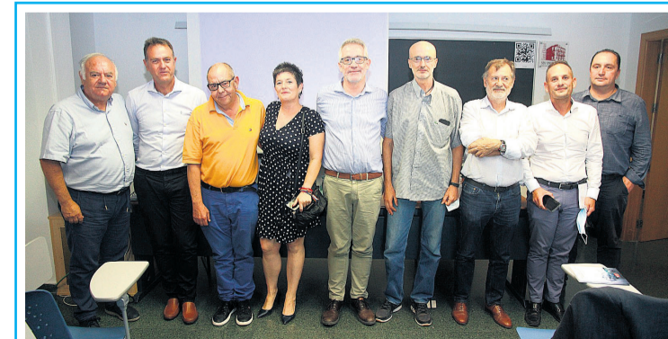
Los ponentes de la jornada sobre FP del PSPV-PSOE

Esta transformación está generando innovación y una alta cualificación de las personas que cursan estos estudios. También se usó sobre la mesa la colaboración de las prácticas en empresas, que han sido determinantes para que los estudiantes consigan un alto grado de conocimiento en todas las especialidades, teniendo opción, posteriormente, a integrarse en el mercado laboral y a los nuevos puestos de trabajo que se van generando de acuerdo con las necesidades de nuestra sociedad.