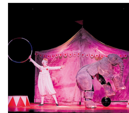
Una de las actuaciones de Petit Teatre