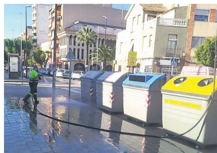
Operario en labores de limpieza

El nuevo contrato del servicio de Limpieza Viaria y Recogida de Residuos tendrá una duración de 8 años y su presupuesto de licitación supondrá el doble del actual contrato.