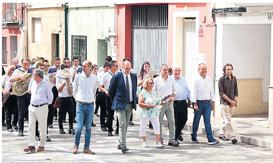
Miembros de la corporación municipal en la ofrenda