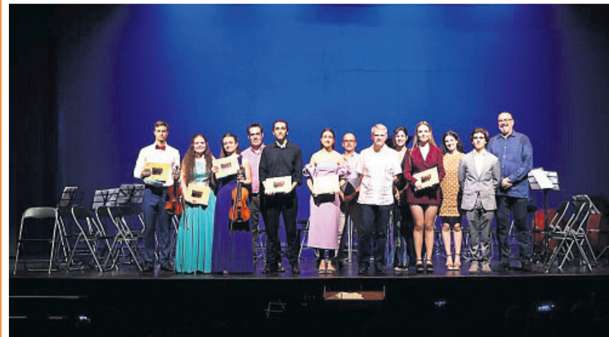
Foto de familia de los graduados