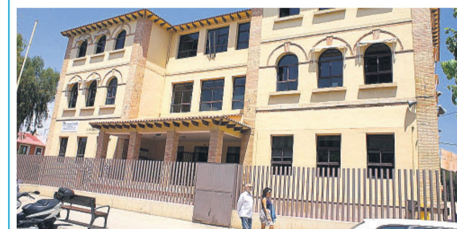
Colegio Cristo de la Paz