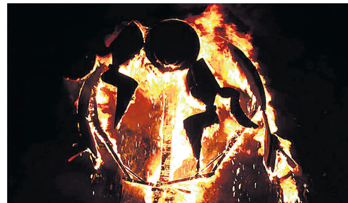
Momento de la quema de una de las hogueras

La cremà fue donde Sant Joan vivió uno de los días más especiales en los últimos dos años. La fiesta, el fuego y la pólvora hicieron acto de presencia en la cremà de las Hogueras.