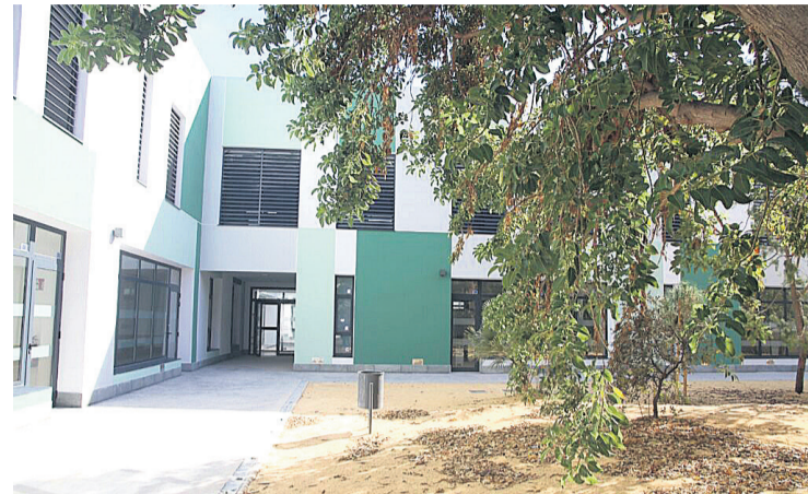
Colegio Lo Romero, fruto del Plan Edificant