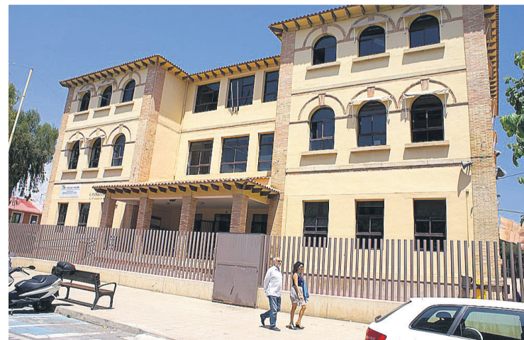
Fachada del CEIP Cristo de la Paz