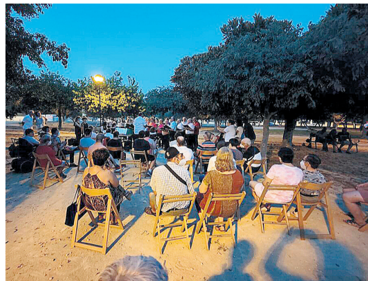
Uno de los 241 actos de este pasado 2022 de La Paz