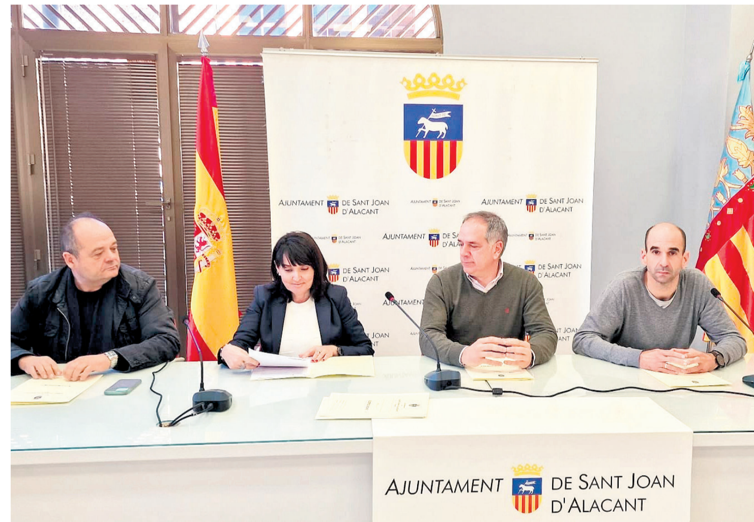
Los concejales de Ciudadanos de Sant Joan d'Alacant

El 2022 ha sido el año en el que se han celebrado eventos y fiestas en las calles tal y como los hemos conocido en época prepandémica ¿Cómo ha influido esto en el municipio de Sant Joan? Sí, el 2022 ha sido un año de cierta normalidad en todos los aspectos, en actos, eventos y en el trabajo cotidiano. Los dos primeros años de legislatura fueron más atípicos porque los propios plenos y acuerdos más importantes tenían que realizarse por videoconferencia y sin poder contar prácticamente con los compañeros y los técnicos municipales. Durante esos años contamos con el apoyo de instituciones como la Diputación Provincial y, afortunadamente en la actualidad seguimos contando con su ayuda. Sin ir más lejos esta Navidad hemos tenido la tercera campaña de bonos al consumo a iniciativa de la Diputación Provincial en la que se aportaron 129.000€ y fue todo un éxito.