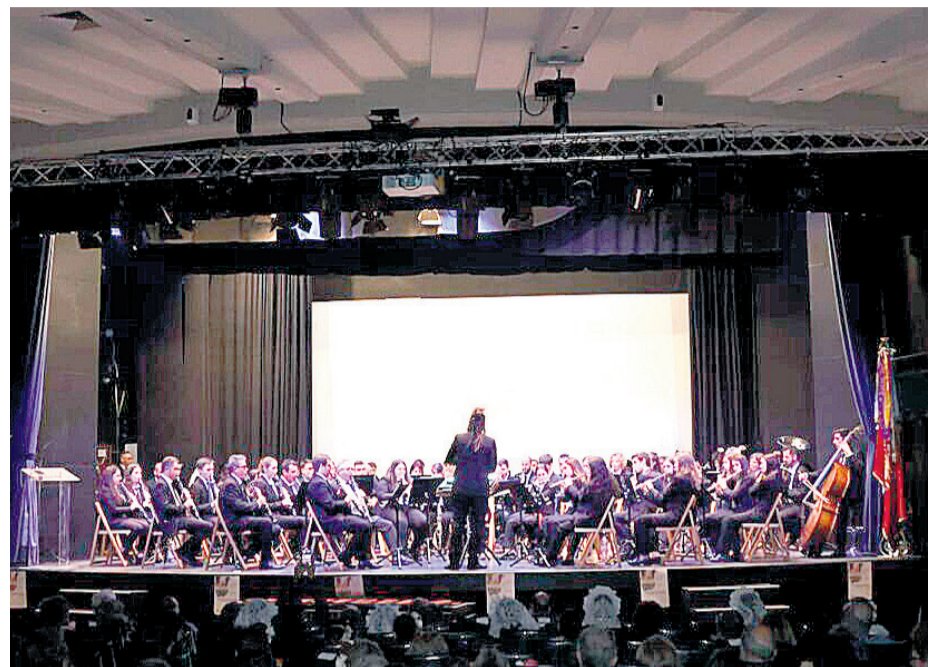
La Paz en uno de sus conciertos