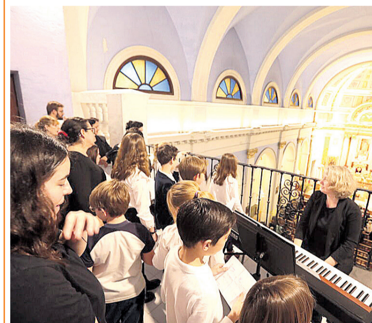
Integrantes de la SM La Paz en las XL horas de San Gregorio