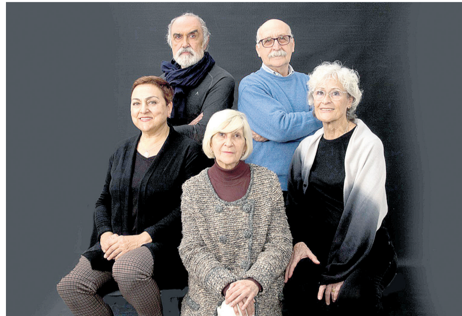
Elenco de la obra “Terapia Emocional”