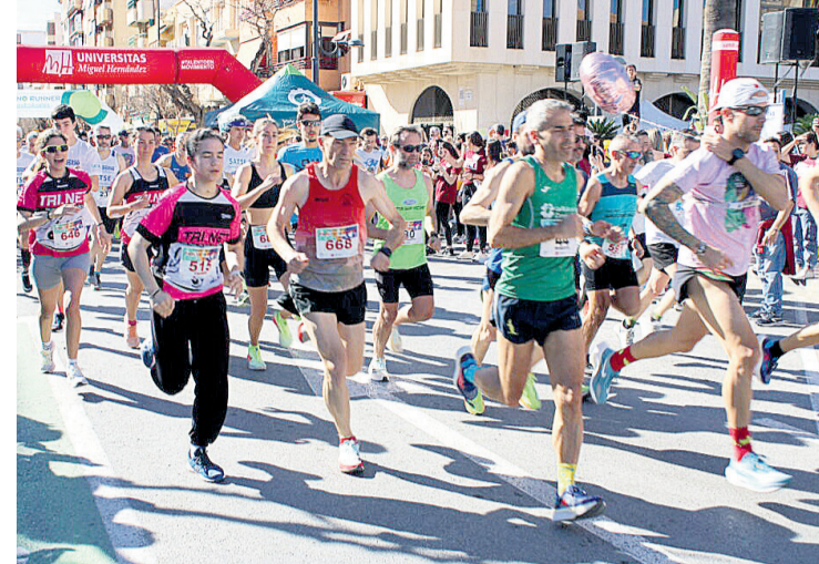
Momento de la salida