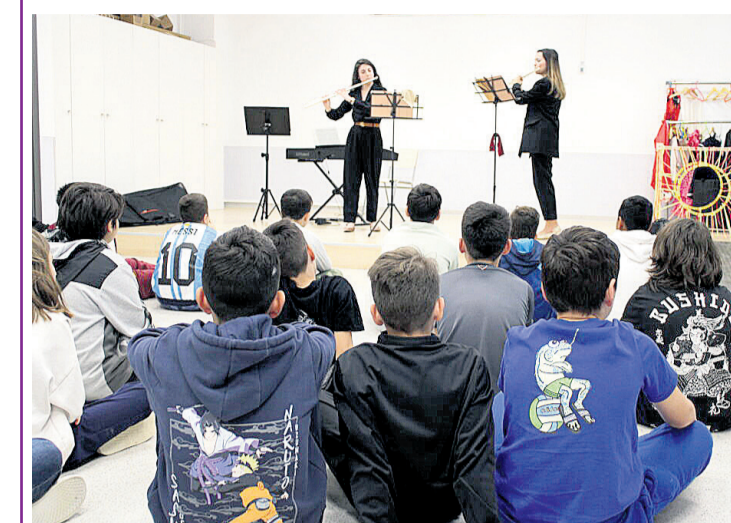
Dos integrantes de la SM La Paz en una de sus actuaciones en el colegio Lo Romero