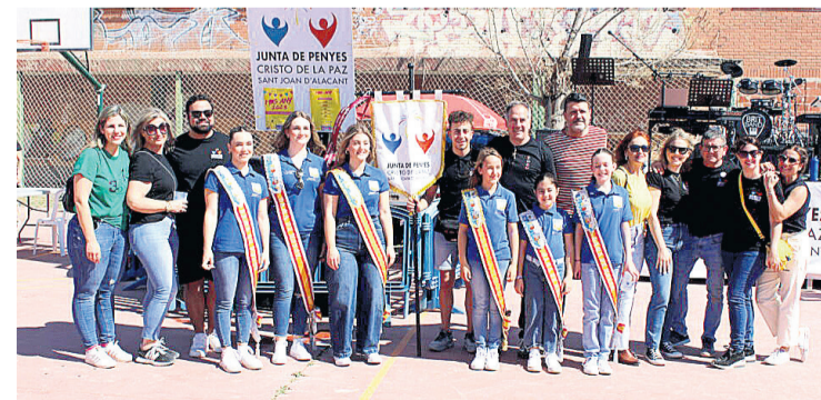
Las reinas de las fiestas junto a parte de la corporación municipal y parte de la Junta de Peñas