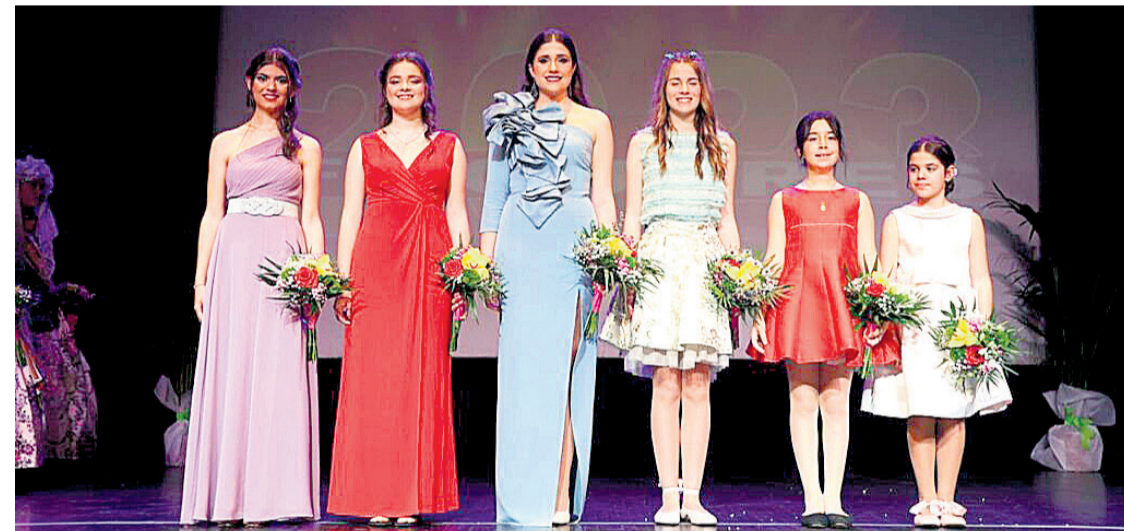
Las nuevas Bellezas sobre el escenario