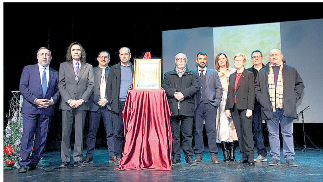
Personalidades de la Semana Santa de Sant Joan en la presentación del cuadro