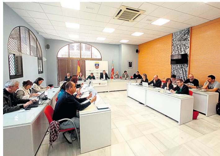
Pleno de Sant Joan