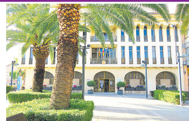
Fachada del ayuntamiento de Sant Joan

Para VOX Sant Joan, este tipo de planes suponían una discriminación y un menosprecio a la figura de la mujer dado que la colocaban de facto como un ser débil e inca-