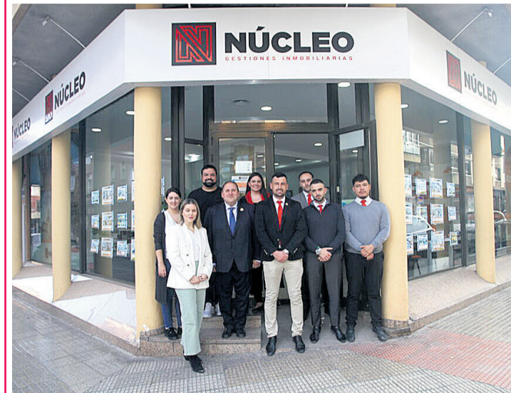
El equipo de Núcleo junto al presidente de la Junta de Peñas