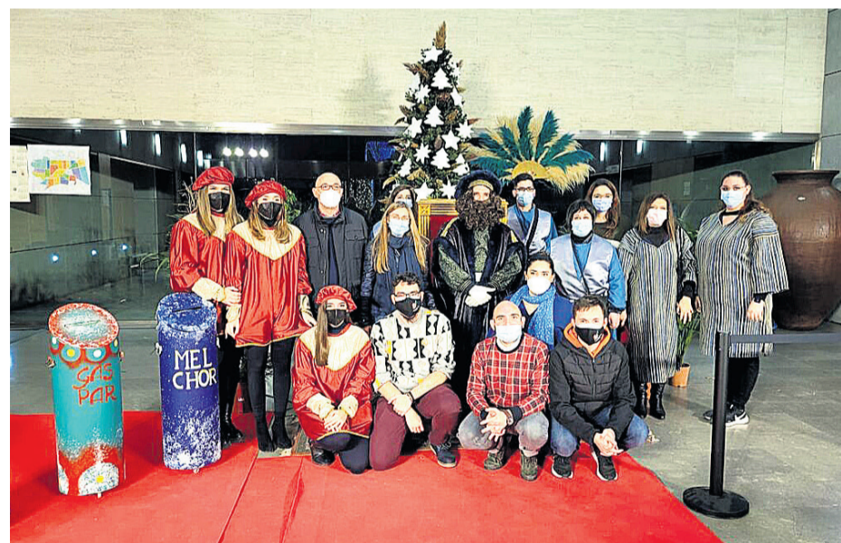
Llegada del cartero Real el 4 de enero