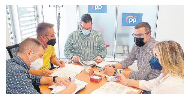
Grupo municipal del PP