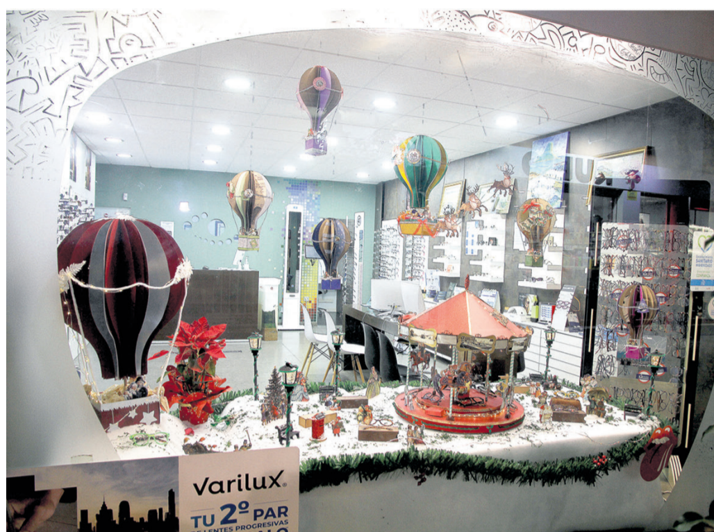
Veróptica Barberá, segundo premio de la modalidad de comercios y servicios

◆ El segundo premio de la modalidad de comercios y servicios ha ido a parar a Veróptica Barberá, en Manuel de Falla 8; y el tercero al establecimiento Aptitude&Attitude, en Sevilla, 6. En la modalidad de hostelería, el segundo galardón lo ha obtenido Heladería Bellagio, la calle Villafranqueza, 16; y el tercero ha sido para