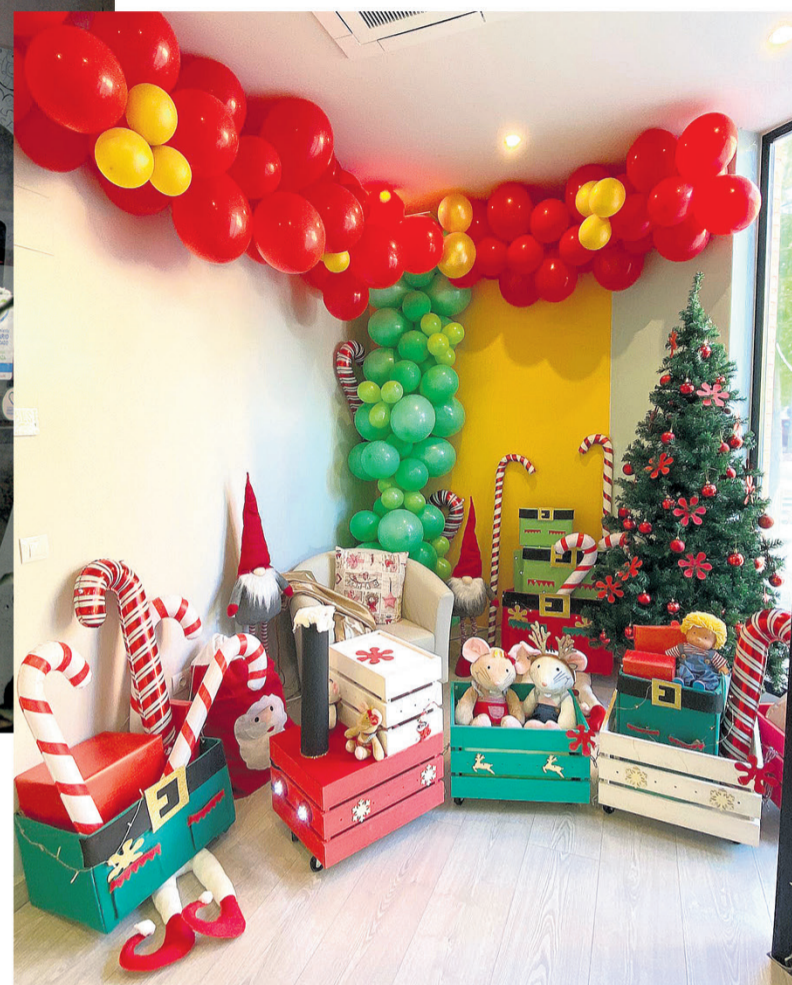
Kids&Us, tercer premio de la modalidad de comercios y servicios