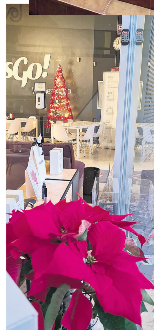
SGO Health & Spa