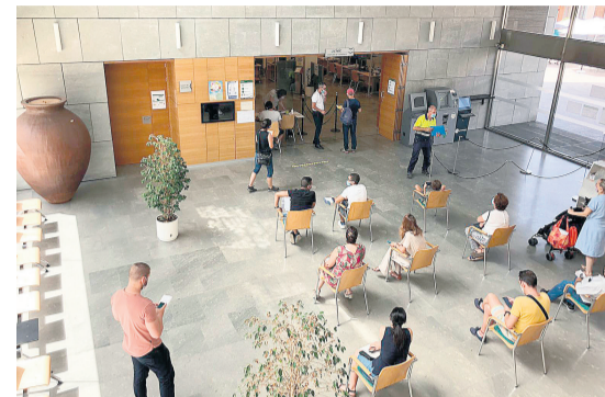
La Oficina de Atención al Ciudadano (CIVIC) ha incorporado a cuatro personas