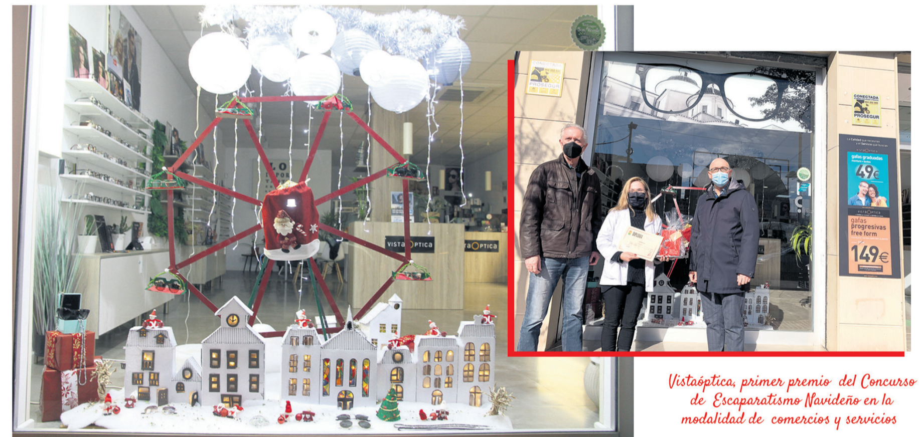
Vistaóptica, primer premio del Concurso de Escaparatismo Navideño en la modalidad de comercios y servicios