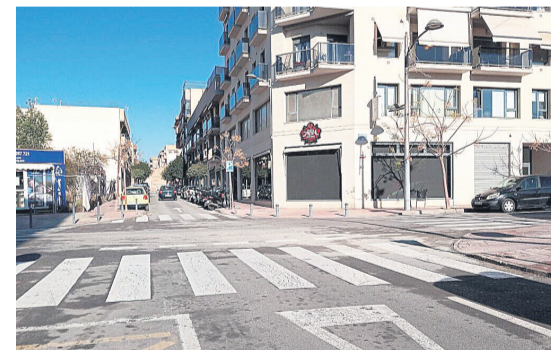
El proceso de licitación del contrato para el reasfaltado de las calles municipales continúa su curso