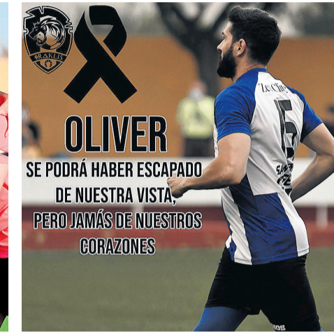
Perejo, un gran referente del Iraklis ha sufrido una trágica pérdida