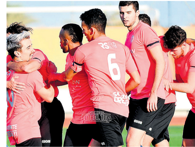
Buen partido del conjunto sanvicentero pese a no sumar la victoria