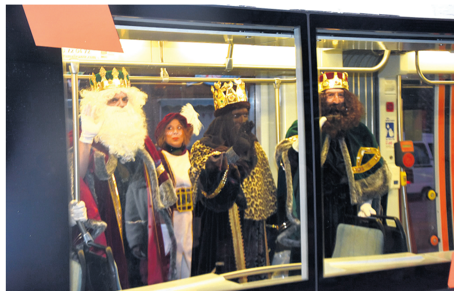
Los magos de oriente hicieron su aparición en TRAM

Un día antes había hecho aparición el cartero real. Ilusión, nervios y sobre todo mucha alegría. Tanto pequeños como adultos entregaron en la tarde del martes 4 de enero sus peticiones para los Reyes Magos. A lomos de un carruaje el emisario de oriente llegó a la plaza del Ayuntamiento acompañado de diferentes grupos de danza y música. Allí el Cartero recibió personalmente las cartas de la ciudadanía.