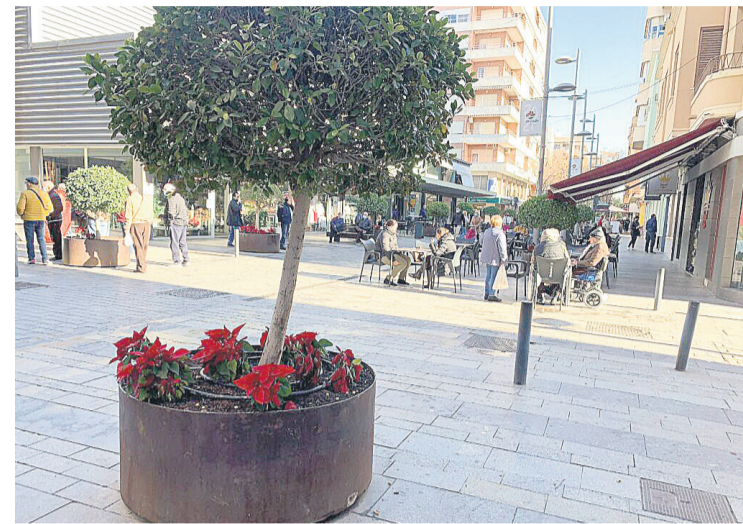
Foto de archivo de una terraza de San Vicente