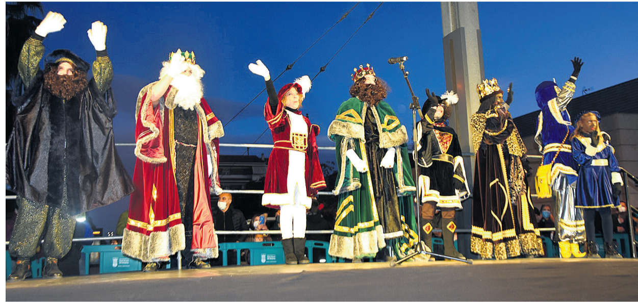
Gran expectación por una cabalgata que cambió de recorrido

● San Vicente del Raspeig acogió la tradicional Cabalgata de los Reyes Magos, en la que Melchor, Gaspar y Baltasar recorrieron las principales calles del municipio acompañados por numerosas carrozas, grupos de animación y pastores. Sus Majestades hicieron su aparición en Tram en la calle Alicante y a continuación iniciaron un recorrido que finalizó en la Plaza de España con la entrega de regalos a los más pequeños.