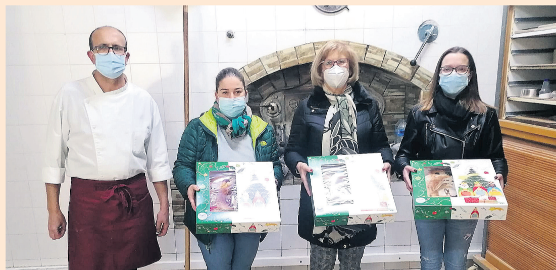
Imagen de la entrega de roscones el 5 de enero