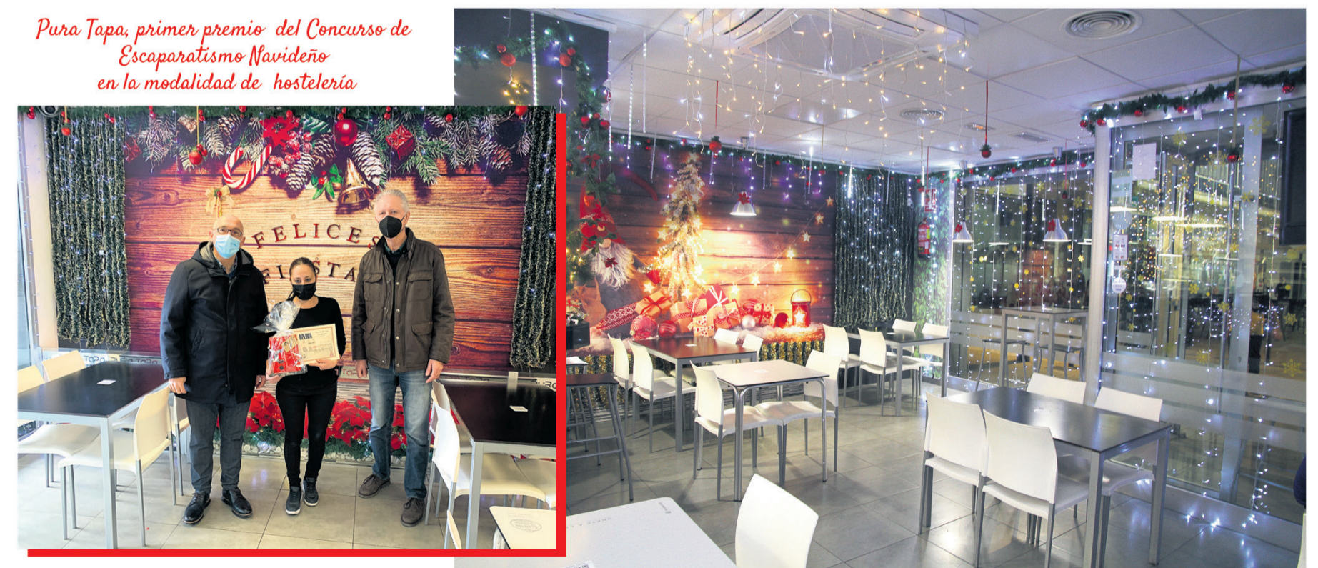
Pura Tapa, primer premio del Concurso de Escaparatismo Navideño en la modalidad de hostelería