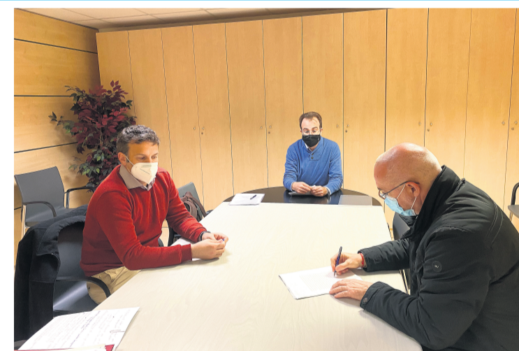
Firma ante notario del documento de la permuta

La valoración económica de la permuta es de 2.437.591€, valor de la reserva de aprovechamiento establecida en su día por el convenio de 2005 con el IVVSA, actual EVHA, para completar el valor de la parcela de su propiedad. Con esta adquisición, el Ayuntamiento estudiará y valorará nuevos proyectos para desarrollar y llevar a cabo en los terrenos de 'La Yesera'.