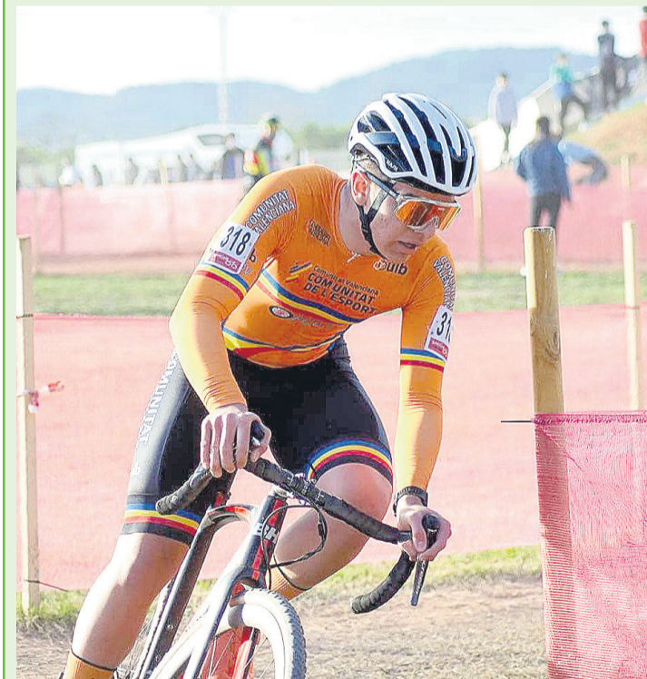
El club ciclista San Vicente inicia el año con buenos resultados