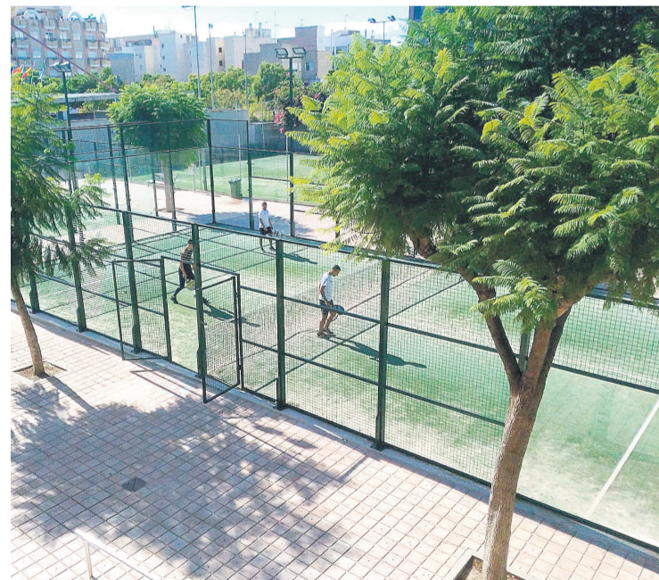
Las empresas dispondrán de un plazo hasta el 31 de enero de 2022 para presentar su candidatura