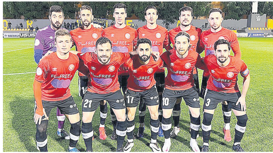
Imagen del partido ante el Orihuela