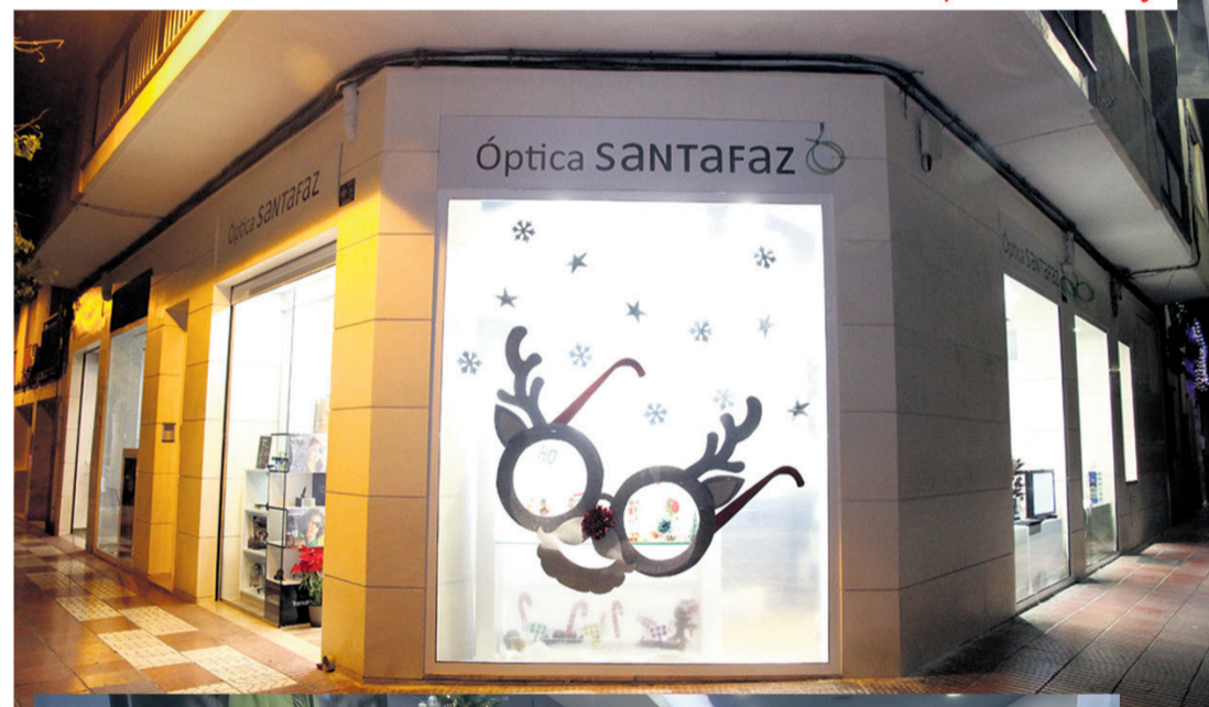
Óptica Santa Faz

◆ La Concejalía ha subido en esta edición la cuantía de los premios. En cada una de las modalidades, el primer premio está dotado con 600 euros, el segundo con 400 y el tercero con 250 euros.