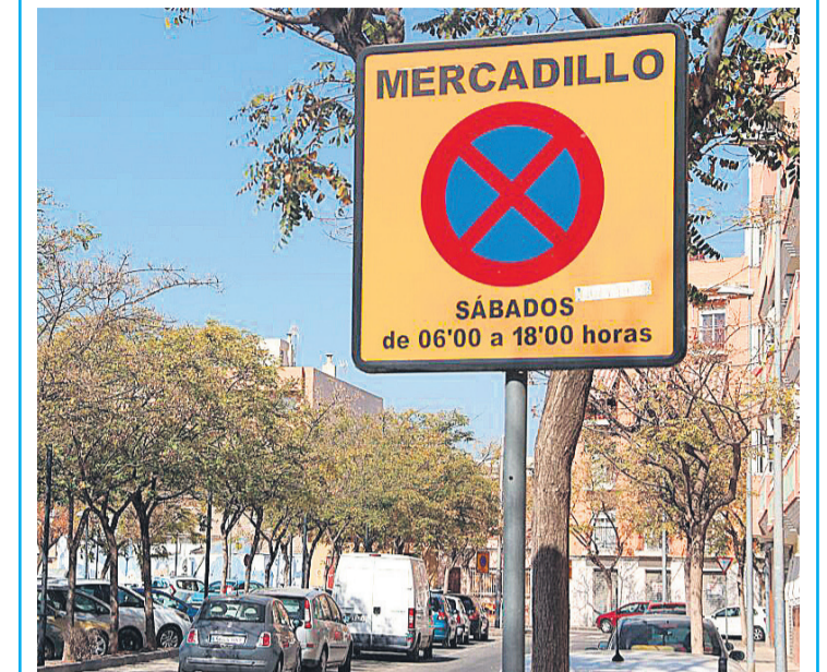
El pasado 8 de enero de 2022, el mercado semanal de los sábados volvió a su emplazamiento original