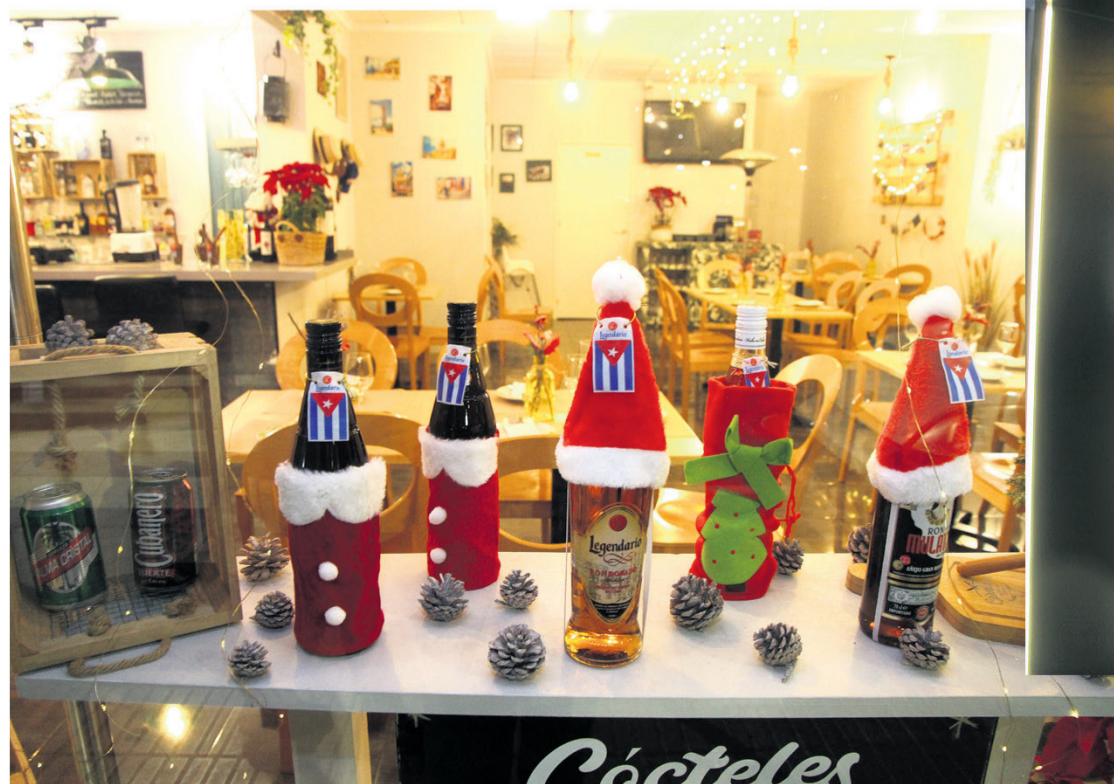
Cafesón, tercer premio de la modalidad de hostelería y premio de redes sociales