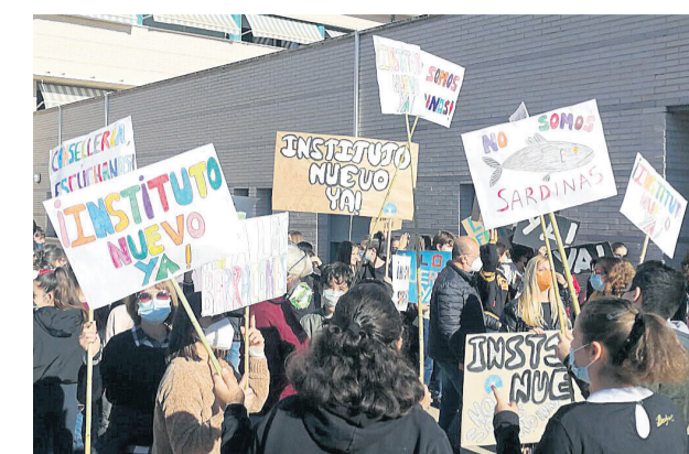
Imagen de archivo de las reivindicaciones en el IES Gaia