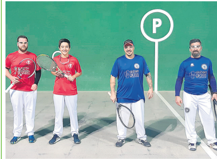
Inmejorable inicio de 2022 para nuestro frontenis