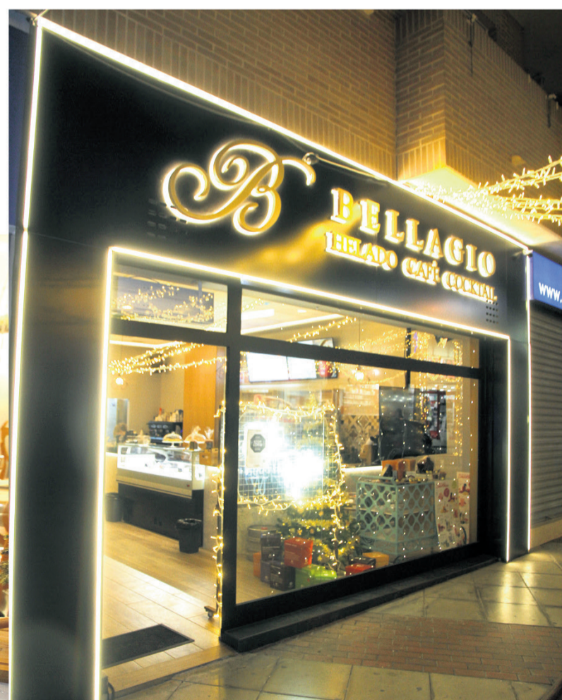
Heladería Bellagio, segundo premio de la modalidad de hostelería