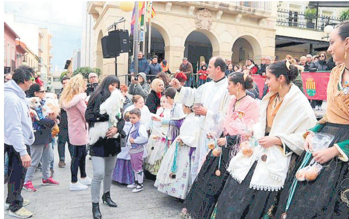
Imagen de años anteriores

Existen numerosas leyendas y relatos alrededor de San Antonio Abad, conocido popularmente como San Antón. Fue un monje cristiano, nacido hacia el año 250 d.C. en Egipto, en la orilla izquierda del Nilo. Se le atribuyen multitud de prodigios y curaciones