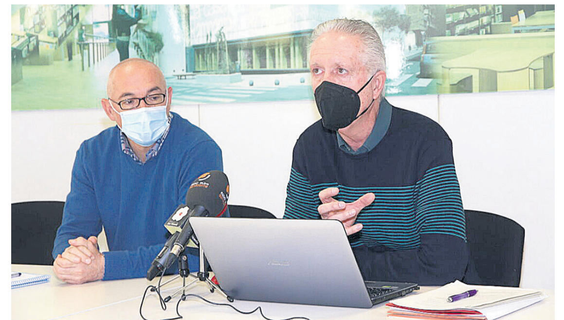
El edil de Hacienda y el alcalde presentaron las cuentas en rueda de prensa

materialización de la futura construcción del albergue de animales, etc..".