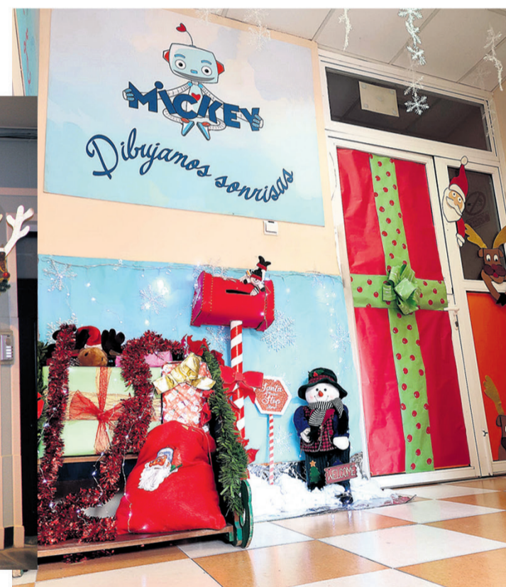
Centro de educación Infantil Mickey