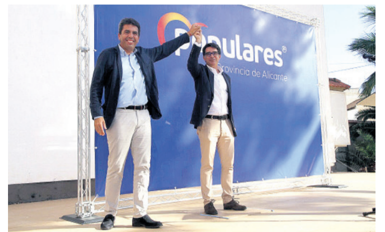
Imagen de la visita de Mazón a nuestro municipio

Por su parte Carlos Mazón definió la candidatura de Pachi como la candidatura de la unión, de la suma y de los brazos abiertos. «San Vicente es un municipio que ha dejado de brillar y que ha renunciado por culpa de su Ayuntamiento gobernado por el PSOE a ganar el futuro. No hay nuevas infraestructuras sanitarias ni educativas y que sigue durmiendo el sueño de los justos ese gran proyecto que es el auditorio y que nosotros nos comprometemos a desarrollar con seriedad. Ahora el Ayuntamiento está absolutamente dividido y desde luego lo que nosotros no vamos a ofrecer a San Vicente son concejales que se espían entre ellos, ni desidia ni brazos caídos». Mazón hizo un llamamiento a la unión del bloque de centro-derecha para recuperar la alcaldía en San Vicente. «Lo importante es que todos nos juntemos en este gran pro-