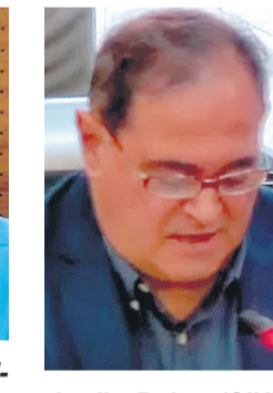
Jordi Roig (CIUDADANOS): “son unos presupuestos limitados en sus objetivos y poco ambiciosos”