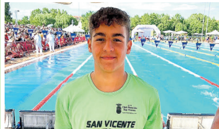
El club Natación San Vicente tuvo una nutrida representación en el Trofeo 226 celebrado en la piscina Olímpica de Castellón