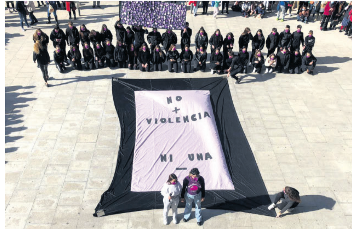
Hoy se conmemora el día internacional contra la Violencia de Género

● Bajo el lema “Nos queremos vivas, libres y sin miedo”, el Departamento de Integración e Igualdad de la Concejalía de Bienestar Social, cierra la campaña de “Prevención y detección precoz de las violencias machistas”, con los actos convocados con motivo del 25N, Día Internacional contra la Violencia de Género.