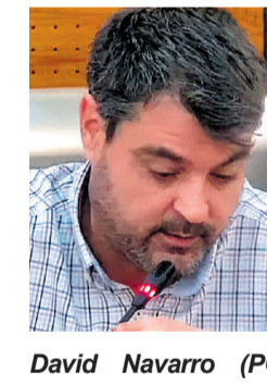
David Navarro (PODEMOS): “Aprobamos unos presupuestos realistas, transversales, equilibrados y responsables”