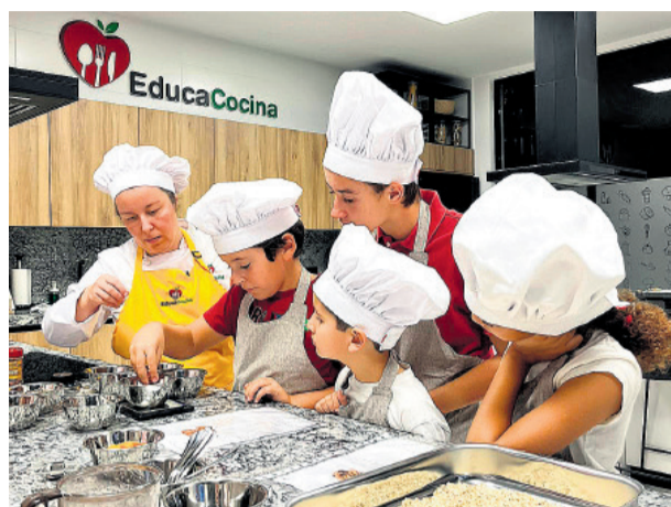
Uno de sus talleres