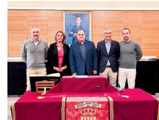
Concejales de ciudadanos hasta el final del mandato actual