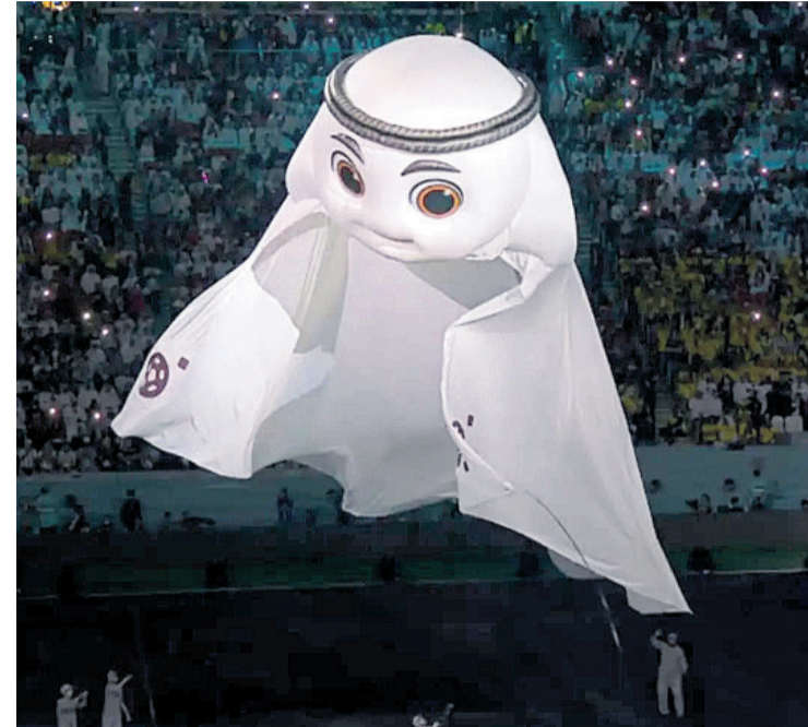
Una ceremonia de inauguración en la que San Vicente tuvo su cuota de protagonismo

◆ Durante la misma, se dejó ver una réplica gigante de la mascota que fue una creación de la empresa Carros de Foc, una de las más internacionales con las que cuenta nuestro municipio. El artista Miguel Ángel volvió a exhibir su maestría con esta creación maravillosa para un evento que más allá de las polémicas que le envuelven, es uno de los más importantes del mundo a nivel deportivo.