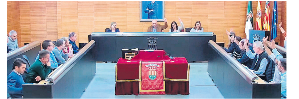
Sesión extraordinaria de pleno celebrada en la mañana del miércoles 23 de noviembre

● En la mañana del miércoles 23 de noviembre, el pleno municipal ha aprobado los presupuestos correspondientes al año 2023, gracias a los votos favorables del equipo de gobierno (PSOE, EU, PODEMOS), además de COMPROMÍS, y pese a no contar con el apoyo de CIUDADANOS, PP y VOX.