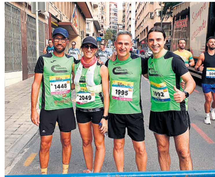
4 atletas de la sección "Sanvirunners" del Club Atletismo San Vicente, participaron en la 4ª edición de la Gran Carrera del Mediterráneo