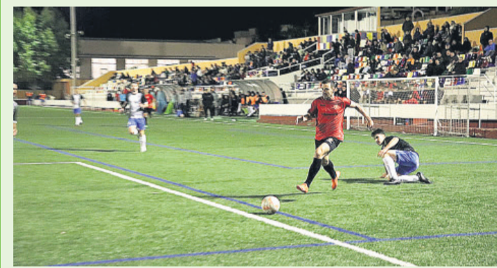
El Jove Español empató sin goles ante el Rayo Ibense en un partido celebrado el pasado sábado en la Ciudad Deportiva