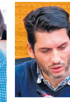
Adrián García (VOX): “Estos presupuestos están hechos con carga ideológica más que lógica”