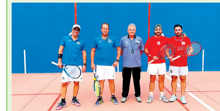
Imagen de nuestros jugadores