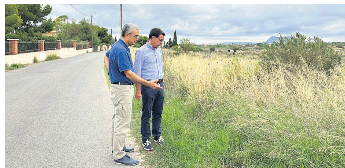
El Ayuntamiento de San Vicente del Raspeig ha aprobado la adjudicación del servicio de desbroce de caminos, vías públicas y otros espacios de gestión municipal

● El Ayuntamiento de San Vicente del Raspeig ha aprobado la adjudicación del servicio de desbroce de caminos, vías públicas y otros espacios de gestión municipal. Concluye así el proceso de licitación a favor de la mercantil Prezero, que será la responsable de poner en marcha a lo largo del último trimestre del año los trabajos necesarios para el mantenimiento de estos lugares.