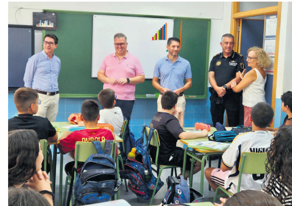
Primer día de curso con visita de las autoridades al CEIP Jaume I