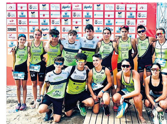
Campeonato de España de Triatlón Sprint