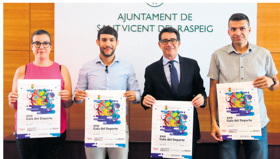
Rueda de prensa de presentación de la Gala del Deporte que tendrá lugar el próximo jueves