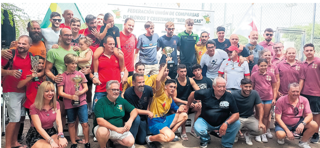
Algunos de los ganadores mostrando sus trofeos