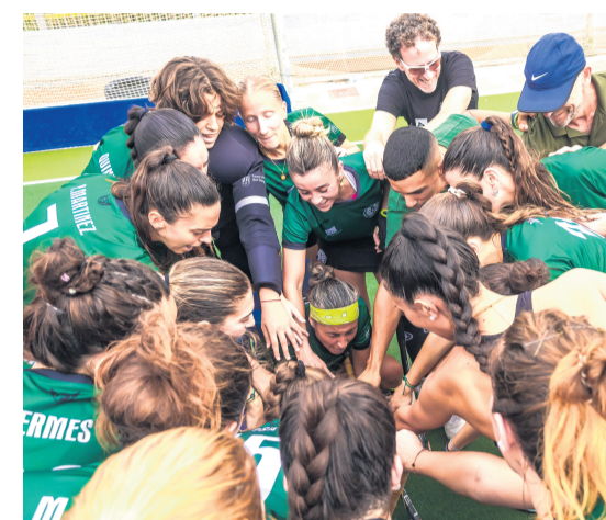
Primer encuentro en casa del equipo femenino