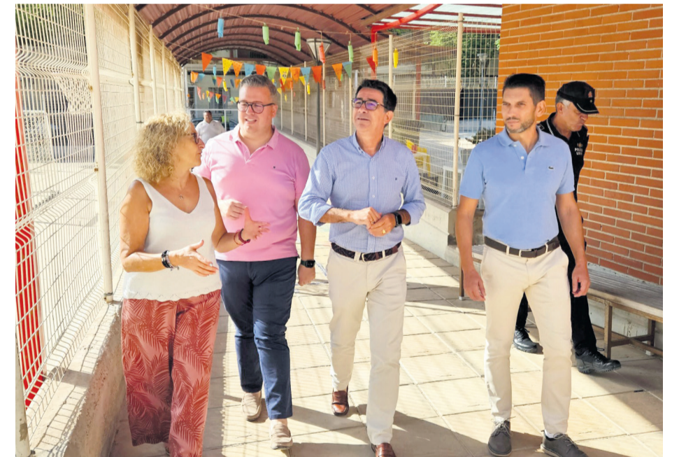
Primer día de curso con visita de las autoridades

competencia municipal, ha trasladado a la Conselleria de Educación su preocupación por el estado del patio del IES Gaia que se va a precitar para reparar los desperfectos. Operativo de seguridad El concejal de Seguridad Ciudadana y Policía Local, Adrián García, ha garantizado que "el operativo de seguridad previsto para atender todos los centros escolares de San Vicente del Raspeig está preparado para cubrir tanto las necesidades diarias como aquellas situaciones puntuales en las se requiera la intervención policial, todo ello adaptado al número de efectivos de los se dispone actualmente". El responsable municipal ha explicado que son prioritarios los colegios con transporte escolar y los que tienen mayor densidad de tráfico rodado, pero se dará servicio a todos los que lo requieran. "Por supuesto trabajamos para poder dar cobertura a todas las entradas y salidas de los colegios en los que se necesita de la presencia policial", ha reiterado. Por otro lado, la Concejalía de Cultura ha confirmado que, con motivo del inicio de curso, la Biblioteca Infantil y Juvenil Miguel Hernández situada en la plaza de la Comunidad Valenciana tendrá desde hoy horario vespertino, de 16 a 20 horas, que se extenderá a todos los días en los que se imparta clase y volverá a abrirse por las mañanas en periodo vacacional.