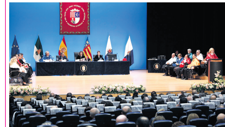
Inauguración del curso académico en la UA