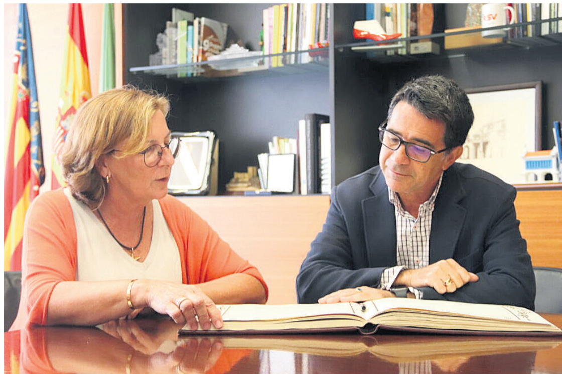
El alcalde de San Vicente, Pachi Pascual, y la delegada del Consell en Alicante, Agustina Esteve