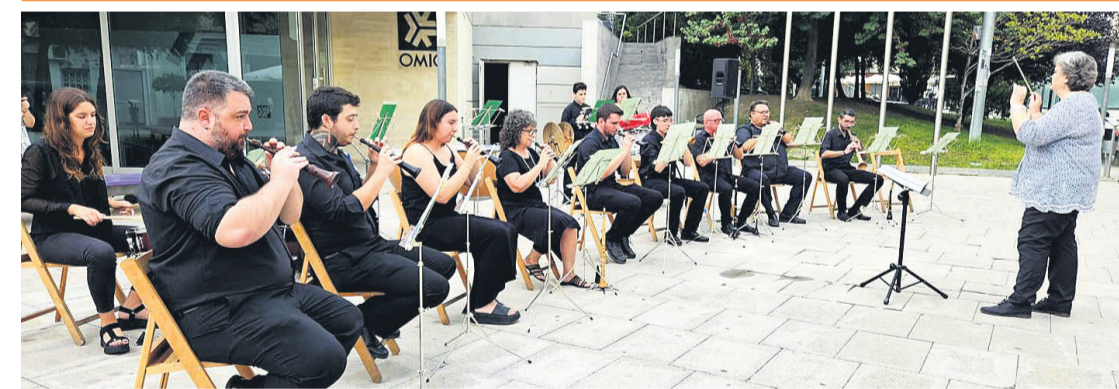
La Colla de la A.M. El Tossal interpretó el pasado domingo 17 de septiembre su concierto de música tradicional en la plaza de la Comunidad Valenciana