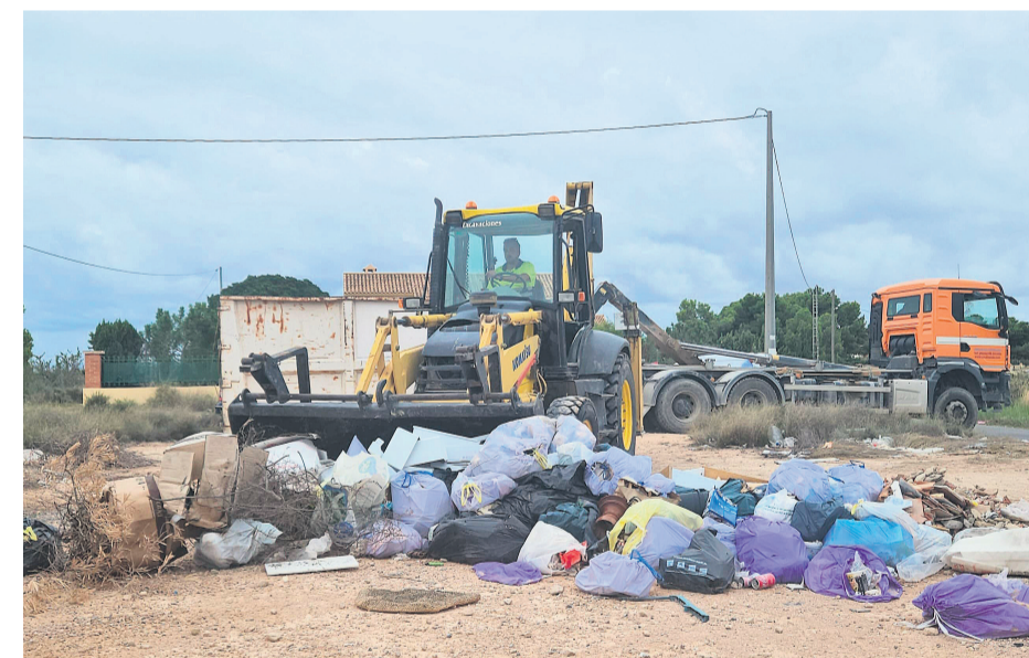
Inicio de los trabajos de limpieza

alrededores de Viveros Mari, Clot, Font de Sala, Femandina Rodalet, Horta, Carretera de Villafranqueza, Guadiana, Rayo Gardenias, zona Teular, Sol y Luz, Rebosar, Sendera, Carreret, zona Girasoles, Mahones, Collado, La Bornique, Raspas, Cuevas, Marcona, Tubos y Manchegos, carretera de La Alcoraya, alrededores del Velódromo de la carretera Calamar, Canastell y Revuelta Tomás.