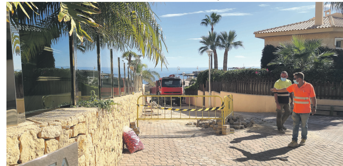
Trabajos de mejora de la escorrentía de la calle Morros Alts