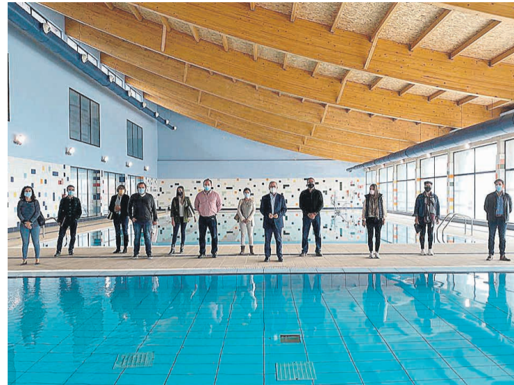
Visita de la corporación municipal a la instalación deportiva

para captar el máximo de luz natural. Los vasos de las piscinas no están enterrados, sino a la vista, lo que permitirá localizar con facilidad filtraciones y averías, y simplifica mucho el mantenimiento, según señalan los técnicos. Como ya avanzaron en su día el propio alcalde y el concejal de Deportes, Cristian Palomares (PP), aunque la crisis sanitaria ha frenado el avance de las gestiones para su puesta en funcionamiento y disfrute del público, el objetivo es tener "todo" dispuesto para que cuando finalice la pandemia salga de forma inmediata a licitación la explotación del complejo deportivo.