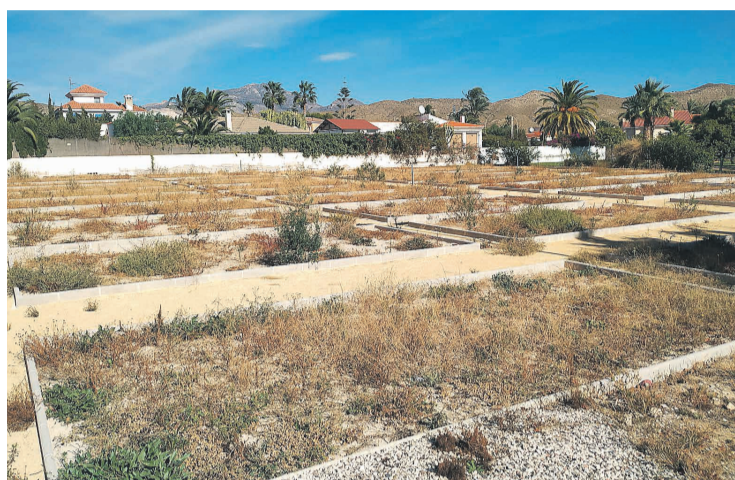
Parcelas dedicadas al huerto urbano de El Campello

Igualmente desde esta agrupación quieren dar voz a una de las peticiones más frecuentes realizadas por las personas usuarias de los huertos durante la visita que el concejal de EU hizo y es permitir utilizar de manera pro-