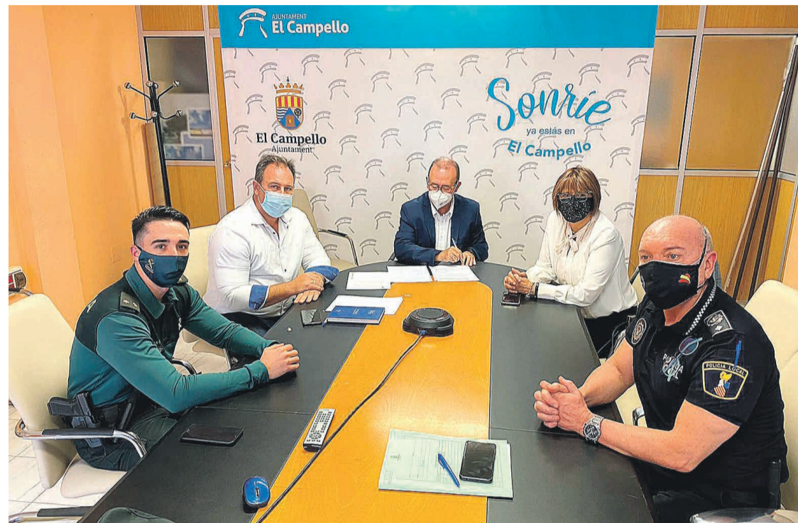
La Junta Local de Seguridad celebrada en El Campello de forma presencial y telemática