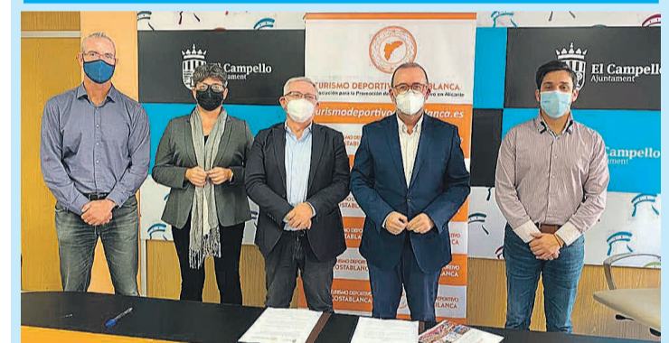
Firma del convenio para promocionar el turismo deportivo