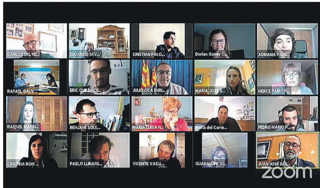
Sesión plenaria telemática del Ayuntamiento de El Campello

“El concejal de Deportes se comprometió a tener listo el pliego que adjudicará a una empresa la gestión total del complejo deportivo, una vez se levante el estado de emergencia sanitaria”