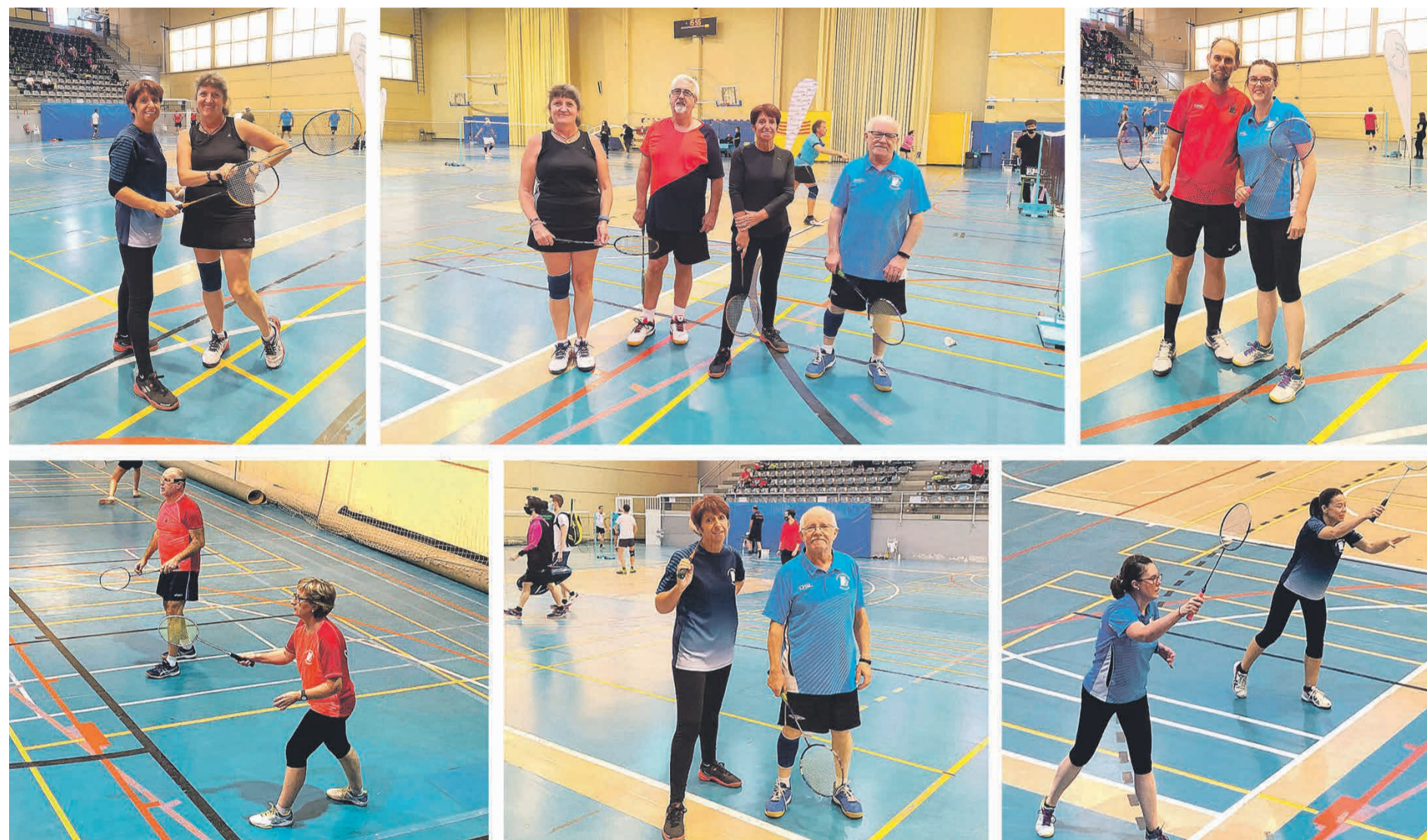
El pasado domingo 15 de Noviembre se disputó en El Campello el primer TTR absoluto/ sénior de bádminton