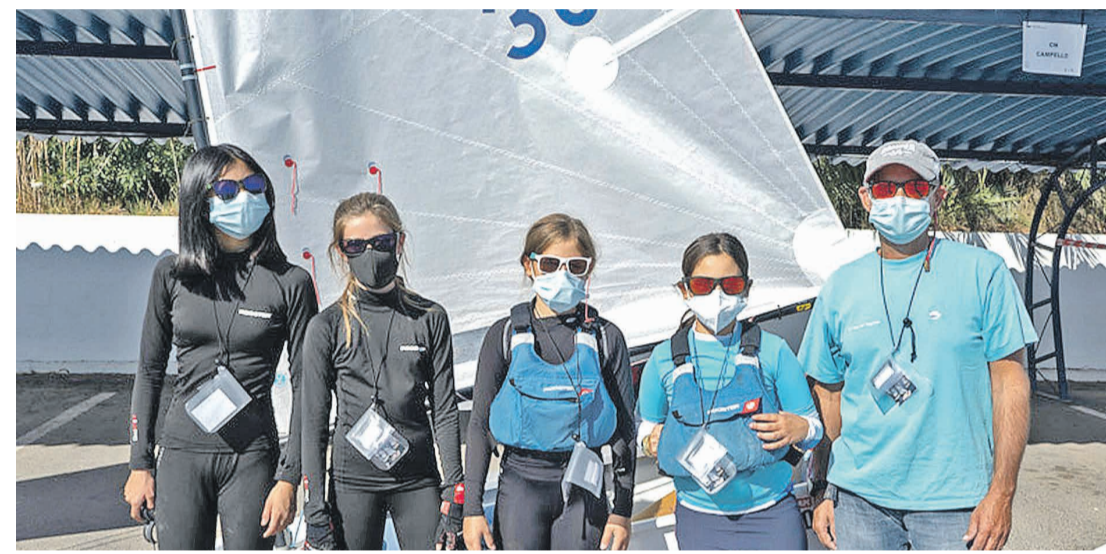
Las buenas condiciones meteorológicas permitieron a la flota completar el programa de pruebas previsto