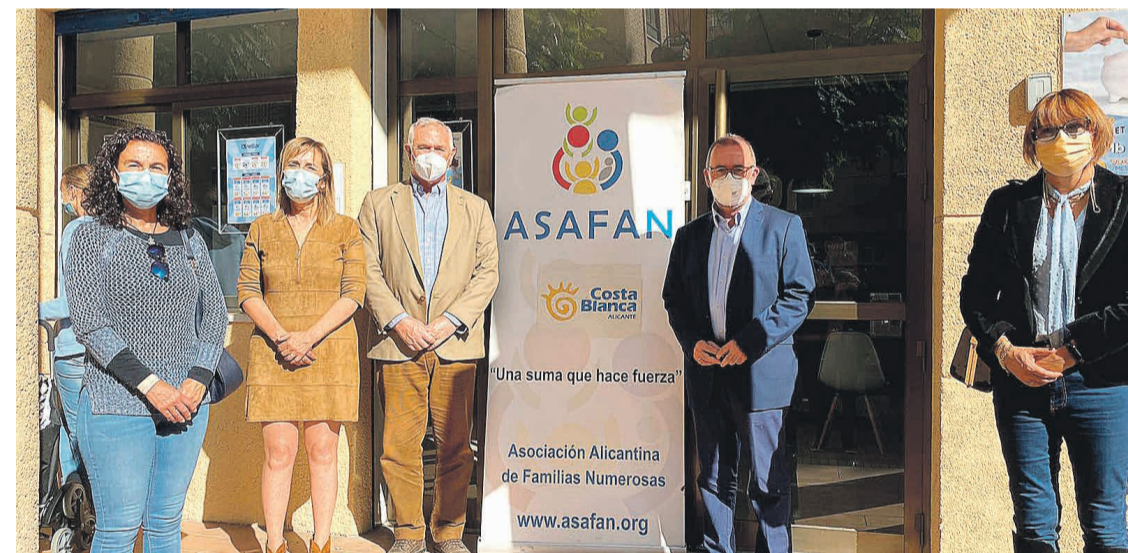
ASAFAN ya cuenta con una sede en el municipio de El Campello