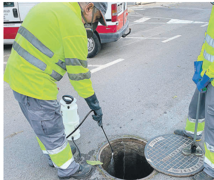
Un operario trabajando en la nueva campaña de desratización