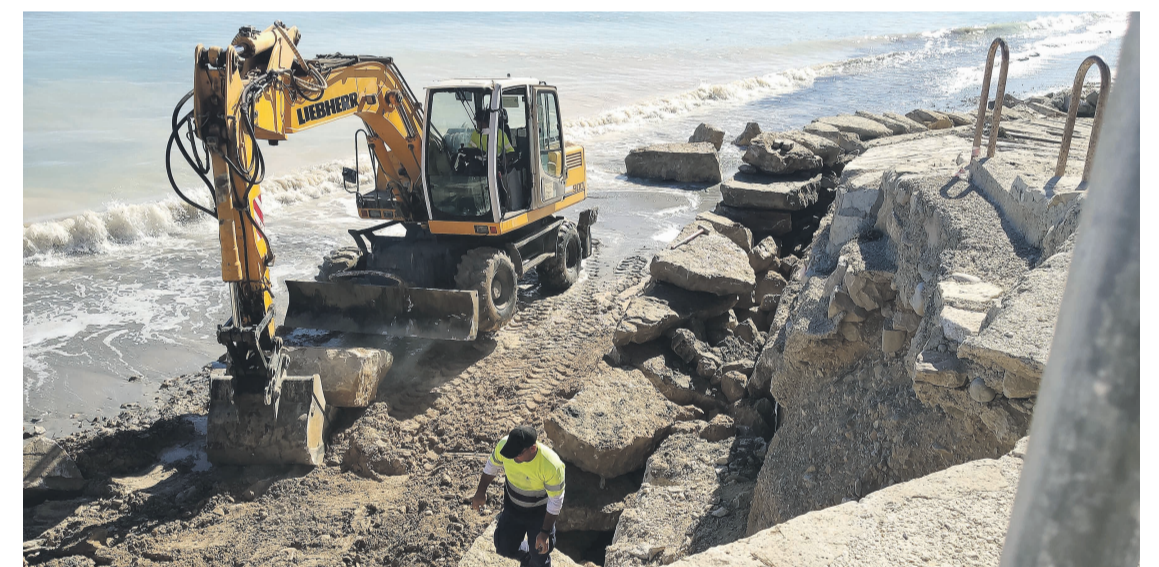
Obras en la playa de La Almadraba

Asimismo, se ha acometido la reconstrucción del muro de contención de mampostería, de una longitud de 20 m y una altura de 3 m, para lo cual se están empleando bloques de piedra de escollera, de hasta 2 toneladas, procedentes de las canteras de Busot. Además, se ha procedido a la recons-