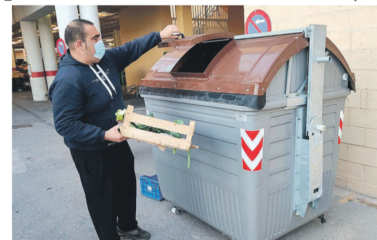
Un usuario del quinto contenedor para materia orgánica

Hoy mismo, se realizaba una primera prueba piloto, en la que se ha valorado la viabilidad de la recogida de residuos orgánicos en el contenedor marrón, cuya boca de entrada posee unas dimensiones muy reducidas, lo que podía representar una dificultad a los comerciantes, a la hora de desechar los residuos. "Se trata de facilitarles el trabajo, que entiendan esta iniciativa desde el punto de vista del beneficio y no como una carga o un trabajo añadido a sus quehaceres", ha explicado el edil de Mercado, Ja-