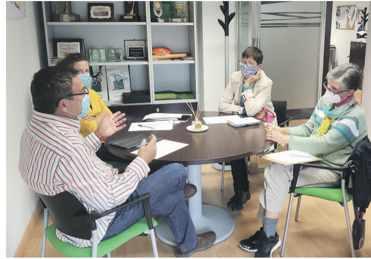
Reunión para impulsar el voluntariado medioambiental