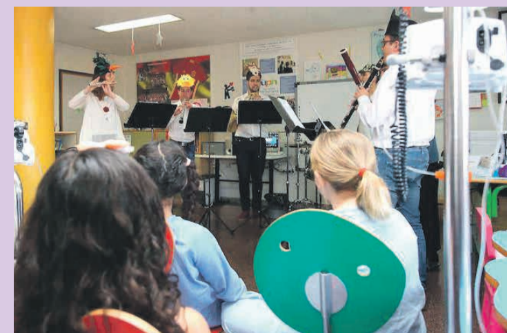
Actividad de musicoterapia en el CEIP El Fabraquer

La concejalía apuesta por la colaboración con los centros educativos del municipio en el desarrollo de actividades complementarias dirigidas a potenciar el acceso a la cultura y todas sus manifestaciones, el conocimiento del municipio y