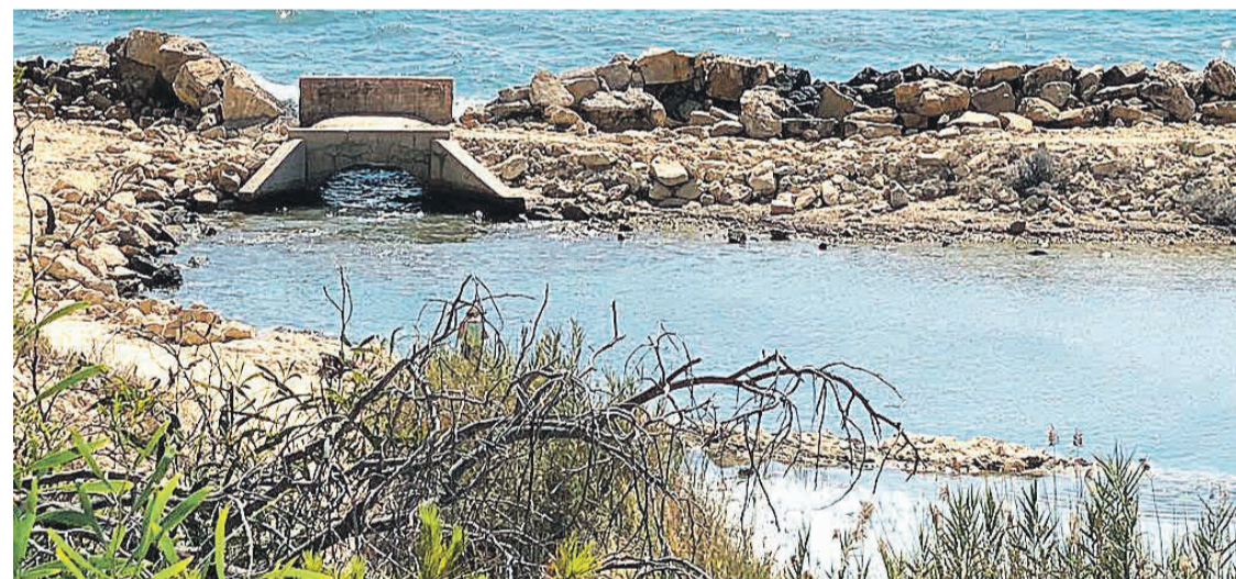
Imagen de Cala Baeza en El Campello