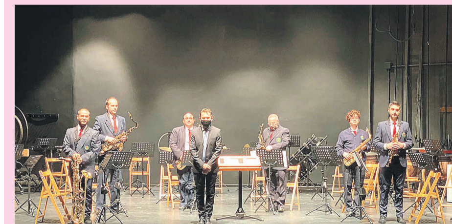
Concierto de Santa Cecilia en el que L'Avanç incorporó 4 nuevos educandos