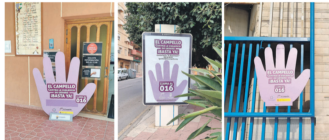
Se trata de una campaña que invade el espacio público