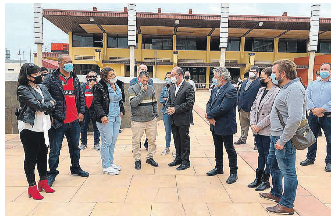
El alcalde Juanjo Berenguer junto a la familia de la joven asesinada

◆ Una mujer de 23 años fue asesinada con un arma blanca en El Campello el pasado viernes 13 de noviembre, a manos de un hombre en un caso donde se descarta el móvil por violencia machista dado que entre el agresor y la víctima no existía ningún vínculo.