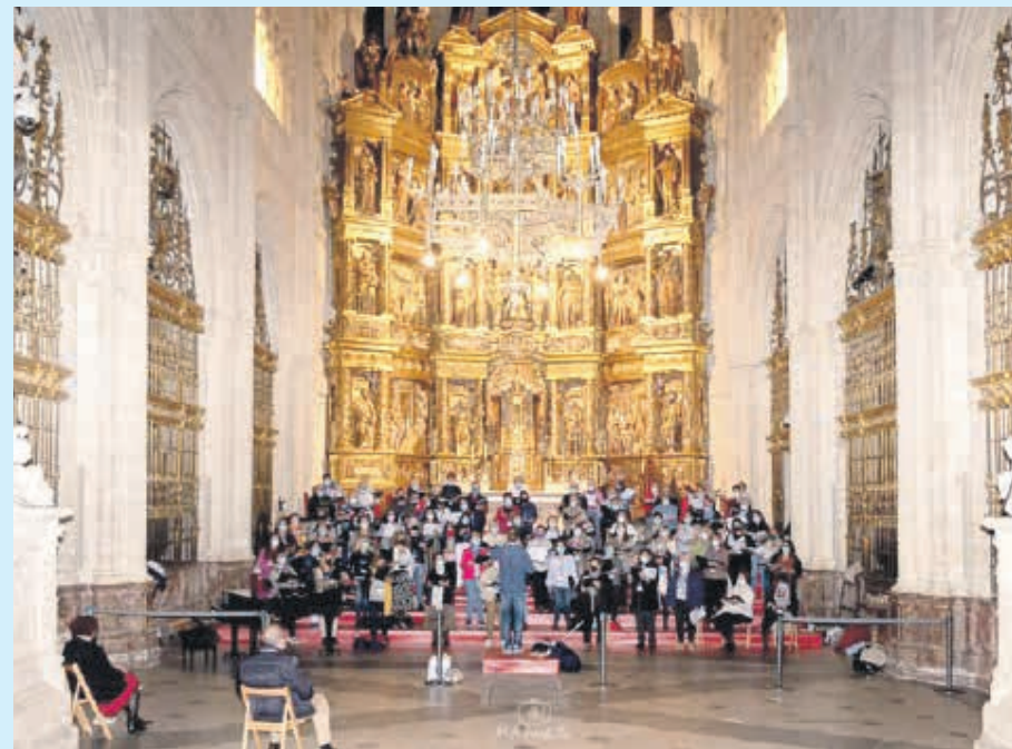
El orfeón en la catedral de Burgos