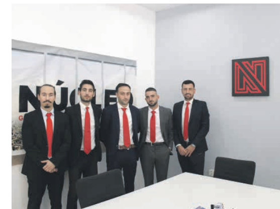
El equipo de trabajo de Inmobiliaria Núcleo