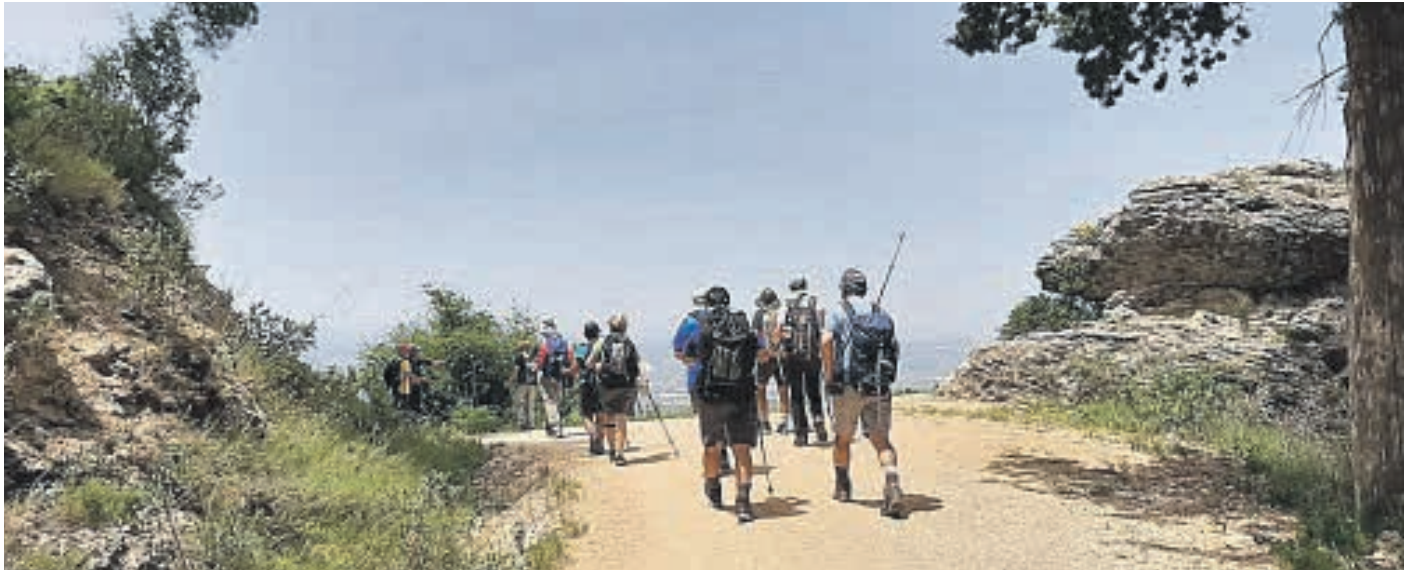
El Grup Muntanyenc en una de sus salidas