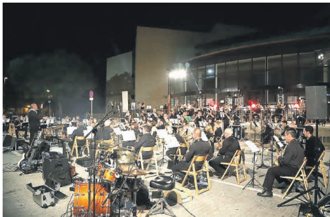
La banda en uno de sus conciertos

Junto a la orquesta sinfónica de la Sociedad Musical La Paz actuarán, los dos primeros domingos de octubre, las orquestas de la Primitiva de Liria, la Unión Musical de Liria y la Santa Cecilia de Cullera.