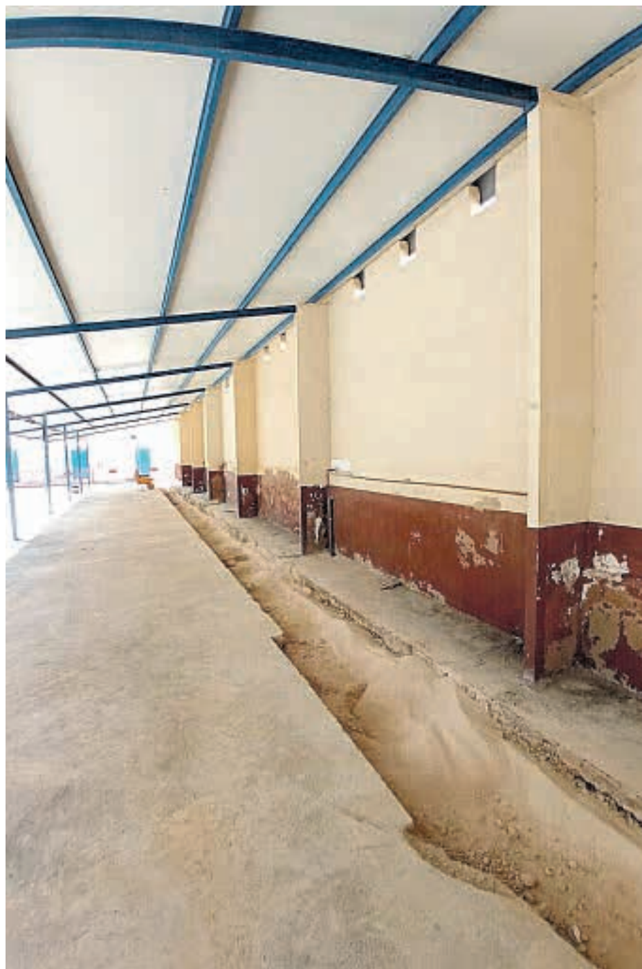
Obra en el mercado

Todas estas intervenciones incluyen una nueva forma de trabajo que creo es la más adecuada para estas actuaciones, ya que pretendo poder contribuir a actualizar el mercado municipal de Sant Joan no solo en sus infraestructuras e imagen sino también en su funcionamiento en lo que queda de legislatura, para lo que el trabajo conjunto con los comerciantes es imprescindible"