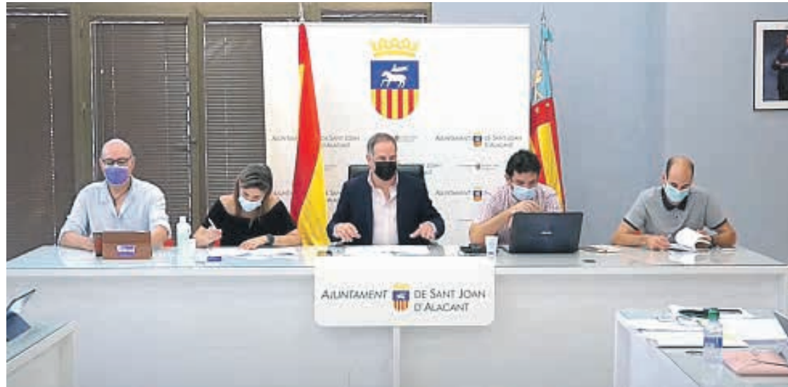
Pleno de Sant Joan d'Alacant