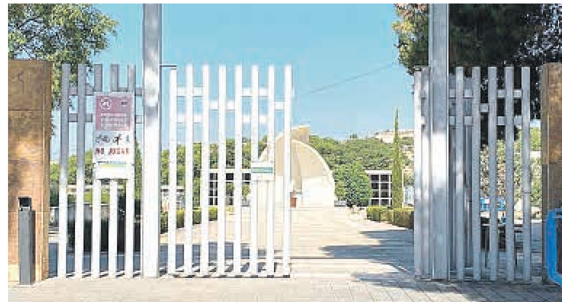
Puerta del Cementerio Municipal de Sant Joan