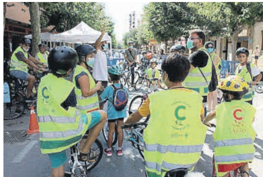
Momentos antes de salir en ruta de bicicleta por Sant Joan