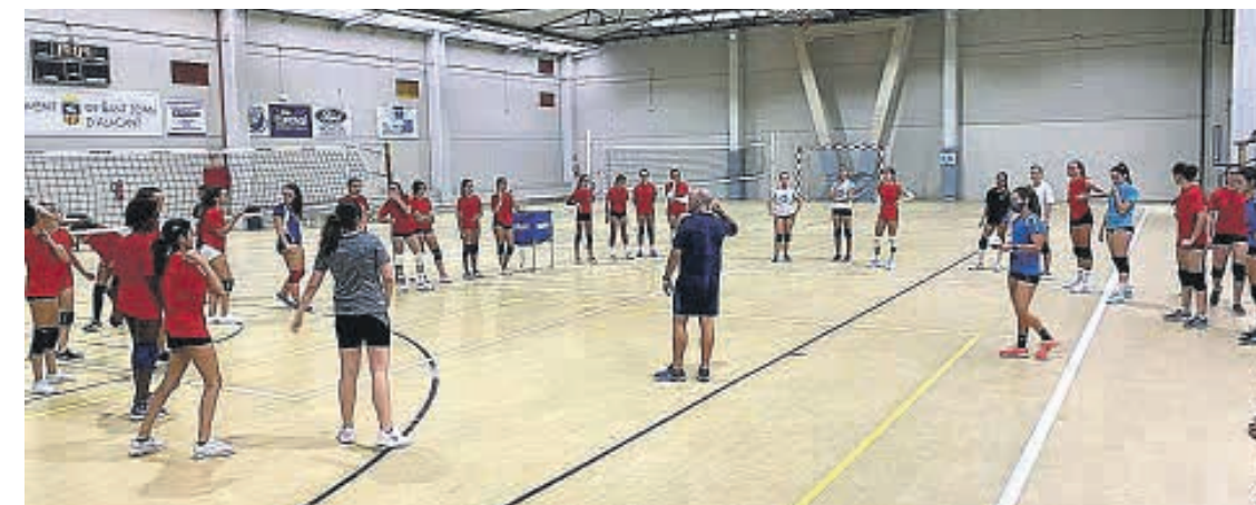
Uno de los equipos del Club Voleibol Sant Joan entrenando

Según apuntan desde el club, la previsión es subir año tras año en categorías hasta llegar a tener un sénior masculino, el club también dispondrá de un nuevo equipo junior femenino, categoría de nueva creación en voleibol y un tercer infantil femenino federado. Actualmente el club cuenta con un equipo senior que milita en Primera División Nacional con la mente puesta en el ascenso a Superliga 2.