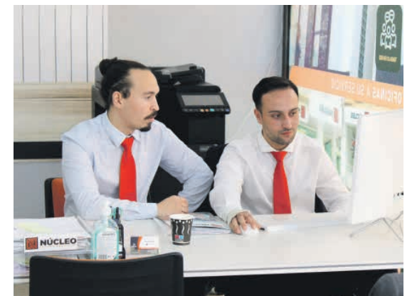
Los chicos de Inmobiliaria Núcleo trabajando