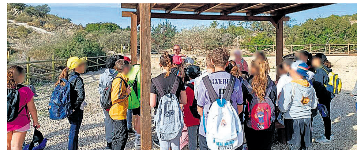
Los alumnos de El Víncl en la plantación

Todos ellos recibieron como regalo un cuaderno de campo de las características de las diferentes especies vegetales y consejos para su buen desarrollo.