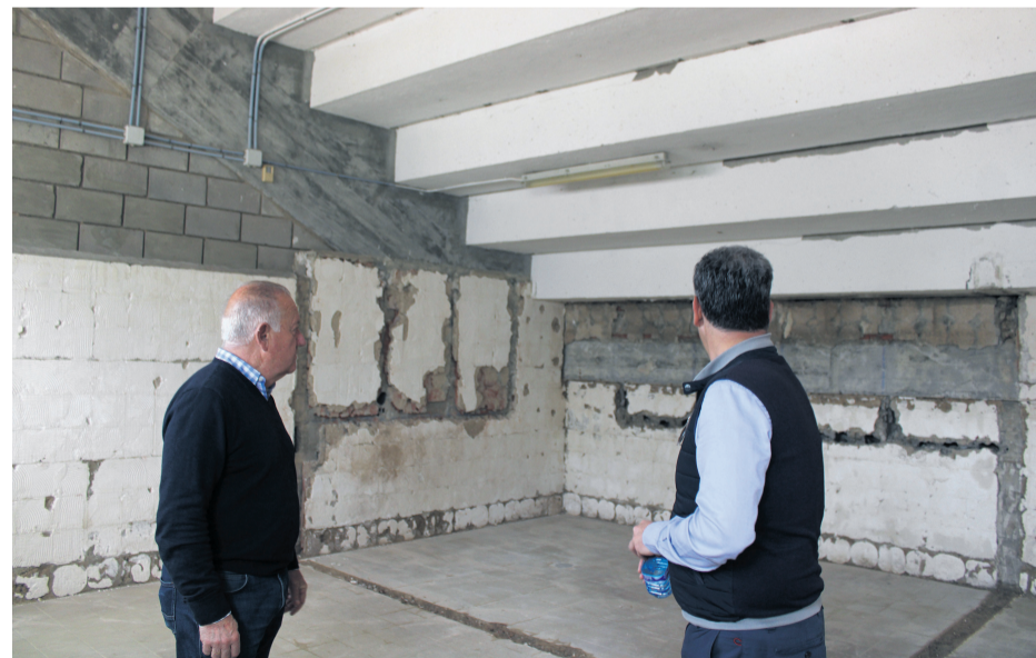
Los vestuarios del polideportivo de Mutxamel se renovarán por completo