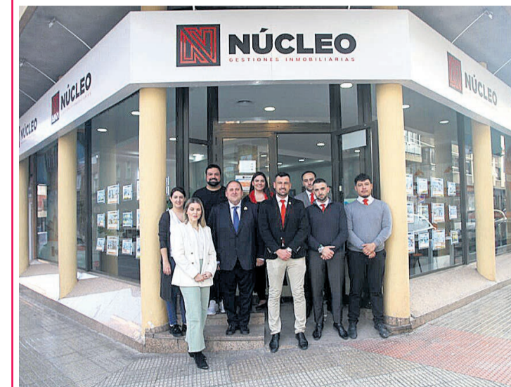
El equipo de Núcleo junto al presidente de la Junta de Peñas