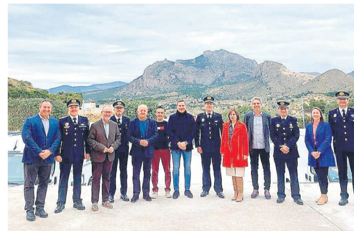
Miembros de los ayuntamiento de la comarca en la reunión para la creación de la comisión