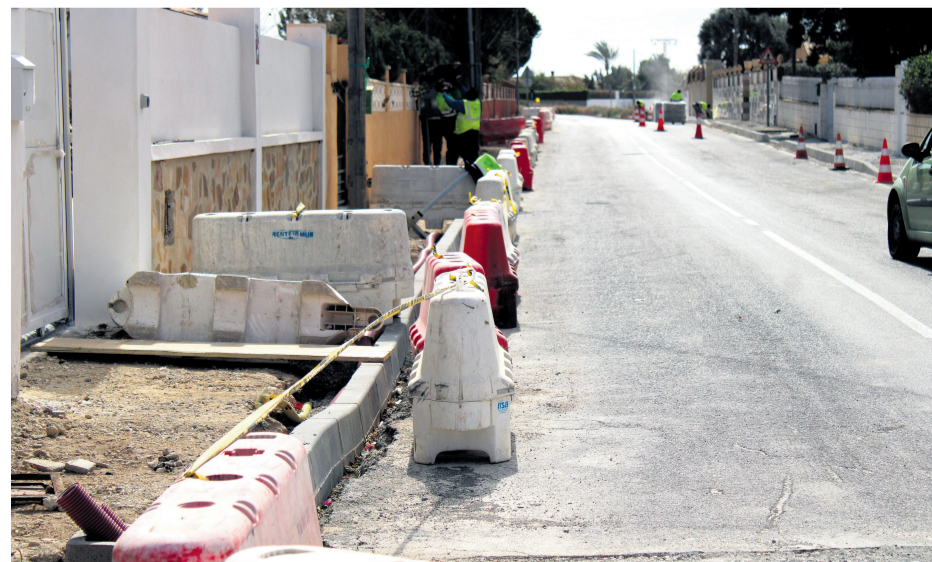
Las obras en “Los Girasoles” ya han comenzado

Además de al polideportivo, el concejal de Infraestructuras y el alcalde de Mutxamel se acercaron a visitar las obras de la urbanización “Los Girasoles”. Esta obra, que tendrá un coste de alrededor de unos 194.500€ consiste en cambiar y reponer nuevas luminarias y alumbrado led para también aliviar el consumo junto a nuevas aceras, con una amplitud adecuada y asfaltado de calles. Las obras han comenzado por una de las calles principales de la urbanización, la Calle del Clavell y en una segunda actuación se seguirá por otras colindantes. “Esta obra era algo demandado por los vecinos desde hace mucho tiempo y ya en un periodo corto de tiempo lo podrán ver realizado” ha explicado el concejal de Infraestructuras que ha añadido que desde el Ayuntamiento de Mutxamel están realizando lo que está un su término municipal, ya que la urbanización “Los Girasoles” está compartida entre Mutxamel y San Vicente del Raspeig.