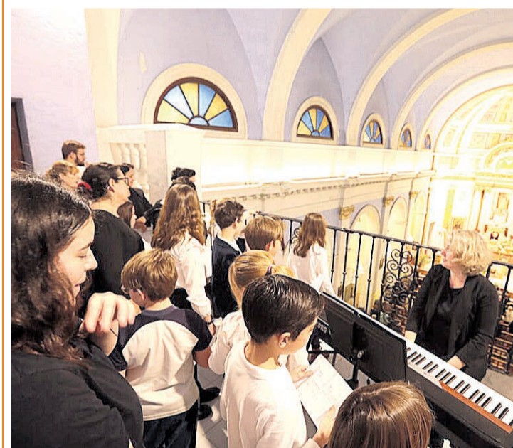
Integrantes de la SM La Paz en las XL horas de San Gregorio