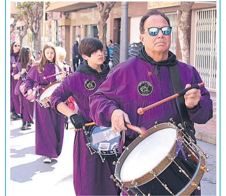
Tamborileros a su paso por la Avenida Carlos Soler