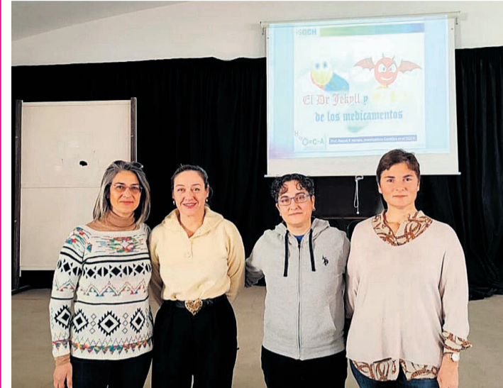
Las dos homenajeadas en su visita al instituto