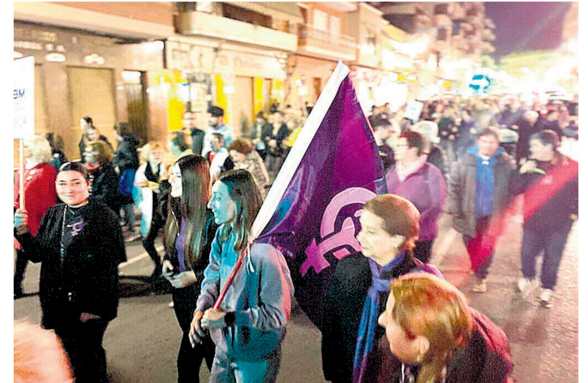
Manifestación del 8M en El Campello

una actuación de "Improvisencia Teatro", una compañía de teatro de improvisación especializada en espectáculos donde cuenta historias únicas e irrepetibles. Y para finalizar la jornada reivindicativa, a las 19:30 horas la Plataforma Violeta, Associació de Dones Posidonia y Amudeca encabezaron la manifestación feminista por el 8M, que partió del Ayuntamiento y recorrió la Avenida de la Generalitat, Carrer la Mar, Avenida de San Bartolomé y Avenida del Furs, para acabar en el mismo Ayuntamiento. En todos los casos, quienes participaron en los actos clamaron por un futuro igualitario en el mundo entero, al tiempo que se ponía en valor el esfuerzo, el trabajo y la lucha de las mujeres, incluso en países donde son perseguidas o asesinadas por colocarse mal un pañuelo o donde sus derechos simplemente no existen ni están reconocidos.