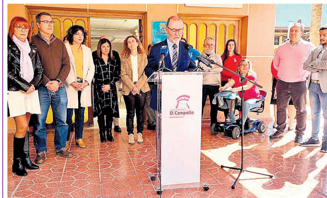
El alcalde junto a parte de la corporación municipal en la lectura de la declaración institucional