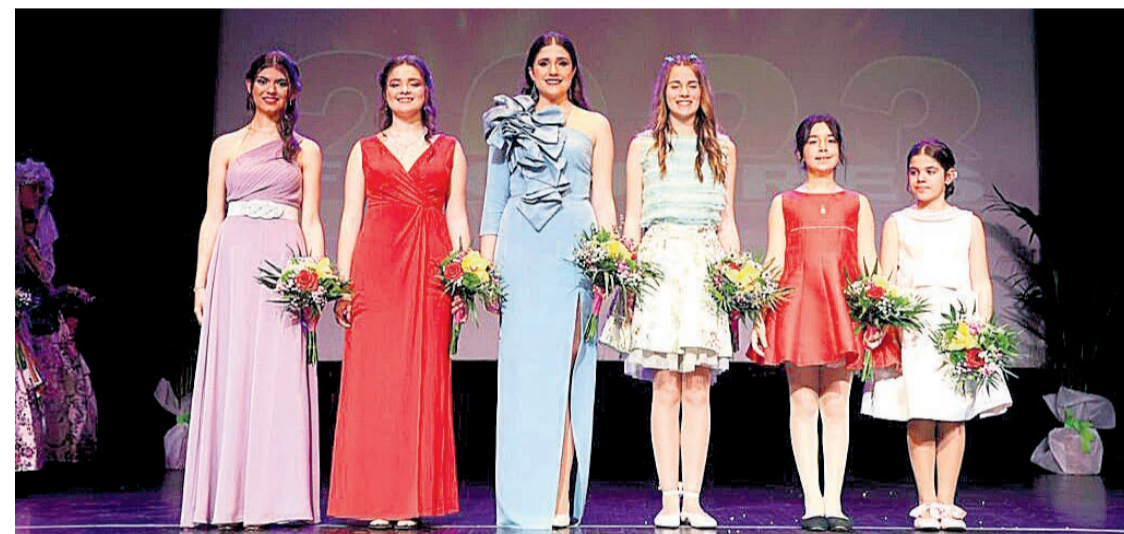
Las nuevas Bellezas sobre el escenario