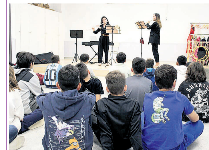
Dos integrantes de la SM La Paz en una de sus actuaciones en el colegio Lo Romero