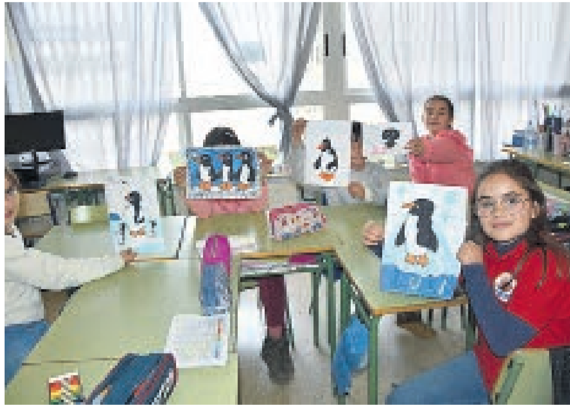
Los alumnos junto a sus dibujos