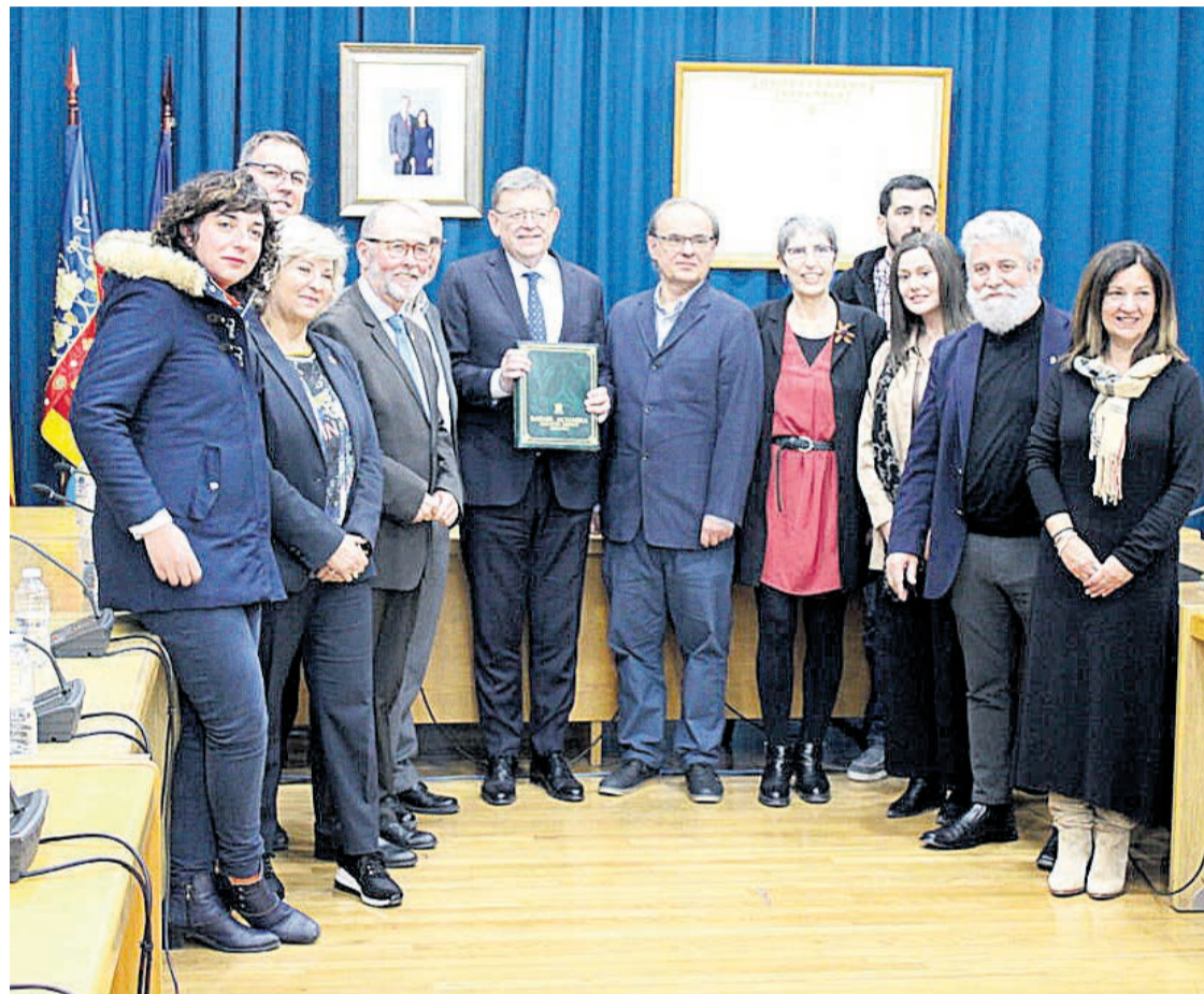
El presidente de la Generalitat Valenciana asistió a la clausura del Consell Valencià de Cultura

“Ventana al saber humanista” Para Ximo Puig, la herencia de Altamira “es una ventana al saber humanista” por sus múltiples facetas, entre ellas, las de jurista, escritor, pensador, pacifista, historiador, pedagogo y crítico literario. El president ha recordado que Altamira consideraba que la justicia y la educación estaban en la base de la paz y la convi-