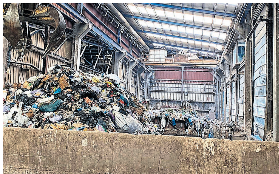
Interior del vertedero

desde las Asociaciones reclaman una rápida y eficaz finalización de las obras en dicha planta. También se le instó a que resolvieran las 1.400, alegaciones que hay presentadas, por la Asociación Vecinal, ayuntamiento y vecinos, argumentando su oposición a la ampliación del vertedero. Desde las asociaciones están a la espera de la respuesta del Consell. Por su parte, la Delegada tomó nota de las de ambas Asociaciones y las solicitudes para dar parte al Presidente Ximo Puig, subrayando la necesidad de un consenso político, entre Consellería y Ayuntamiento, y de un consenso ciudadano que, representado por las asociaciones de El Campello, queda ratificado. Para conseguir el citado consenso político, la Delegada del Consell instó a las Asociaciones que organicen una reunión entre asociaciones, Consellería y ayuntamiento. Desde la Asociación Vecinal Campellera sorprende que este tipo de