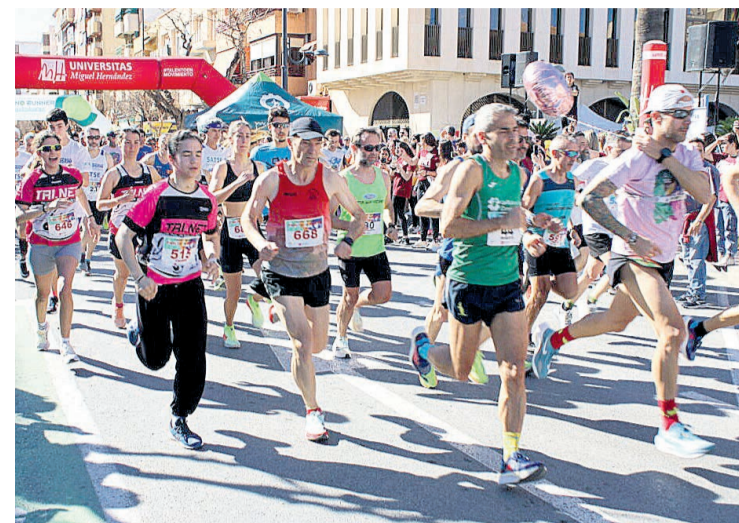
Momento de la salida