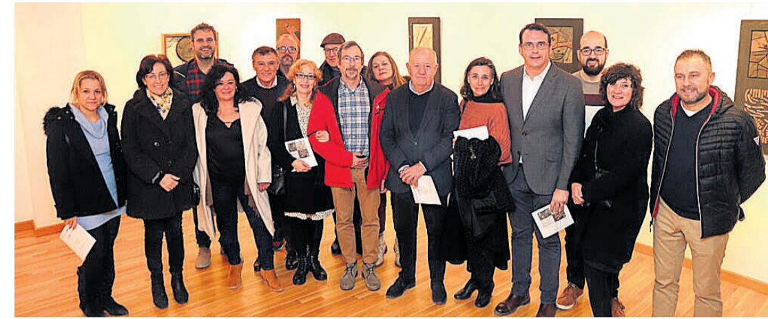
Imagen de la inauguración de la exposición