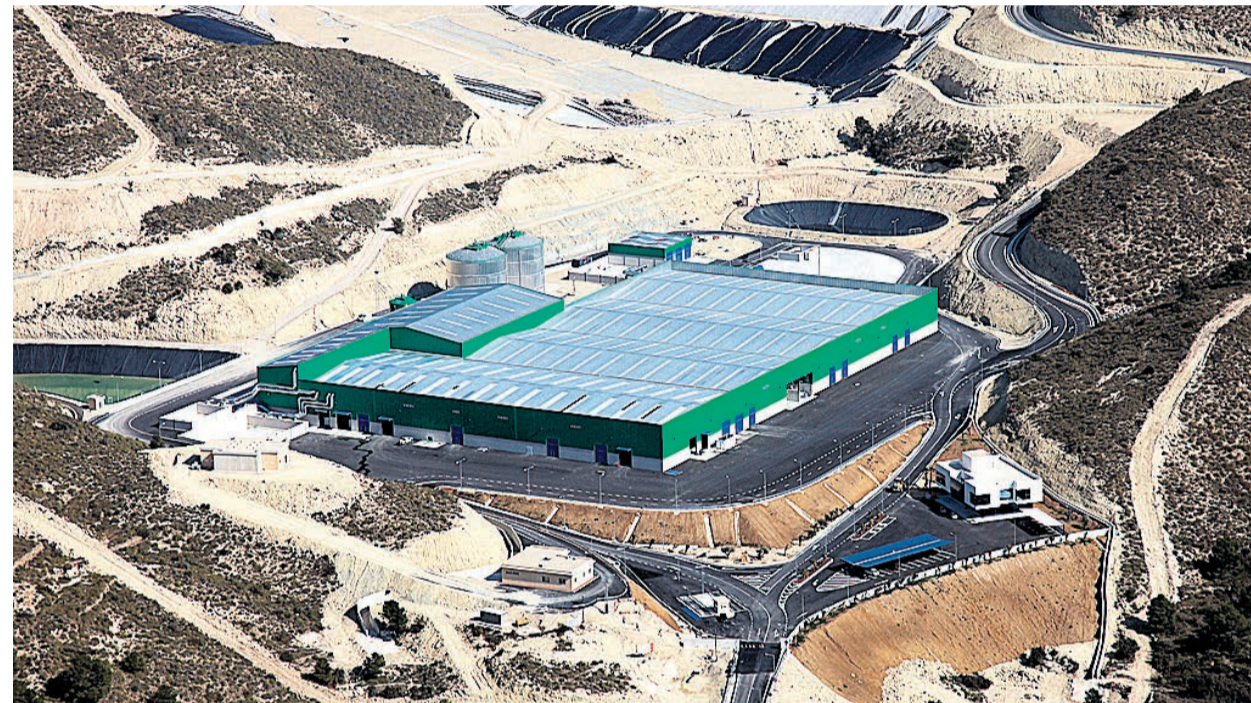
Vertedero Les Canaryades