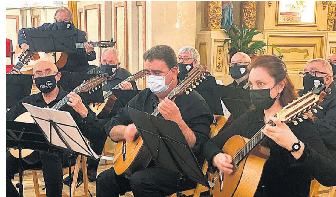
Imagen de archivo de la Batiste Mut