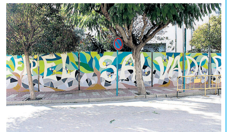
Fachada del CEIP El Salvador

carácter complementario a las actividades desarrolladas por la Conselleria de Sanidad Universal y Salud Pública, e introduce las adaptaciones precisas para producir una sinergia de efectos, no incurriendo por tanto en duplicidad. Este nuevo informe supone para la Concejalía de Educación el restablecimiento del Programa de educación para la Salud que se venía prestando desde el año 2007, con gran aceptación entre la comunidad educativa y la ciudadanía de Mutxamel.