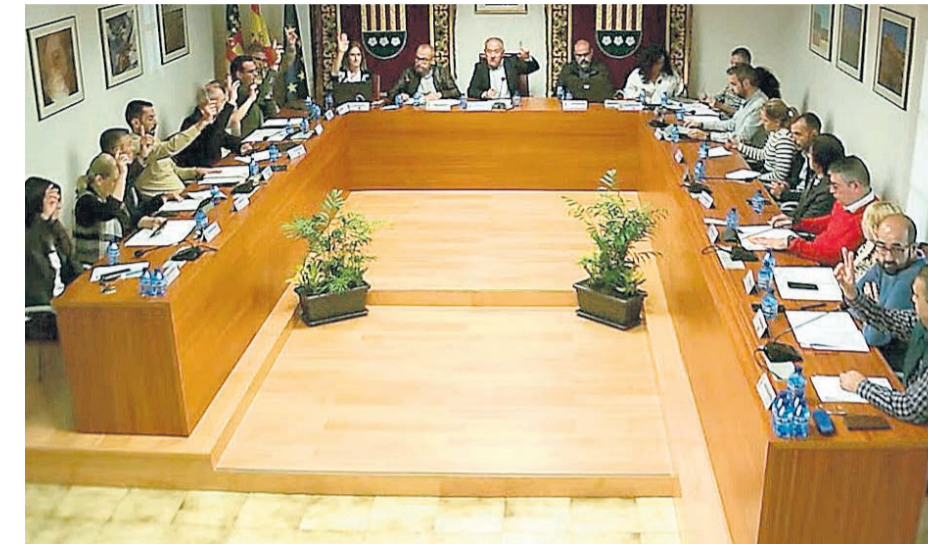
Pleno de Mutxamel