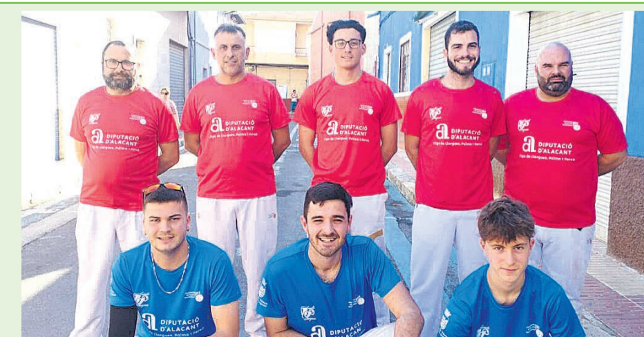
Un dels equips del Club de Pilota Valenciana del Campello