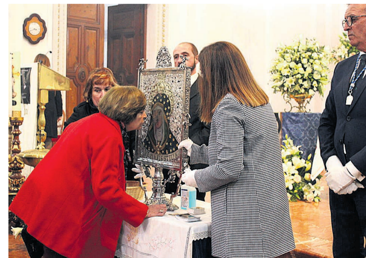
Una vecina de Mutxamel en la besà a la Mare de Déu de Loreto

La tarde comenzó con una misa en su honor, para pasar a una procesión por la plaza nueva hasta regresar otra vez a la iglesia donde la imagen de la Virgen de Loreto se posó en un atril para que vecinos y visitantes pudieran hacer lo que desde hacía tres años no podían por culpa de la pandemia, besar a la virgen. Los primeros en hacerlo fueron los integrantes de la corporación municipal, los integrantes de la cofradía de la Mare de Déu, los miembros de la Comisión de Fiestas de Moros y Cristianos y los cargos festeros. La cola para la tradicional besà salía por la puerta de la iglesia y el templo estuvo abierto hasta que el último vecino o visitantes se acercó a venerar a su patrona. Alrededor de las once de la noche, se subía a su capilla donde descansará hasta septiembre cuando vuelva a bajar para la procesión del 9 de septiembre. Los mutxameleros se despidieron de ella con el tradicional «salut per l'any que ve».