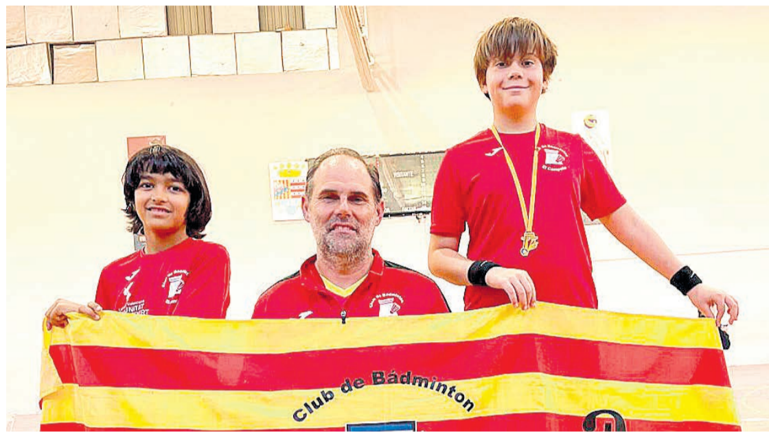
Imagen de equipo del Club de Bádminton

●El sábado se disputó en El Campello un TOP TTR sub13, sub17 y absoluto de bádminton, con participación de jugadores de clubes de la Comunidad Valenciana, Murcia y Castilla La Mancha. Del club de El Campello hubo participantes en las tres categorías.