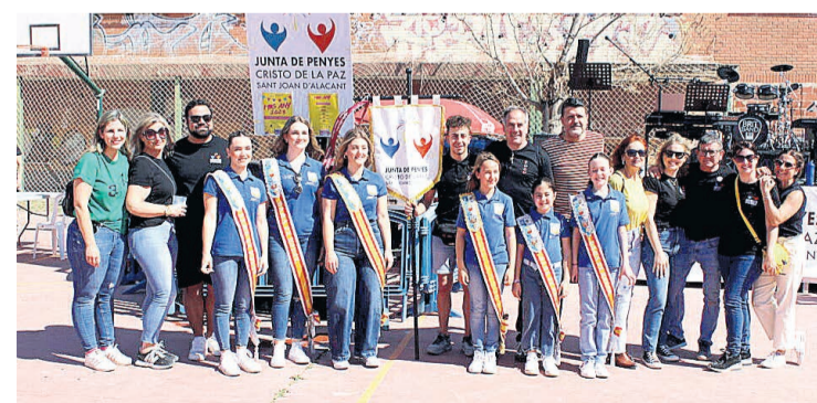
Las reinas de las fiestas junto a parte de la corporación municipal y parte de la Junta de Peñas