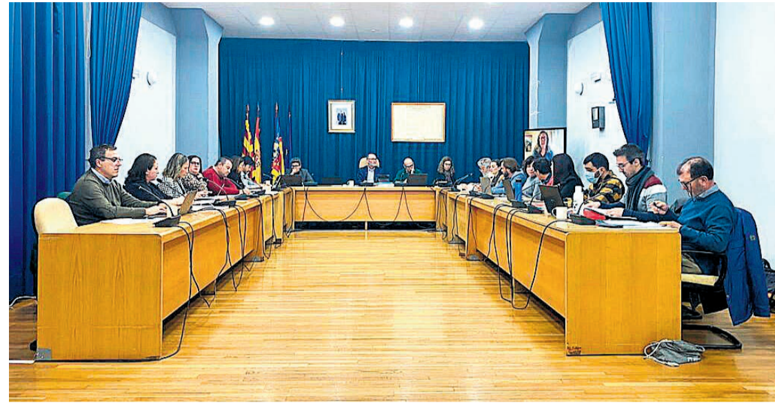
Pleno de El Campello