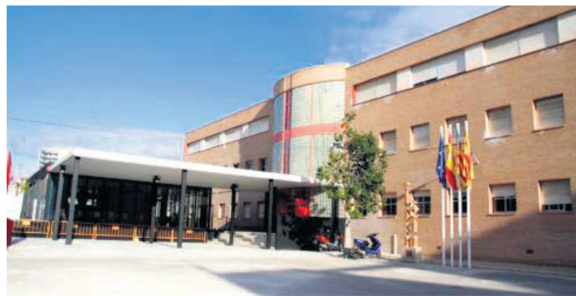
IES Clot de l'Illot

Serán reparadas las pistas de fútbol sala y vóley, con una superficie aproximada de 2.890 metros cuadrados, y serán reformados los aseos de las plantas baja, primera y segunda, tantos los destinados al alumnado como al profesorado, además de los vestuarios. Las obras se aprovecharán para introducir en el complejo aseos adaptados. En lo que a las pistas deporti-