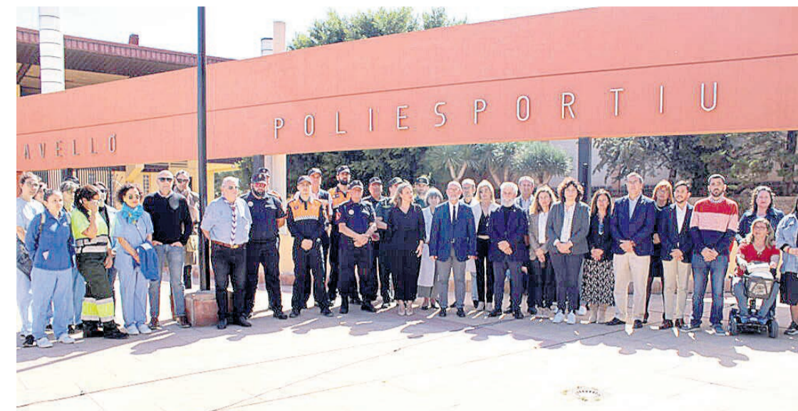
Foto de familia de todos los participantes en el homenaje

El manifiesto aporta datos sobre cogedores, como los cerca de 14 millones de españoles que desde 2020 se han visto afectados por la enfermedad, los 120.000 falle-