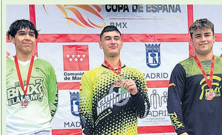
Podium de uno de los deportistas campelleros