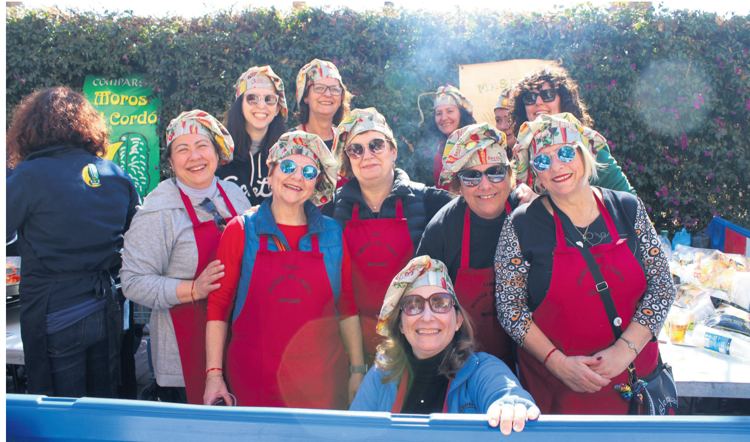
La Comparsa Maseros fue la ganadora del concurso de paellas

●El Mig Any comenzó de la mano de la solidaridad, con la Donación de Sangre organizada por la Comisión de Fiestas de Moros y Cristianos de Mutxamel, el Centro de Transfusiones y el Ayuntamiento de la localidad. A esto, le siguió el concierto de Música Festerá a cargo de la Banda Jove de la SM L'Aliança de Mutxamel, al día siguiente, tuvo lugar el torneo de fútbol sala.