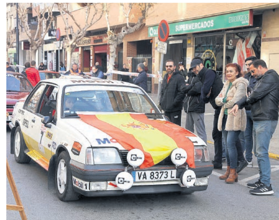
Coche en la salida del Rallye