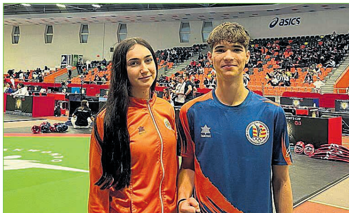
El equipo de Sanvi Sports estuvo en Sofía, Bulgaria, participando en el prestigioso torneo WT President’s Cup