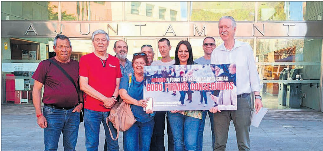
Imagen tras la recogida de firmas a las puertas del Ayuntamiento