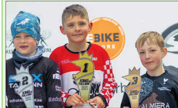
Gran resultado para el rider sanvicentero