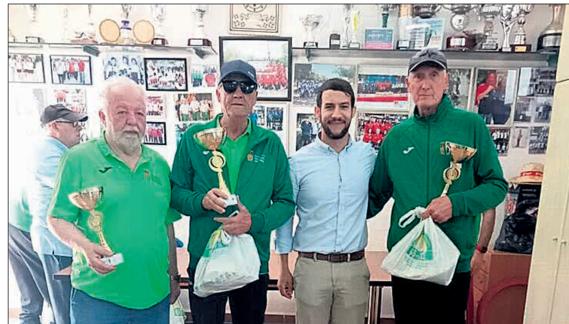
¡Felicidades al club y sus campeones!