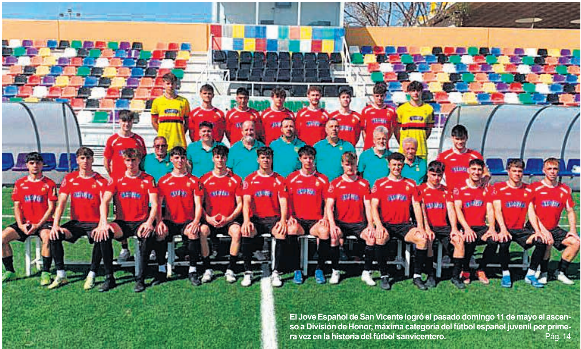
El Jove Español de San Vicente logró el pasado domingo 11 de mayo el ascenso a División de Honor, máxima categoría del fútbol español juvenil por primera vez en la historia del fútbol sanvicentero.