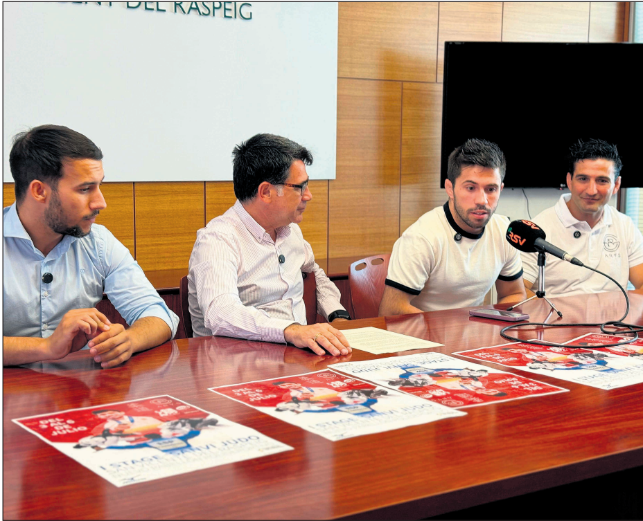
Rueda de prensa presentando el stage