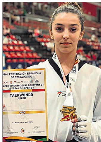
Otro buen resultado para la deportista sanvicentera