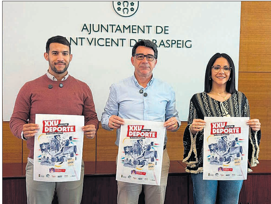
Imagen de la rueda de prensa