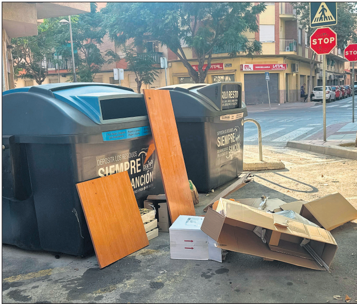
Contenedores en las calles de San Vicente