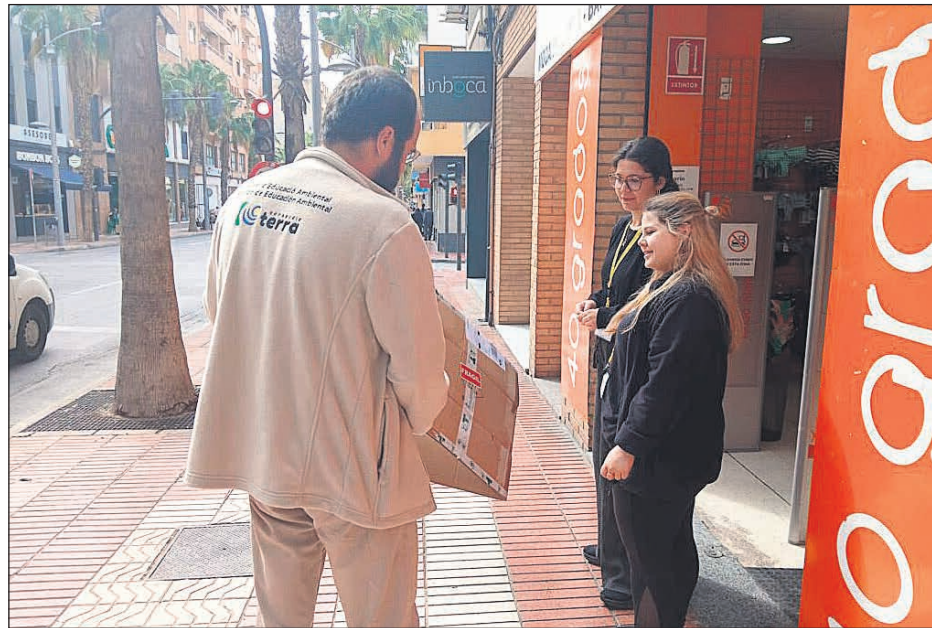
Imagen de la visita a los comercios