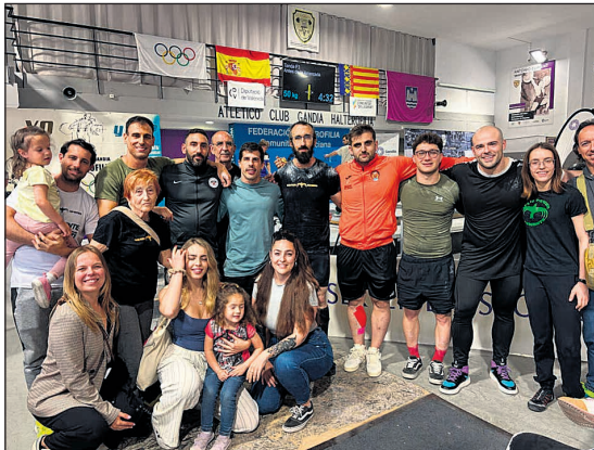
Sobresaliente actuación del Power San Vicente