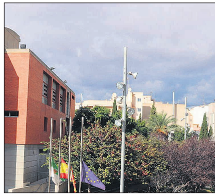
San Vicente sede del Foro UEPAL