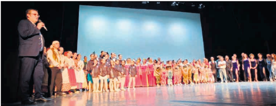
San Vicente del Raspeig vivió el pasado fin de semana una vibrante celebración cultural con la XXIX edición del Homenaje a la Danza