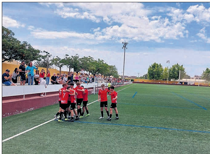
Otro gran éxito para el deporte sanvicentero