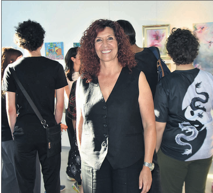
Gran afluencia de gente en la exposición