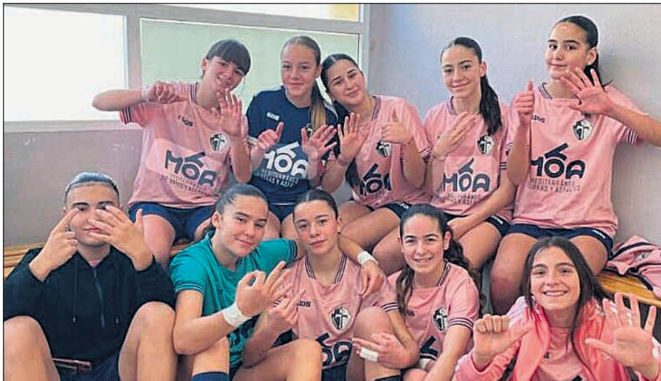
El equipo femenino CDFS Torres de San Vicente

El equipo femenino del CDFS Torres de San Vicente no solo ha demostrado un alto nivel competitivo, sino también un gran espíritu deportivo y trabajo en equipo, consolidándose como un referente en el fútbol sala de la localidad. San Vicente del Raspeig está preparado para respaldar a sus jugadoras en este decisivo momento. El esfuerzo colectivo y el talento de estas deportistas reflejan el compromiso de la localidad con el deporte base y su proyección en competiciones de alto nivel.