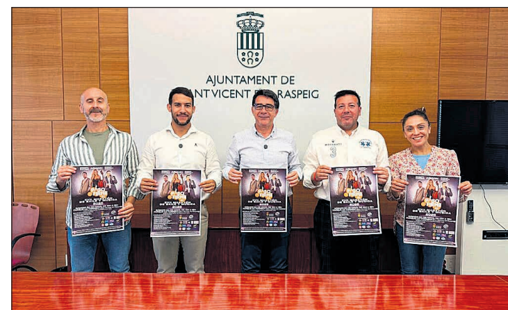
Imagen de la rueda de prensa

En el programa de actividades preparado se incluyen una clase impartida por Gregory Campillo que animará la jornada lecciones de hip-hop, salsa y bachata. La organización ha confirmado que se entregará a todos los participantes ob-