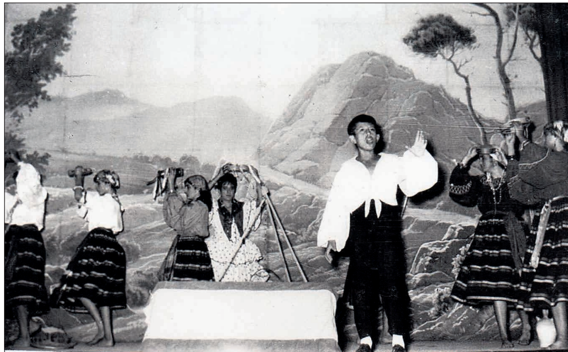
Canción del Vagabundo de Alma de Dios