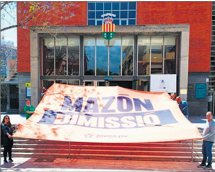
Miembros de Compromís mostrando la pancarta