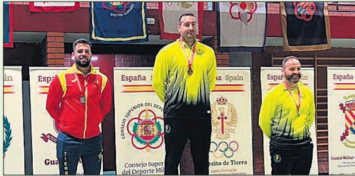
Gran triunfo del atleta sanvicentero