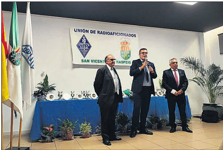
Un momento del acto