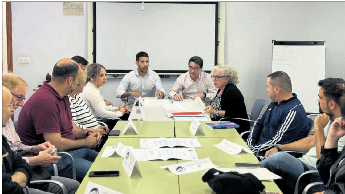
El Ayuntamiento de San Vicente del Raspeig, a través de la concejalía de Deportes, ha constituido por primera vez el Consejo Municipal del Deporte