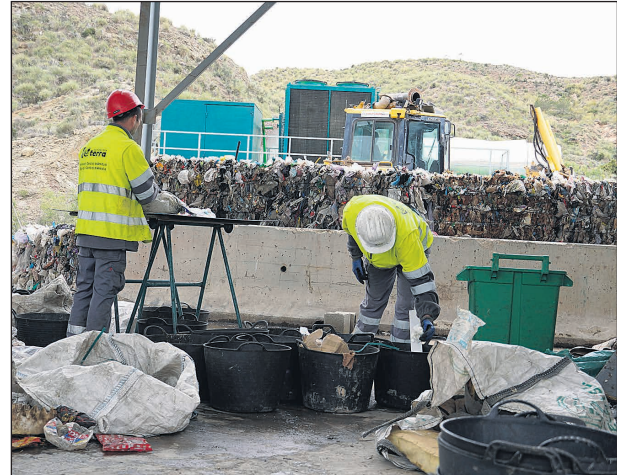
Centro de Tratamiento de Residuos Domésticos del Consorcio Terra

Las caracterizaciones se hacen con la técnica del cuarteo, un método de muestreo que sigue el protocolo para la caracterización de los flujos de residuos municipales del Ministerio para la Transición Ecológica con el objeto de armonizar el proceso a nivel nacional, y a través del cual se obtiene una