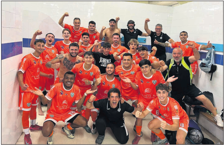
A un paso de cerrar una gran temporada