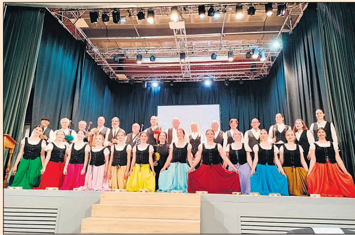
El grupo Gaitas de Rusadir durante su actuación

(1931) de Pío XI (1857-1939); Mater et Magistra (1961) de Juan XXIII (1881-1963) y Centesimus Annus (1991) de Juan Pablo II (1920-2005), con toda una reflexión sobre el papel de la Iglesia Católica romana. Igualmente, el día 18 de mayo, celebramos el XXIII Aniversario de la Creación de Almorçarets Sanvicenteros, alcanzando los 1.023 actos, con el nombramiento de 112 “Sanvicenteros Universales”. Una interesante trayectoria cultural en San Vicente del Raspeig.