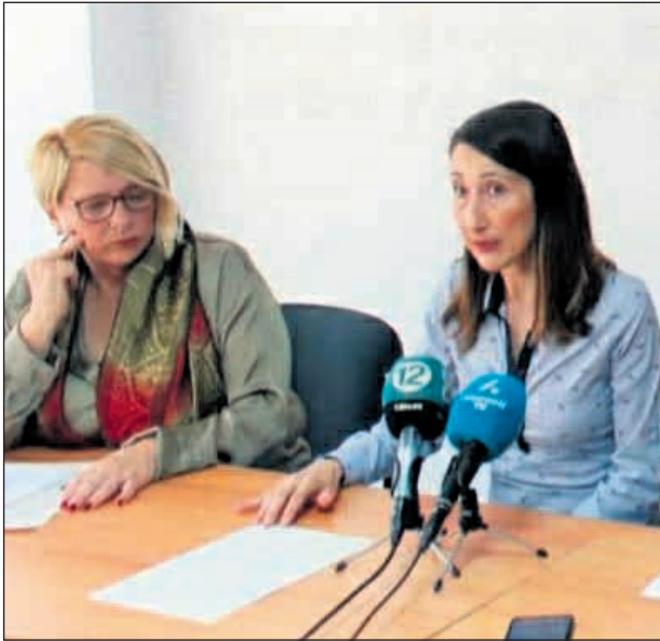
Imagen de una rueda de prensa