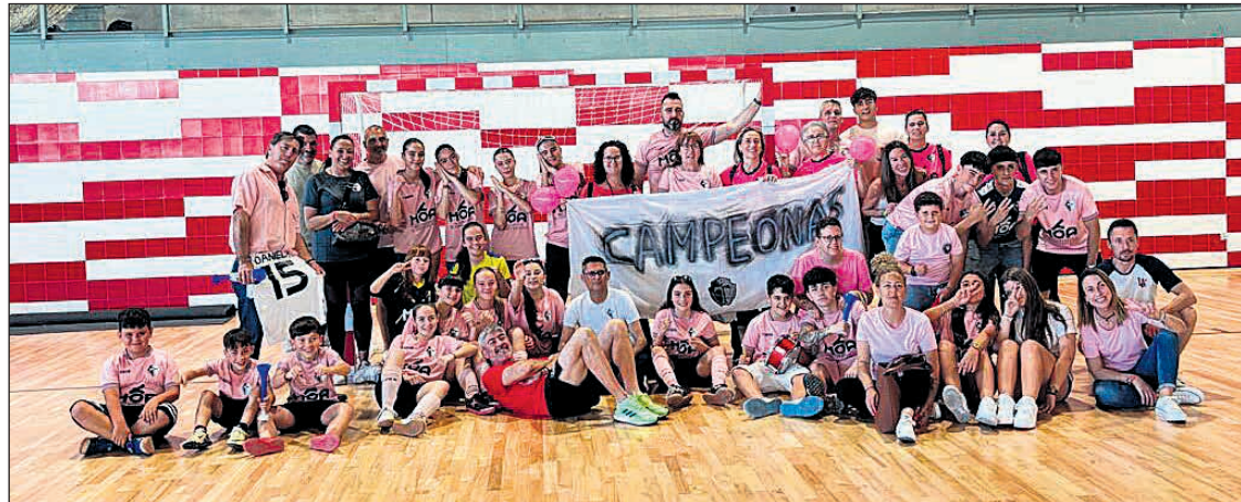
¡Enhorabuena al CDFS Torres de San Vicente por este logro histórico!