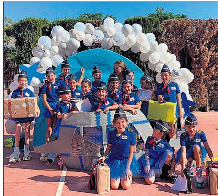
La pasada semana se celebró el festival de fin de curso de las actividades extraescolares de patinaje en el colegio Bec de l'Àguila

Familias y docentes disfrutaron de una tarde emocionante, en la que el esfuerzo y la dedicación de los participantes se vieron reflejados en cada coreografía. Un cierre brillante para una actividad que ha fomentado el deporte, la constancia y el compañerismo.