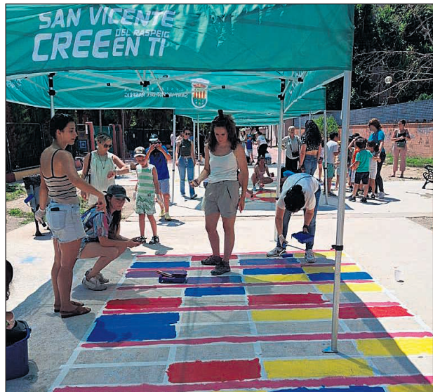
El alumnado de 4º de Primaria, dentro de su proyecto «Orgullo de barrio», llevó a cabo la primera intervención para dar color y vida a las calles cercanas al centro escolar