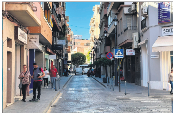
Imagen de archivo