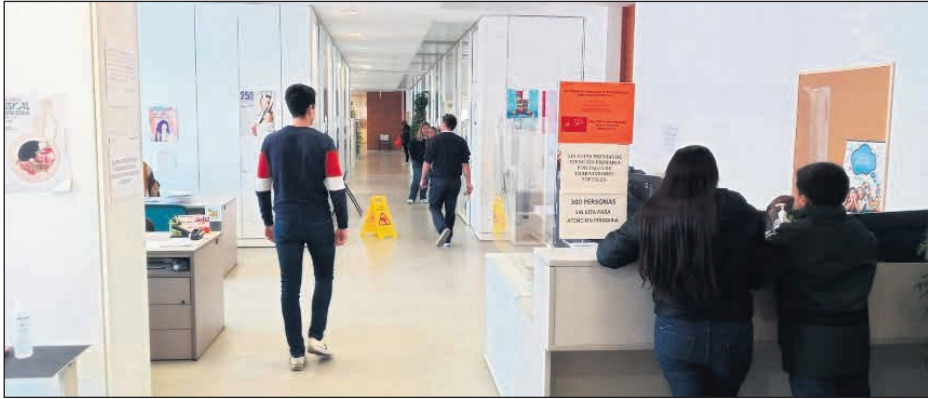
Uno de los centros de Salud de San Vicente