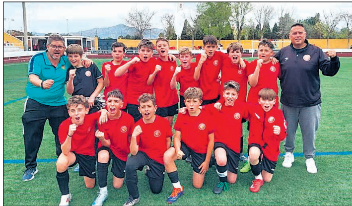
El Alevín «A» del FCJ Español de San Vicente se ha proclamado campeón de Liga