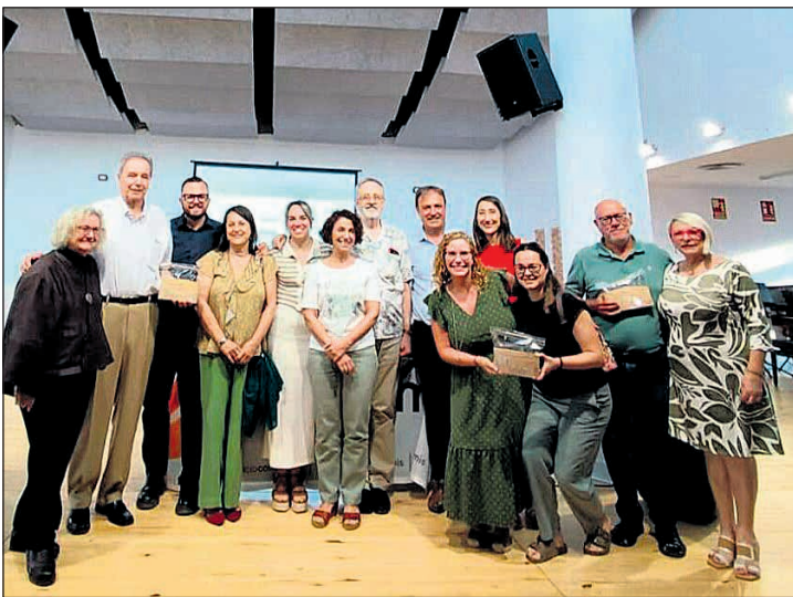
Un momento de la entrega de premios