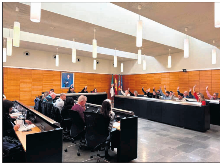
Imagen del pleno