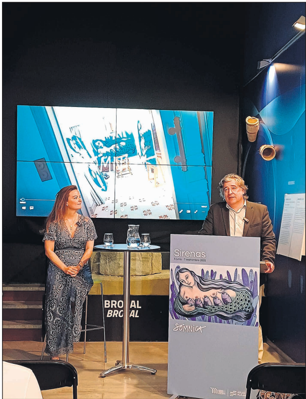
Una instalación con la mujer como protagonista, dentro del VI Ciclo de Arte y Medioambiente del museo