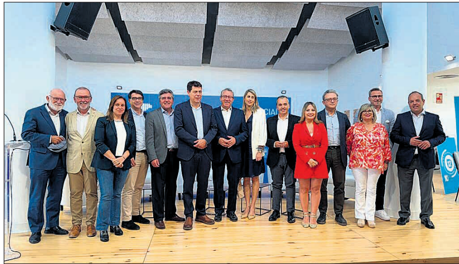
Encuentro que tuvo lugar en San Vicente