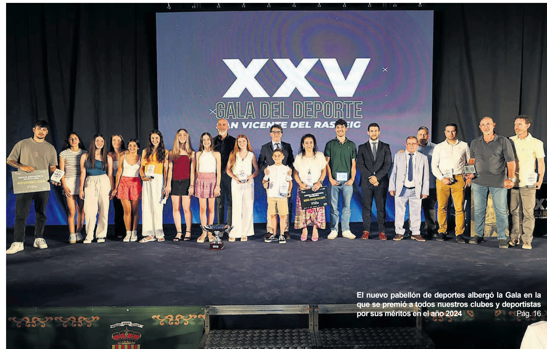
El nuevo pabellón de deportes albergó la Gala en la que se premió a todos nuestros clubes y deportistas por sus méritos en el año 2024