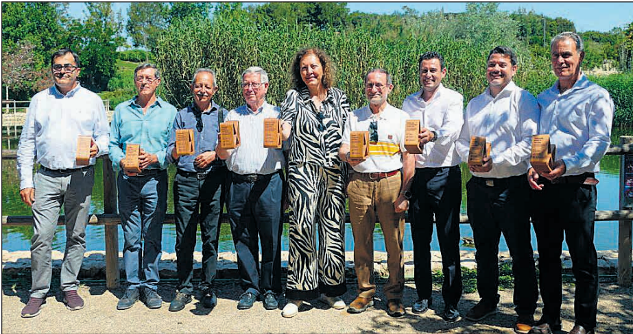
El acto se ha celebrado con motivo del 10º aniversario de la inauguración de la infraestructura inundable, que forma parte de un plan antirriadas

Promovido conjuntamente por el Ayuntamiento de Alicante y Aguas de Alicante, La Marjal fue inaugurado en marzo de 2015 y da solución a