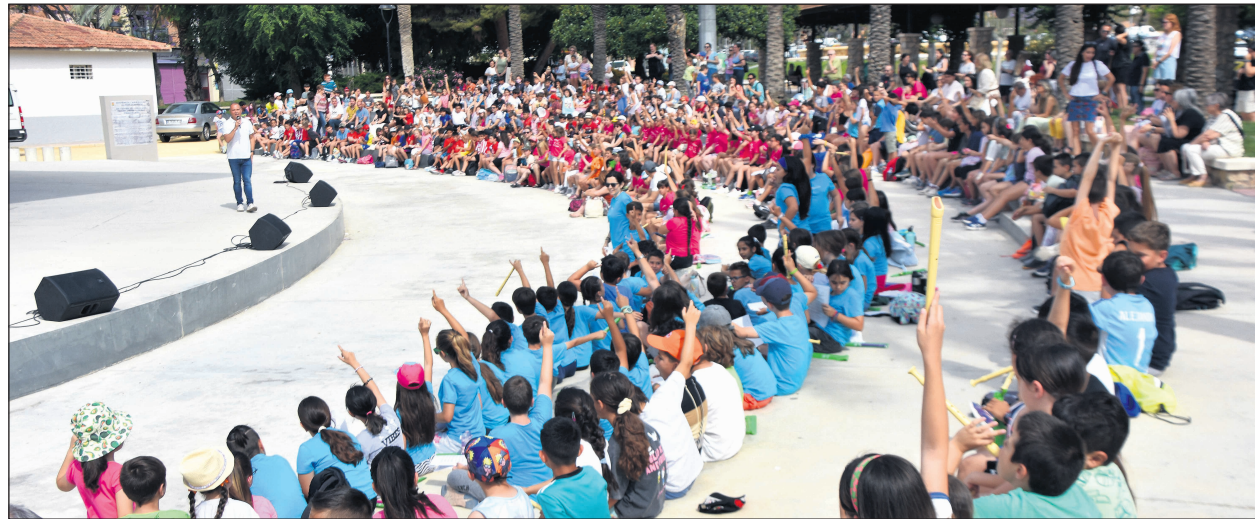
Concluye el ciclo de Conciertos Escolares con una última actuación al aire libre en el parque Juan XXIII