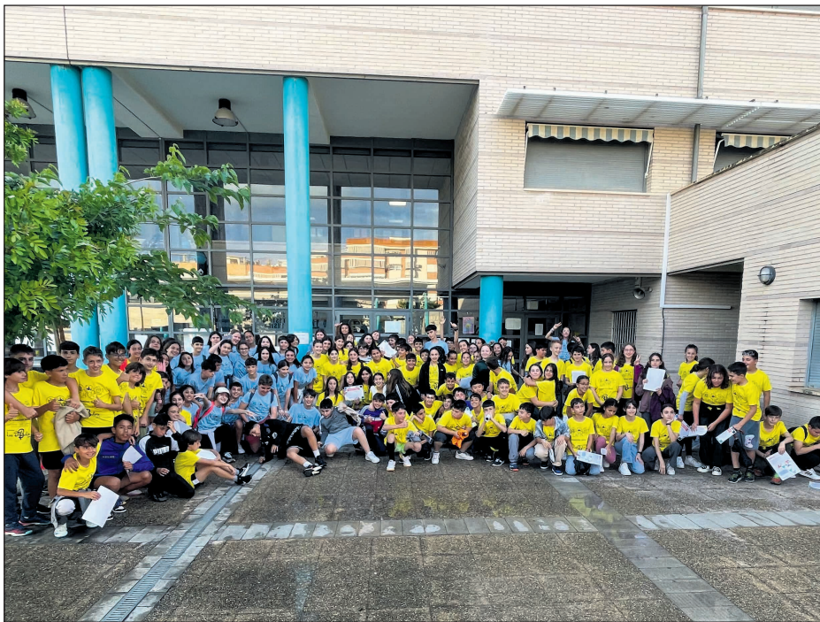
Participantes del Icosatlón en el IES Gaia

ESO, que les ayudan y les guían en este recorrido. Además, también coincidieron con parte del profesorado del instituto que tendrán en su primer año de Secundaria. Para algunas familias también es tranquilizador acompañar a sus hijas e hijos hasta el instituto este primer día de contacto y ver cómo se desenvuelven con cierta soltura ya en el que será su centro en los próximos años. Este acto pretende servir como instrumento de generación de confianza del alumnado con el propio centro, con las instalaciones, el profesorado y los compañeros, y además tiene carácter colaborativo porque las pruebas no son competitivas. Para la realización del Icosatlón se ha contado (aparte de la inestimable participación del alumnado de 1º de ESO) con la colaboración del AMPA del IES Gaia que nos ofrece una merienda de confraternidad, así como con el patrocinio de La Brodadora que nos equipa con camisetas para todos los participantes, para sentirnos miembros del mismo equipo que es la comunidad educativa del IES Gaia.