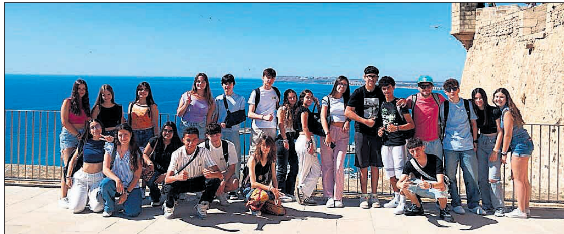
Alumnado del IES Gaia graba escenas de su cortometraje en Alicante