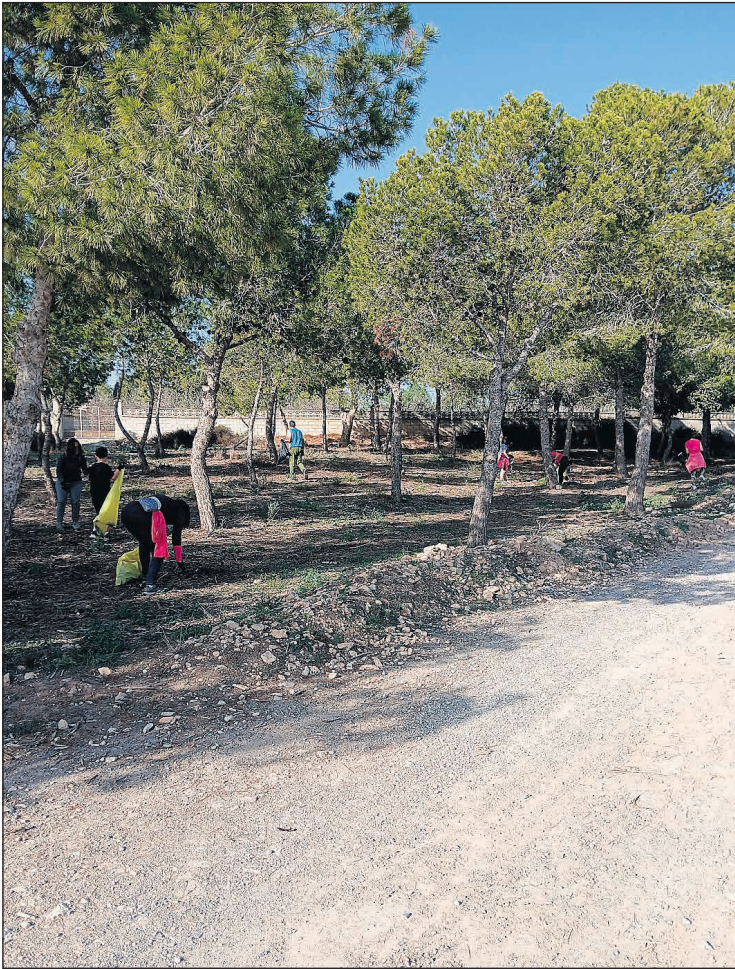
Actividades de recogida de residuos

El Consorcio Terra está formado por municipios de las comarcas de El Comtat y parte de l'Alcoià y l'Alacantí: Agres, Alcoleja, Alcosser, Alfafara, Almudaina, l'Alqueria d'Asnar, Balones, Benasau, Beniarrés, Beniloba, Benillup, Benimarfull, Benimassot, Cocentaina, Fageca, Farnorca, Gaianes, Gorga, Millena, Muro de Alcoy, l'Orxa, Planes, Quatretondeta y Tollos, junto a Alcoy, Benifallim, Ibi, Penàguila, Tibi, Agost, Aigües, Busot, Mutxamel, Sant Joan d'Alacant, Sant Vicent del Raspeig, La Torre de les Maçanes y Xixona. Junto a estas 37 entidades locales, son miembros del Consorcio Terra, la Generalitat Valenciana y la Diputación Provincial de Alicante.