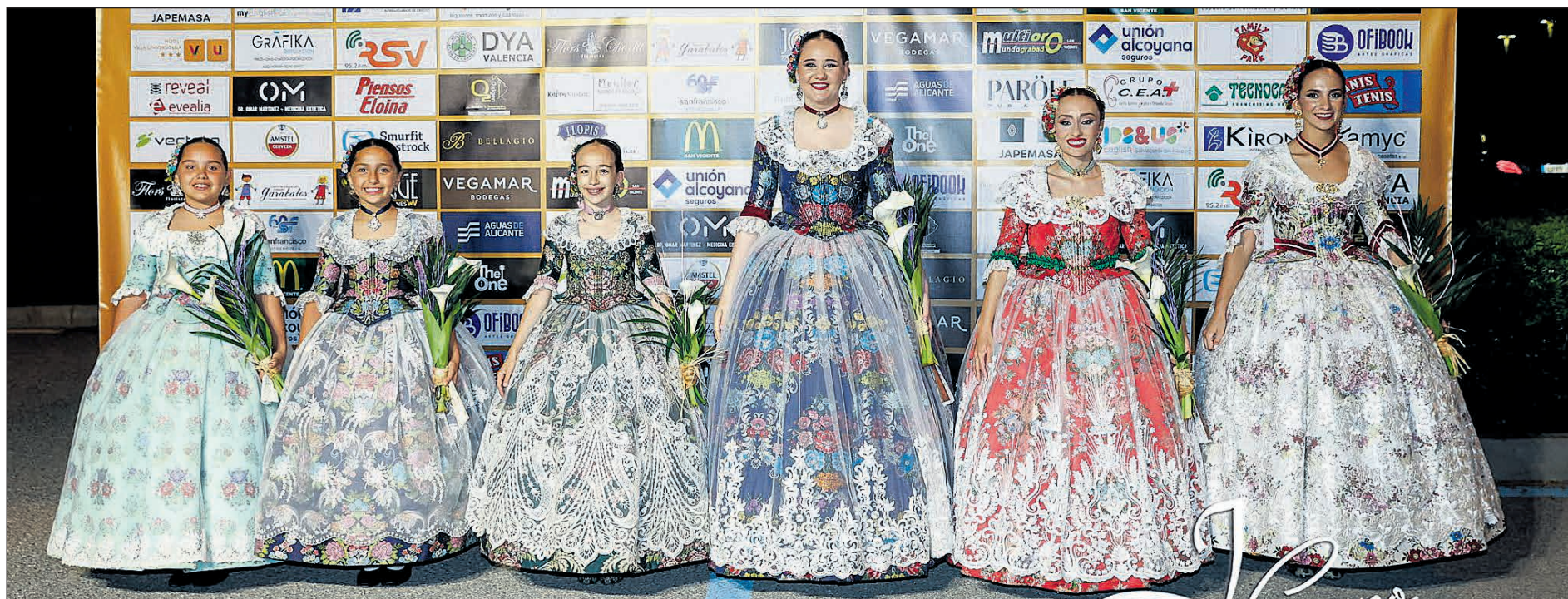
San Vicente del Raspeig vivió una jornada llena de emoción con la elección de la Belleza del Foc adulta e infantil 2025