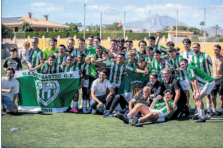
El Gimnàstic Sant Vicent ha logrado una gesta histórica al conseguir el ascenso a Primera Regional