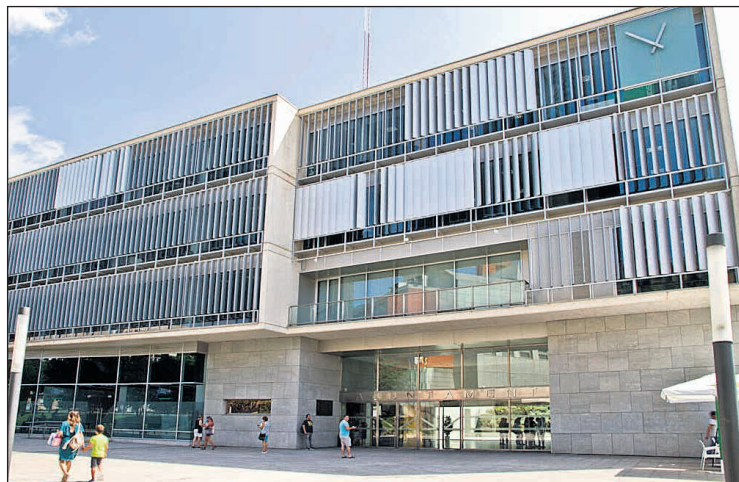
Imagen de archivo

Con esta iniciativa el Ayuntamiento da un primer paso en la implementación de este modelo de contenedores y, además, se está ultimando la apertura del servicio a todos aquellos ciudadanos interesados y comprometidos con la gestión responsable de los residuos orgánicos.