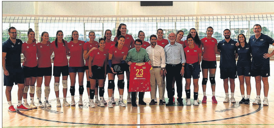
La selección española femenina de voleibol, se encuentra entrenando en el nuevo pabellón