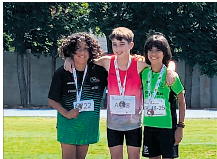
Los campeones mostrando sus medallas