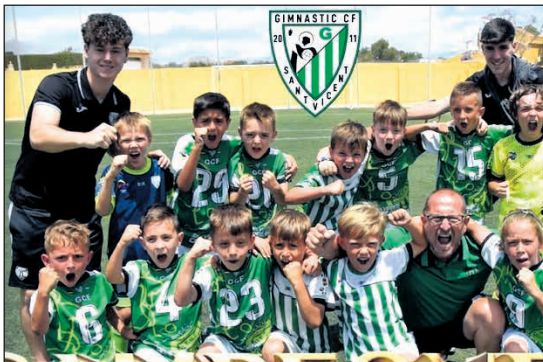
¡Enhorabuena, campeones! El futuro del club está en las mejores manos

Somos Raspeig ♦El Prebenjamín A del Gimnàstic Sant Vicent ha hecho historia proclamándose campeón de liga tras la última jornada disputada en Villajoyosa. Un logro que refleja el