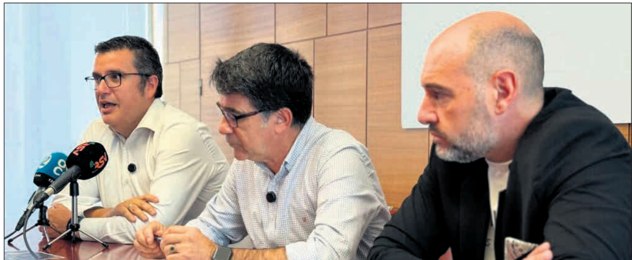
El Ayuntamiento de San Vicente del Raspeig estrenará el primer Festival de Flamenco del municipio organizado por concejalía de Cultura bajo el título Soniquete Sound