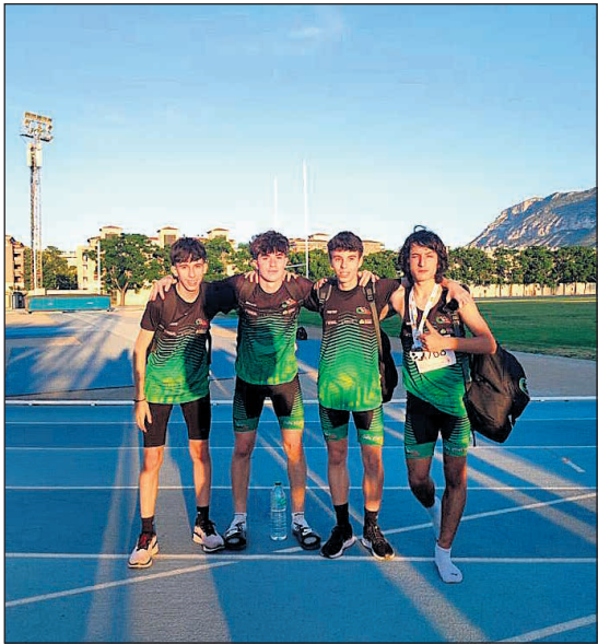
Este fin de semana han tenido lugar campeonatos de atletismo de las categorías participantes en los juegos escolares tanto a nivel autonómico como provincial