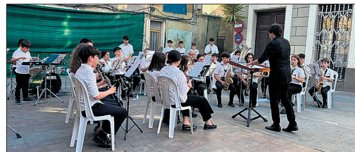
Actuación de la Banda Joven de la Sociedad Musical La Esperanza