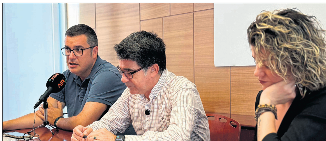
Imagen de la rueda de prensa presentando la feria del libro