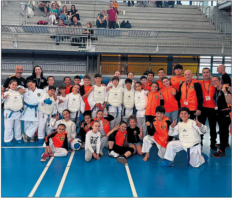
Los karatekas del club lograron una destacada actuación al obtener varias medallas en diferentes categorías