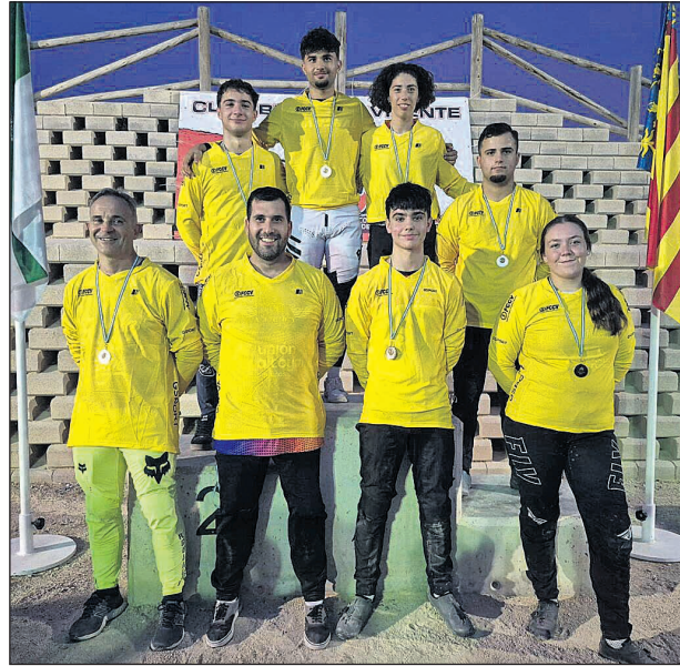
Gran actuación del Club BMX San Vicente

◆El pasado sábado, el club BMX San Vicente tuvo una destacada participación en la Copa CV, con carreras muy fluidas y resultados sobresalientes en múltiples categorías.