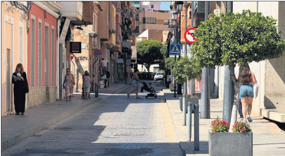
Imagen de la calle Pintor Picasso

En la calzada se retirarán los bolardos del centro tradicional y se reparará el pavimento con un material en las aceras y calzadas que reduzca el ruido del tráfico. Los trabajos incluyen la