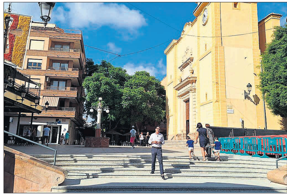
Imagen del alcalde Pachi Pascual