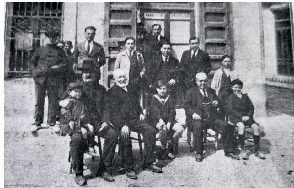
El personal de Redacción, Administración y Talleres del semanario EL RASPEIG