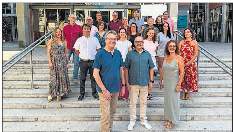
Nuevo equipo directivo

servatorio, por ello, su dedicación y experiencia han permitido que, generación tras generación, los alumnos se formen en un entorno que une tradición, innovación y valores artísticos". En este sentido, la edil ha agra-