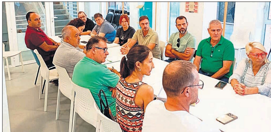
I Mesa por la Movilidad en Sant Vicent del Raspeig organizada por Compromís