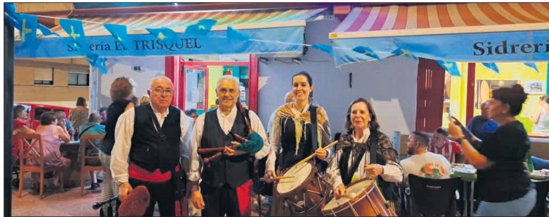
Componentes de Amigos de Rusadir