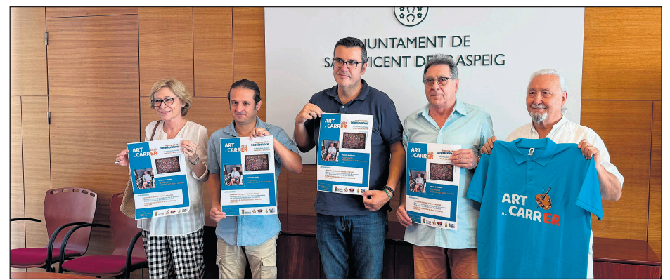
Presentación de la edición especial de Art al Carrer

“Estrenamos este fin de semana una nueva temporada de Art al carrer que, bajo el título ‘Todos a pintar’, inundará la avenida de la Libertad de artistas mostrando al público su proceso de creación durante toda la mañana del domingo”