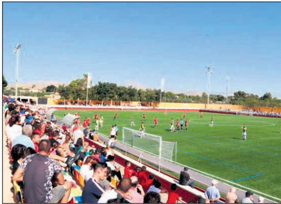
Imagen de un partido