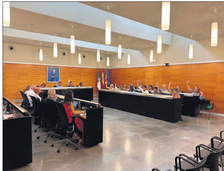
Imagen del pleno

●La sesión ordinaria de septiembre da luz verde a la creación de un segundo centro ocupacional, reclama apoyo institucional para retirar el amianto y debate sobre el empleo juvenil, las instalaciones deportivas y la gestión del nuevo pabellón.