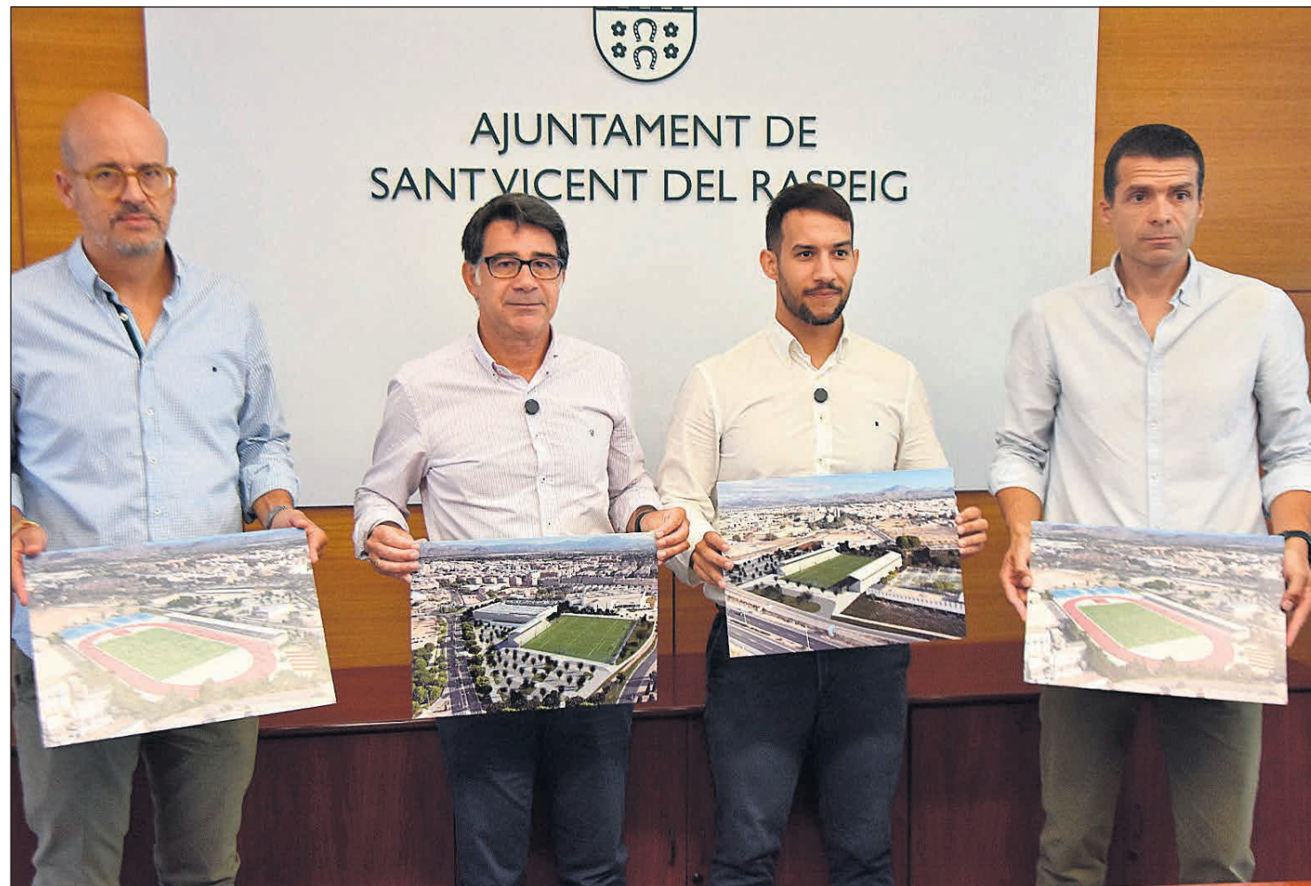
Rueda de prensa del Ayuntamiento presentando el Plan de Infraestructuras Deportivas