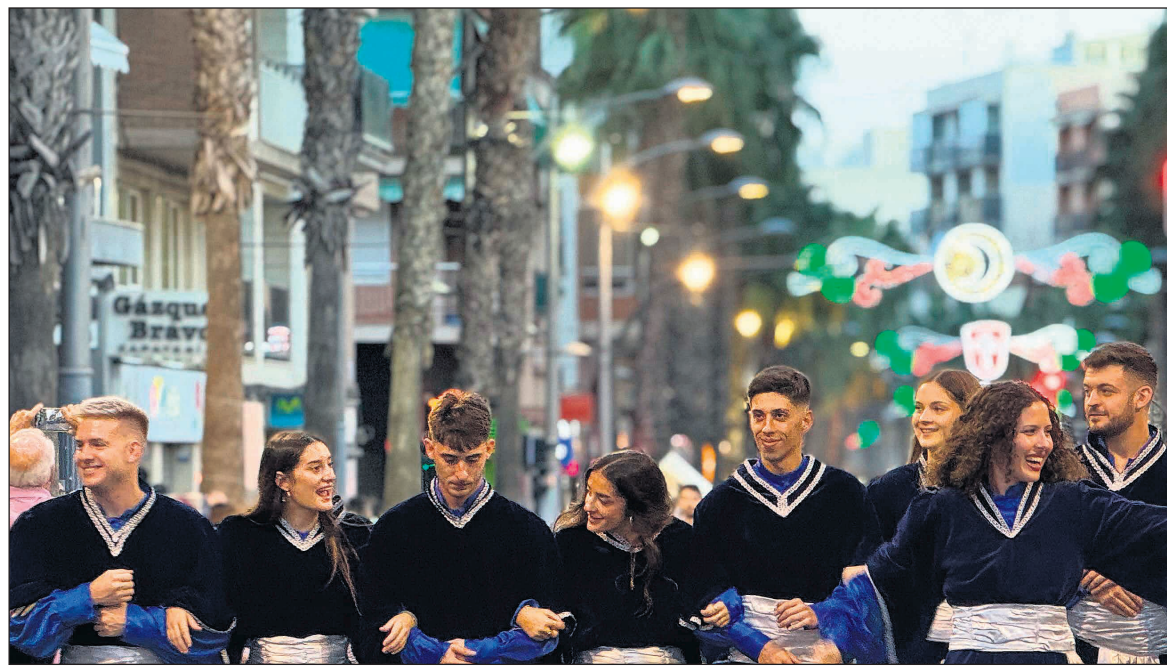
Festeros y vecinos compartirán una jornada de música, tradición y hermandad en el cierre del aniversario festero

Con motivo del Mig Any, Desde la Federación Unión de Comparsas Ber-Largas, en colaboración con el Ayuntamiento de San Vicente del Raspeig, se ha preparado una completa programación que comenzará el viernes, día 26 de septiembre, con un pasacalles, amenizado por la Asociación Musical El Tossal. Saldrá a partir de las 20 horas desde la plaza de España y se dirigirá primero al Complejo Deportivo Sur, donde se podrá presenciar el castillo de fuegos artificiales ofrecido por la concejalía de Fiestas, y, a continuación, a la plaza de España para acabar en el recinto festero.