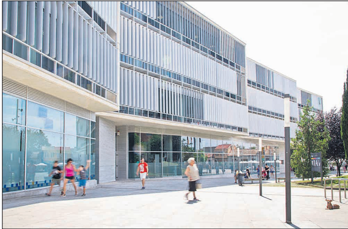
Ayuntamiento de San Vicente del Raspeig