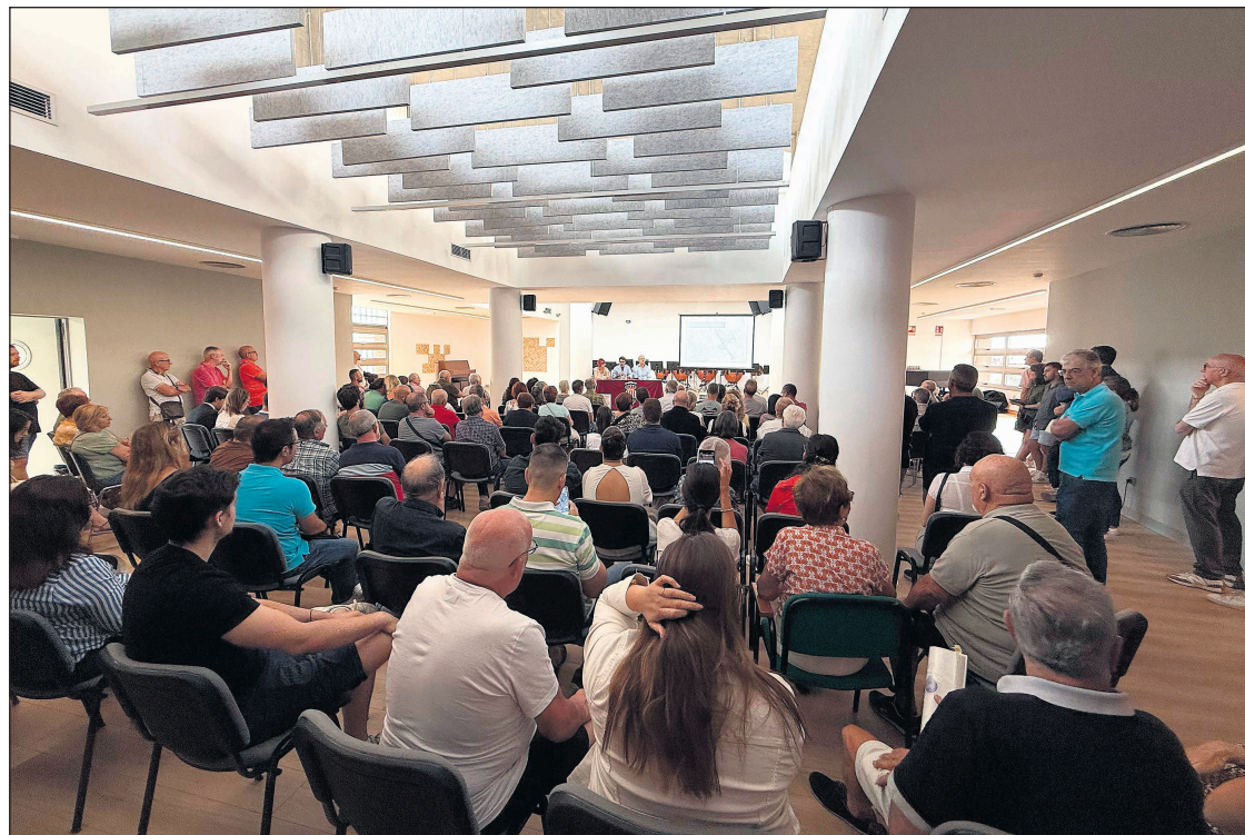
Imagen de la jornada informativa

● El Ayuntamiento de San Vicente del Raspeig ha confirmado que, a partir de mañana y hasta el 27 de noviembre, permanecerá abierto el periodo de recogida de alegaciones sobre la Modificación Puntual nº 42 del Plan General de Ordenación Urbana (PGOU) que afecta al sector PAU/7 Los Urbanos. Para facilitar a la ciudadanía la consulta de información y la presentación de sugerencias, se ha publicado en tablón de anuncios y en el área de Urbanismo de la web municipal el siguiente enlace https://raspeig.sedipualba.es/tablondeanuncios/anuncio.aspx?id=67795 . También hoy el DOGV anuncia el inicio de la exposición pública.