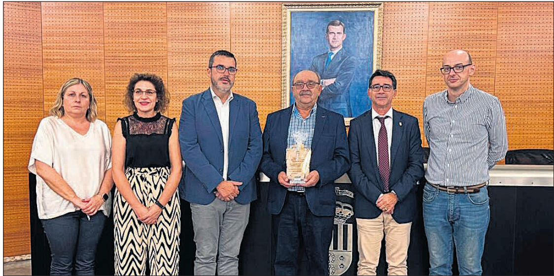
Imagen de ediciones anteriores

Somos Raspeig ♦El edil ha anunciado que “seguiremos trabajando para dar mayor protagonismo y alcance a los Premis 9 d’Octubre”. Con esta finalidad, se ha ampliado este año el aforo para arropar a los premiados con un nue-