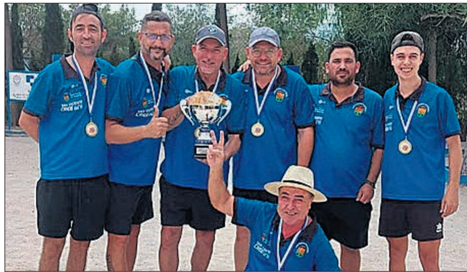
El Club Petanca San Vicente ha hecho historia al proclamarse campeón de la Liga División de Honor

Desde el club invitan a la afición a seguir apoyando a los jugadores en esta nueva cita, donde esperan seguir ampliando éxitos.