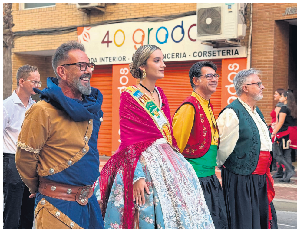
El Mig Any pondrá el broche de oro a un año de actos conmemorativos por el 50 aniversario de las Fiestas de Moros y Cristianos

Con esta nueva imagen y con un calendario repleto de propuestas, la Comparsa Cristians inicia un año muy especial en el que celebrará cinco décadas de historia, orgullo y tradición en las Fiestas de Moros y Cristianos de Sant Vicent del Raspeig.