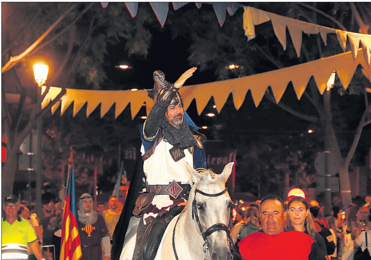
Imagen de archivo de la entrada de Jaume I

Con esta programación, el Ayuntamiento de San Vicente del Raspeig invita a la ciudadanía a celebrar dos fechas señaladas en el calendario con música y cultura, reforzando la identidad local y fomentando la convivencia a través de las tradiciones.