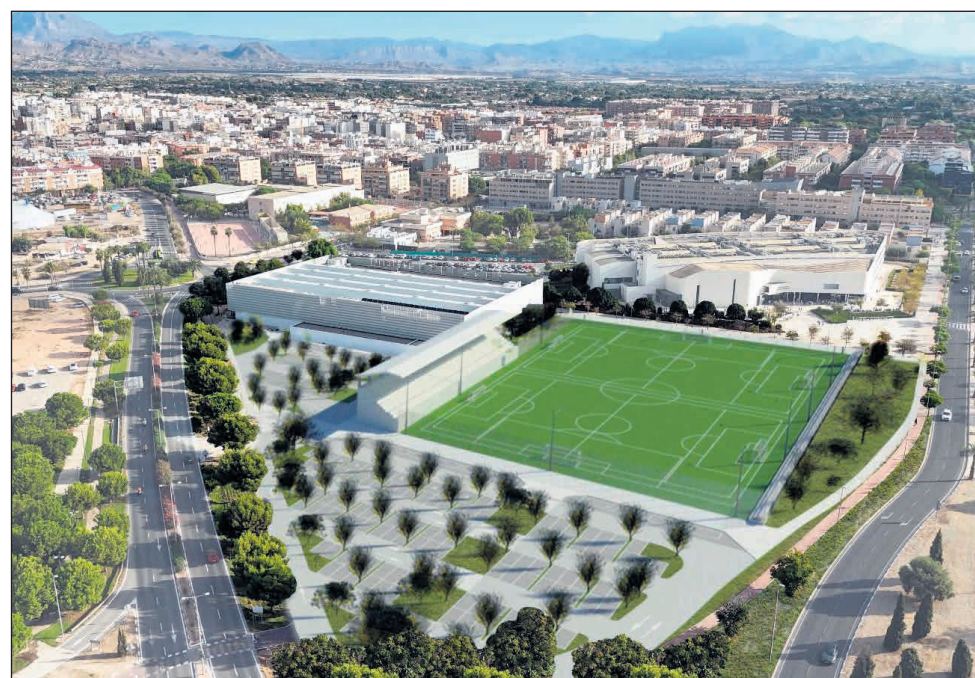
Infografías del área de El Rigas con la futura pista de atletismo, instalaciones para tiro con arco y pistas polideportivas y el nuevo campo de fútbol