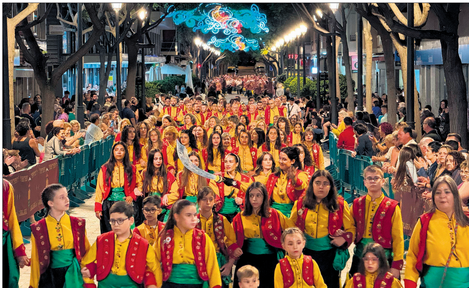
Las comparsas de San Vicente del Raspeig llenarán de color y ambiente festivo las calles en la celebración del Mig Any