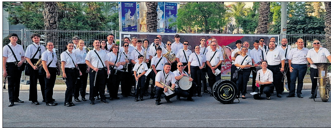
Imagen de archivo de la Associació Musical El Tossal