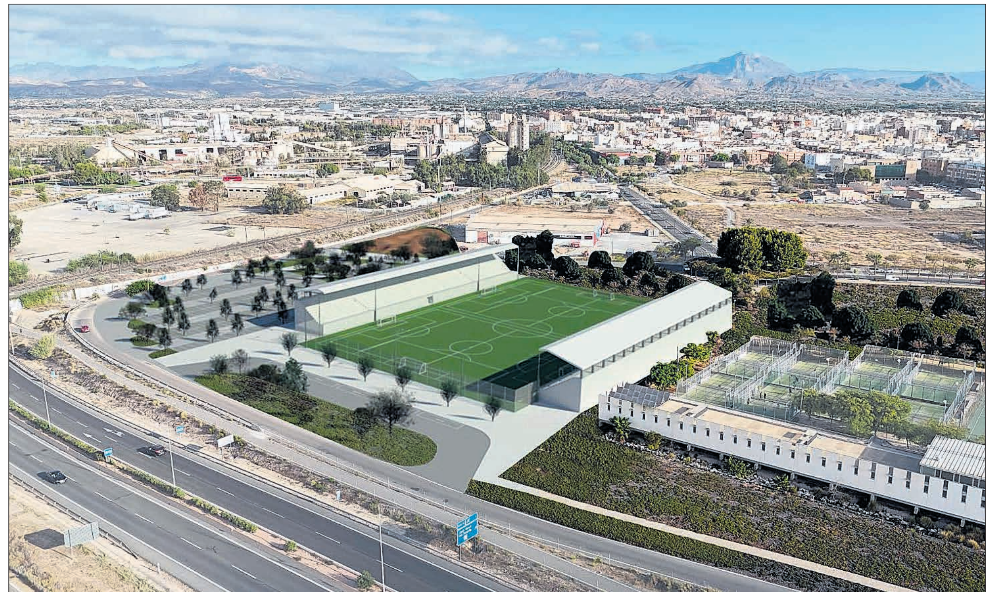
Simulación arquitectónica del complejo deportivo Sur-Velódromo, mostrando la integración entre el nuevo estadio, las pistas de pádel y áreas de ocio