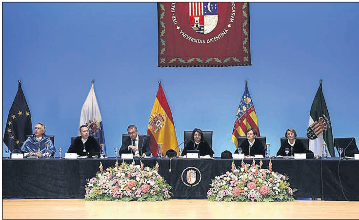
Acto de apertura de curso de todas las universidades públicas valencianas