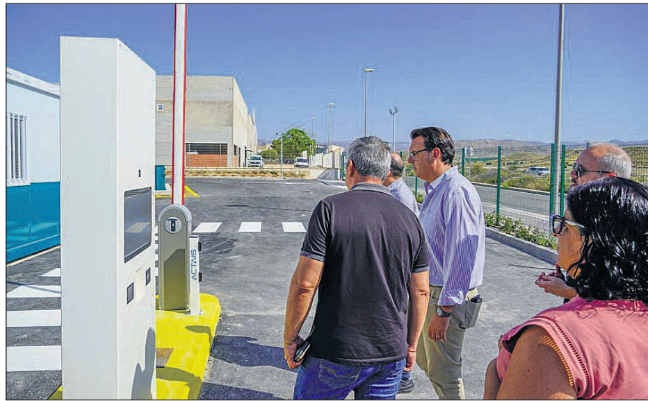
Las 12 instalaciones fijas de la entidad, gestionadas por PreZero, han supuesto un impulso a la economía circular del área de gestión de la que forman parte 37 municipios