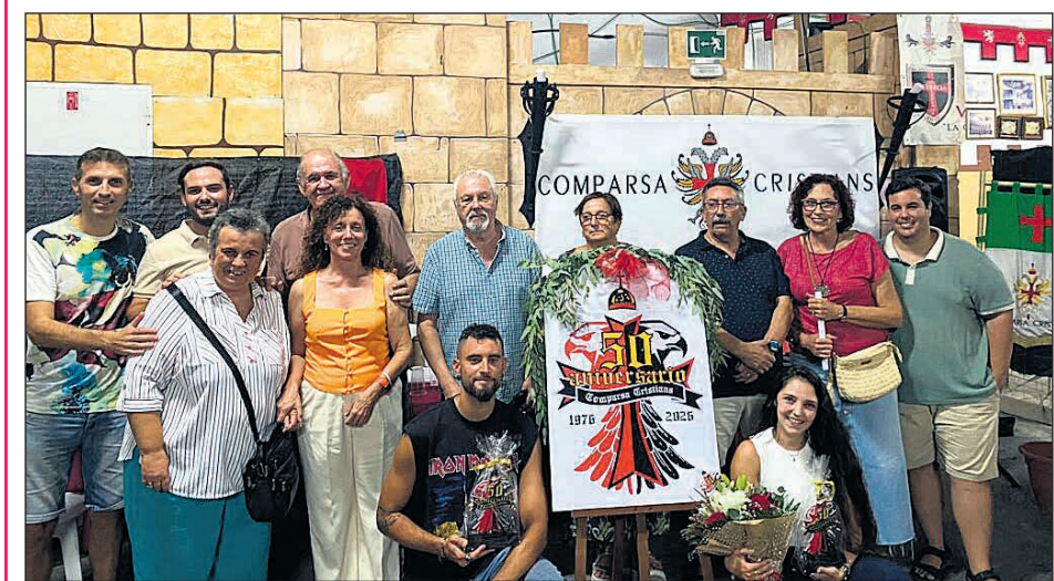
Cristians ha presentado oficialmente el nuevo logo conmemorativo de su 50 aniversario

vicenteros participarán bajo las banderas de las 20 comparsas, que volverán a teñir de color las calles del municipio. Los actos del sábado finalizarán en el recinto situado en la partida Inmediaciones, donde, a partir de las 22 horas, se volverán a reunir a todos los festeros en la segunda cena de hermandad. La noche contará con una sesión de discoteca musical abierta al público. El domingo, 28 de septiembre, las actividades arrancarán por la mañana, a las 9 horas, con la Diana Festera, seguida de actividades dirigidas a público de todas las edades. A partir de las 11.30 horas los más pequeños de cada comparsa podrán disfrutar de hinchables y diferentes talleres, además de los concursos de dibujo y redacción. Al mediodía, se dará paso al tradicional concurso de paellas, que precederá una gran comida de hermandad. Por la tarde, en el Solar de la Festa se realizarán actividades infantiles para despedir esta nueva edición del Mig Any.