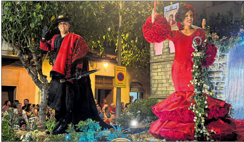
Los capitanes cristianos en su carroza el día de la entrada

año, la Comisión de Fiestas de Moros y Cristianos de Mutxamel repartió un total de 316 kilos entre más de 150 tiradores. Llegaba el día 10 y la fiesta se palpaba en el ambiente, la diana anunciando que la fiesta ya estaba en la calle era el preludio de lo que le quedaba a Mutxamel por delante, días de fiesta, desfiles, pólvora y una majestuosidad en sus desfiles. La mañana venía marcada por la entrada de bandas, donde las once bandas de las once comparsas fueron desfilando hasta el castillo. Allí esperaban hasta la última para recibir a José Tomás Moñinos, el director del himno de fiestas que todos los vecinos y festeros cantaron y con el que se daba por empezadas las fiestas. La tarde llegaba y era el momento de poner sobre una Avenida Carlos Soler ataviada para la ocasión todo lo que las once comparsas tenían preparado para la espectacular entrada. Las capitánias no defraudaron, la Comparsa Contrabandistas mostró con orgullo sus tesoros, la alegría de su música y el alma de su cultura, recordando a los que no están y con la majestuosidad del abanderado cristiano, imponente y portado por sus caballeros. A lo lejos se vislumbran los capitanes, que sobre una carroza que representa el Assut de Mutxamel llegan con la alegría característica de los 150 años de historia. La Comparsa Els Pacos nos situaba en la Guerra del Riff con