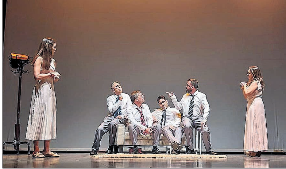
Imagen de archivo de una de las representaciones de Mutxamel a escena

xamel está inmerso en una nueva edición de su XI Certamen de Teatro Amateur "Mutxamel a Escena", que tendrá lugar durante el mes de octubre en el municipio. Este certamen se ha consolidado como un referente cultural que permite a los amantes del teatro disfrutar de obras variadas, que van desde el drama y la comedia clásica hasta el musical, interpretadas por compañías amateurs de gran trayectoria. El programa se inauguró el viernes 3 de octubre a las 20:00 horas con "Madrid 19-67", de Paraskenia Teatro. Esta obra, estrenada en 2023, es un drama que mezcla memorias, re-