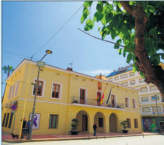
Fachada del Ayuntamiento de Mutxamel