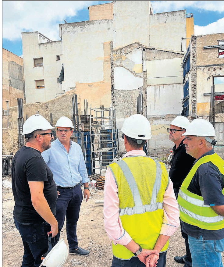
Reunión sobre el terreno para supervisar la obra

que la actual biblioteca no cumple con los requisitos de la Xarxa de Biblioteques desde la legislatura 2007-2011. Con la nueva instalación, Mutxamel podrá integrarse plenamente en la red autonómica y acceder a futuras subvenciones. Durante los últimos años, el Ayuntamiento ha impulsado diversas acciones para reforzar el sistema bibliotecario, como la creación de la figura del facultativo bibliotecario