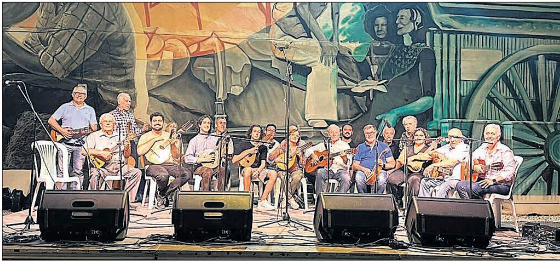
El So de Mutxamel en el Aplec de Sonadors

Som Mutxamel ♦ El municipio de Mutxamel celebró el pasado 27 de septiembre el Aplec de Sonadors, una cita cultural dedicada a la música y a las tradiciones populares valencianas. El evento, organizado en el Mercat Municipal, contó con entrada libre y registró una destacada afluencia de público. La programación se inició a las 19:30 horas con una dansà desde la puerta del Ayuntamiento, en la que participaron los grupos locales Nanos, la Colla de dolçainers