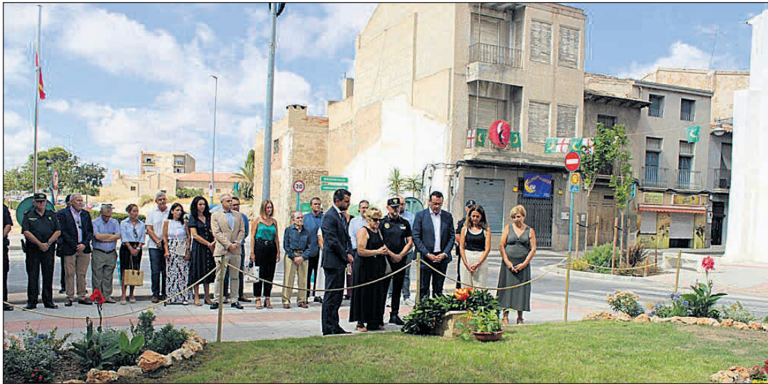
Familiares de los fallecidos junto al alcalde y miembros de la corporación municipal