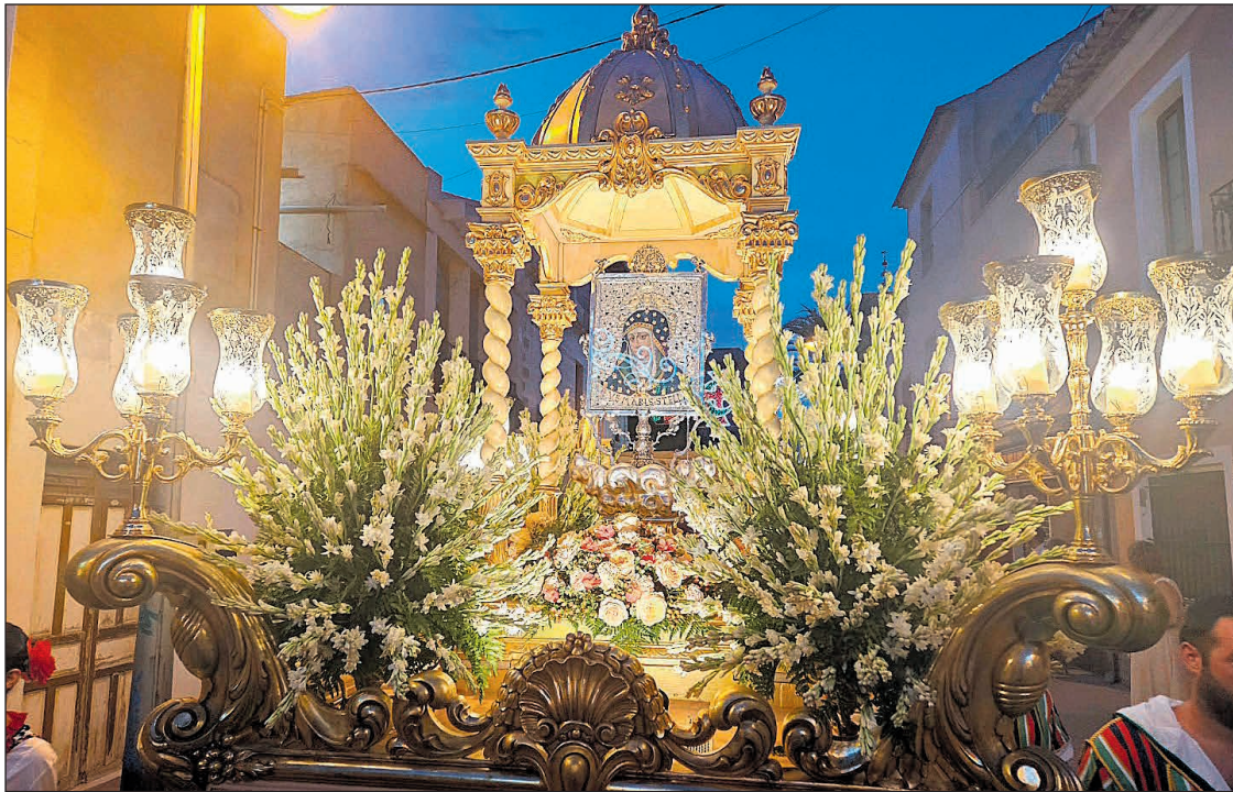
La Mare de Déu de Loreto en su carroza el día 9 de septiembre