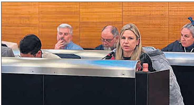
Imagen de archivo de una sesión plenaria