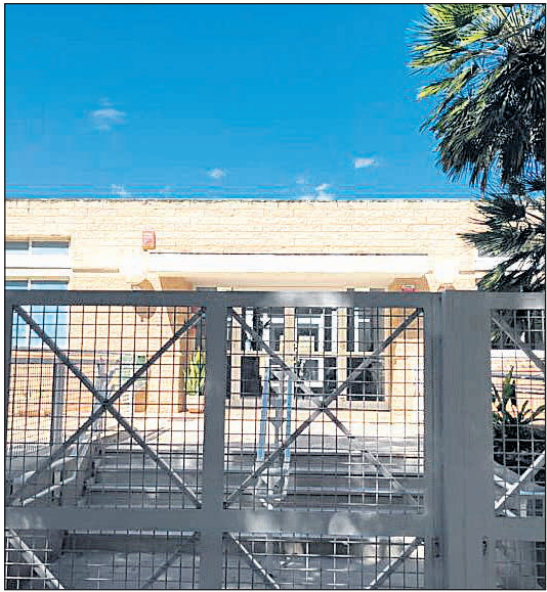
Aprueban la construcción del segundo centro