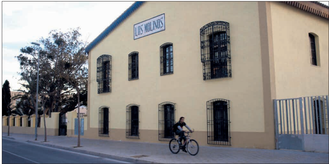
El evento se celebrará en el Centro de Recursos Juveniles Los Molinos (c/ Enric Valor, 2)