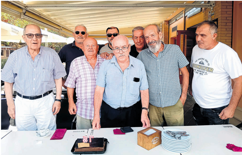
Un momento de la celebración