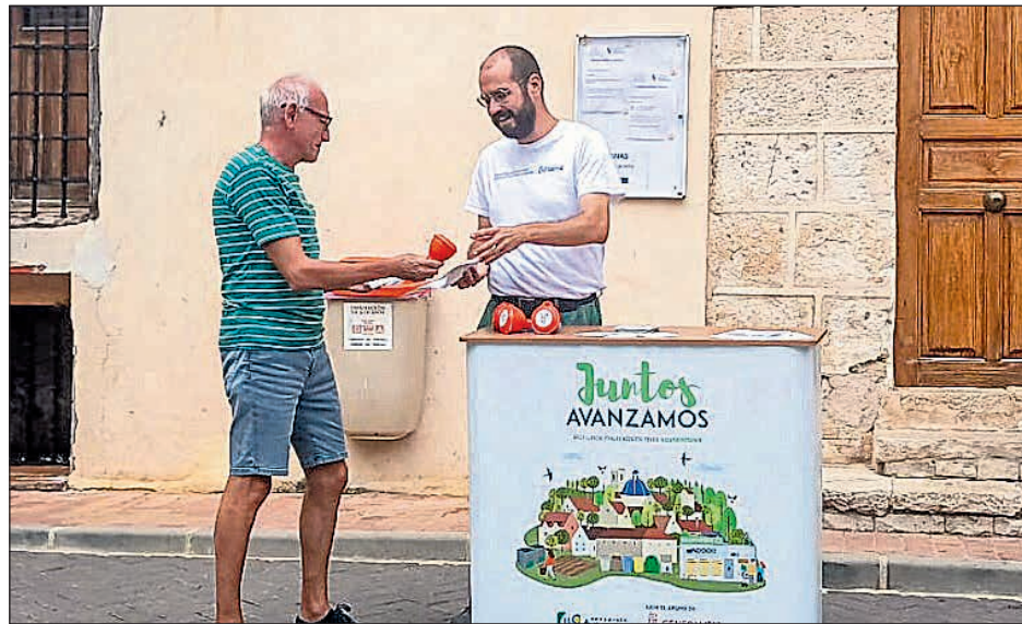
Los educadores y educadoras están distribuidos por núcleos poblaciones

Somos Raspeig ♦El Consorcio Terra, que gestiona los residuos de 37 municipios de las comarcas del Comtat, l'Alacantí y l'Alcoià, ha recibido una subvención de la Conselleria de Medio Ambiente, Infraes-