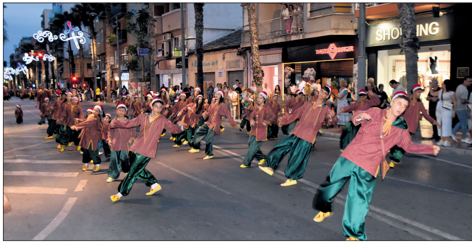
El bando moro recorriendo la avenida con sus atuendos habituales