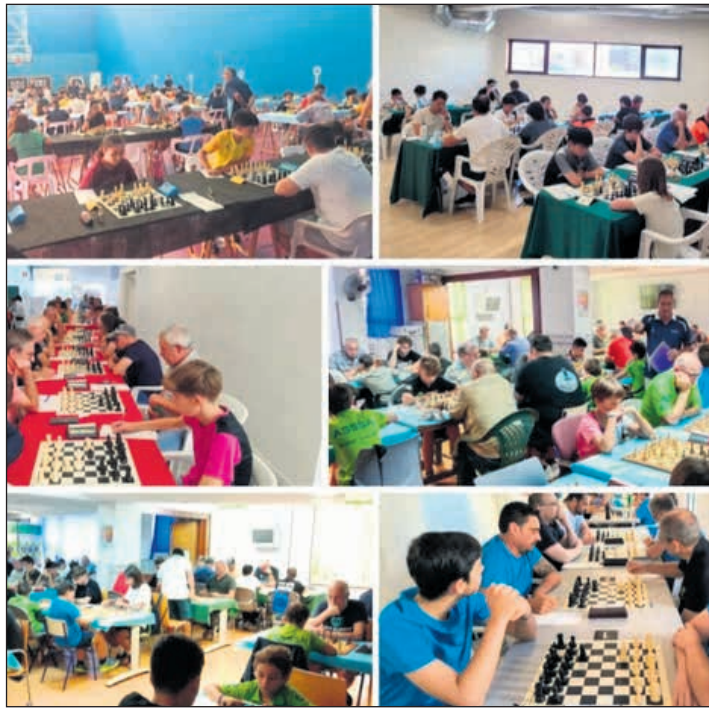
Participantes en este campeonato