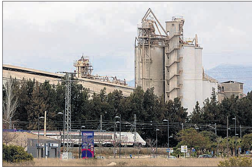
Imagen de archivo de la cementera