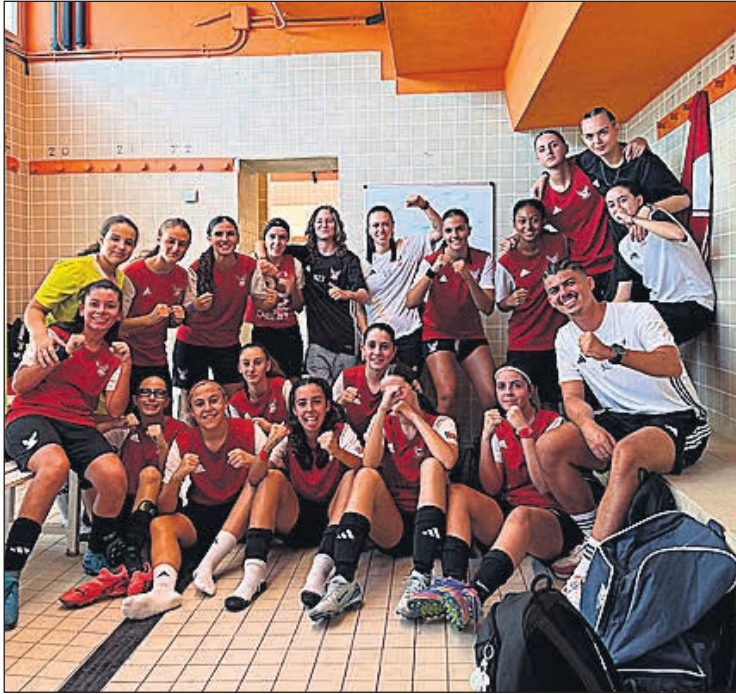
El equipo cadete del InproSport