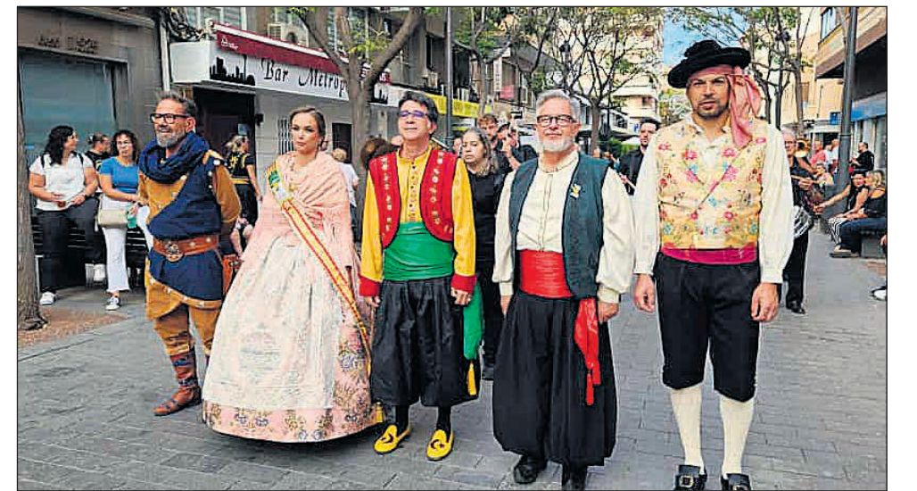
El alcalde y concejal de Fiestas acompañando a la Reina de las Fiestas

actividades infantiles que cerraron el programa del Mig Any, poniendo punto final a un fin de semana inolvidable. Con estos actos, San Vicente despidió un año muy especial en el que se conmemoró el medio siglo de historia de sus Fiestas de Moros y Cristianos. El esfuerzo de las comparsas, la implicación de la ciudadanía y la emoción compartida en cada acto reflejaron la importancia de esta tradición, que sigue creciendo y consolidándose como una de las señas de identidad más queridas del municipio.