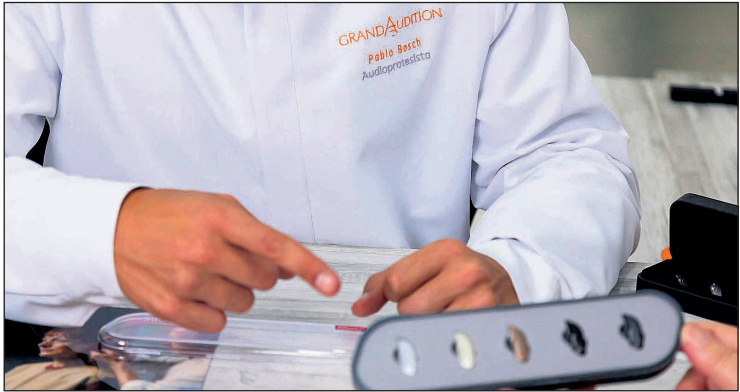
Celebran su aniversario con el firme propósito de seguir mejorando y prestando el mejor servicio

En Grandaudition San Vicente del Raspeig contamos con equipamiento de última generación que nos permite realizar evaluaciones auditivas completas y precisas. Nuestros audiólogos especializados analizan cada caso de manera detallada para poder recomendar la solución auditiva más adecuada, ya sea mediante audífonos discretos y potentes, ayudas técnicas personalizadas o programas de seguimiento continuado. La combinación de tecnología avanzada y atención humana es nuestra seña de identidad. Sabemos que