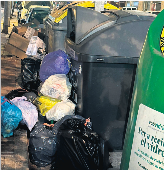
Basura en las calles de San Vicente