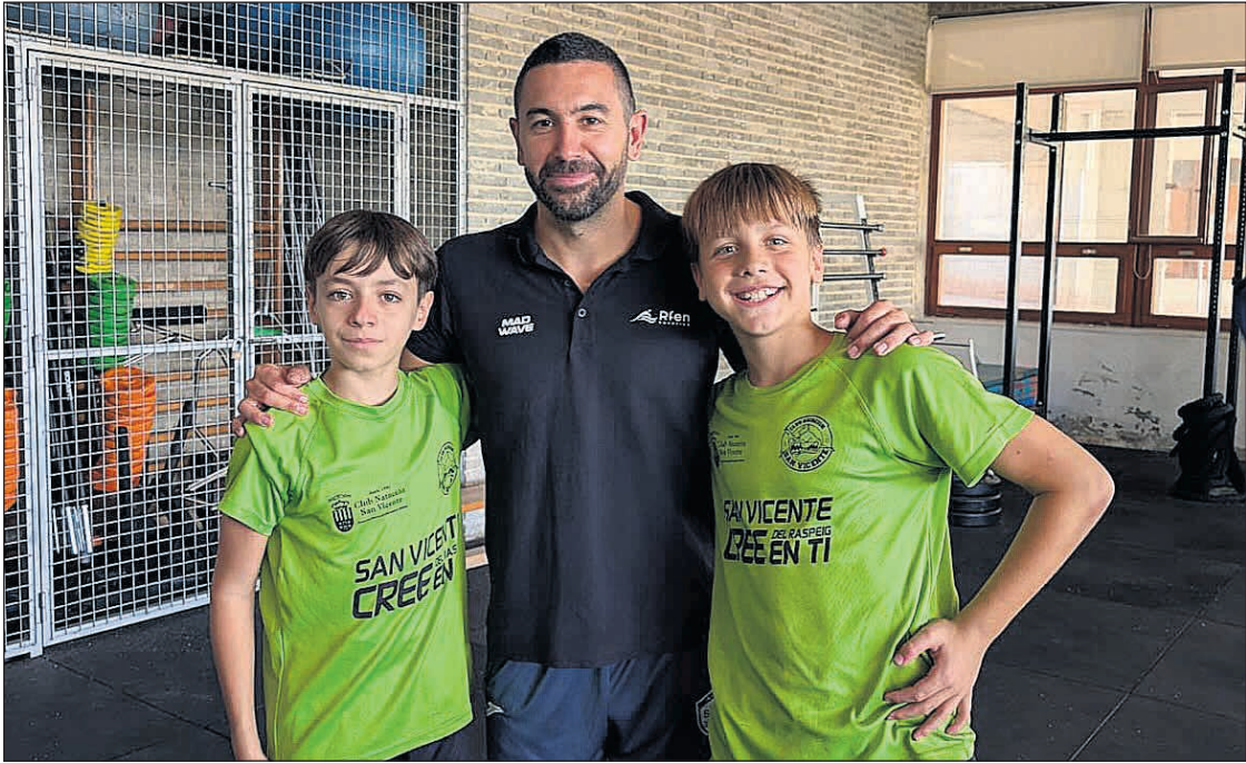
Los dos integrantes del Club Natación San Vicente