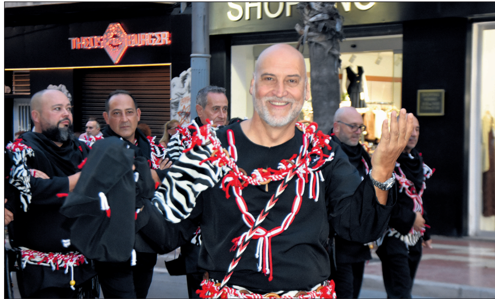
Los festeros llenaron las calles de alegría y celebración

calles de la localidad encabezada por el Bando Cristiano y seguida por el Bando Moro. Miles de sanvicenteros participaron bajo las banderas de las veinte comparsas del municipio, llenando el desfile de música, color y alegría. Tras el recorrido, la fiesta continuó en el recinto festero con la cena de hermandad y una animada sesión musical que reunió a comparsistas y vecinos.