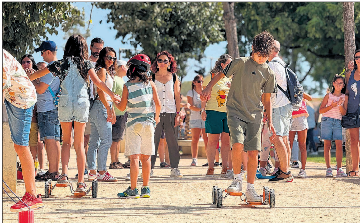
Imagen de la edición del año pasado