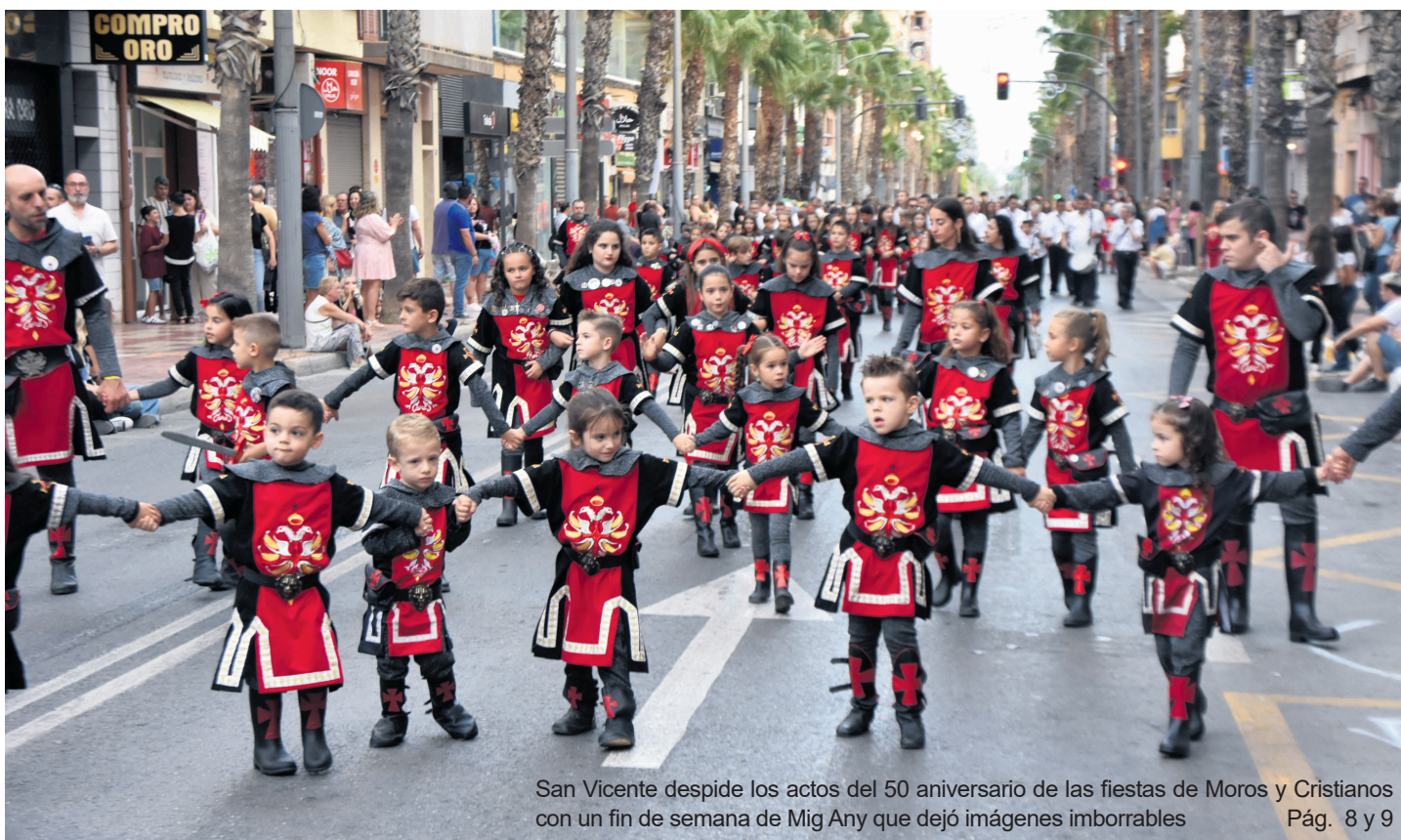
San Vicente desfiló los actos del 50 aniversario de las fiestas de Moros y Cristianos con un fin de semana de Mig Any que dejó imágenes imborrables