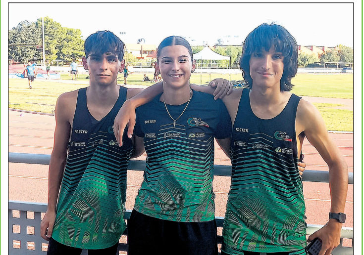
La temporada de atletismo no podía empezar mejor para el Club Atletismo San Vicente