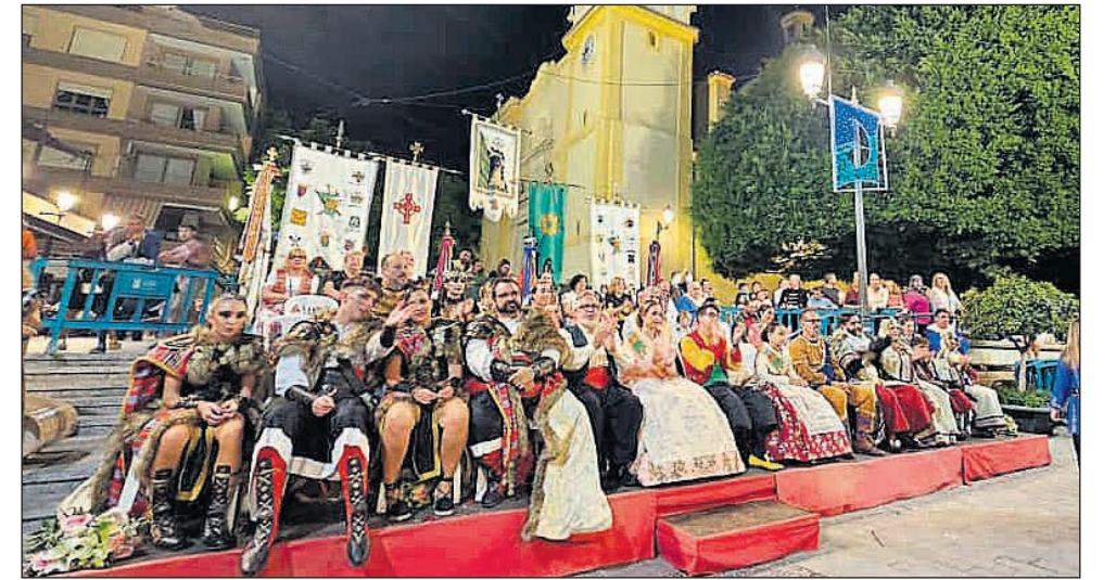
Los cargos cerraron un emotivo 2025 festero

◆ El domingo, desde las nueve de la mañana, arrancó la jornada con la Diana Festera, que despertó la ciudad con música y ambiente festivo. A lo largo de la mañana se ofrecieron actividades para todos los públicos, con hinchables, talleres y concursos pensados especialmente para los más pequeños. El tradicional concurso de paellas reunió a centenares de personas alrededor de los fogones, dando paso a una comida de hermandad que volvió a poner de manifiesto el carácter participativo de la fiesta. Por la tarde, el Solar de la Festa acogió nuevas