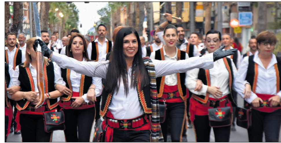
El bando cristiano abrió el desfile en este año del 50 Aniversario