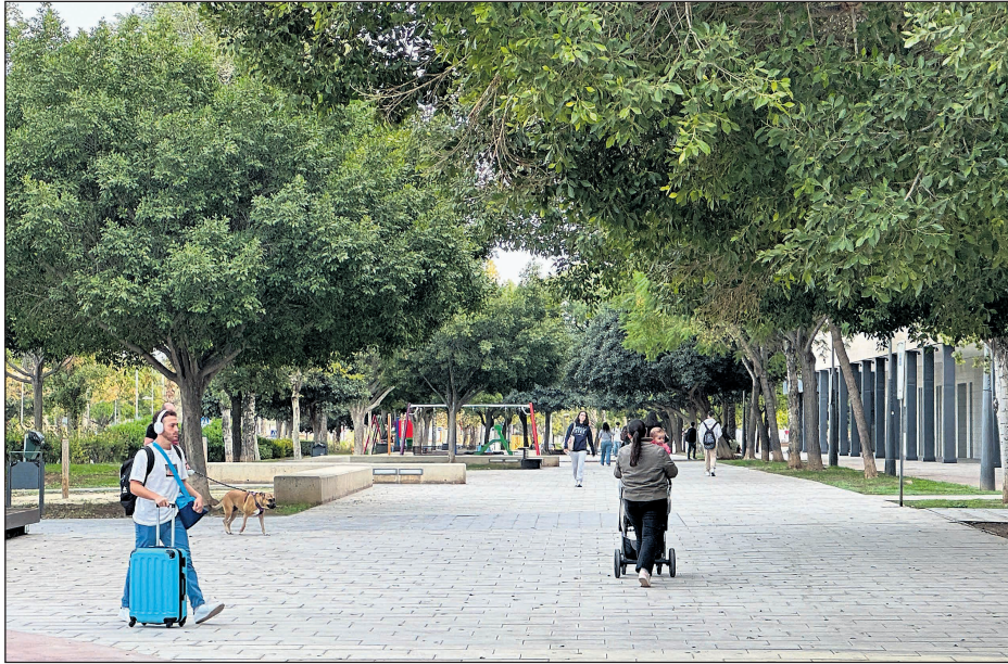
El área de Medio Ambiente impulsa la mejora de este importante pulmón con una nueva red de riego y la renovación del ajardinamiento