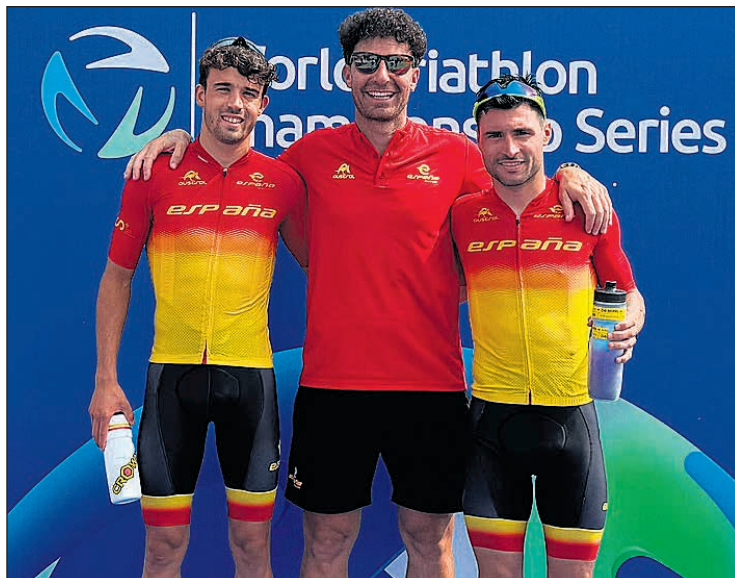
El UA Triatlón vuelve a destacar a nivel internacional

a los socios y participantes en un calendario completo de jornadas de pesca deportiva. Esta temporada está subvencionada por la Concejalía de Deportes y el Ayuntamiento de San Vicente del Raspeig, apoyo fundamental para fomentar y mantener viva la actividad deportiva local y el espíritu de compañerismo que caracteriza a este club. ¡Mucha suerte a todos los participantes en esta nueva temporada!