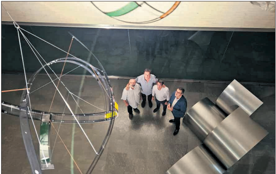
La concejalía de Cultura ha transformado el hall del Ayuntamiento en un espacio dedicado al arte con la nueva exposición del escultor Miguel Bañuls

habitamos". Para acompañar esta pieza, el escultor ha seleccionado otra titulada 'Espacio robado' que, en contraste con la anterior, está al nivel suelo. Bañuls ha aclarado que la pieza, cedida temporalmente por el Instituto de Cultura Alicantina Juan Gil-Albert, está fundamentada en la noción de que "curvar un mismo sólido provoca que ocupe un mayor tamaño, en un juego de significado profundamente simbólico". El artista abstracto traslada con esta exposición "la atracción por un universo donde las líneas paralelas al final se cortan, donde la suma de los ángulos de un rectángulo no es de 180 grados, donde la línea recta no es la distancia más corta o donde esta varía con la velocidad". A la inauguración de la muestra de Bañuls ha asistido el alcalde de San Vicente del Raspeig, Pachi Pascual, acompañado del concejal de Cultura y de numeroso público que ha podido ver, por primera vez, la combinación de las dos esculturas metálicas de gran tamaño que se podrán visitar en el hall del Ayuntamiento en horario de 9 a 20 horas hasta el 30 de noviembre.