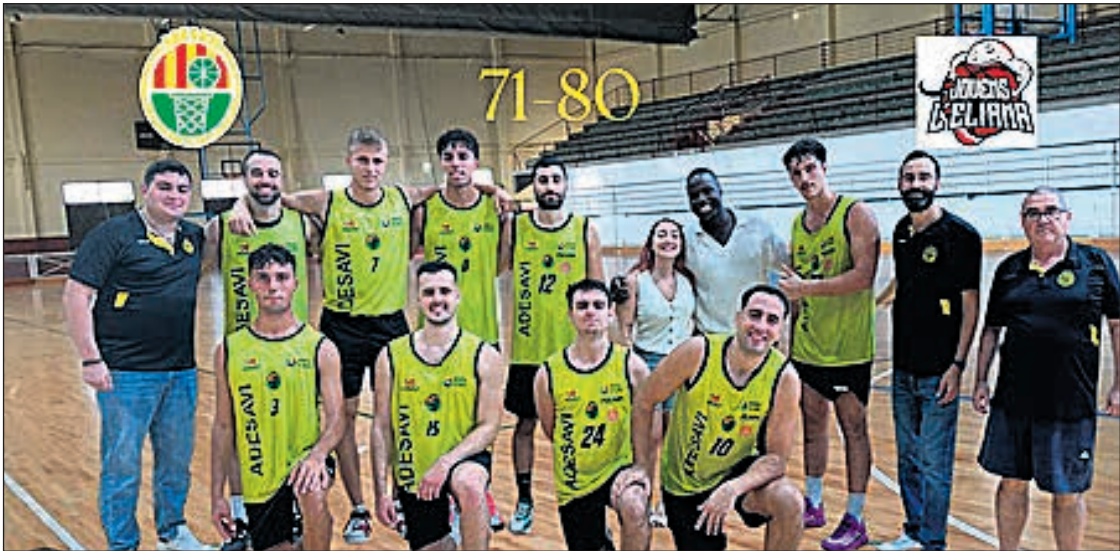
Equipo del PersonalHome Adesavi