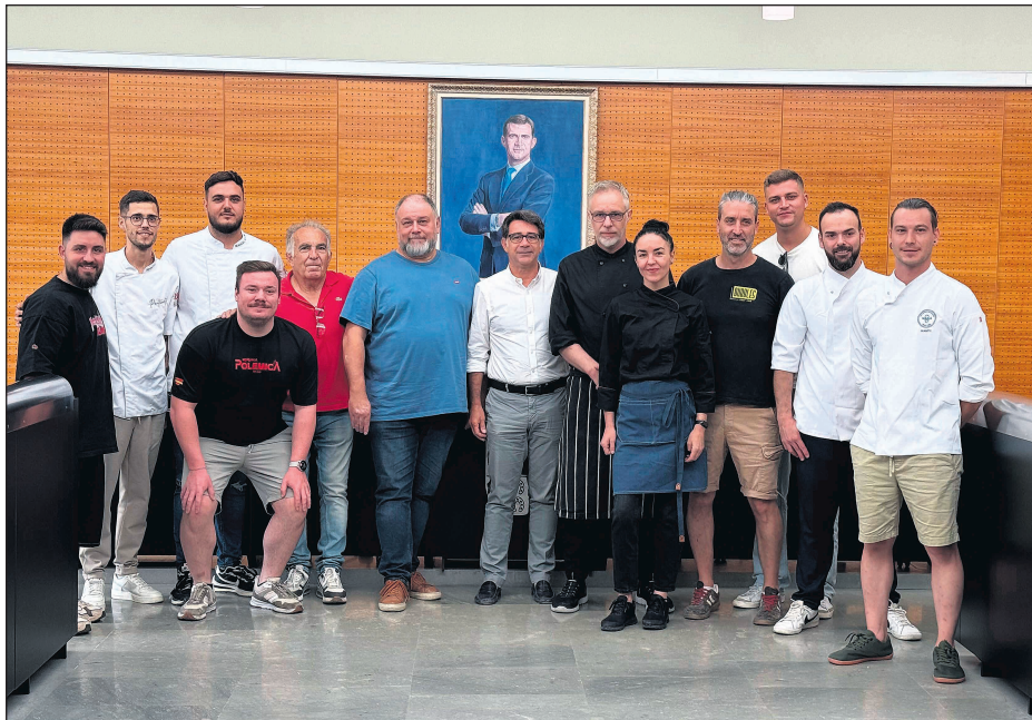
Los hosteleros y comerciantes acudieron al ayuntamiento antes de la feria

Ofrecerán degustaciones, productos exclusivos y propuestas culinarias representativas del municipio. Cada uno llevará lo más especial de su carta o producción para compartirlo con visitantes y aficionados a la gastronomía. La feria tendrá lugar este fin de semana en el Recinto Ferial. Uno de los momentos más esperados será el show cooking organizado específicamente para San Vicente: chefs locales prepararán platos en directo, explicando técnicas, ingredientes y secretos ante el público asistente. Esta actividad abrirá una ventana para que los visitantes conozcan de cerca el saber hacer culinario de la ciudad. La colaboración de la Concejalía de Comercio y Hostelería ha sido clave para que esta iniciativa sea posible. Bajo el liderazgo de Vicente Pastor, la concejalía ha facilitado la coordinación entre los negocios participantes, la difusión institucional y la logística necesaria para que