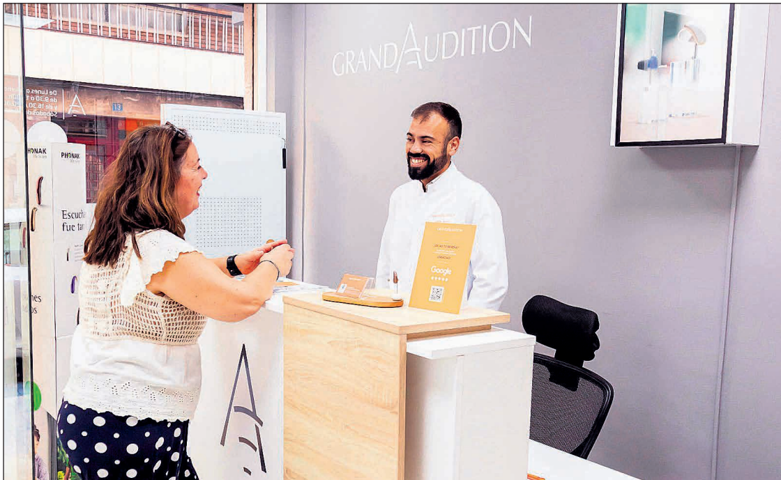
Te atienden en la calle Pintor Picasso para ofrecerte el trato más cercano y profesional

cada persona y cada oído son únicos. Por ello, dedicamos el tiempo necesario a escuchar, entender y acompañar a cada paciente en todo el proceso, desde el diagnóstico inicial hasta la adaptación y el seguimiento posterior.