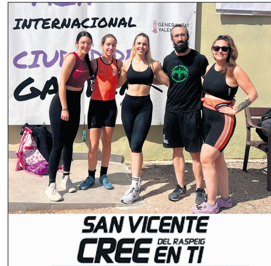
Integrantes del Power San Vicente