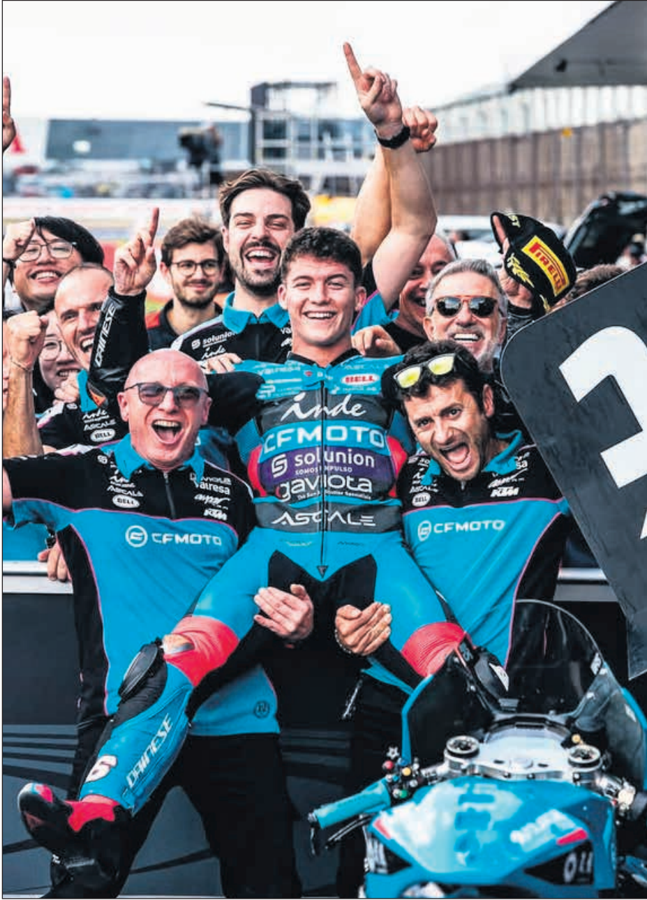
Otro éxito para el deportista sanvicentero

En el plano estrictamente deportivo, el triunfo en Japón le permite sumar unos puntos vitales que lo acercan a los puestos de honor de la clasificación. Aunque aún queda campeonato