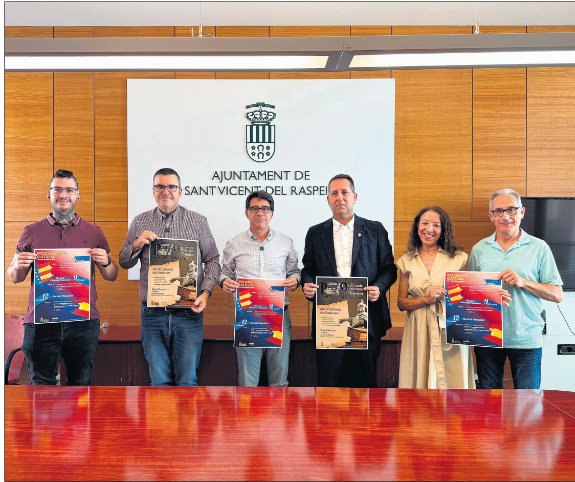
Presentación en el ayuntamiento de la programación de esta festividad

La misma tarde del miércoles, 8 de octubre, a las 19.30 horas, dará comienzo la entrada triunfal de Jaume I que realizará un recorrido a caballo desde la plaza de Santa Faz hasta las escaleras de la plaza de España. Desde este emblemático lugar dirigirá unas