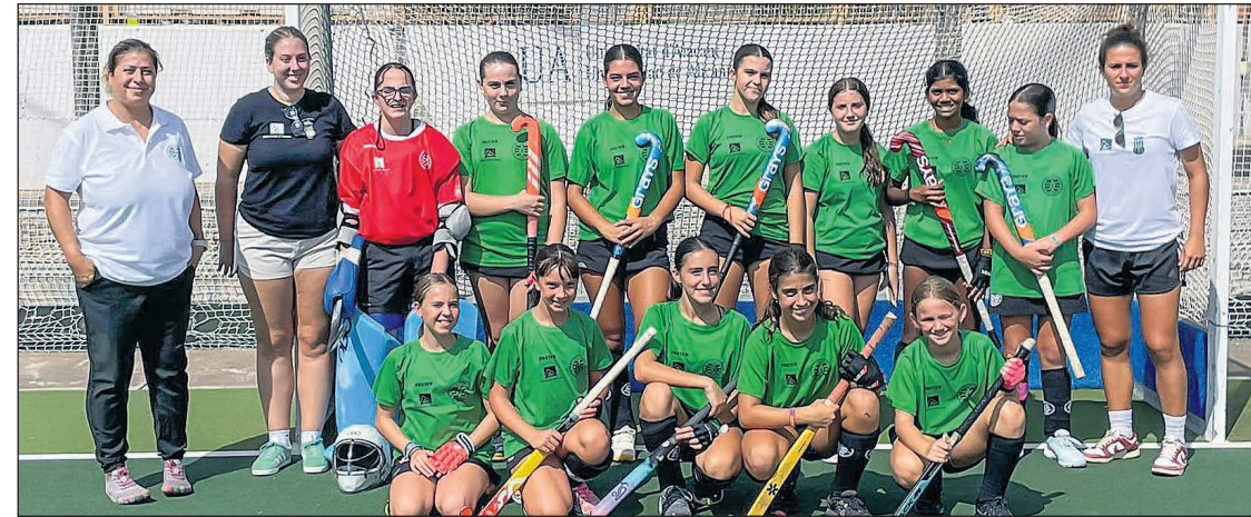
Uno de los equipos de la base del Atlético San Vicente