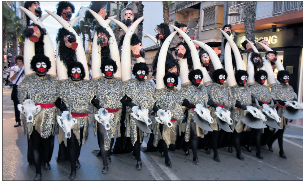
San Vicente disfrutó de un gran colorido durante el Mig Any