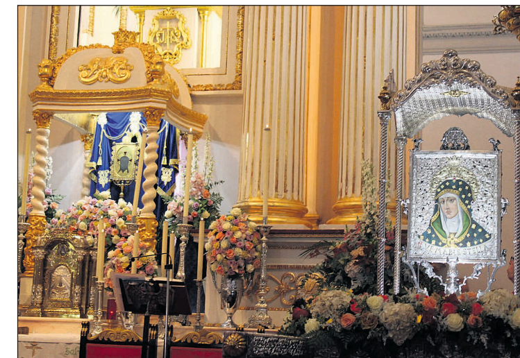
La Santa Faz visitó Mutxamel con motivo de la coronación

Mutxamel despidió así un año lleno de devoción y exaltación a su patrona que ha concluido con el orgullo de haber vivido un acontecimiento que quedará grabado en su memoria colectiva, como reflejo de un pueblo que sabe mantener vivas sus tradiciones y mirar al futuro con esperanza.