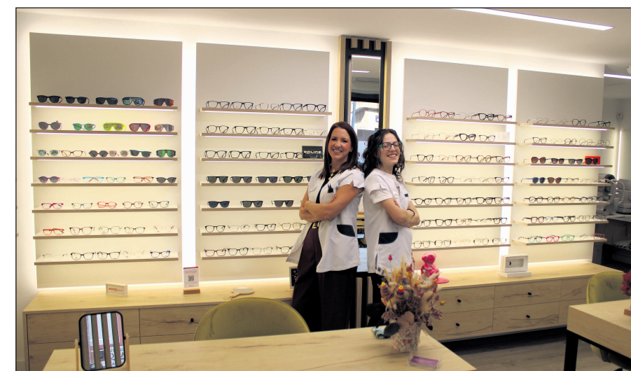
El equipo de Claravisión

15 años trabajando con todo el cariño que me cabe". El sello de identidad de Claravisión se encuentra precisamente en este equilibrio, una fórmula exitosa que combina: "Tecnología, profesionalidad y trato humano." Para sus pacientes, el centro no es un simple dispensador de productos, sino un lugar de seguimiento completo de su salud, diferenciándose de la competencia por la cercanía y la búsqueda constante de soluciones personalizadas y de calidad. La permanencia de Claravisión no ha sido pasiva. El sector óptico ha evolucionado drásticamente, y la adaptación ha sido, en sus propias palabras, "parte de nuestro ADN". La clave ha sido la apuesta temprana por la innovación. El centro se ha posicionado a la vanguardia incorporando técnicas y equipos que, hasta hace poco, eran poco habituales. Entre los servicios que los pacientes más valoran se encuentran el control de miopía infantil con biómetro, que permite un seguimiento preciso de la evolución ocular; la adaptación de lentes de contacto esclerales, una solución