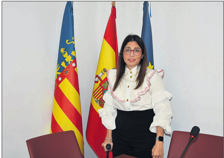
Estefanía Moreno, concejala de Igualdad de Mutxamel