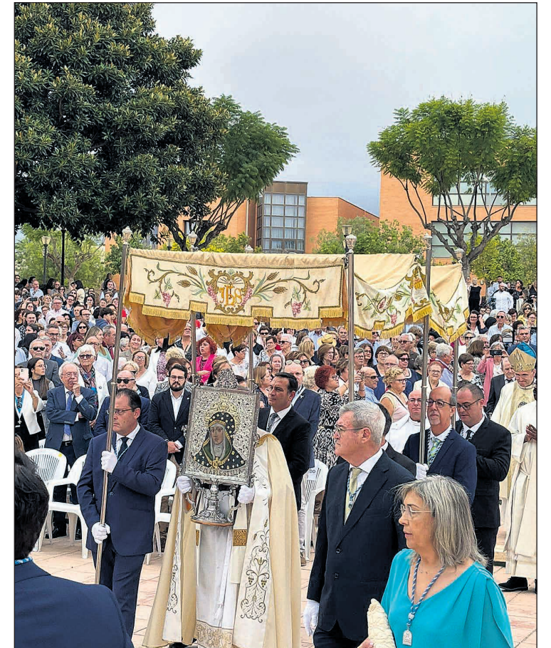
La Mare de Déu de Loreto llegó al parque El Canyar de les Portelles donde más de 1.200 personas le esperaban

El alcalde de Mutxamel, ha destacado "la coincidencia simbólica de esta coronación con la fecha en la que, el 26 de octubre de 1628, el rey Felipe IV concedió a Mutxamel el título de Villa Real, hecho que supuso su reconocimiento como municipio con administración propia respecto a Alicante". Ha puntualizado respecto al acto que "Mutxamel escribe una nueva página en su historia, la coronación de nuestra patrona nos une como pueblo y nos recuerda los valores que nos definen; gratitud, fe y compromiso con nuestras raíces". Ha resaltado que "nuestra patrona es además signo de integración e identidad para todos los que aquí