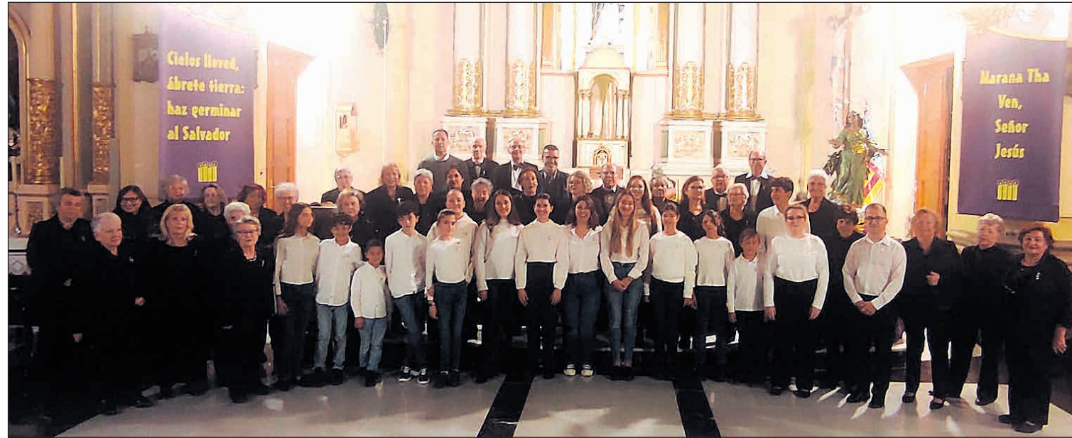
Imagen de la edición pasada de la Semana Musical Santa Cecilia

● La Asociación Cultural Ball i Art de San Vicente inicia esta semana su esperada Semana Musical en honor a Santa Cecilia, patrona de la música, con un programa lleno de sensibilidad, diversidad y compromiso cultural. Fieles a su espíritu innovador, los integrantes de la entidad han querido aportar este año una novedad muy especial: la interpretación de cuatro canciones acompañadas también por lenguaje de signos, un gesto que busca acercar la música a todos los públicos y subrayar el valor de la inclusión en el arte.