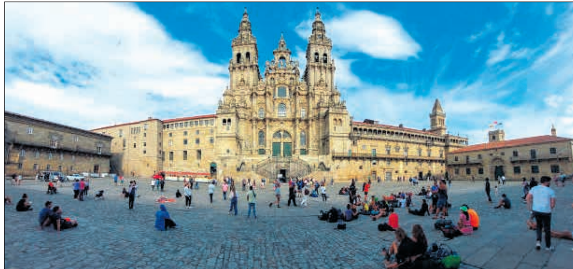
Imagen de uno de los viajes recientes de Almorçarets Sanvicenteros