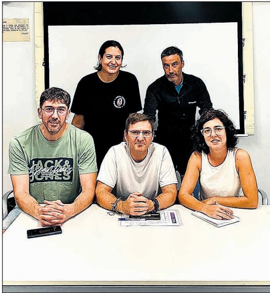
Junta Directiva del Club d'Escalada i Muntanya Sant Vicent-SKAPEIG