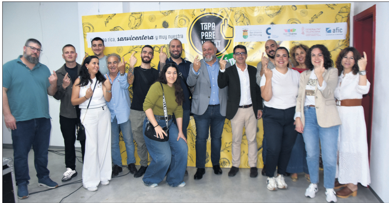
Presentación de la segunda edición de la Tapa Pare Vicent