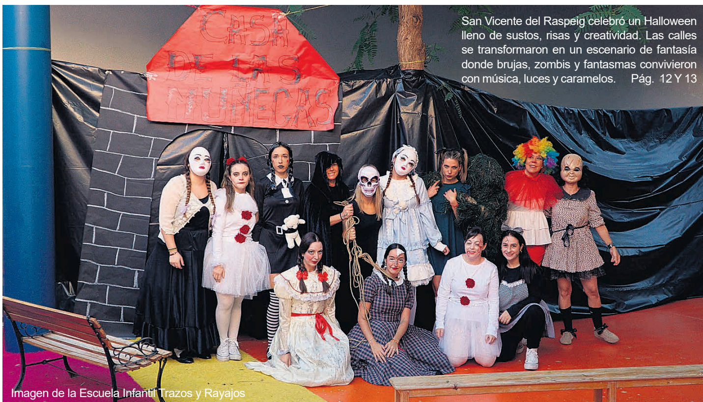
Imagen de la Escuela Infantil Trazos y Rayajos

San Vicente del Raspeig celebró un Halloween lleno de sustos, risas y creatividad. Las calles se transformaron en un escenario de fantasía donde brujas, zombis y fantasmas convivieron con música, luces y caramelos. Pág. 12 Y 13