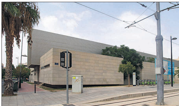
Centro de Salud 2 de San Vicente del Raspeig