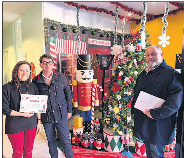
Imagen de la entrega de premios del año pasado