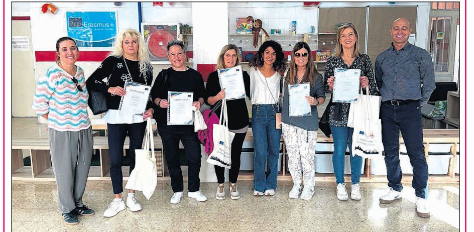
Nuevas visitas internacionales que fomentan el intercambio cultural y profesional entre docentes europeos