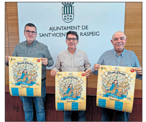
Presentación de Santa Cecilia

El alcalde ha invitado a toda la ciudadanía a participar en este programa cultural que protagonizará el mes de noviembre y ha recomendado al público ir con suficiente antelación para acceder al aforo, limitado a las plazas disponibles, y acomodarse.