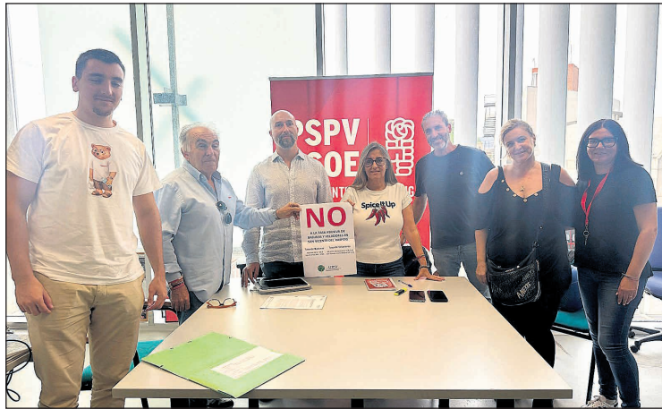
Reunión del PSOE con los empresarios hosteleros