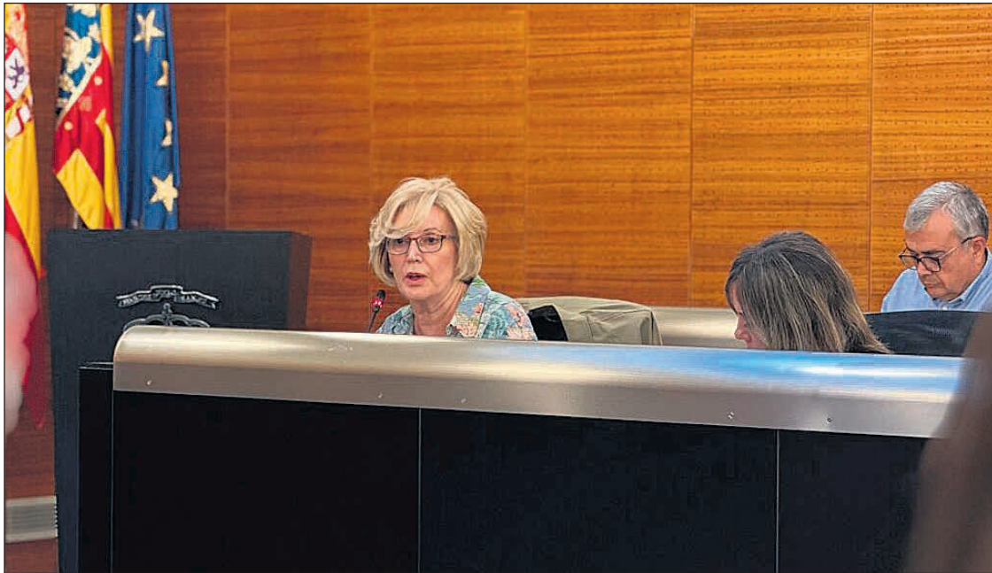
Imagen de la última sesión plenaria