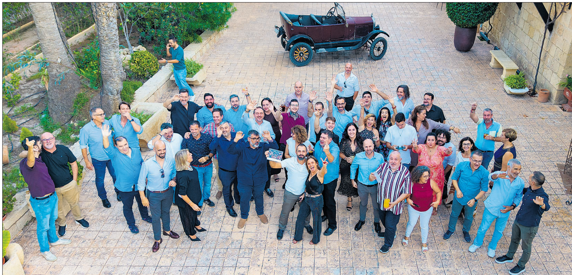
Empresarios de BNI ACN Fomento se dieron cita en Torre de Reixes para celebrar su 10º Aniversario