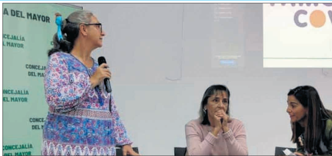
Jornada informativa organizada por la concejalía del Mayor

de los derechos que asisten a estas familias. Esta iniciativa forma parte del compromiso del Ayuntamiento por impulsar la información, la inclusión y el bienestar social de todos los vecinos y vecinas del municipio.