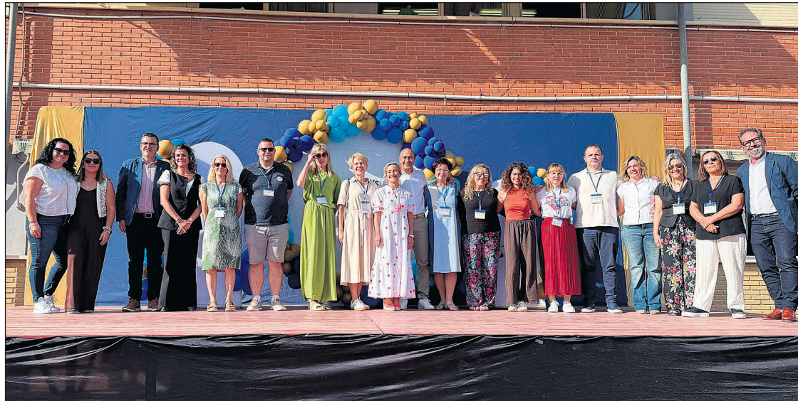
El colegio C.E.I.P. Bec de l'Àguila ha celebrado un emotivo acto de bienvenida dentro del marco del proyecto Erasmus+ "Arts for Heart's Sake"