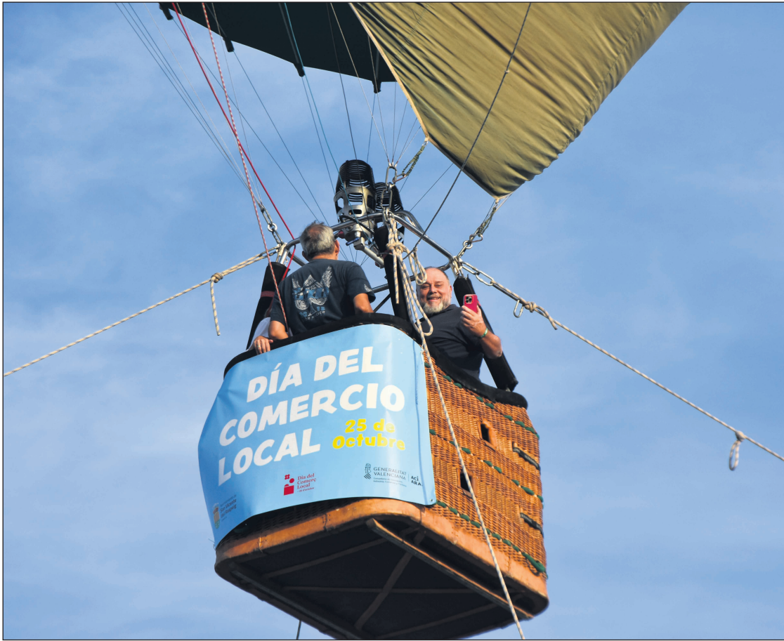
El Ayuntamiento de San Vicente celebró el Día del Comercio Local con la elevación de un globo estático con pancarta promocional