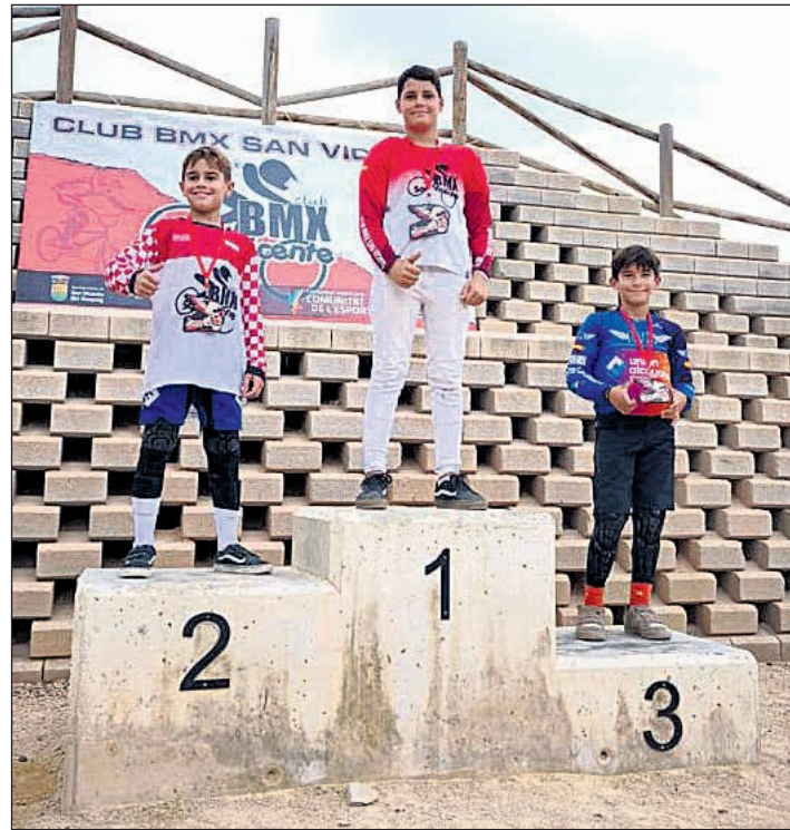
El Club BMX San Vicente ha puesto el broche final a su temporada