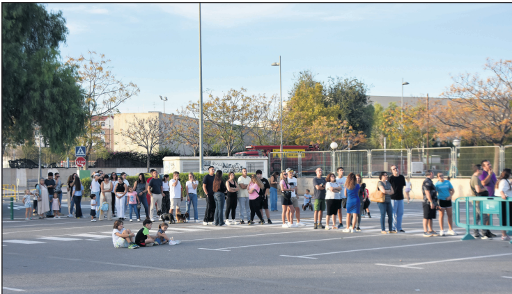
Cientos de vecinos y visitantes se acercaron para fotografiarse junto al globo o incluso subir en turnos organizados

negocios del municipio. Aseguró que la acción no solo cumplía una función estética, sino que se alineaba con otras iniciativas previstas ese fin de semana para impulsar las ventas, la difusión del comercio local y las relaciones con el tejido empresarial del municipio. Al cierre de la jornada, el globo fue