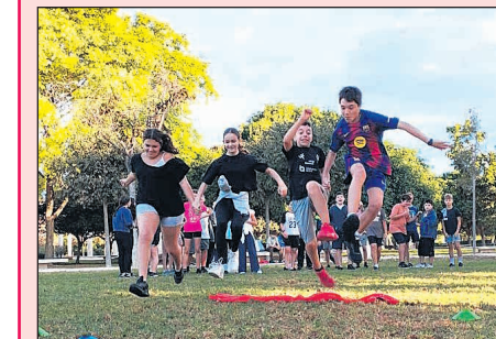
Primera edición de los Juegos de la Paz