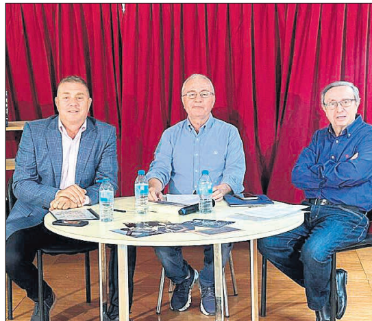
El pasado viernes 24 de octubre, a las 19:00 horas en la Biblioteca Municipal de San Vicente, se presentó el libro 'Yo me casé con un negro'