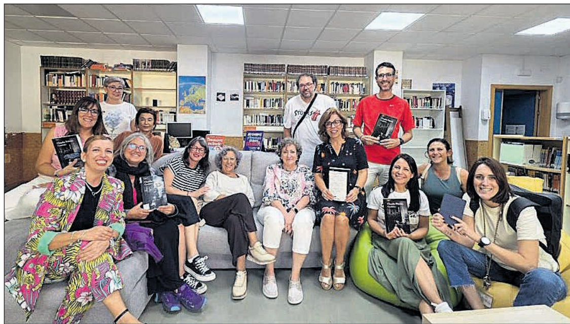
Asistentes al club de lectura del IES Gaia