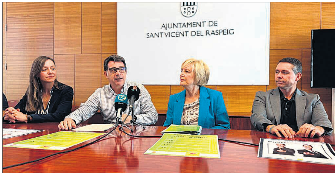
Imagen de la rueda de prensa