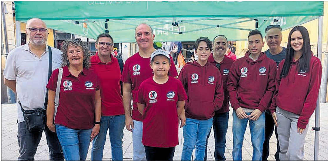
San Vicente vivió el sábado 25 de octubre una jornada diferente gracias al Club d'Escacs Sant Vicent