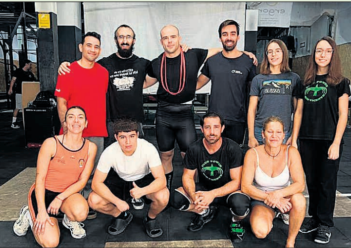
El Club Power San Vicente firmó una brillante actuación