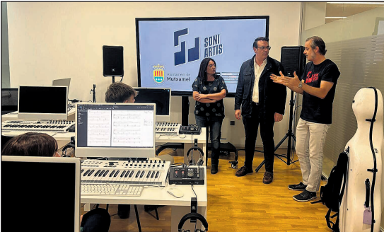
Rafael García, alcalde de Mutxamel supervisando los equipos