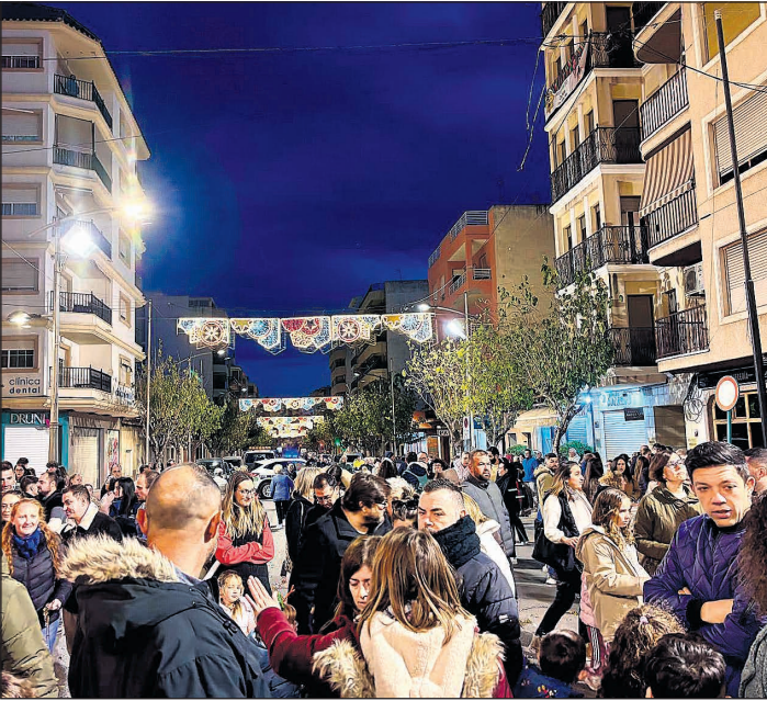
La puerta del ayuntamiento congreg   a multitud de vecinos para la inauguraci  n de la iluminaci  n

Som Mutxamel    Mutxamel encendi   oficialmente la iluminaci  n navide  a del municipio en un acto que reuni   a familias y numerosos vecinos en una tarde llena de tradici  n y ambiente festivo. La celebraci  n comenz   a las 18:00 h con el esperado encendido de las luces de Navidad, que iluminaron las principales calles y plazas del municipio, marcando el inicio de la temporada navide  a. Tras el encendido, peque  os y mayores se trasladaron a la Plaza del Mercado, donde tuvo lugar la inauguraci  n del Bel  n Municipal, una obra realizada este a  o por el reconocido artista local Vise "El Saboner". A continuaci  n, se procedi   a descubrir el cartel oficial de la Cabalgata de Reyes Magos de Mutxamel, creado por un grupo de alumnos