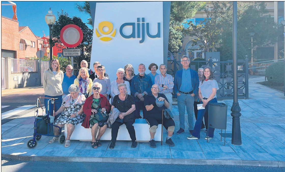
Una de las visitas organizadas por el Consorcio Terra

hasta tejido asociativo, grupos de mayores y representantes institucionales. En el ámbito educativo y formativo, alumnos del IES Cotes Baixes de Alcoy y del IES Haygón de San Vicente del Raspeig visitaron las instalaciones de Camacho Recycling en Caudete para conocer el ciclo del vidrio. Por su parte, estudiantes del Ciclo Superior de Química y Salud Ambiental del CIPFP Canastell conocieron el Centro de Tratamiento Cañada Hermosa en Murcia, una referencia en gestión de residuos sólidos urbanos y biogás. La innovación tecnológica ha sido un pilar fundamental de estas jornadas. Diversos colectivos, como el grupo de mayores de San Vicente del Raspeig, la Asociación Ensanché-Benisaido de Alcoy, el Casal de la Tercera Edad de Mutxamel y la Asociación Babilón de Ibi, visitaron institutos tecnológicos de referencia. Entre ellos destacan AIJU (juguete), AITEX (textil), INESCOP (calzado) y