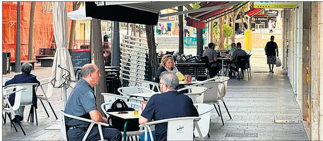
Terraza en una de las calles de San Vicente