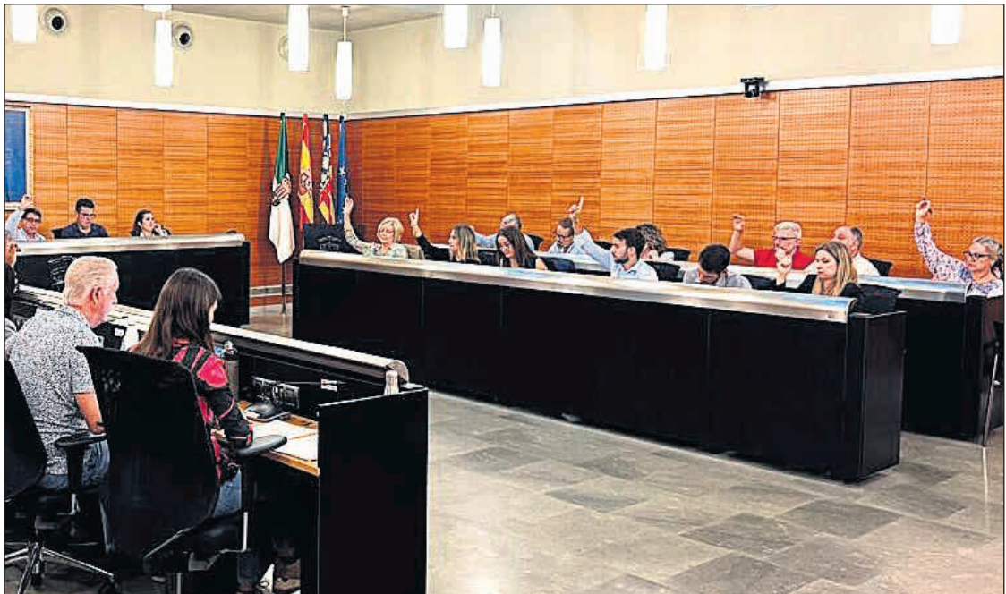
Imagen del pleno