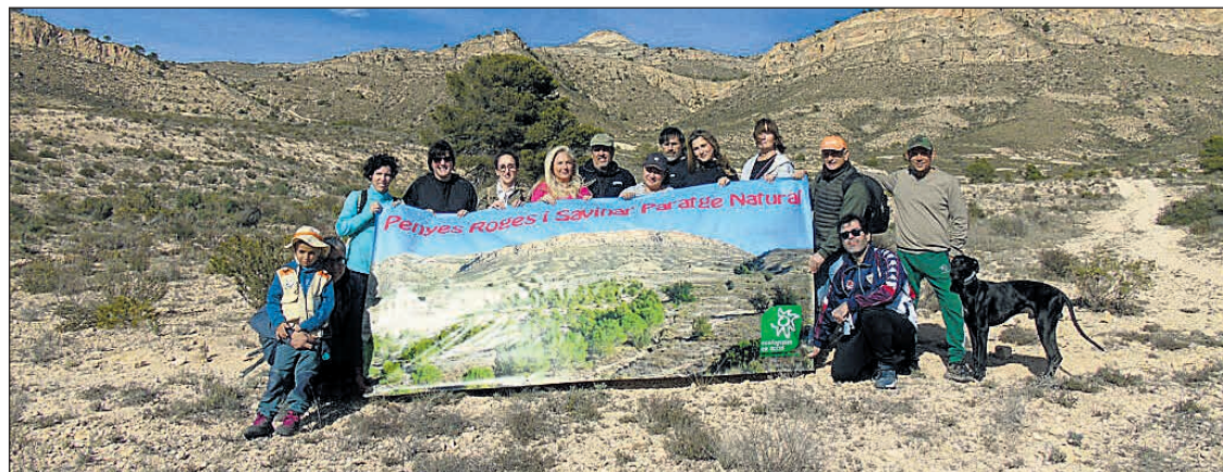
Grupo Ecologista Maigmó GREMA- Ecologistas en Acción de San Vicente del Raspeig