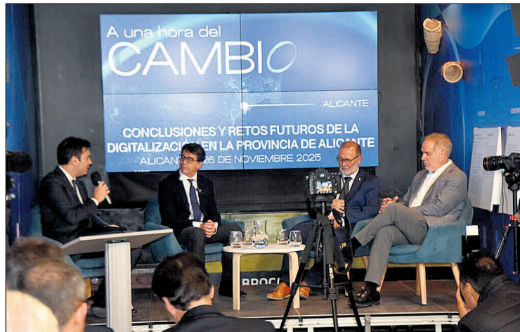
La clausura del proyecto A una hora del cambio, celebrada en el Museo de Aguas de Alicante, reunió a los alcaldes de los principales municipios de L'Alacantí