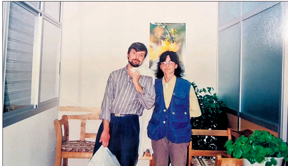
30 años han pasado desde que el proyecto abrió sus puertas en 1995

¡Feliz aniversario, Clínica Veterinaria Eusgar, y que vengan muchos años más!