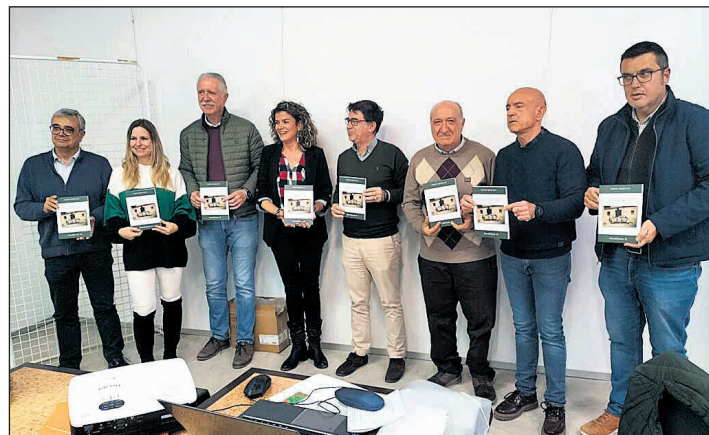
El jueves 27 de noviembre se presentó el libro “La Escuela Rural en San Vicente del Raspeig”