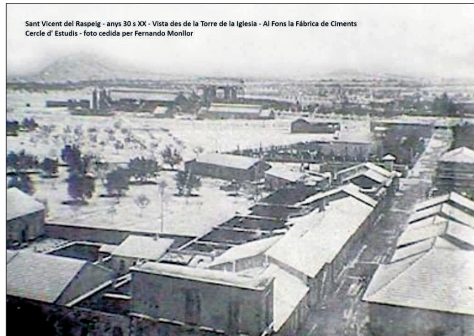
San Vicent del Raspeig - anys 30 s XX - Vista des de la Torre de la Iglesia - Al Fons la Fàbrica de Ciments Cercle d' Estudis