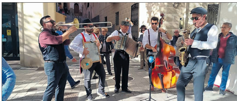
Almaens Jazz Band

Ambos conciertos son de acceso gratuito, una oportunidad excepcional para disfrutar de dos propuestas jazzísticas de gran nivel en un mismo fin de semana, de la mano de artistas locales y de trayectoria internacional.