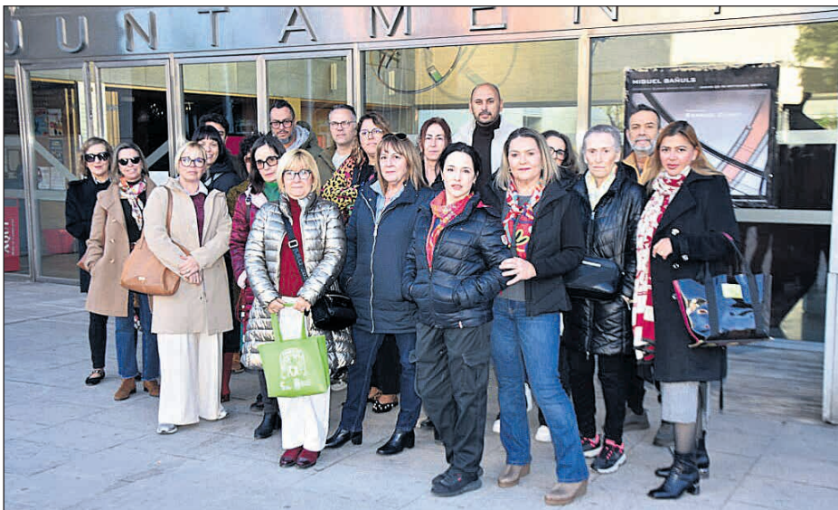
Comerciantes de Pintor Picasso

temporal del aparcamiento ha sido "necesario" para poder ejecutar las obras con seguridad, y asegura que esta medida se mantendrá "el mínimo tiempo posible". Añaden que el tráfico peatonal está garantizado, gracias a pasarelas y a la continuidad de las aceras, salvo momentos puntuales en los que se realicen rebajes. Además, detallan que la parte del tramo con mayor concentración comercial, entre las calles Velázquez y Mayor, se ha pospuesto precisamente para evitar coincidir con la Navidad. Como alternativas de estacionamiento, el Ayuntamiento remite a otros seis espacios operativos: el parking rotativo Ingeniero José Ramón García Antón; el aparcamiento del Mercadillo (Avda. Primero de Mayo, 41); el del Mercado Central (C/ Domínguez Margarit, 17); el solar de la Inmaculada (C/ Benlliure, 4); el parking de los Juzgados (C/ Bailén, 68) y el solar frente al IES María Blasco (C/ Mayor).