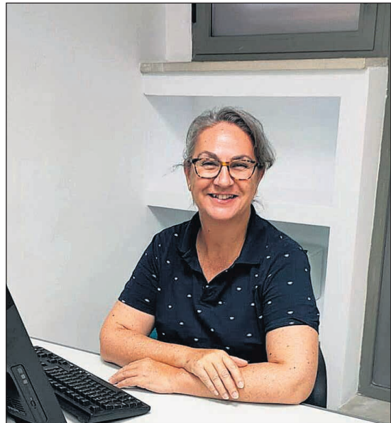
Edil del grupo municipal de Vox

Somos Raspeig ♦ En relación al debate con ocasión del día internacional contra la violencia hacia las mujeres, desde VOX lamentamos que, año tras año, se propongan las mismas medidas que ya se están implementando a nivel nacional y que resultan ser un estrepitoso fracaso, tal como lo demuestran las crecientes cifras de agresiones contra las mujeres. Mientras que el gobierno socialista dilapida millones de euros en organismos inútiles, comisiones, pactos, asociaciones, observatorios y el ministerio de Igualdad, desde VOX denunciarnos que las agresiones sexuales contra mujeres han ido aumentando durante 8 años consecutivos