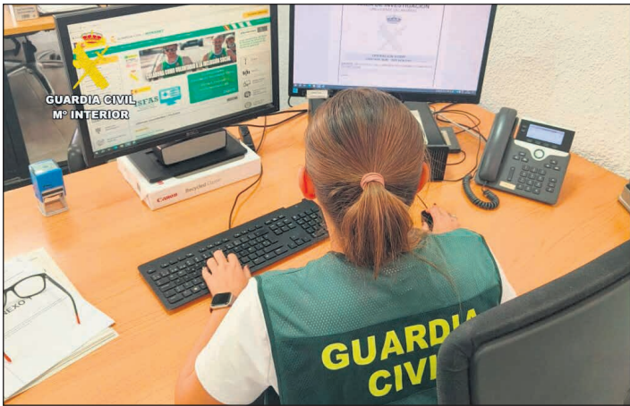
Los agentes han localizado ya a 27 perjudicados

Somos Raspeig ♦La Guardia Civil ha detenido a una persona como presunta responsable de estafar más de 800.000 euros a un mínimo de 27 víctimas de la provincia de Alicante. Se trata de una ex empleada de una gestora de seguros situada en la capital que, aprovechándose de su puesto de trabajo y de la confianza de los clientes, les robaba los fondos acumulados en los seguros que tenían contratados. La operación se inició el pasado mes de septiembre, tras recibir la denuncia de un hombre al que le habían sustraído 45.000 euros de su seguro de jubilación, al que llevaba realizando aportaciones desde hacía más de 35 años. Tras las primeras indagaciones, los investigadores lograron identificar a la presunta responsable, una ex empleada de una gestora de seguros, que había sido recientemente despedida porque la empresa había descubierto algunas irregularidades. Las víctimas elegidas eran personas de avanzada edad o con