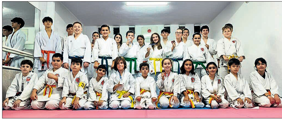
El Club de Kárate SIGMA firmó una destacada actuación en el Trofeo de Promoción de Alicante