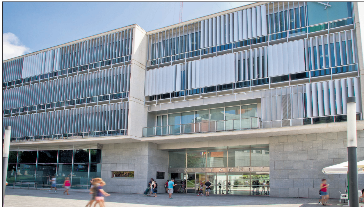
Ayuntamiento de San Vicente del Raspeig