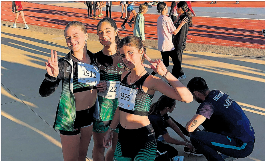
Participantes en uno de los controles de marcas de atletismo