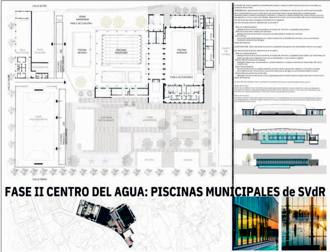
Las propuestas se someterán a evaluación técnica