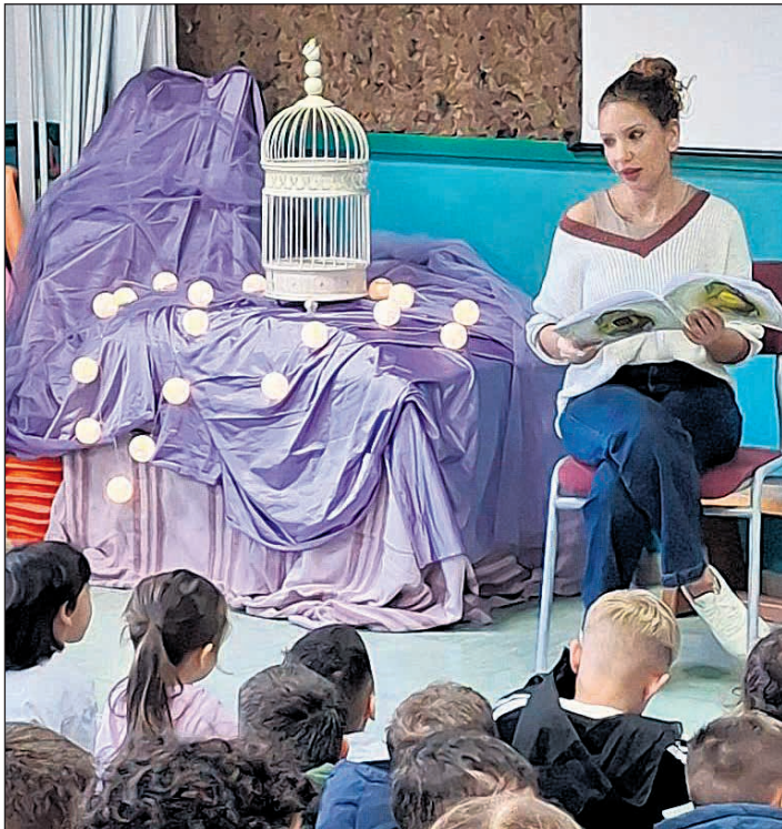
Uno de los actos celebrados por el 25N

cido este año en España, el ayuntamiento haya sido incapaz de dar una respuesta institucional conjunta a favor de la eliminación de la violencia contra la mujer, ya que "ésta supone la mayor vulneración de los derechos humanos y es una expresión extrema de la desigualdad de sexo. Requieren de la actuación decidida de los poderes públicos, con los recursos necesarios para dar respuesta institucional a un problema de esta magnitud".