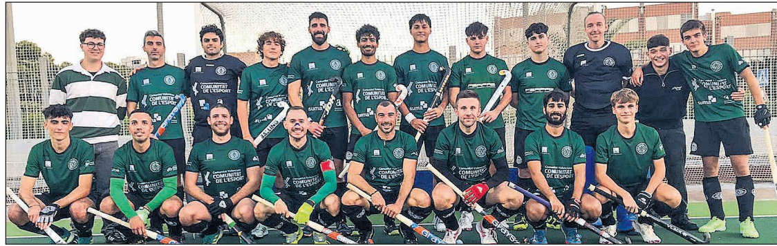
El equipo masculino Universitat d'Alacant – San Vicente