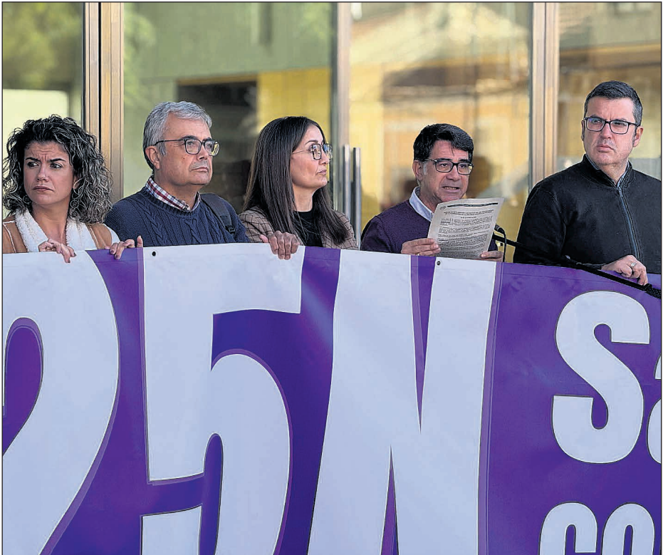
El Ayuntamiento agradeció públicamente la participación ciudadana

sensibilizar a la población, especialmente a los más jóvenes, sobre la necesidad de promover relaciones igualitarias y detectar comportamientos violentos. El Ayuntamiento agradeció públicamente la participación ciudadana y destacó que la lucha contra la violencia de género requiere constancia durante todo el año, más allá del 25N. Desde el área de Igualdad se subrayó la importancia de la educación, la coordinación institucional y el refuerzo de los recursos destinados a las víctimas. Con esta jornada, San Vicente volvió a mostrar su rechazo rotundo a la violencia machista y su compromiso de construir un municipio seguro, libre y justo para todas las mujeres.