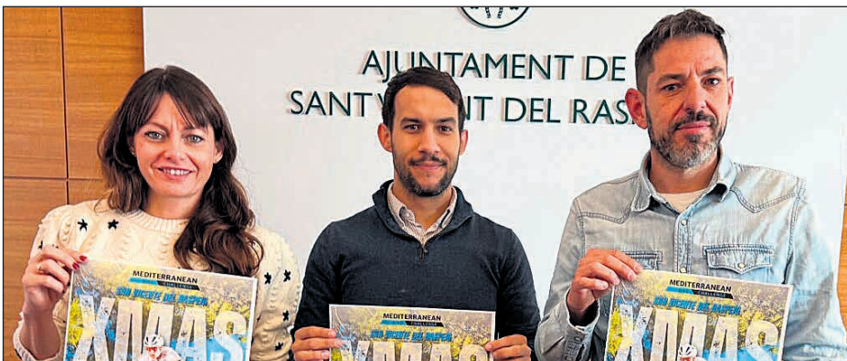
El Ayuntamiento de San Vicente del Raspeig, a través del área de Deportes, celebrará el próximo 13 de diciembre, sábado, una nueva edición de la marcha Xmas Classic

● El Ayuntamiento de San Vicente del Raspeig, a través del área de Deportes, celebrará el próximo 13 de diciembre, sábado, una nueva edición de la marcha Xmas Classic, que llega este año a su decimosexta edición.