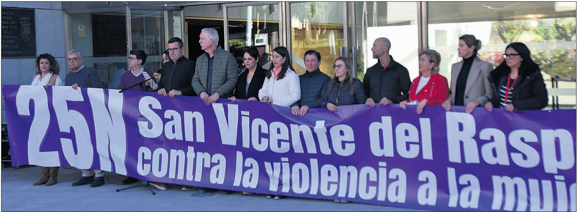
El acto central tuvo lugar en la plaza del Ayuntamiento, donde se llevó a cabo la lectura del manifiesto institucional

● San Vicente del Raspeig conmemoró la pasada semana el Día Internacional para la Eliminación de la Violencia contra la Mujer (25N) con una serie de actos institucionales, culturales y participativos que reunieron a representantes municipales, asociaciones, colectivos y ciudadanía. La jornada estuvo marcada por un mensaje común: la necesidad de mantener el compromiso firme para erradicar cualquier forma de violencia machista y avanzar hacia una sociedad más igualitaria.