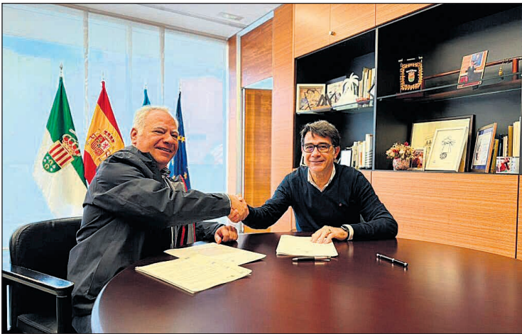
El alcalde estudiará las propuestas de los empresarios con la finalidad de mejorar la seguridad, la limpieza y el mantenimiento de los polígonos

algún otro tipo de situación de vulnerabilidad, de este modo la autora conseguía valerse de la confianza que éstos depositaban en ella para robarles el dinero sin que terceras personas pudieran descubrirla, desviando los fondos de sus planes de seguro a cuentas de las que era ella la titular. El pasado 2 de noviembre fue detenida por los delitos de estafa, falsificación de documentos públicos y usurpación de identidad. Tras ser puesta a disposición del Juzgado de Instrucción número 1 de San Vicente del Raspeig, ha quedado en libertad con cargos. Se trata de una mujer de 49 años, de nacionalidad española, residente en la localidad de Alicante. La operación Yosir1 ha sido desarrollada por el Área de Investigación del Puesto de la Guardia Civil de San Vicente del Raspeig. Los agentes han localizado ya a 27 perjudicados y no se descarta que aparezcan nuevas víctimas. Se ha solicitado al Juzgado la intervención de las cuentas bancarias con las que operaba.