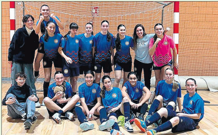
El nuevo Juvenil Femenino del Xaloc Alacant FS

◆ El Xaloc Alacant Fútbol Sala, histórico club alicantino fundado en 1982, ha presentado esta temporada su nuevo equipo Juvenil Femenino, un proyecto que destaca especialmente por la fuerte presencia de talento procedente de San Vicente del Raspeig. Ocho de las jugadoras que integran la plantilla son sanvicenteras, una apuesta que refuerza el vínculo del club con la comarca y evidencia el creciente impulso del fútbol sala femenino en el municipio. En su debut en la liga Cadete-Juvenil, el conjunto -creado este mismo año- ha completado una primera vuelta muy notable, alcanzando el primer puesto tras semanas de trabajo y progresión constante. Aunque el club mantiene los pies en el suelo, valora positivamente el camino recorrido y el margen de crecimiento que aún tiene el equipo. El protagonismo sanvicentero también se refleja en las convocatorias autonómicas. Cinco