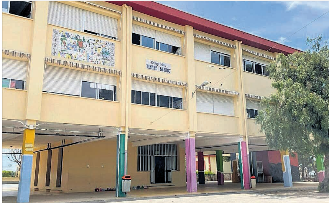
Fachada del Colegio Arbre Blanc de Mutxamel