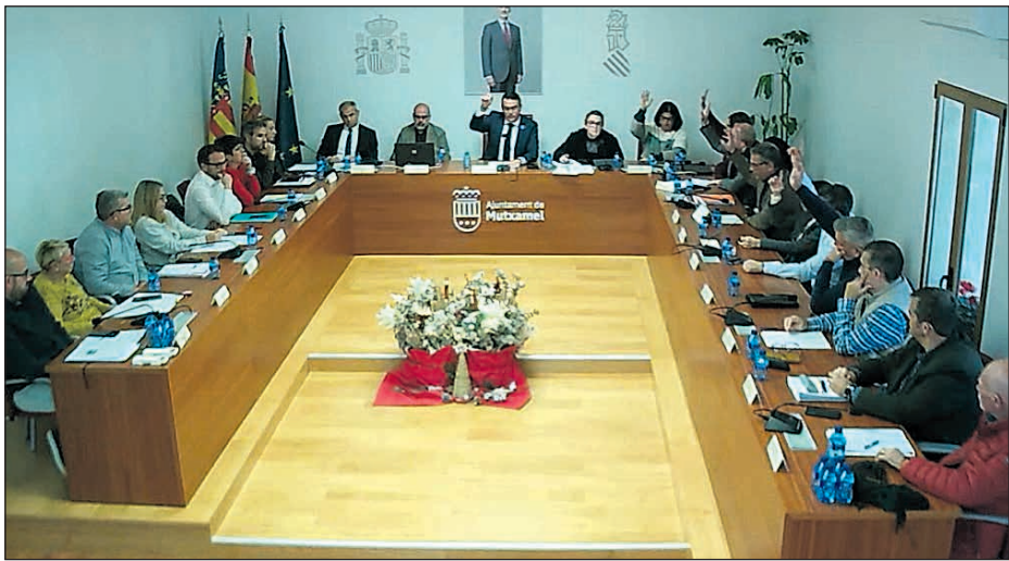
Momento de la votación en el pleno