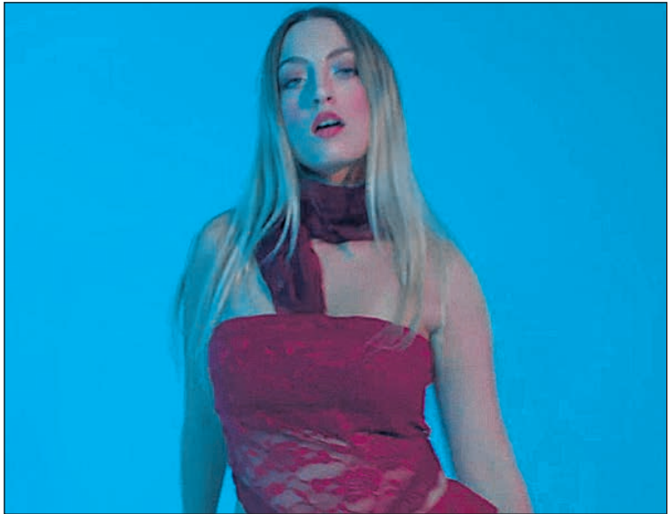
Imagen del videoclip de Cada vez de Elena Lacal