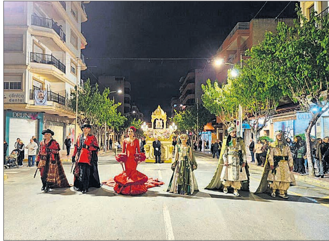
Los Cargos Festeros desfilan delante de la Mare de Déu de Loreto en la procesión

El ambiente festero continuó el fin de semana siguiente con el esperado Día de las Comparsas. Más de 3.500 festeros se reunieron en la avenida Carlos Soler, que por unas horas se transformó en el escenario de los desfiles que recuerdan a los que se