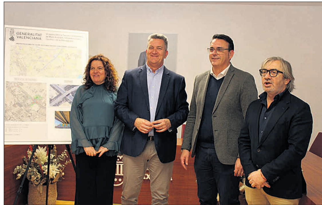
Visita del Conseller Martínez Mus para explicar el proyecto

La obra trata del derribo del actual puente de Sant Peret y la sustitución del puente por una rotonda de 30 metros de