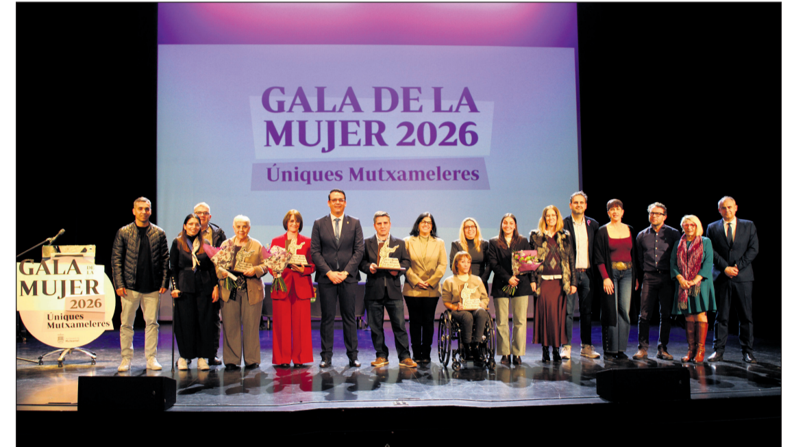
La corporación municipal junto a las premiadas

La velada estuvo marcada por la emoción, los recuerdos y el reconocimiento público a estas mujeres que han dejado huella en la historia reciente de Mutxamel. El acto contó además con la destacada participación del alumnado del Conservatorio de Mutxamel, que ofreció tres actuaciones musicales llenas de talento y sensibilidad, aportando un toque artístico a una noche muy especial. El evento concluyó con un mensaje de agradecimiento a todas las personas que hicieron posible la gala y, especialmente, a las homenajeadas, cuya trayectoria representa los valores y el espíritu de Mutxamel.