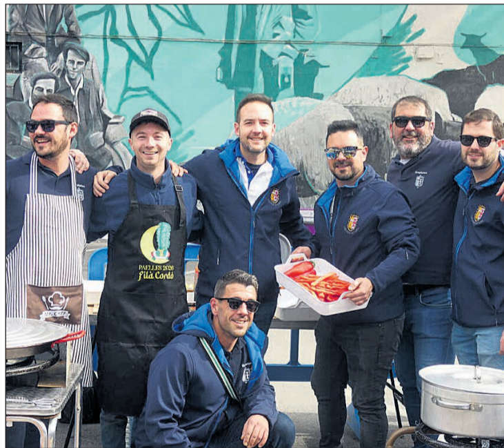
Componentes de la Comparsa Templarios, ganadora de la mejor paella