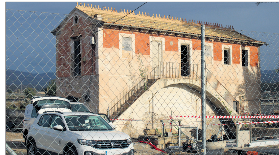
Las obras de emergencia de El Pantanet acaban de empezar

Con estas actuaciones, Mutxamel afronta de manera simultánea la mejora de infraestructuras educativas largamente demandadas y la preservación de su patrimonio histórico, combinando inversión, seguridad y planificación a medio plazo.