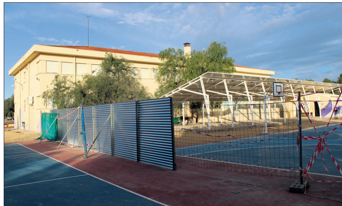
Se espera que para el inicio del próximo curso las obras hayan terminado