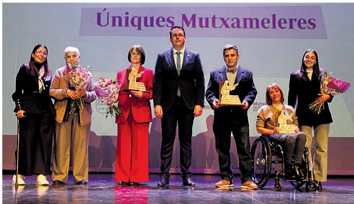
Mutxamel rinde homenaje a cuatro mutxameleras en el marco del 8M, Día Internacional de la Mujer