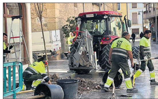
Trabajos de cambio de arbolado