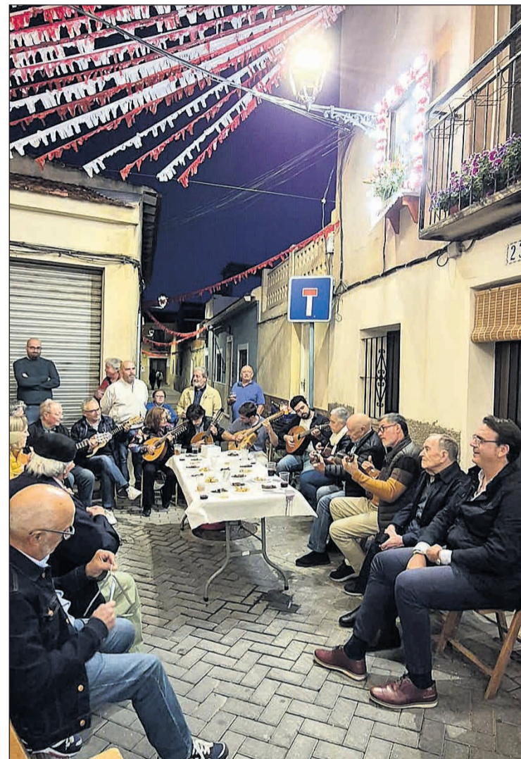
El So de Mutxamel abrió los actos de conmemoración de las fiestas