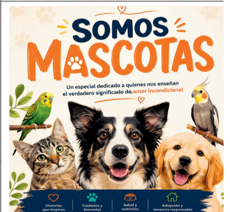
Detrás de casa ladrado o ronroneo hay una historia, consulta los mejores cuidados para tu mascota en nuestro especial Somos Mascotas