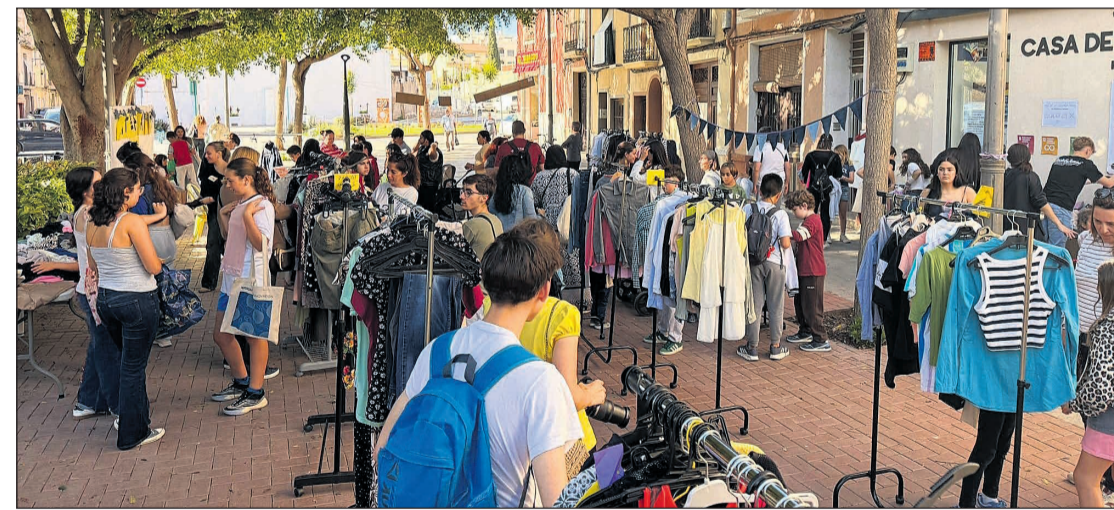
La Casa de la Juventud acogió otra vez La Resistienda