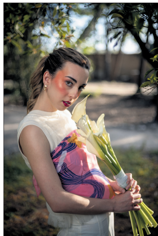
Una de las imágenes de la muestra