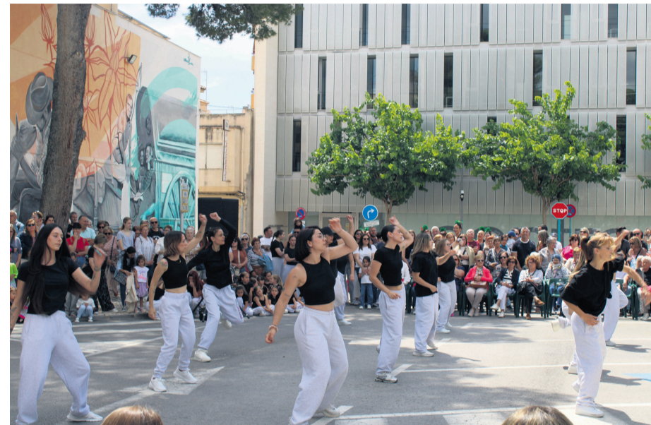
La Plaza del Mercado Municipal acogió un espectáculo de danza de las escuelas del municipio