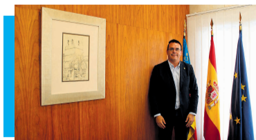
El alcalde de Mutxamel repasa la actualidad local en el ecuador del año Pág. 3