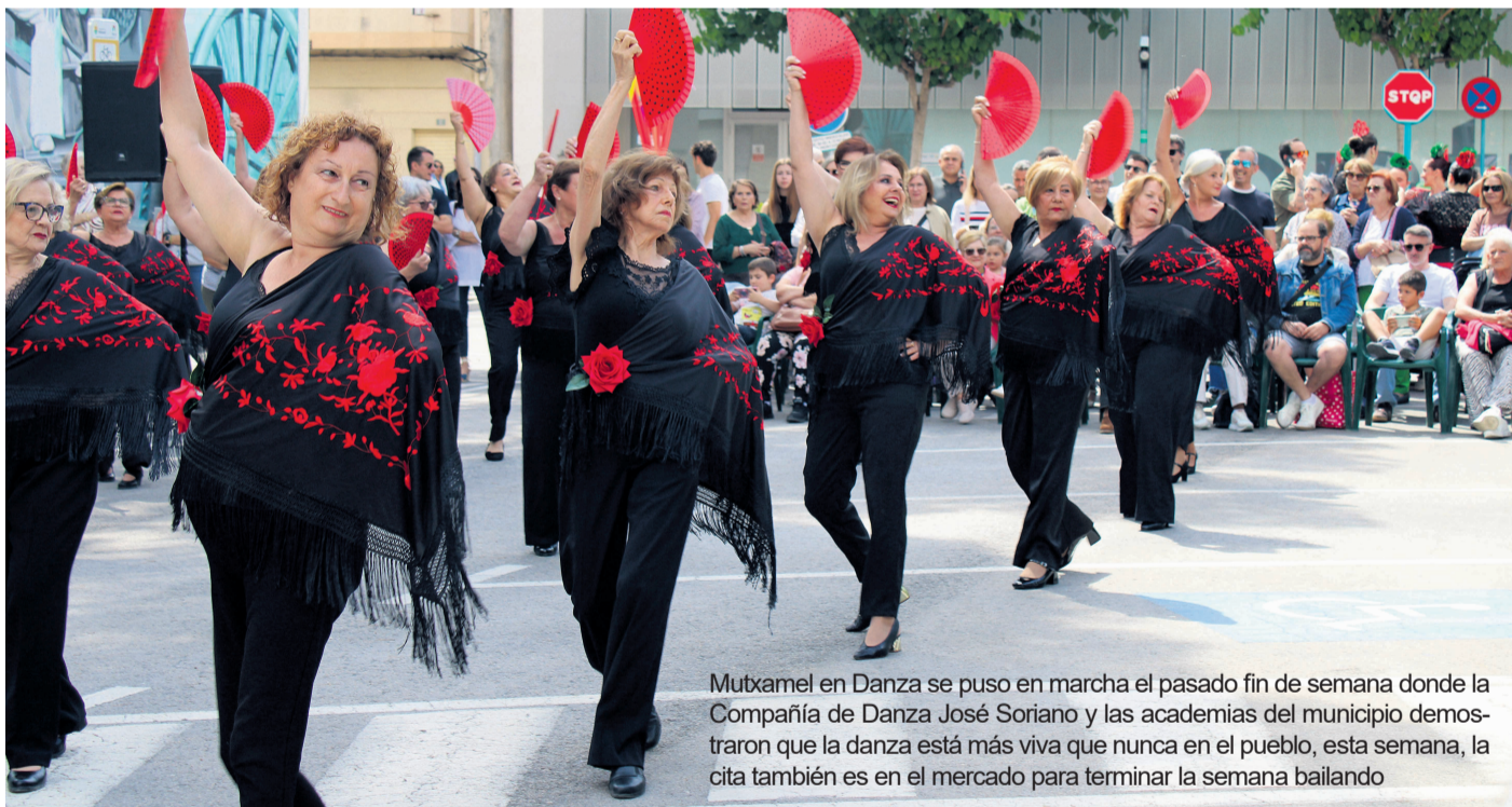
Mutxamel en Danza se puso en marcha el pasado fin de semana donde la Compañía de Danza José Soriano y las academias del municipio demostraron que la danza está más viva que nunca en el pueblo, esta semana, la cita también es en el mercado para terminar la semana bailando