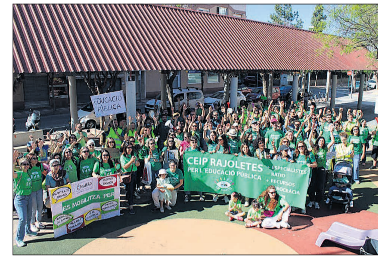
Docentes de Sant Joan y Mutxamel concentrados en el Parque Miguel Hernández

A lo largo de las tres jornadas, el profesorado ha insistido en las mismas demandas: mejoras salariales, reducción de ratios, refuerzo de plantillas y alivio de la carga burocrática, además de in-