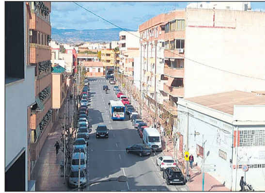
Vista aérea de Mutxamel