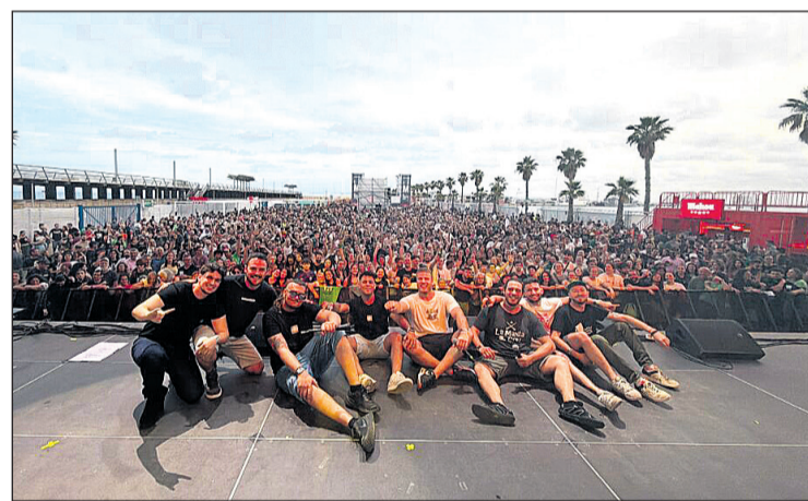
Els integrants de Mawela al concert

◆ El grup musical mutxameler Mawela va actuar com a un dels protagonistes del concert que va oferir La Gossa Sorda el passat dissabte al recinte Muelle Live d'Alacant, en una cita que va reunir un nombrós públic i es va convertir en una de les vetlades musicals destacades de la temporada a la ciutat. La formació de Mutxamel va formar part del cartell de la nit, aportant el seu estil característic i consolidant la seua presència dins de l'escena musical valenciana. El concert de La Gossa Sorda, una de les bandes més influents del panorama de la música en valencià, va servir com a reclam principal d'un esdeveniment que va combinar energia, reivindicació i festa. El Muelle Live d'Alacant, situat al port de la ciutat, va acollir així una nit que va