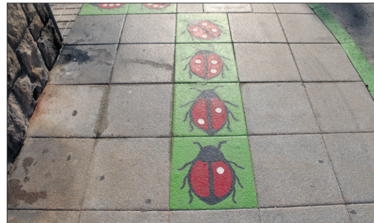
Algunas zonas del municipio están decoradas para hacer más fácil el camino a los centros educativos

La zona norte de Mutxamel está experimentando una transformación impulsada por la participación ciudadana. El proyecto municipal de dinamización comunitaria que se desarrolla en la zona norte de Mutxamel, concretamente en las zonas de Convent, Poble Nou y Ravalet busca revitalizar estos espacios mediante actividades culturales, educativas y de mejora urbana en las que los propios vecinos son protagonistas. Una de las actuaciones más visibles es el proyecto de arte urbano "Camí a l'escola", desarrollado por Comando Margarita. La iniciativa consiste en señalar mediante pintura el recorrido que une la calle Elda con el CEIP Arbre