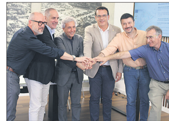
Foto de familia entre el Ayuntamiento de Sant Joan, el de Mutxamel y la Generalitat