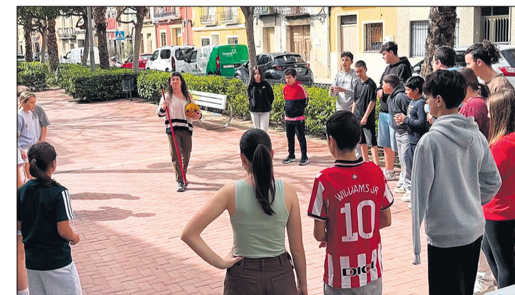
Una de las actividades realizadas en la Casa de la Juventud

vidades especiales, como la experiencia XJump realizada el pasado 12 de junio para corresponsales juveniles en San Vicente, así como dos salidas acuáticas previstas para el 4 de julio y el 1 de agosto. El proyecto no se limita al entretenimiento, sino que también trabaja aspectos como la convivencia, la autonomía personal, la igualdad, la diversidad, los hábitos saludables y la participación juvenil. En este sentido, la programación juvenil de Mutxamel se complementa con actividades durante todo el año, como el grupo de escritura creativa, el servicio de afectividad y sexualidad, teatro los sábados por la mañana y una actividad intergeneracional mensual. Asimismo, desde la concejalía se impulsan mensualmente actividades especiales. En abril tuvo lugar una competición en el pumptrack, en mayo se celebró la resistencia y el Game On, mientras que