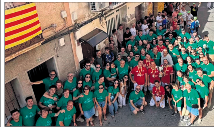
Els jugadors de l'equip de Mutxamel junts a molt veïns

◆ El municipi de Mutxamel ha sigut l'escenari de les finals de la 34a Lliga de Palma Trofeu Diputació d'Alacant 2026, disputades al mític Carrer Sol, que ha tornat a convertir-se en el centre de la pilota valenciana amb una gran resposta de públic i un ambient festiu durant tota la jornada. Les finals han deixat diferents campions en les categories en joc. En Primera, el CPV La Rectoria C s'ha imposat per 10-8 al CPV Tibi B. En Segona, el CPV Xàbia ha guanyat per 10-4 al CPV Mutxamel, en una partida exigent que no ha restat protagonisme a l'excel·lent ambient viscut al carrer. En Tercera, el CPV Finestrat B ha superat el CPV La Nucua per 10-6, mentre que en Quarta, el CPV Tibi D ha vençut el CPV Xàbia B per 10-4. Més enllà dels resultats esportius, Mutxamel ha viscut una autèntica festa de la pilota valenciana. El Carrer Sol ha registrat una gran afluència d'aficionats, amb un ambient espectacular que consolida el municipi com una de les seues destacades d'aquesta competició. L'activitat no s'atura al municipi, ja que la pròxima setmana Mutxamel tornarà a acollir finals de la competició, en esta ocasió corresponents a la modalitat de llargues, reforçant així el seu paper clau dins del calendari de la pilota valenciana a la província.