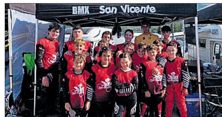
Componentes del Club BMX San Vicente

siguieron sendos terceros puestos para completar el magnífico balance del club. Con estos resultados, el Club BMX San Vicente continúa consolidándose como una de las entidades referentes del BMX autonómico y nacional, gracias al trabajo constante de sus deportistas y técnicos, así como a la gran progresión mostrada por sus jóvenes riders durante las últimas temporadas. Tras esta primera jornada llena de éxitos, los integrantes del club afrontaron la segunda jornada de competición con ilusión y ganas de seguir sumando buenos resultados en Alcoy.