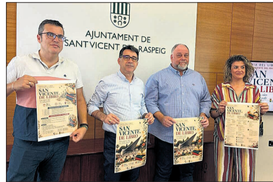
Imagen de la presentación