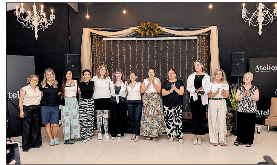
El equipo que participó en el evento que se celebró en la Sala Atelier