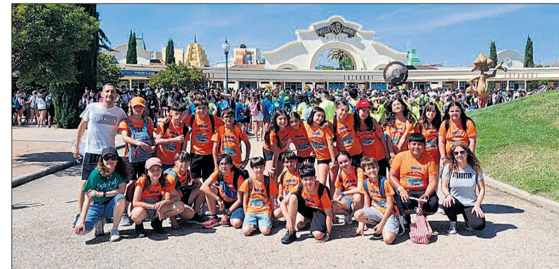
El alumnado trabajó en el aula diferentes actividades relacionadas con los destinos que posteriormente visitarían

Desde el centro educativo han destacado el valor pedagógico de esta iniciativa, que ha permitido al alumnado desarrollar competencias digitales, trabajo cooperativo y habilidades comunicativas mientras disfrutaban de una experiencia de convivencia y aprendizaje fuera del aula.