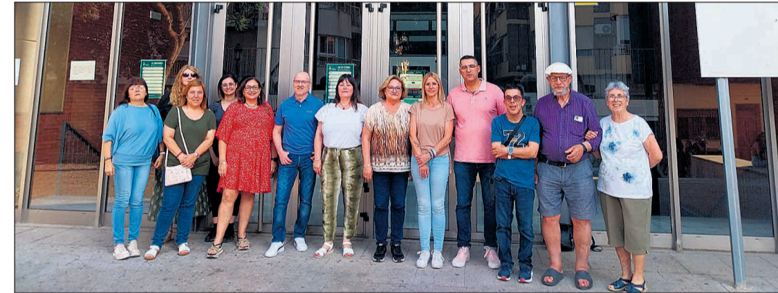
La presidenta de Ball i Art junto a los conserjes y la Masa Coral La Aurora