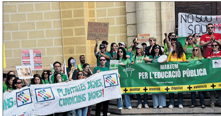
Imagen de una de las concentraciones