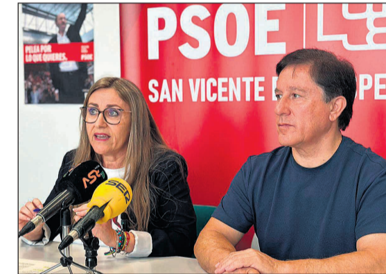
Imagen de la rueda de prensa