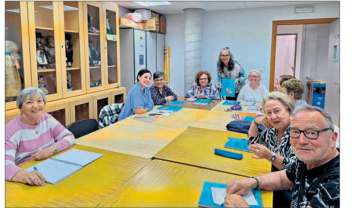
Nuevo programa de actividades dirigido a mayores de 65 años

En materia de reciclaje, se trabajará con los mayores en el proceso de reutilización de materiales textiles con una sesión en la que los asistentes aprenderán a transformar productos en desuso y otras dos dedicadas a la prevención de desperdicios alimentarios en el hogar y a la elaboración de jabón natural con el uso de aceite usado, esta última el 26 de junio. En el capítulo de nuevas tecnologías, "Seguro con tu móvil" se impartirá los lunes 5, 12, 19 y 26 de junio y 'Chatea con la IA', los mismos días en distinto horario. Además de estos talleres, se