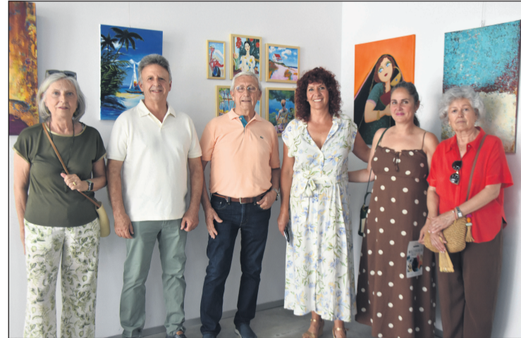
Inauguración de "Multiverso Creativo", organizada por FF-Art Atelier