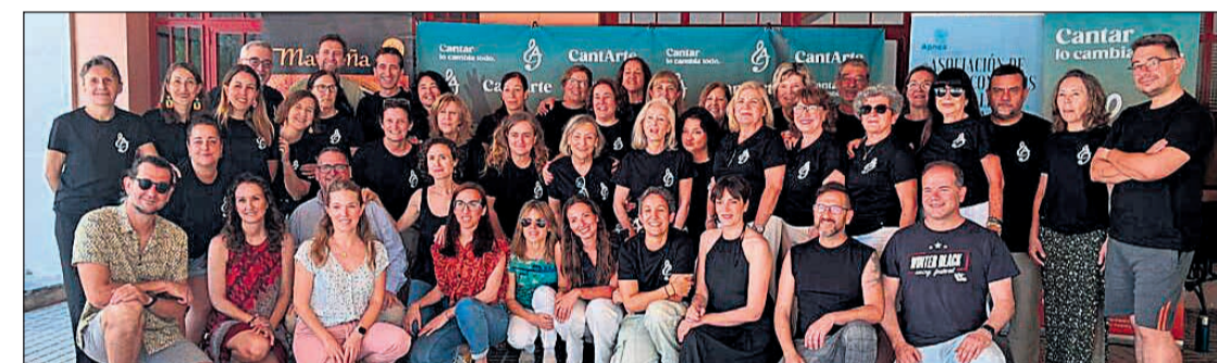
El pasado fin de semana el Coro CantArte tuvo un ensayo muy especial junto a los grupos colaboradores, Maraña y Mailers