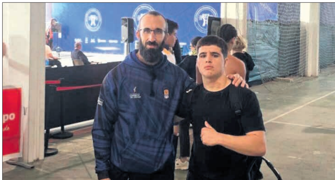
El deportista sanvicentero consiguió una meritoria sexta posición