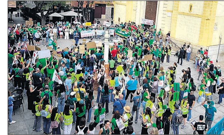
Sant Vicent muestra su total respaldo a las reivindicaciones de los y las docentes