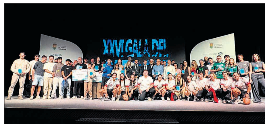
El Ayuntamiento de San Vicente del Raspeig ha celebrado una de las ediciones más internacionales