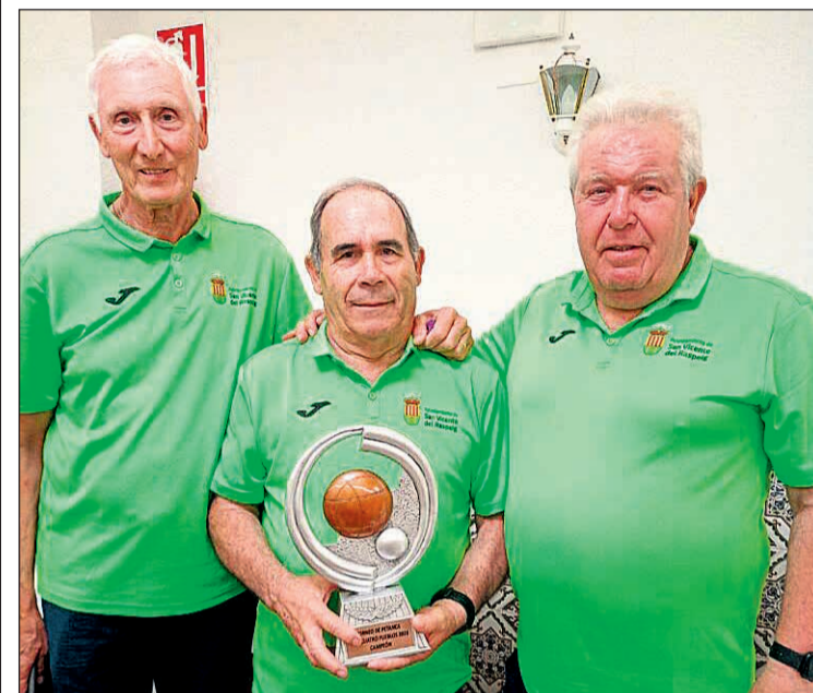
El Club de Petanca de Jubilados y Pensionistas de San Vicente ha cosechado recientemente un importante éxito deportivo

título de campeones de liga por tripletas, reafirmando el gran nivel competitivo y el buen momento que atraviesa el club sanvicentero. Este doble triunfo supone un reconocimiento al esfuerzo, la constancia y el compañerismo de sus integrantes, que continúan llevando el nombre de San Vicente a lo más alto en las competiciones de petanca.