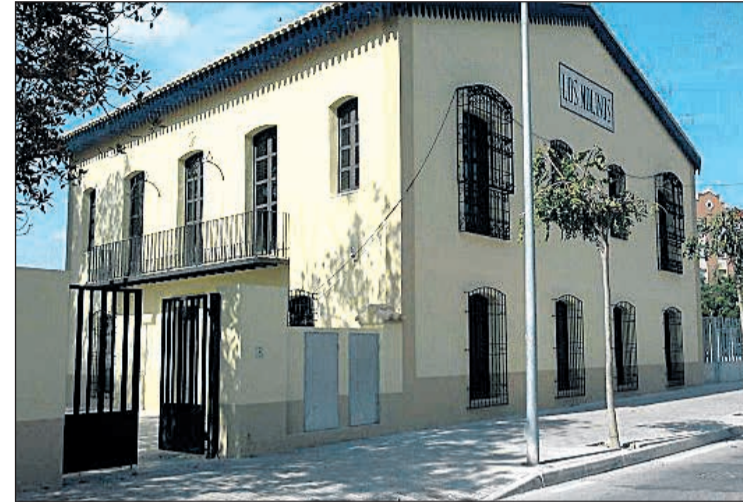
Centro Juvenil Los Molinos