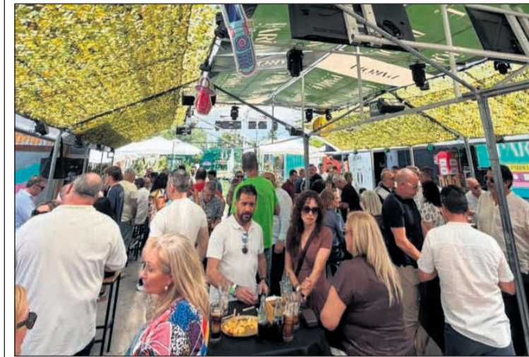
Evento celebrado el pasado fin de semana