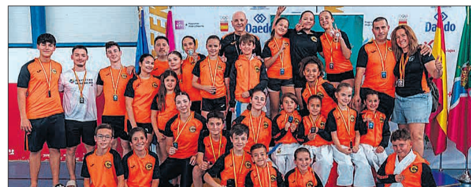
El conjunto sanvicentero regresó con un balance de 14 medallas de oro, 8 de plata y 7 de bronce