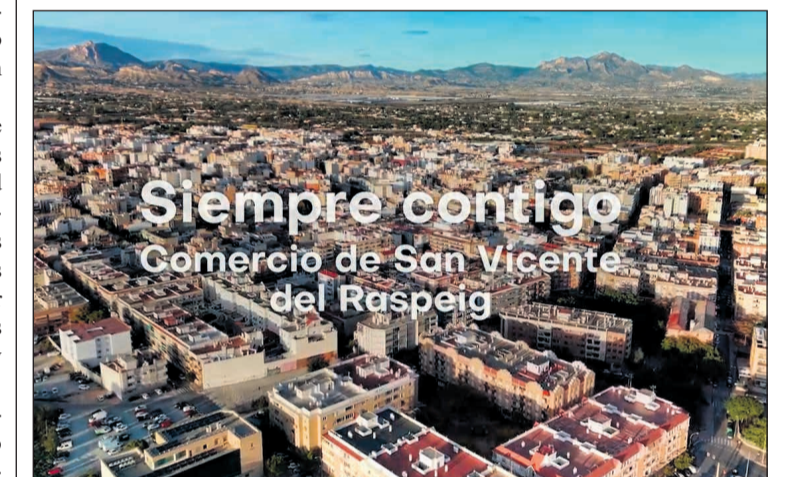
Nuevo spot promocional de la campaña de apoyo al comercio local

Además de su presentación oficial, el spot estará disponible en las redes sociales del Ayuntamiento y de la Concejalía de Comercio, además de en las nuestras, con el objetivo de alcanzar al mayor número posible de ciudadanos y dar visibilidad a los comercios participantes en la campaña impulsada durante este mes de junio.