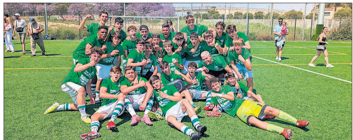
El equipo cadete del Gimnásic Sant Vicent ha logrado proclamarse campeón provincial esta temporada