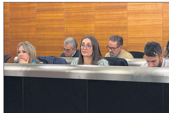
Imagen de una sesión plenaria