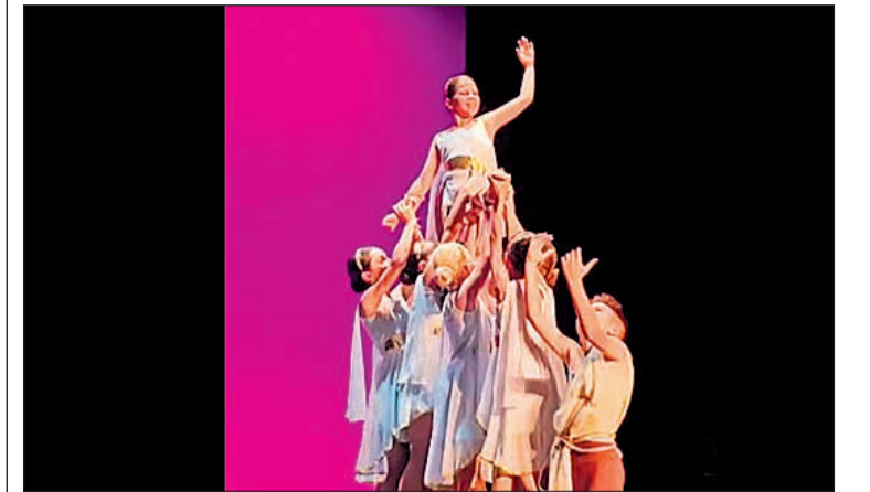
30 aniversario de la Gala 'Homenaje a la Danza'