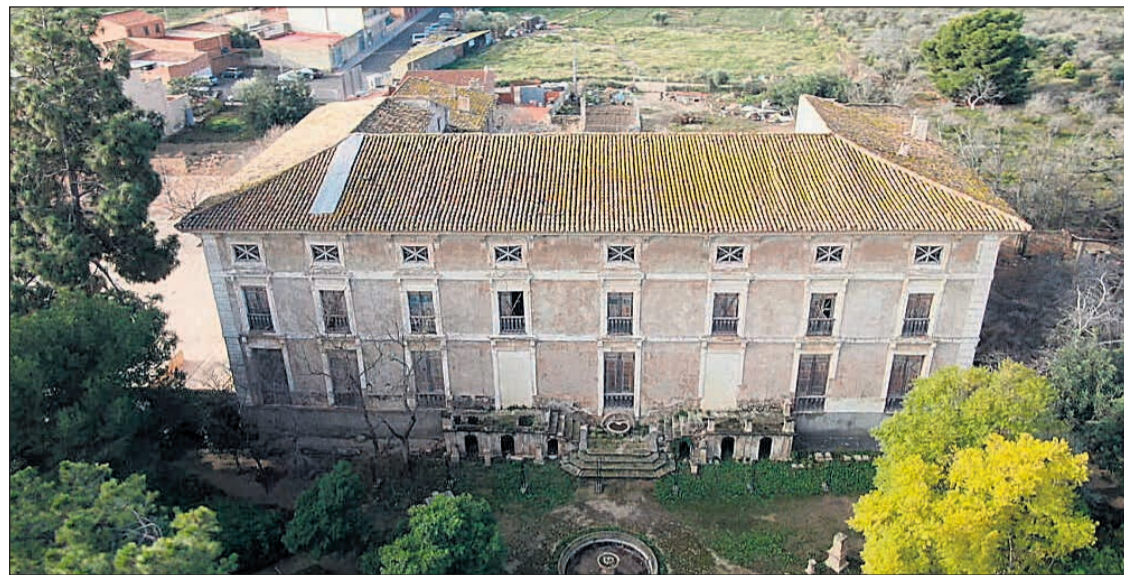
Imagen aérea de Peñacerrada