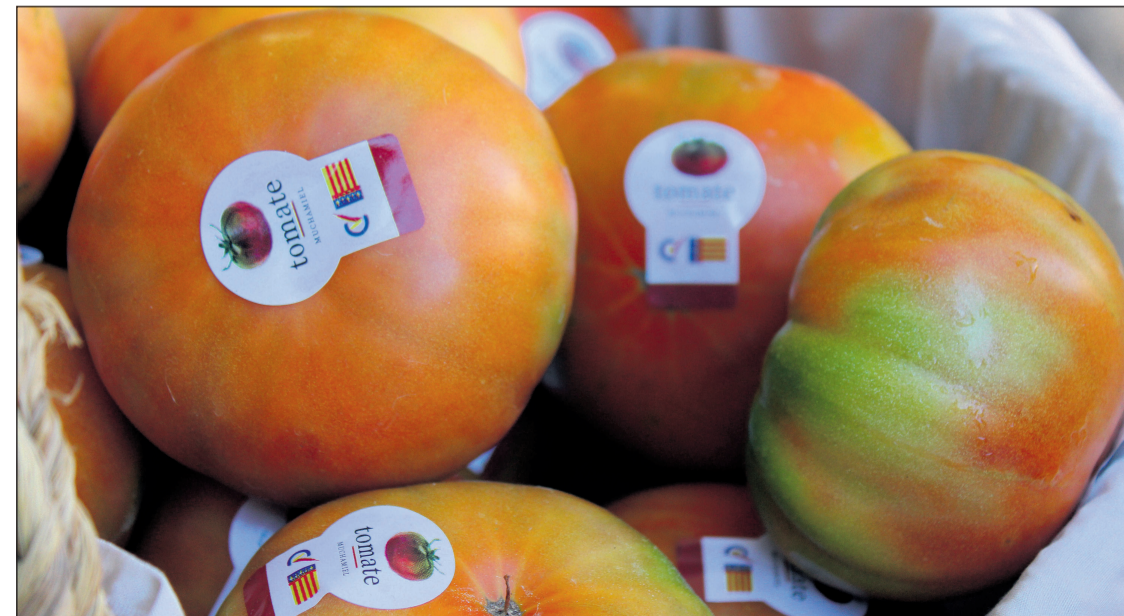
El Tomate Muchamiel fue el gran protagonista de todo el fin de semana

Este proyecto supone un nuevo paso en la apuesta de Mutxamel por combinar tradición e innovación, incorporando la investigación científica como herramienta para garantizar el futuro de uno de los cultivos más representativos del municipio.