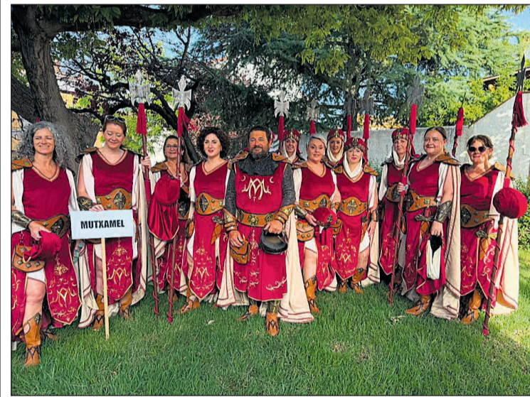
Parte de los integrantes de la Comparsa Mozárabes en el desfile de los 50 años de la UNDEF

La participación de Mutxamel en esta efeméride supone un reconocimiento al compromiso de sus comparsas con la conservación y promoción de las fiestas de Moros y Cristianos, así como una oportunidad para proyectar la imagen del municipio en un encuentro de referencia dentro del panorama fester nacional.