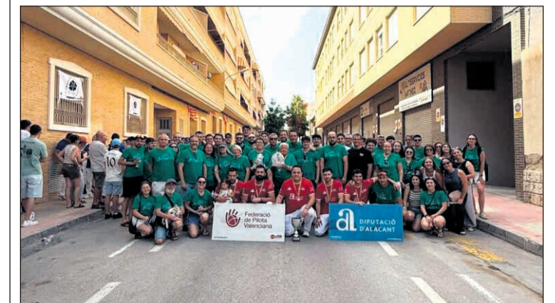
Els integrants de l'equip de Pilota Valenciana en el Carrer Pedro Cano

En la final de Primera Categoria, el títol va ser per al CPV La Rectoria, que va superar el CPV Orba per 10 jocs a 7 en una partida intensa i disputada, digna d'una gran final. Més enllà dels resultats, la jornada va tornar a posar en valor la capacitat organitzativa de Mutxamel i la seua estreta vinculació amb la pilota valenciana. En dos caps de setmana consecutius, els carrers del municipi han sigut l'escenari de finals de la Lliga de Llargues, reunint aficionats, jugadors i amants d'un esport que continua molt viu als pobles de la Marina i l'Alicantí.