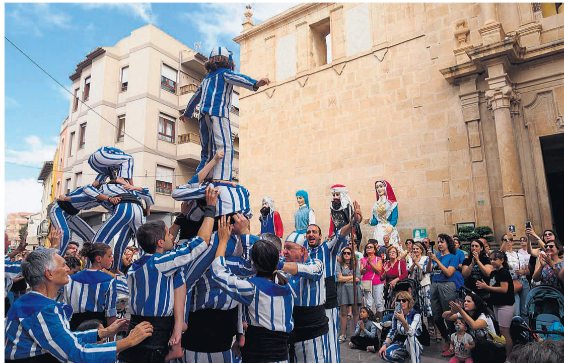
Un dels actes als que la Muixeranga acudix es la festa del 9 d'octubre de Mutxamel

important procés de recuperació que ha propiciat el naixement de noves colles arreu del territori. Les figures que hui es poden contemplar en les actuacions tenen també una important càrrega simbòlica. Quan, durant el primer quart del segle XVIII, l'Església va incorporar la muixeranga a les processons de la Mare de Déu de la Salut d'Algemesí, moltes de les construccions van adquirir un caràcter religiós. Com que la majoria de les colles actuals han heretat el coneixement d'aquella tradició preservada a Algemesí, encara hui moltes figures mantenen referències a la patrona. Però darrere de cada actuació hi ha moltes hores de preparació. La colla assaja setmanalment, ajustant posicions, provant combinacions i perfeccionant cada moviment per garantir la seguretat i l'èxit de les figures. Cada integrant té un paper fonamental, independentment de la seua edat, pes o condició física. Actualment, la Muixeranga d'Alacant compta amb prop de 110 socis i sòcies. Una de les seues característiques més destacades és precisament la diversitat. No existien requisits especials per formar-ne part. Tot el món pot trobar el seu lloc dins d'una figura, demostrant que la força de la muixeranga no depèn només de les capacitats individuals, sinó de la coordinació i la confiança entre les persones que la formen.