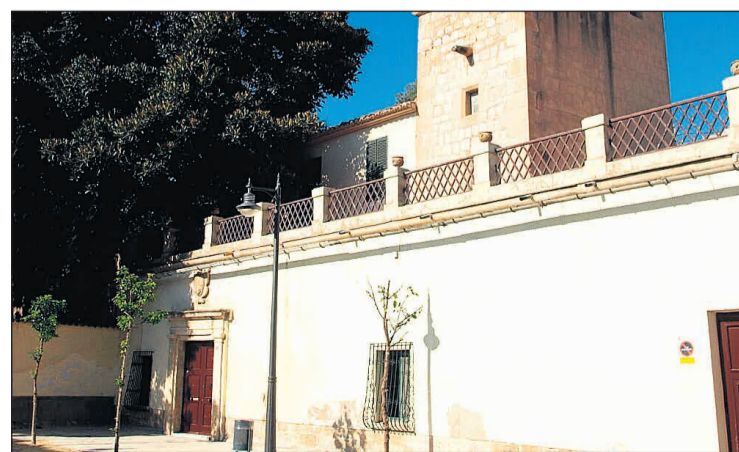
Fachada de l'Hort de Ferraz