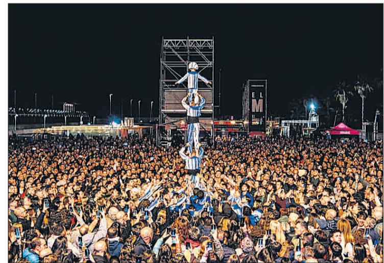
La Muixeranga en uns dels molt actes que tenen

Però si hi ha alguna cosa que defineix la Muixeranga d'Alacant és la seua capacitat per unir persones. En un temps marcat per la rapidesa i l'individualisme, la muixeranga continua demostrant que les grans construccions només són possibles quan cadascú aporta el seu esforç al conjunt. Una lliçó que va molt més enllà de les places i les actuacions i que, a Mutxamel, ha trobat un lloc privilegiat per continuar creixent.