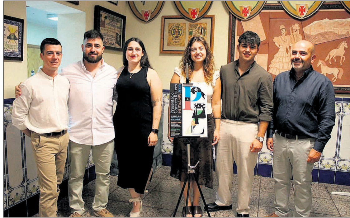
Los cargos festeros de la Comparsa Zegries y Pirates junto al cartel de la presentación de cargos