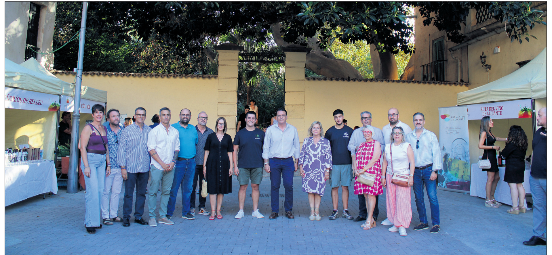
La corporación municipal junto al presidente de la Asociación de Productores del Tomate Muchamiel en la inauguración de la Feria