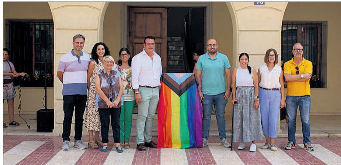
Integrantes del PP, PSOE, Compromís y EU-Podem en la foto de familia del día del Orgullo